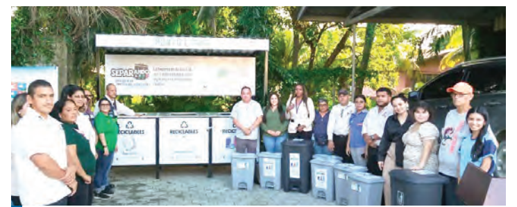
El proyecto fue echado andar en el principal puerto del país.

sede oficial de la graduación de capellanes Internacionales 2025, un evento de gran relevancia espiritual consolidando al municipio como un punto clave para actividades de formación y proyección social.