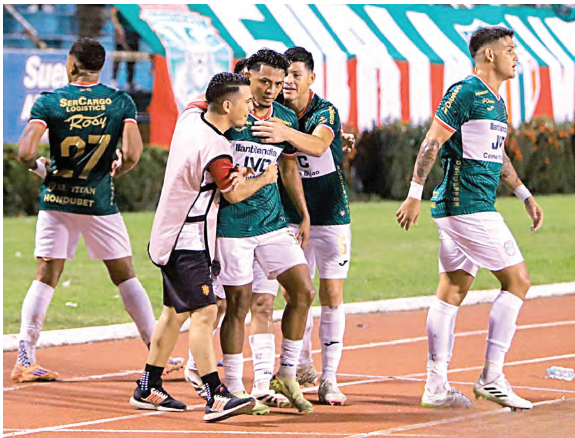
El "Monstruo" llega en uno de sus mejores momentos a la final que comienza este domingo en el Olímpico.