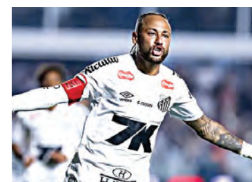
Neymar seguirá en Santos durante 2026: solo falta el anuncio oficial.