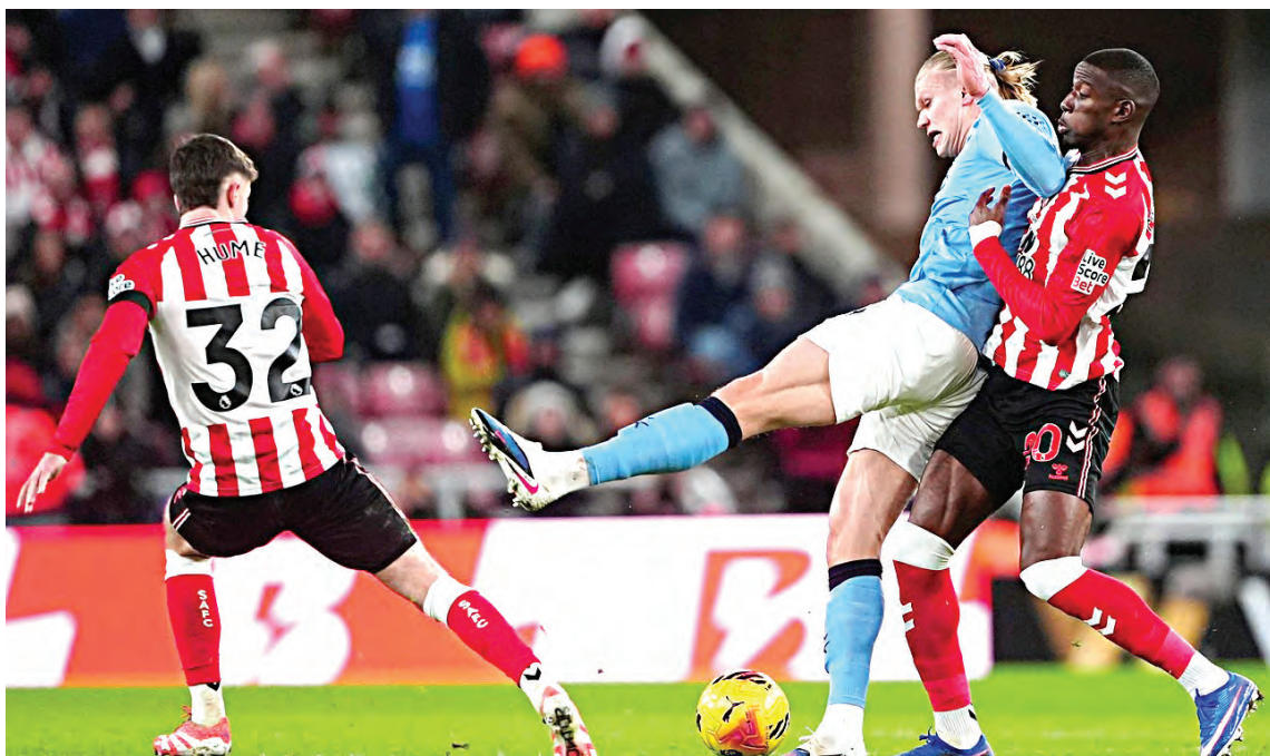
El Manchester City no empezó el año como hubieran querido y se quedan a cuatro del liderato.