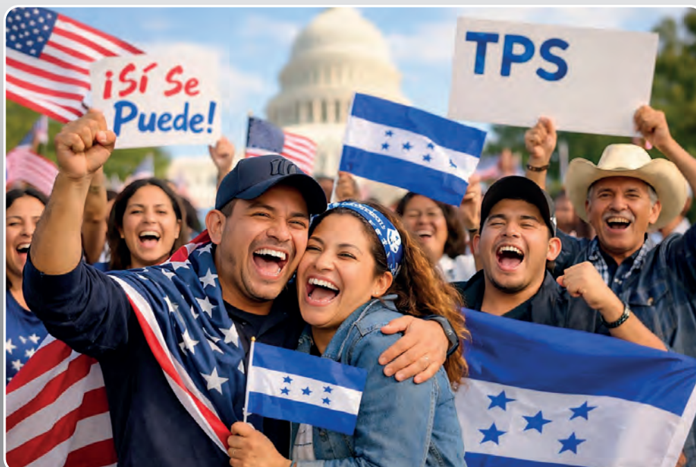
IMAGEN CREADA CON IA

- Decisión judicial se basa en que Seguridad Nacional no cumplió el procedimiento de ley.