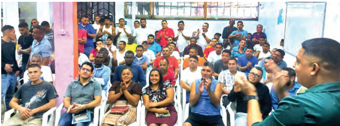
Los reos del centro penal de Tela durante la celebración de fin de año