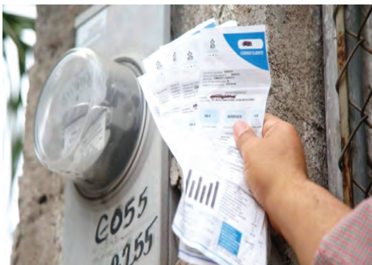
La tarifa eléctrica se reflejará en las facturas del primer trimestre.

No obstante, el ente regulador precisó que el ajuste técnico que correspondía aplicar