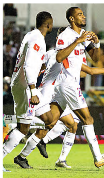
Olimpia es el "Rey de Copas" y tiene medido a los verdes en las finales.