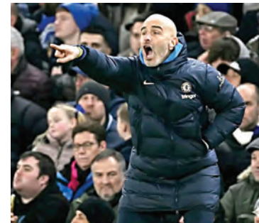
El italiano se fue, pero ganó el Mundial de Clubes para el conjunto inglés.

La dirigencia de BlueCo deberá nombrar reemplazo inme-