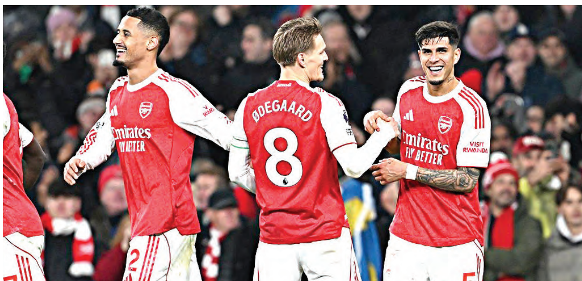
Dos días antes, el Arsenal había masacrado 4-1 al Aston Villa.

La jornada 19 también dejó igualadas entre Fulham y Crystal Palace. Mientras tanto, Brentford y Tottenham no pasaron del 0-0, en una fecha donde los favoritos fallaron y permitieron que el Arsenal respirara tranquilo.