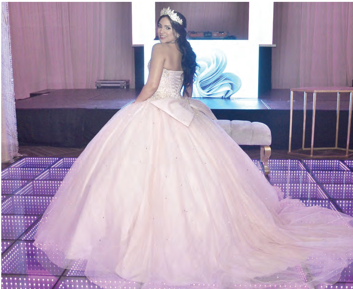
La linda quinceañera durante su gran noche.