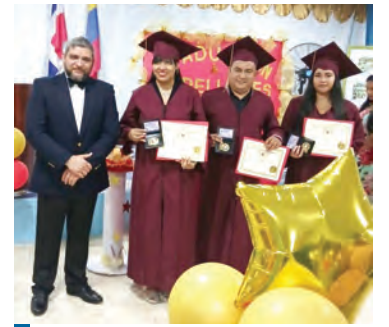
La ceremonia tuvo lugar en el sector ecoturístico porteño.

En este sentido Puerto Cortés se convirtió por primera vez en la