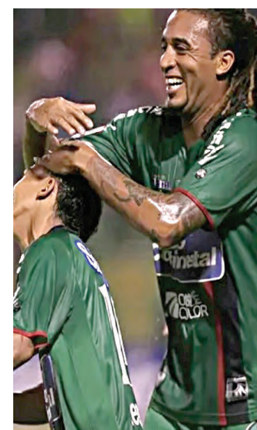
La última final que los verdes le ganaron al conjunto capitalino fue en noviembre de 2009.