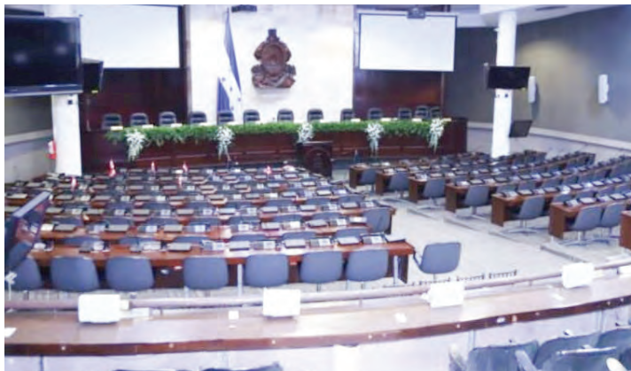
El Congreso Nacional se renueva con la llegada de nuevos diputados.