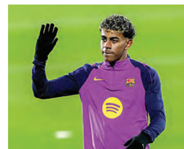
A pocas horas del derbi de Barcelona, Lamine Yamal es duda por molestias.

La plantilla completó su primera sesión del 2026 enfocada