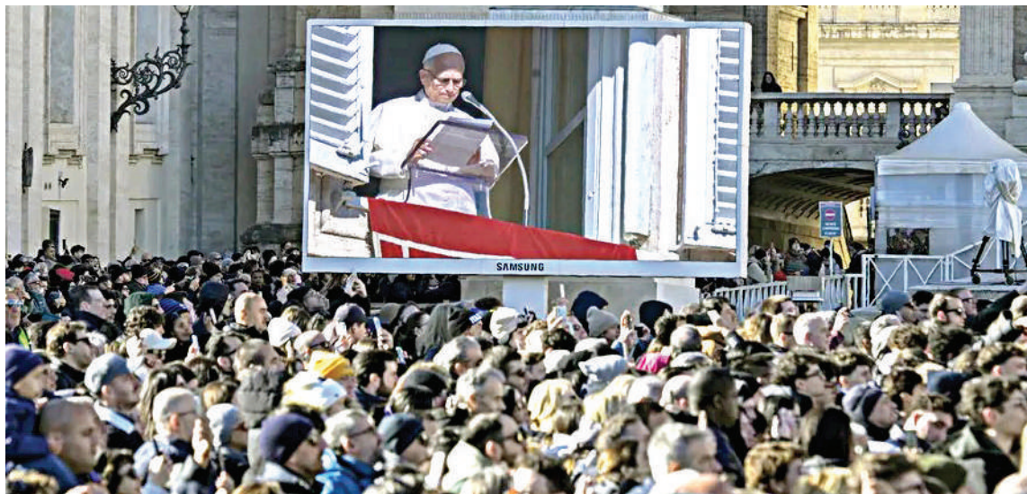
El papa León XIV dio el mensaje ante miles de personas congregadas en la plaza de San Pedro.