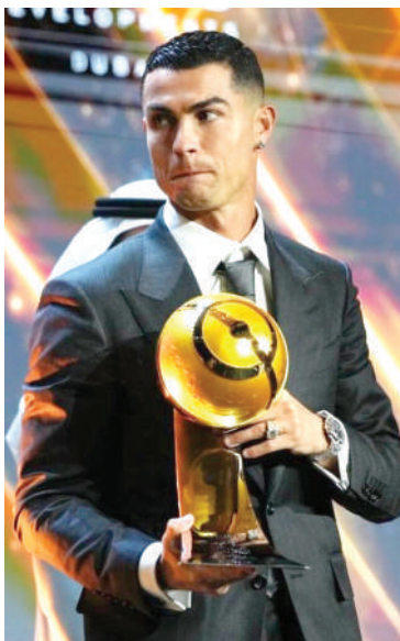
Cristiano Ronaldo volvió a subir a los estrados, ahora como mejor jugador del oriente medio.

En contraste, Real Madrid se marchó sin premios, pese a múltiples nominaciones, mientras Cristiano Ronaldo fue distinguido en