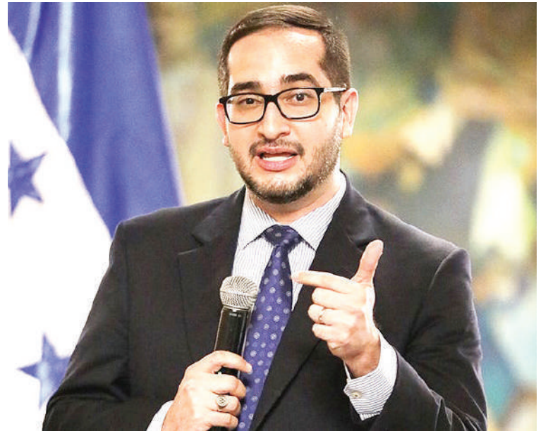
Diputado y exministro de Finanzas, Marco Midence.

El decreto PCM 38-2025 establece que la Secretaría de Finanzas reintegre la Cuenta Única de la Tesorería (CUT), todos los saldos no utilizados que mantienen instituciones públicas, con el fin de cubrir obligaciones urgentes del Estado.