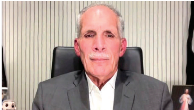
Nasry Asfura, presidente electo de Honduras para el periodo 2026-2030.

Asfura descarta estados de excepción permanentes y promete acción inmediata en seguridad