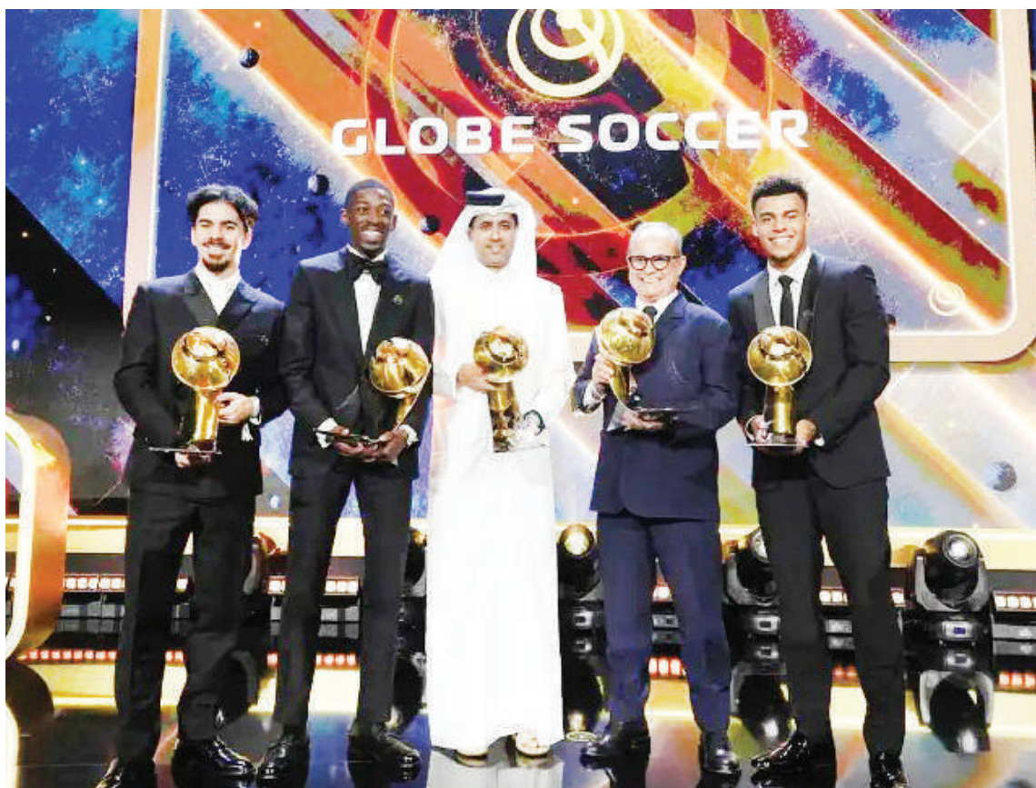
El cuadro parisino arrasa con siete premios en la Gala Globe Soccer, con Dembélé como mejor jugador.