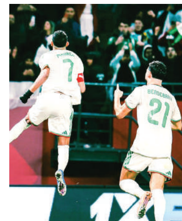
La selección argelina ya está entre las mejores del continente africano.

Con el primer puesto asegurado, Argelia enfrentará a Guinea Ecuatorial, ya eliminada, mientras Sudán y Burkina Faso pelearán el segundo boleto, donde a los bur-