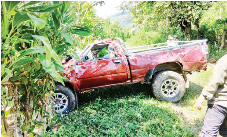
El vehículo tipo pick-up, color rojo llevaba a 12 personas cuando ocurrió el accidente.

Entre los heridos se encuentran varios menores de edad y adultos, quienes permanecen bajo observación médica.