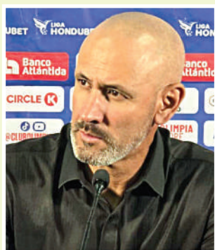
El técnico del Olimpia aun no tiene fechas para preparar la final ante Marathón.