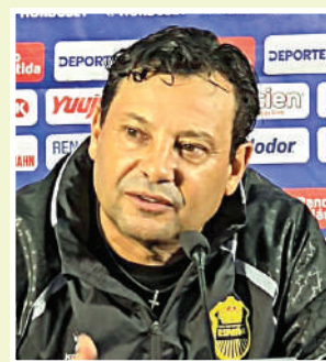
En el segundo torneo al mando del Real España, Campos solo logró clasificarlos a la Liga de Campeones.

El entrenador insistió en que las estadísticas avalan su trabajo, con superioridad en posesión y ocasio-