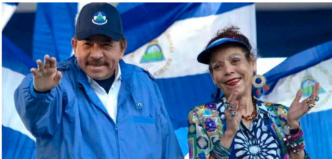
La pareja presidencial, Daniel Ortega y Rosario Murillo, durante un acto oficial del gobierno nicaragüense.

En ese contexto, recordaron la figura del héroe centroamericano