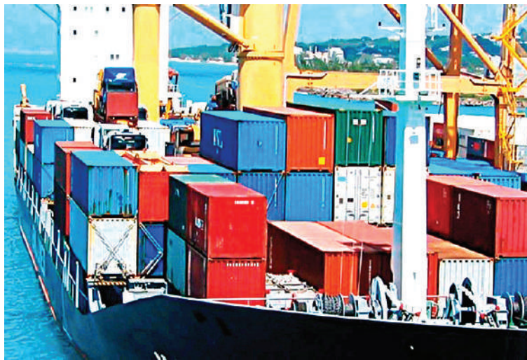
La economía del país se ha mantenido estable según el BCH.

sumo privado de los hogares, sostenido por los ingresos extraordinarios de remesas y precios históricos de café, aunado a la mayor inversión y consumo público, que también han contribuido a mantener la senda de crecimiento.