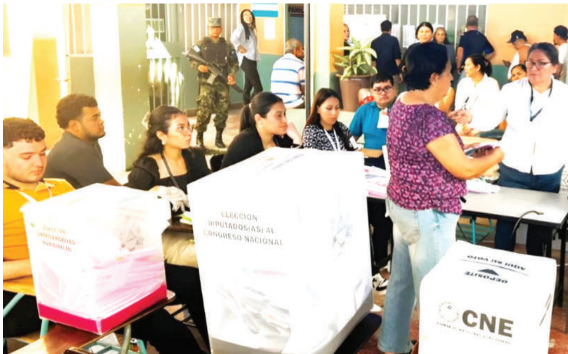
En las elecciones generales, los hondureños eligieron presidente, tres designados presidenciales, 298 alcaldías, 128 diputados al Congreso Nacional.