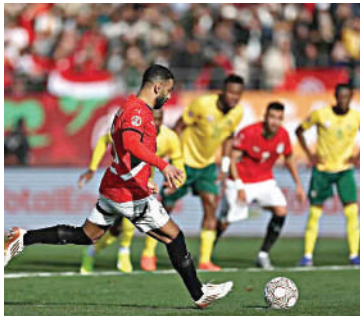
Mohamed Salah también marcó por la vía del lanzamiento de penal.