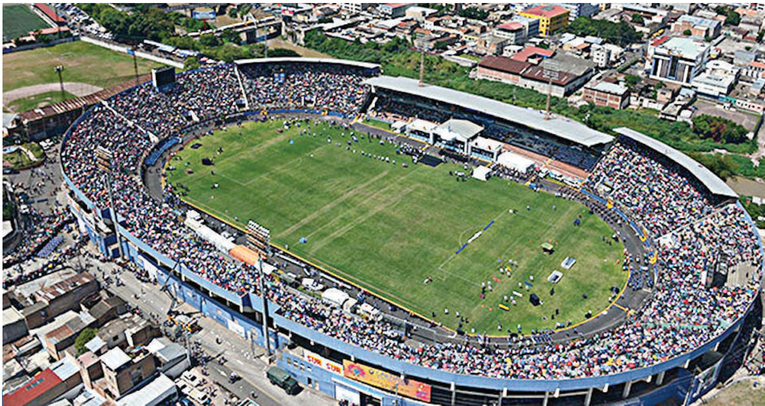
Traspaso de mando presidencial queda descartado del Estadio Nacional.