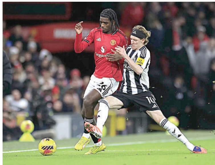
Los 'red devils' son el equipo que más gana en el 'Boxing Day' y las "urracas" siguen siendo el que más pierden.

Caseiro regresó a la titularidad en un mediocampo que sufrió durante la segunda mitad ante el empuje visitante. Sin embargo, el protagonismo absoluto recayó en el joven danés, quien estrenó su