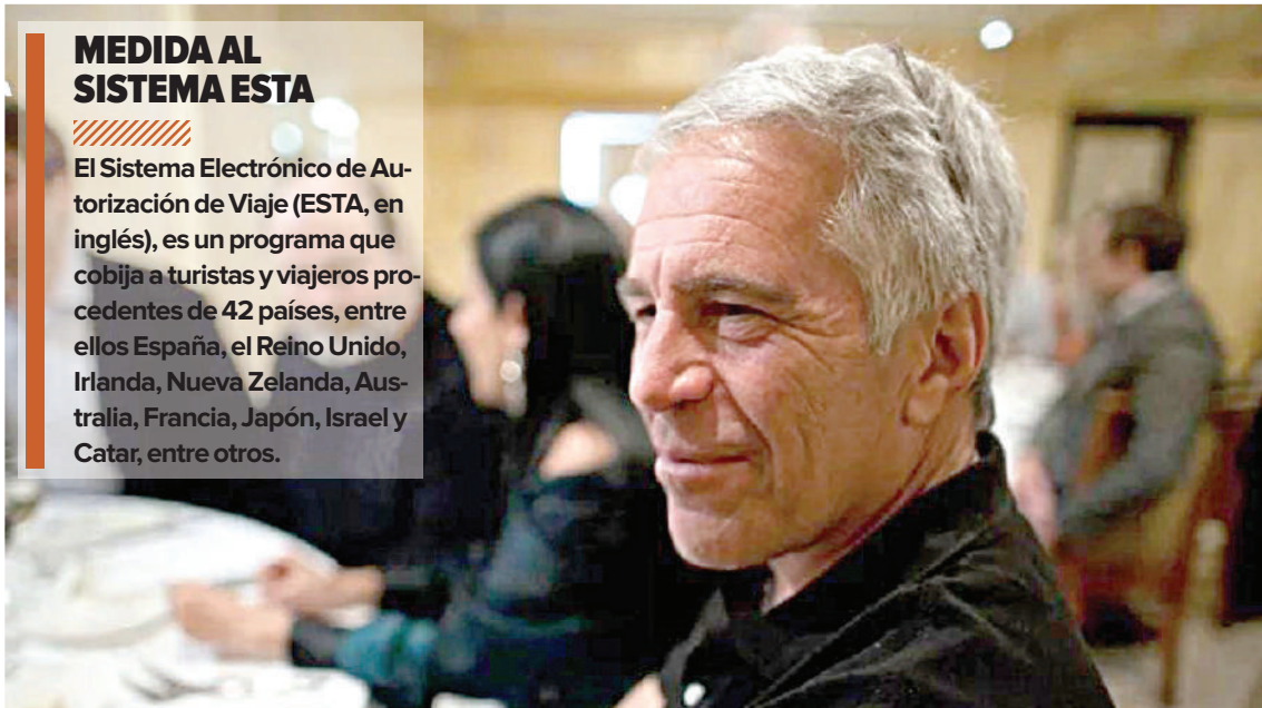
Desde ayer comenzaron con la nueva medida para los viajeros hacia estados Unidos.

El Sistema Electrónico de Autorización de Viaje (ESTA, en inglés), es un programa que cobija a turistas y viajeros procedentes de 42 países, entre ellos España, el Reino Unido, Irlanda, Nueva Zelanda, Australia, Francia, Japón, Israel y Catar, entre otros.