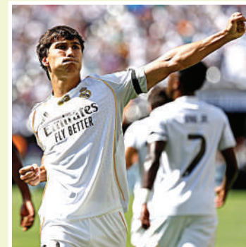
El joven delantero de los blancos se dio a conocer en el Mundial de Clubes de Estados Unidos.

A pesar del ostracismo reciente, su gran actuación en el Mundial de Clubes respalda la