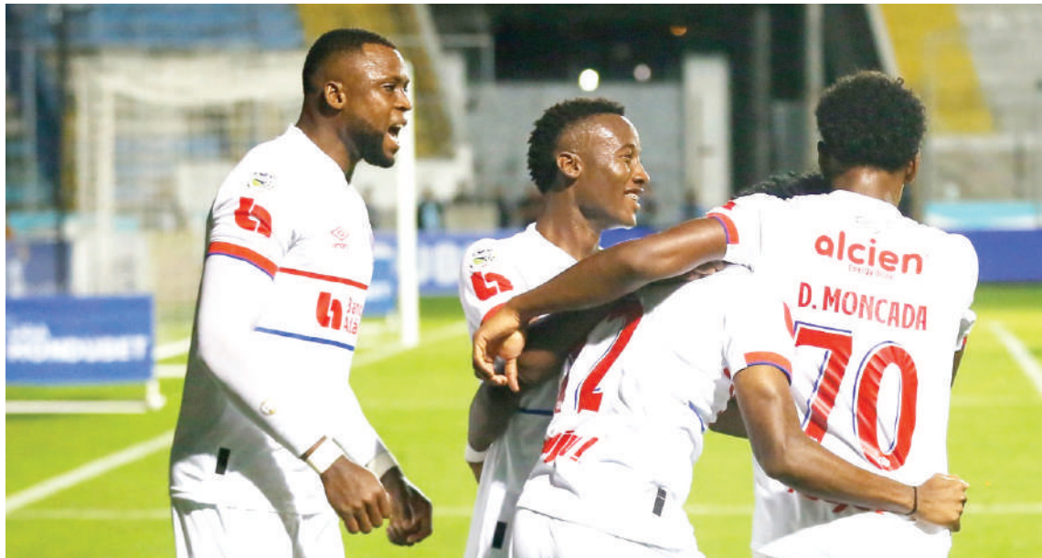
El Olimpia tendrá un "fuego de lujo" esta noche ante Real España de cara a la final del Apertura.