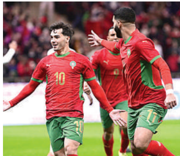
El delantero del Real Madrid, Brahim Díaz hizo el tanto de Marruecos por la vía de los doce pasos.