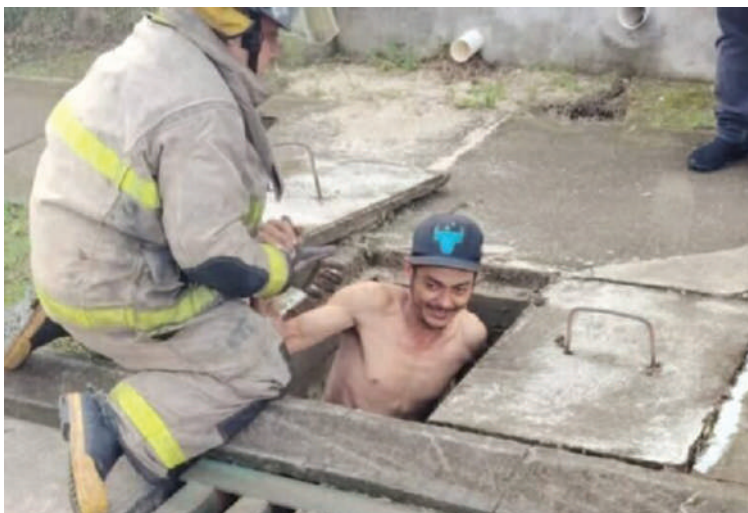
Miembros del Cuerpo de Bomberos ayudaron al hombre a salir de la alcantarilla.

só a la alcantarilla alrededor de las 11:00 p.m. y permaneció allí por ca-