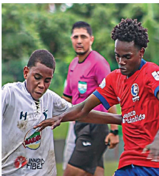
Los blancos se acercan a otra final en el torneo de Reservas de la Liga Nacional.

La liguilla continúa este viernes en La Ceiba con el vibrante duelo entre Victoria y Marathón. Asimismo, Real España recibirá al Platense el sábado en San Pedro Sula buscando acercarse al liderato del grupo A.