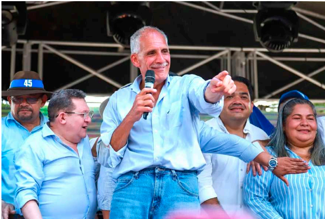
El presidente electo Nasry Asfura para el periodo constitucional 2026-2030.

El proceso de conteo avanzó lentamente en medio de señala-