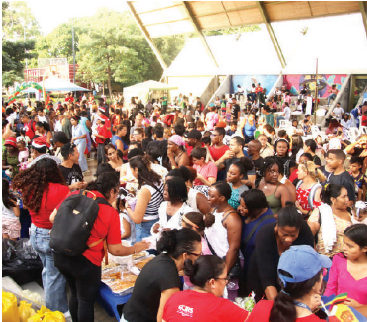
Los migrantes de diferentes nacionalidades se reunieron para celebrar la Navidad.

La reunión incluyó a personas que hace uno o dos años se encontraban en albergues y que hoy regresan tras ser deportadas desde Estados Unidos.