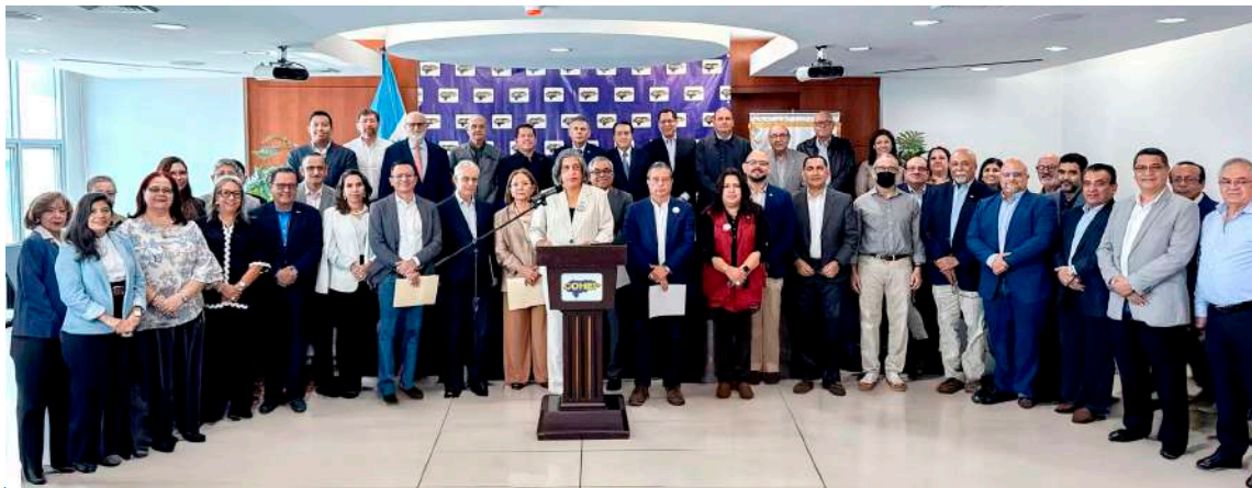
Autoridades ejecutivas del Consejo Hondureño de la Empresa Privada (Cohep), respaldan la declaratoria oficial del CNE.

El empresariado felicitó al presidente electo Nasry Asfura, respaldó al órgano electoral y expresó su disposición de colaborar para reactivar la economía y generar empleo