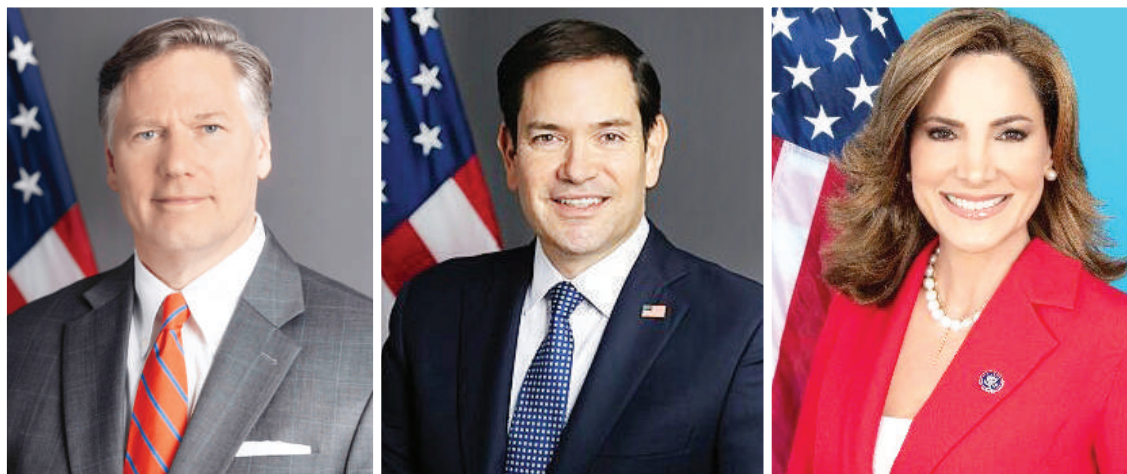
Christopher Landau, Marco Rubio y María Elvira Salazar se pronunciaron tras la declaratoria oficial del CNE.

A través de la Oficina de Asuntos del Hemisferio Occidental del Departamento de Estado de Estados Unidos, el gobierno estadounidense felicitó oficialmente a Asfura por su elección como próximo presidente del país. En el pronunciamiento, Estados Unidos reconoció el liderazgo de la presiden-