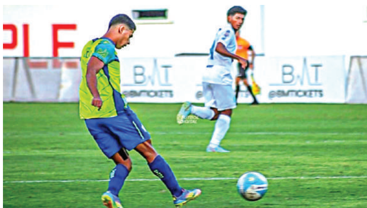
En plena Navidad, Platense cayó en Juticalpa y con eso despidió su torneo de retorno a Primera División.