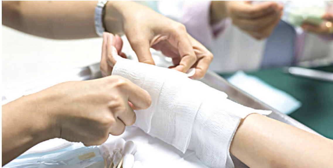
Algunos menores perdieron dedos en la manipulación de la pólvora y que esta les explotara.