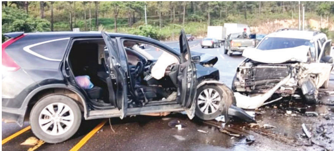
Los accidentes de tránsito se han convertido en la segunda causa de muerte en honduras.

Según la DNVT, los departamentos de Francisco Morazán y Cortés encabezan la lista de las zonas con mayor incidencia de accidentes viales.