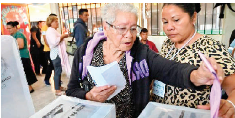
Los dirigentes políticos se suman al llamado de organismos internacionales que instan a respetar la voluntad popular.

Coinciden en la necesidad de cerrar el proceso electoral sin dilaciones que profundicen la polarización política.