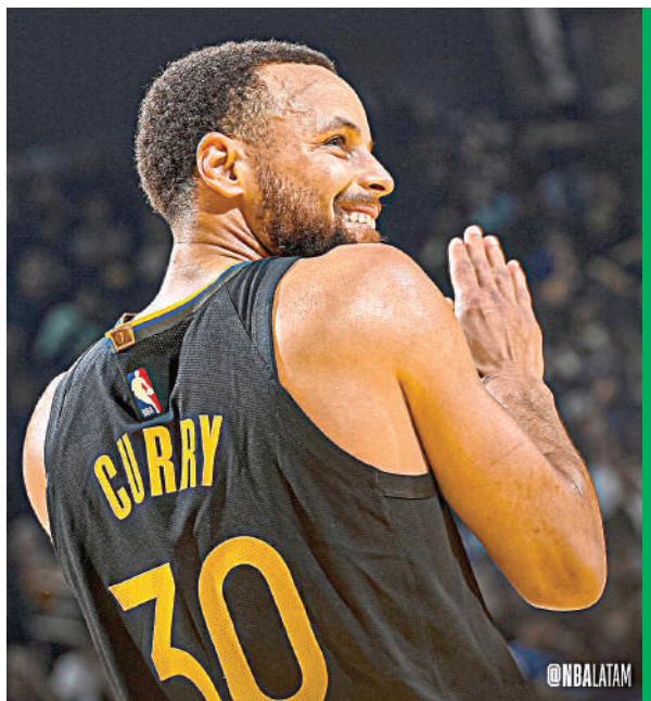
Los europeos tendrán la oportunidad de ver jugar a las grandes estrellas de la NBA como Stephen Curry.

El comisionado Adam Silver destacó la enorme oportunidad