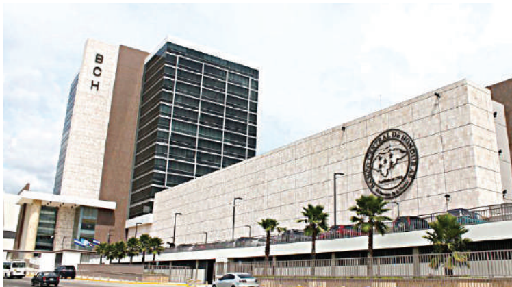
La Comisión de Operaciones de Mercado Abierto del BCH, evaluó la situación económica a nivel nacional.

2025, los indicadores de actividad económica apuntan a un crecimiento favorable, al registrar el Índice Mensual de Actividad Económica (IMAE), un crecimiento de 3.6% a octubre del presente año, impulsado por el consumo privado de los hogares, sostenido por los ingresos de remesas, por exportaciones de café, mayor inversión y consumo público.