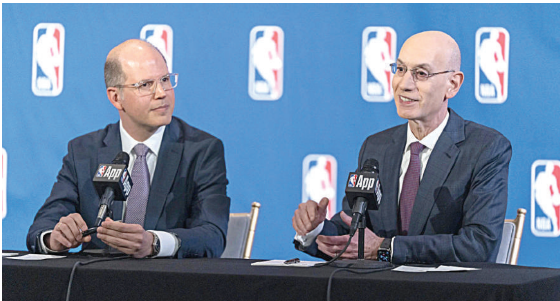
Adam Silver y Andreas Zagklis lanzaron ayer la iniciativa de que ambos continentes jueguen una liga profesional.