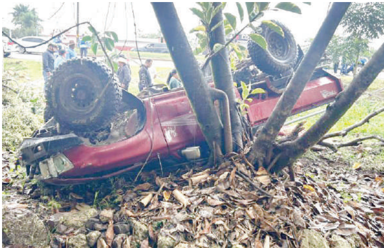
El vehículo quedó volcado en unos árboles.

to despiste habría provocado que el conductor perdiera el control, ocasionando el volcamiento del automotor.