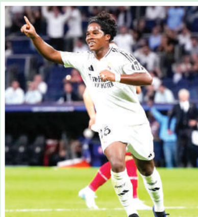
El brasileño quiere jugar el Mundial, y siendo banquero en el Real Madrid no lo llamará Ancelotti.

Bajo las órdenes de Paulo Fonseca, el joven delantero portará el emblemático dorsal nueve con el firme objetivo de sumar minutos. Su meta primordial es asegurar un lugar en la convocatoria brasileña para la cita mundialista.