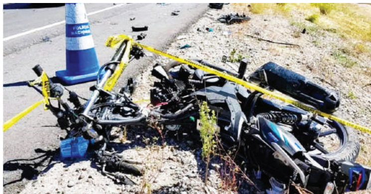
Los accidentes en motocicletas forman parte de las estadísticas elevadas en el país.

Las autoridades reiteraron que los accidentes viales representan actualmente la segunda causa de muerte violenta en Honduras, solo por debajo de los homicidios. Entre las principales causas identificadas se encuentran la imprudencia del conductor, el irrespeto a las señales de tránsito y, en casos de atropellos, la imprudencia peatonal.