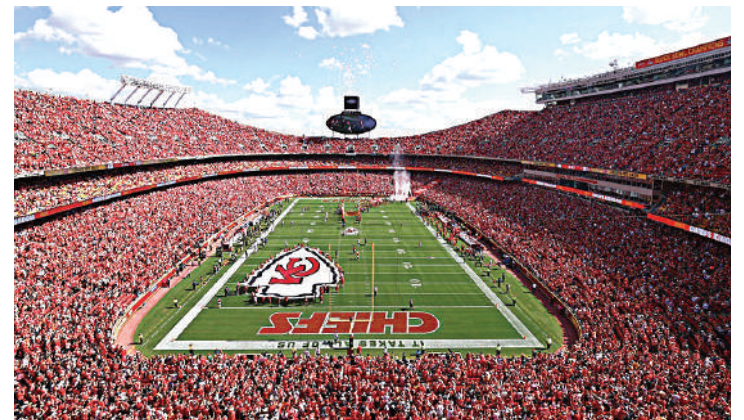
Los Kansas City Chiefs han jugado en el Arrowhead Stadium desde 1972.

Cualquier club ambicioso de Europa tendrá un camino justo para llegar a la cima mediante resultados en sus ligas nacionales.