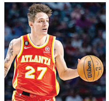
El checo Vit Krejci es uno de los jugadores que han salido baratos en comparación a lo que le costó. Juega en el Atlanta Hawks

El análisis subraya que el camino hacia el éxito no ha sido lineal, pues muchos fueron cortados anteriormente por otros equipos. Ahora, estos jugadores buscan convertir su gran presente en contratos millonarios durante la próxima agencia libre.