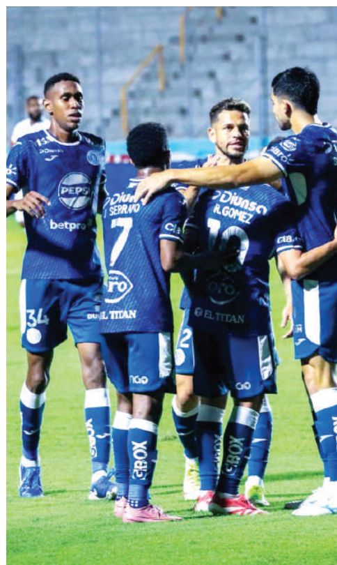
¿Motagua le hará el favor a Olimpia de clasificarlo directo a la final?