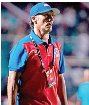
El de Luján cree que si el Olimpia lo llama es porque no le está yendo bien.

El torneo fue parejo según la visión del mediocampista, quien lamentó que los detalles no favorecieran a su club. Ahora, tras el pitazo final, tocará meditar profundamente sobre el futuro deportivo de cara al Clausura.