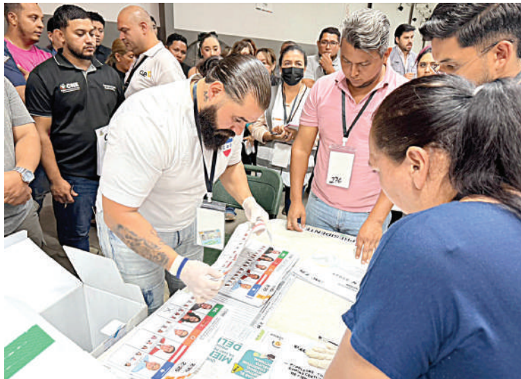
El conteo especial debe culminar antes del 30 de diciembre, fecha límite en la que se debe declarar al nuevo presidente de Honduras.

En la misma publicación el organismo advirtió “cualquiera que obstruya o intente retrasar el trabajo del CNE enfrentará consecuencias. El pueblo hondureño ha esperado lo suficiente. Merece un proceso oportuno, transparente y creíble.