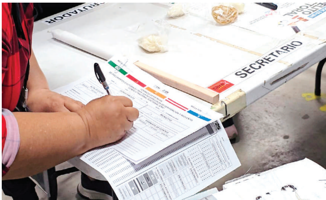
Representantes de partidos políticos realizan el escrutinio especial de actas detectadas con inconsistencias.

Hall explicó que, aunque inicialmente se había planteado que estas autorizaciones fueran unánimes, la complejidad del proceso obligó a ajustar el mecanismo de decisión. Subrayó que el objetivo es estrictamente técnico y electoral: