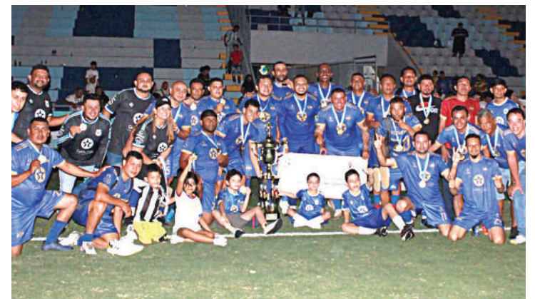
Ceiba eliminó a los tres primeros de la tabla general para colgarse la medalla de campeón.

En la otra llave, Independiente tuvo que llegar hasta los penales para deshacerse del Atlántida tras empatar a dos goles en el tiempo reglamentario. Este equipo mantiene un invicto de 37 partidos.