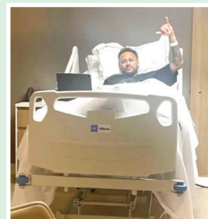
Neymar Jr. fue operado con éxito del menisco y ya inicia su recuperación.

Pese a sus constantes lesiones, el astro brasileño confía plenamente en convencer a