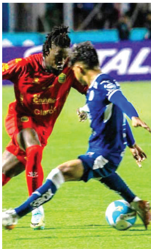
Acción del último juego de liguilla entre ambos donde Motagua cayó 0-3 en su casa.