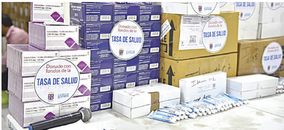
Parte de los medicamentos que fueron entregados a los centros asistenciales.