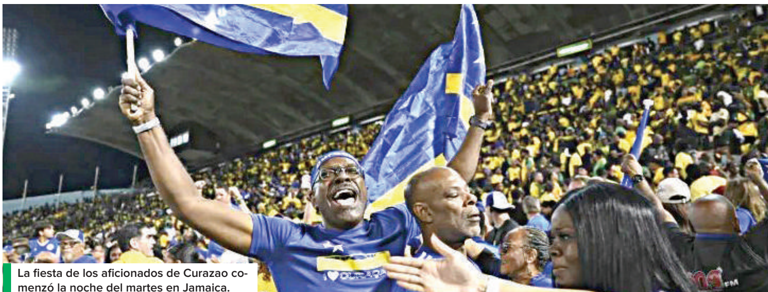
La fiesta de los aficionados de Curazao comenzó la noche del martes en Jamaica.