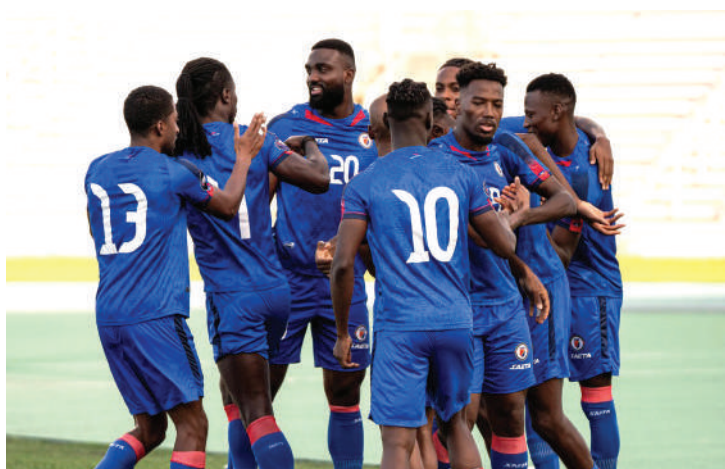
Mientras tanto, los haitianos sí se llevaron ese billete que paga la FIFA como premio.