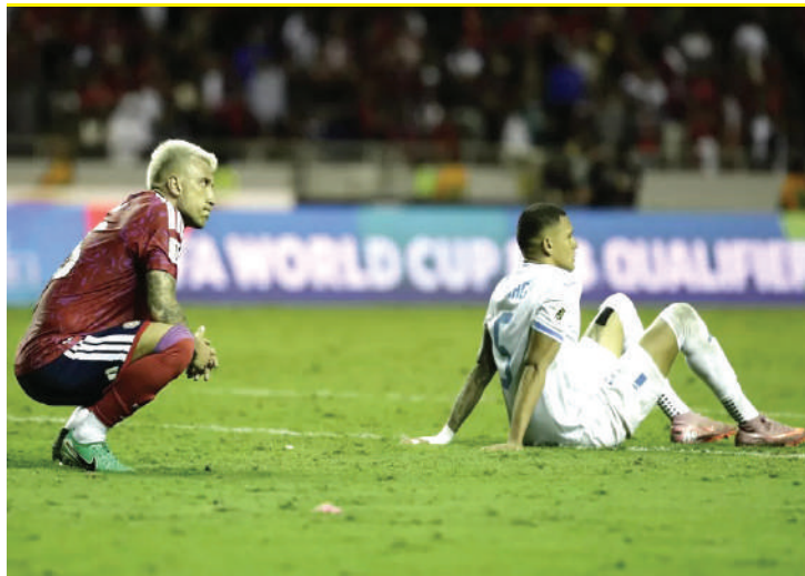
Ticos y catrachos perdieron todo la noche del pasado martes en San José, principalmente millones de dólares.

En el ciclo rumbo a Qatar 2022, Concacaf recibió un total de 49 millones de dólares en premios distribuidos entre sus representantes. Para 2026, esa cifra aumentó casi un 30% debido a la expansión del torneo a 48 selecciones.