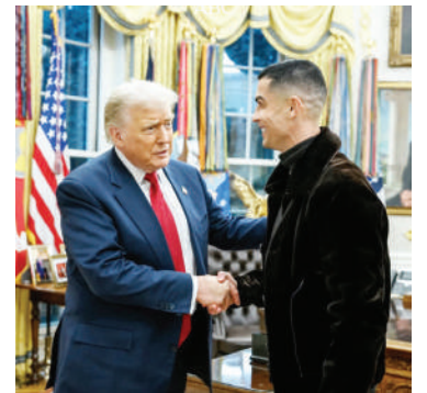
La foto entre el presidente de Estados Unidos y el mayor goleador de la historia del fútbol.