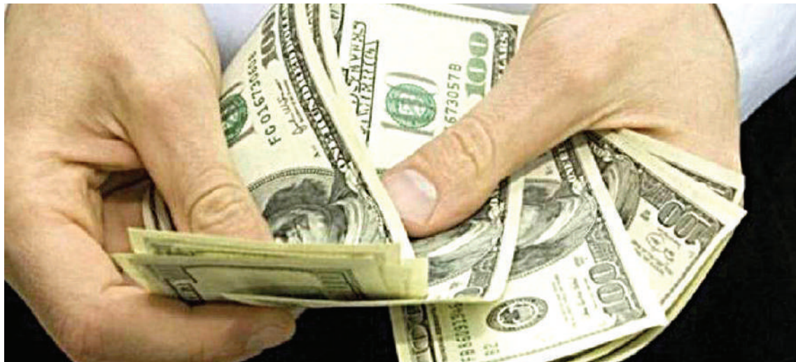
Las remesas son el principal sostén de un buen grupo de familias en la región.

Este año los países centroamericanos volvieron a acaparar los mayores crecimientos de remesas de la región, con una tasa estimada de crecimiento del 20,4 % con respecto al año anterior.