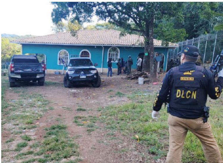
El hombre enfrenta a la justicia después de haber sido capturado mediante allanamiento de morada.

Al realizar la búsqueda de indicios por parte de detectives de la DLCN, se le encontró un fusil, una granada de fragmentación y aproximadamente tres kilos de supuesta co-