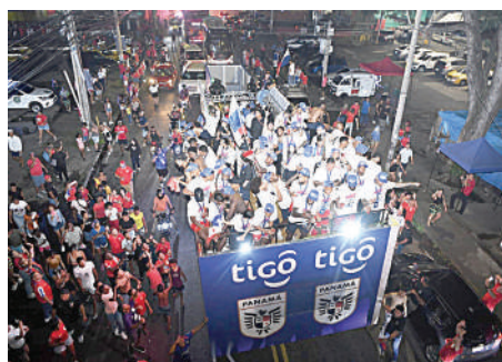
Los seleccionados panameños salieron a las calles en caravana a celebrar con su afición.

El equipo de Thomas Christiansen respondió con un partido contundente. Los goles de Blackman, Davis y Rodríguez encendieron un estadio convertido en volcán, mientras los panameños celebraban también los tantos de Guatemala que ayudaban a encaminar la clasificación mundialista.