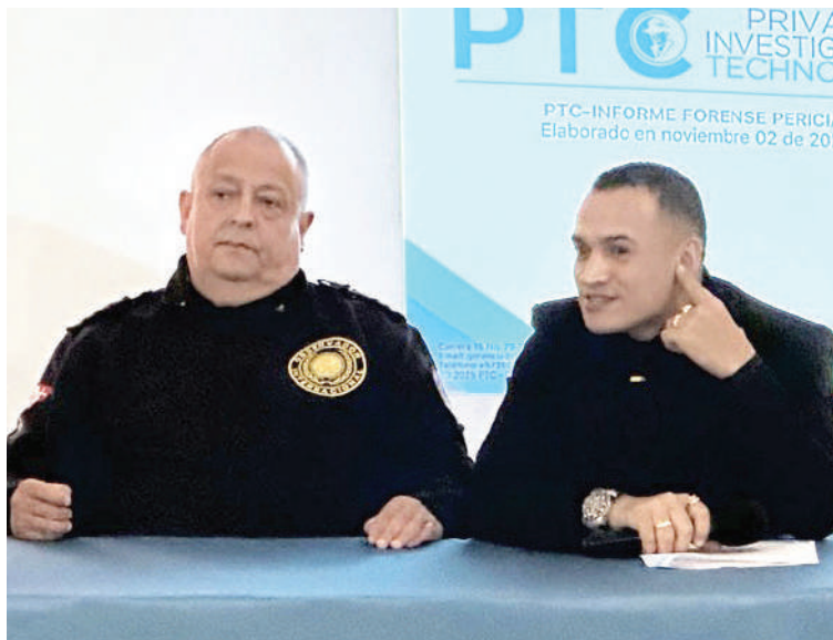
El perito colombiano en conferencia de prensa reveló que Libre financió el análisis de los audios.