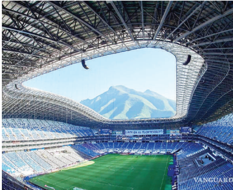
El estadio del Monterrey será una de las sedes para sacar los últimos clasificados a la Copa del Mundo.

El repechaje se disputará del 23 al 31 de marzo con seis selecciones de distintos continentes. Bolivia, Iraq, Jamaica, Nueva Ca-