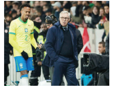
Éder Militao se retira lesionado del amistoso entre Brasil y Túnez

planes de Xabi Alonso en el Real Madrid, disputó 90 minutos en el amistoso de Brasil contra Senegal y 60 contra Túnez, en el que tuvo que retirarse del terreno de juego con una ligera cojera.