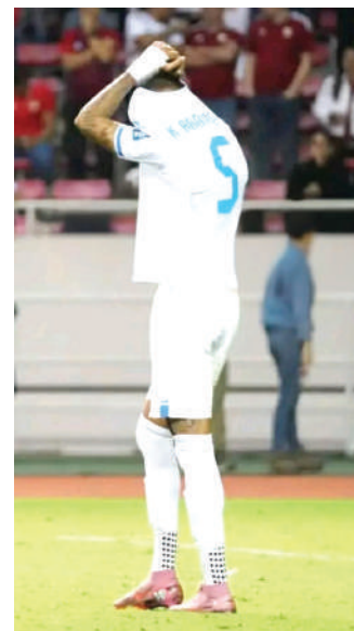
El “Misilito” no gravitó en Honduras a tal punto que terminó pidiendo perdón.

SAN JOSÉ – El mediocampista del Levante de España enfrentó el dolor de un nuevo fracaso mundialista tras el empate en San José. El mediocampista reconoció que Honduras dejó escapar una oportunidad inmejorable y pidió disculpas a la afición, dolida por otra eliminación consecutiva.