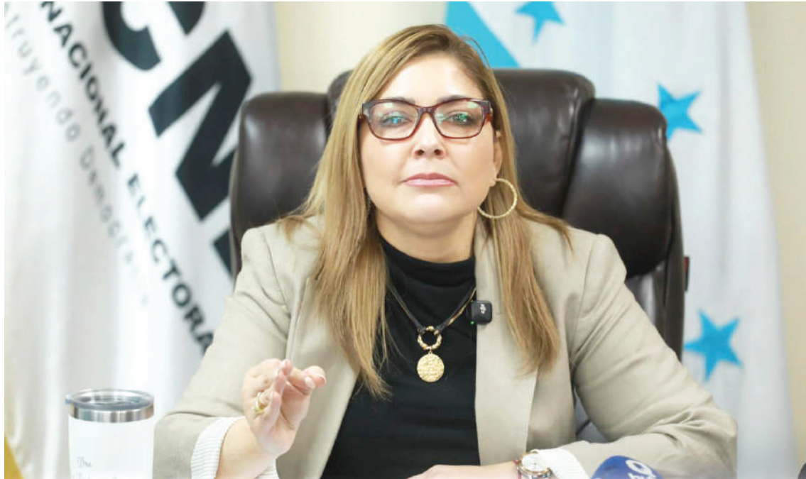
Ana Paola Hall, presidenta del CNE, asegura que las imprentas cumplen los plazos y que no existe ningún retraso en la entrega del material electoral.

chó a las Fuerzas Armadas por divulgar datos “imprecisos o incompletos”, señalando que pueden generar percepciones erróneas en un momento especialmente sensible para el país.