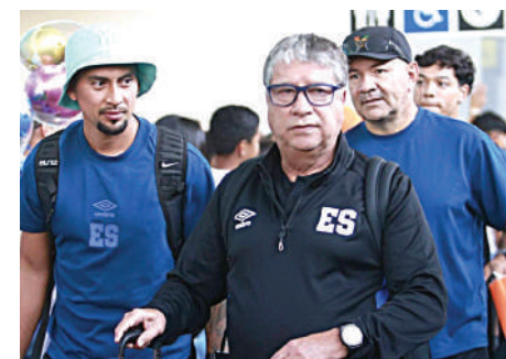
El “Bolillo” señaló que para un proyecto serio se necesita tiempo.

El entrenador explicó que nunca habló con la dirigencia sobre una posible renovación, pese a rumores públicos sobre extender el proceso. Enfatizó que un proyecto serio requiere tiempo y que siete meses de trabajo no bastan para evaluar un ciclo competitivo completo.