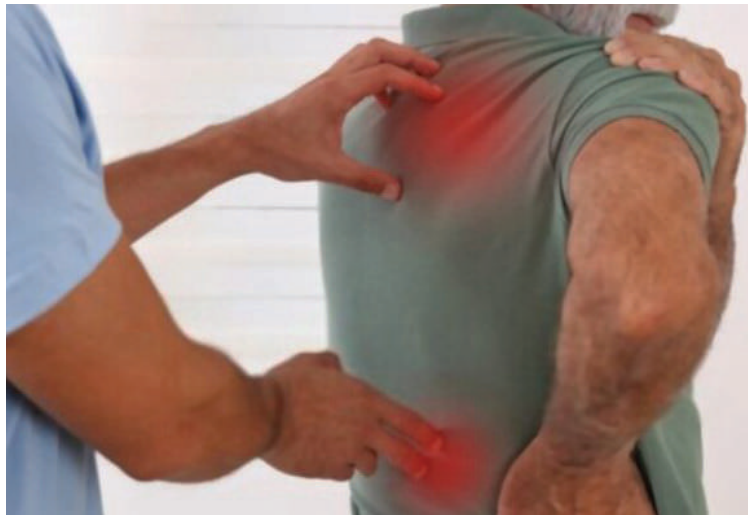
La rickettsiosis confundirse fácilmente con el dengue, lo que dificulta su detección temprana.

“Ya hay rastros de la bacteria en toda Centroamérica”, alertó el infectólogo, al destacar que la expansión silenciosa de la rickettsiosis podría estar provocando cuadros clínicos más severos de lo que las autoridades han podido identificar. El experto recordó que hasta el 48% de los casos de dengue severo en la región no cuentan con confir-