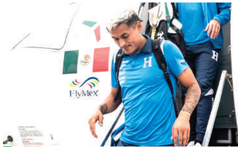
Najar agarró el vuelo sin retorno de la Bicolor. Al menos jugó un Mundial.