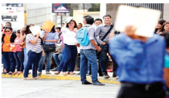
La industria maquiladora es una de las principales fuentes de exportación y circulación de divisas.

la a apenas 140,000, una caída que expertos describen como una “masacre laboral” que ha apagado la dinámica económica del norte del país. La pérdida acumulada supera los 40 mil empleos, según la Asociación Hondureña de Maquiladores, y la tendencia no muestra señales de detenerse.