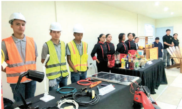
En el festival de mariscos destacan los platillos alusivos al evento.

“Estamos muy contentos de confirmar esta cuarta edición del Festival del Marisco, que es un esfuer-