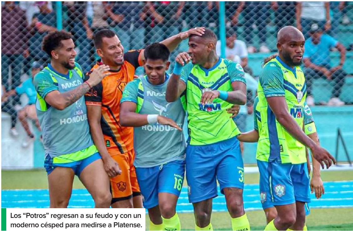
Los "Potros" regresan a su feudo y con un moderno césped para medirse a Platense.