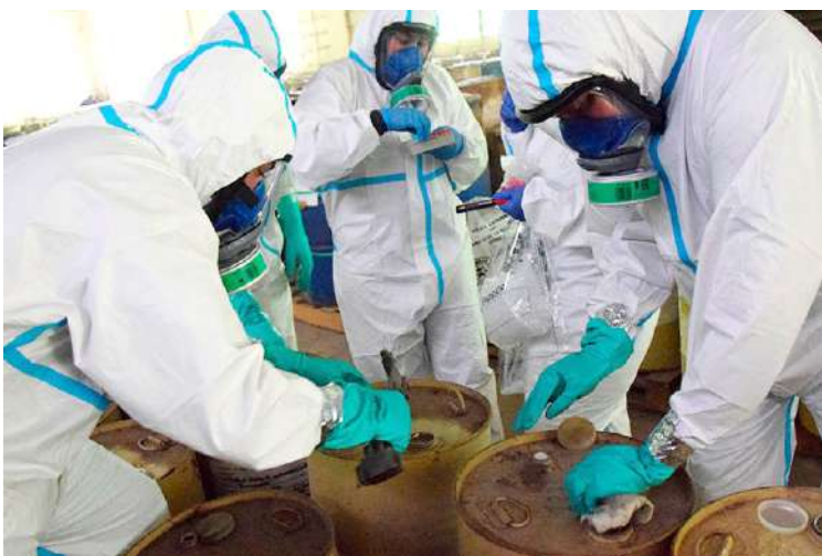
La operación demostró que Honduras es capaz de convertir la cooperación y la responsabilidad en un “fuego limpio” que quema las amenazas ocultas del crimen organizado.

Una empresa privada hondureña facilitó la infraestructura para la quema industrial, consolidando así una alianza público-privada inédita en el país. A la vez, el gobierno de Estados Unidos contribuyó con respaldo financiero y replicó buenas prácticas ya probadas en Guatemala. Esta combinación de recursos y