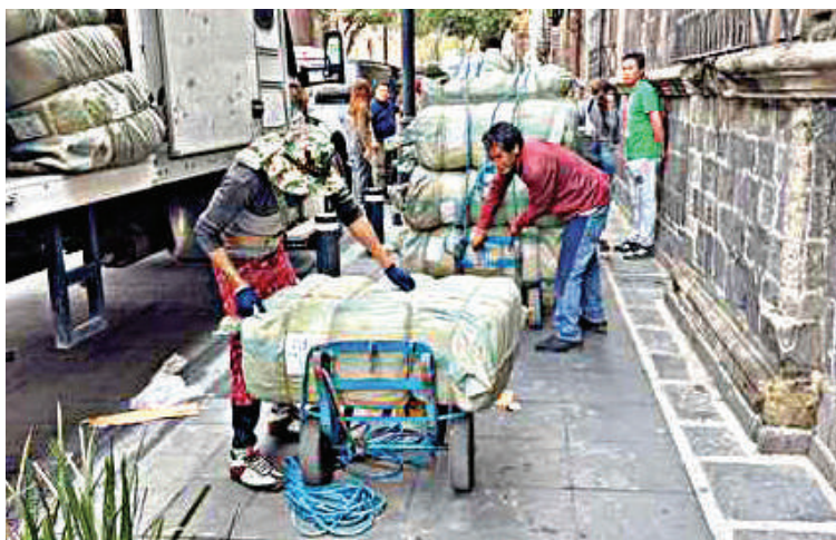
Los chinos están teniendo la oportunidad de abrir negocios en el país.

Expresidente de Fedecámara asegura que los negocios chinos están dando todo a mitad de precio y los únicos perjudicados son los micro, pequeños y medianos empresarios nacionales.