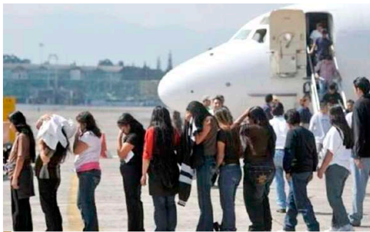
La defensora remarcó también que los migrantes en tránsito por Honduras enfrentan serias dificultades debido a la carencia de estructuras estatales

La defensora también subrayó que Honduras enfrenta