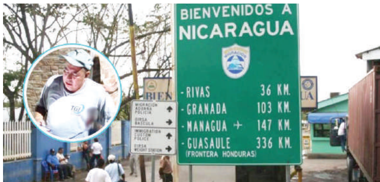
El conductor del vehículo pesado quedó herido.

El conductor fue interceptado por hombres armados que lo despojaron de sus pertenencias y, en medio del atraco, le dispararon.