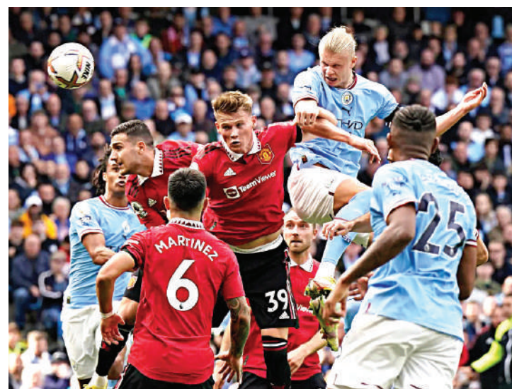
La ciudad de Manchester vive su derbi, pero los dos equipos andan en sus peores momentos.