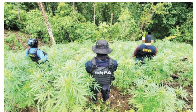
Los agentes intervinieron la zona para asegurar la plantación.

Agentes de la Dirección Nacional de Prevención y Seguridad Comunitaria (DNPSC), capturaron en las últimas horas a un taxista por suponerlo responsable del delito de violación especial, en perjuicio de una menor de 12 años.