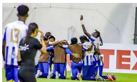
La "Jaiba Brava" quiere su segundo triunfo para salir de la última posición.

La fecha cerrará en el Juan Ramón Brevé, con estreno de césped incluido. Olancho y Platense medirán fuerzas en un choque atractivo entre equipos que muestran fútbol vistoso y competitivo.