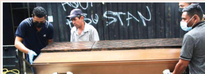
Familiares llegaron a la morgue del Ministerio Público para retirar el cuerpo.