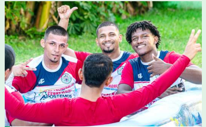
El FAS de San Lorenzo, Valle recibe esta tarde a los capitalinos del Real Tegus.

La Paz: 3:30 pm Estadio Suazo Córdoba Árbitro: Arlington Escobar