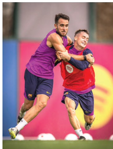
Barcelona tendrá que luchar contra Valencia para seguir cerca del liderato.