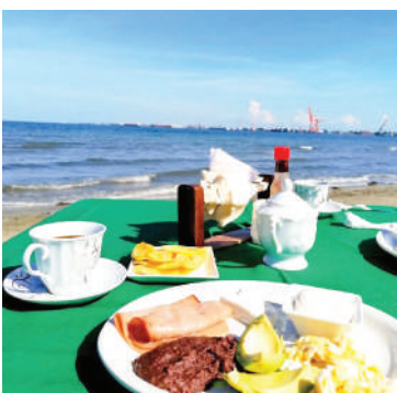
La gastronomía variada es una de las ofertas con que se puede contar.

Los departamentos de Turismo y Desarrollo Económico municipal ya fueron activados anticipadamente