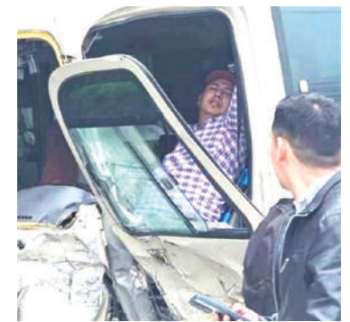
El conductor del bus quedó atrapado dentro de la unidad.

"¡Ayuda, por favor!", expresó el conductor, contrariado por los golpes que recibió en el accidente vial.