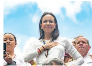
María Corina Machado.

“Te roban, te engañan, te humillan y ahora pretenden que tú salgas a defenderlos. A ellos solo les queda el miedo, pero hoy ya no es ese miedo que sembraron en el pueblo, sino el que se ha apoderado de ellos”, expresó Machado en un video publicado