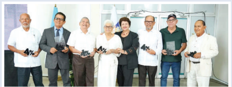
El homenaje se dio en el salón consistorial de la comuna porteña.

El movimiento socializo entre la población los alcances de la iniciativa para desarrollar la ciudad con relleno, drenaje, pavimentación y alcantarillado para lo cual de manera pacífica y cívica acudieron al Congreso Nacional que después de tantos cabildos y presiones de las fuerzas vivas de la ciudad, fue