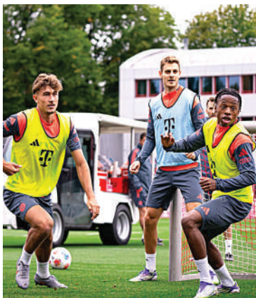
Los bávaros del Bayern Múnich se vuelven a encontrar con el Hamburgo en el Allianz Arena.

El Hamburgo, recién ascendido, afronta el reto con ilusión pese a no haber marcado aún en la temporada. Con refuerzos del Arsenal, busca sorprender al vigente campeón.