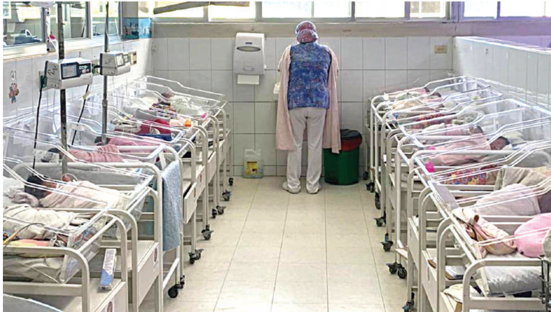
La tendencia ha consolidado al Hospital Escuela como el epicentro del “baby boom” hondureño.

Según datos del propio hospital, durante este mes la sala de Labor y Parto puede recibir hasta 600 alumbramientos, cifra que duplica o incluso triplica los promedios mensuales de 200 a 300 nacimientos del resto del año. Este repunte, conocido popularmente como “baby boom”, refleja el vínculo entre las festividades y los ciclos de maternidad en Honduras.