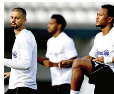
La Juventus ha comenzado la temporada de la Serie A con buen pie.

Arabia Saudita, que en cinco meses debutará ante Argentina en la ciudad catari de Lusail, no pudo revertir el marcador y probó alternativas de cara al Mundial.