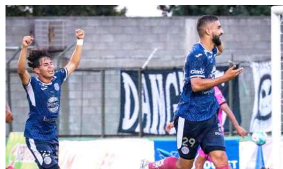
Motagua va por su cuarto triunfo en "batería". Juega en Comayagua.