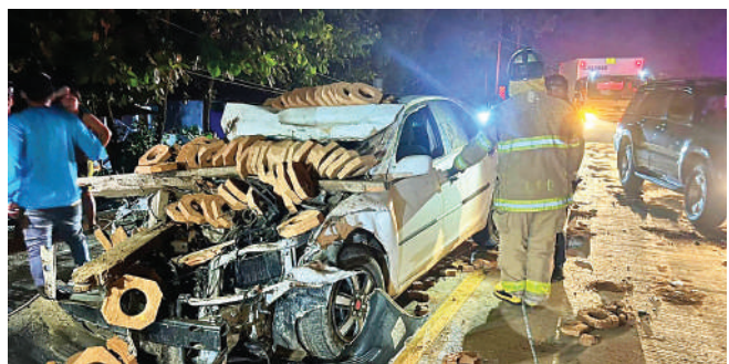
Los agentes de tránsito están listos para comenzar con los fuertes operativos en esta época navideña.

TEGUCIGALPA. Los accidentes de tránsito siguen incrementando en el país y según informó la Dirección Nacional de Vialidad y Transporte (DNVT), aproximadamente mil 600 personas han fallecido por esta causa en lo que va de este año.