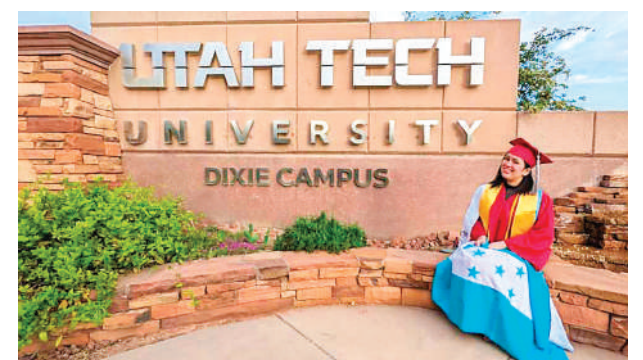
Honduras lidera con el mayor número de universitarios en el extranjero.

El informe Open Doors 2024 reportó que el número global de estudiantes internacionales inscritos en universidades de Estados Unidos alcanzó un récord histórico de más de 1.1 millones de estudiantes internacionales en 2023-2024, lo que representa un aumento del 7%.