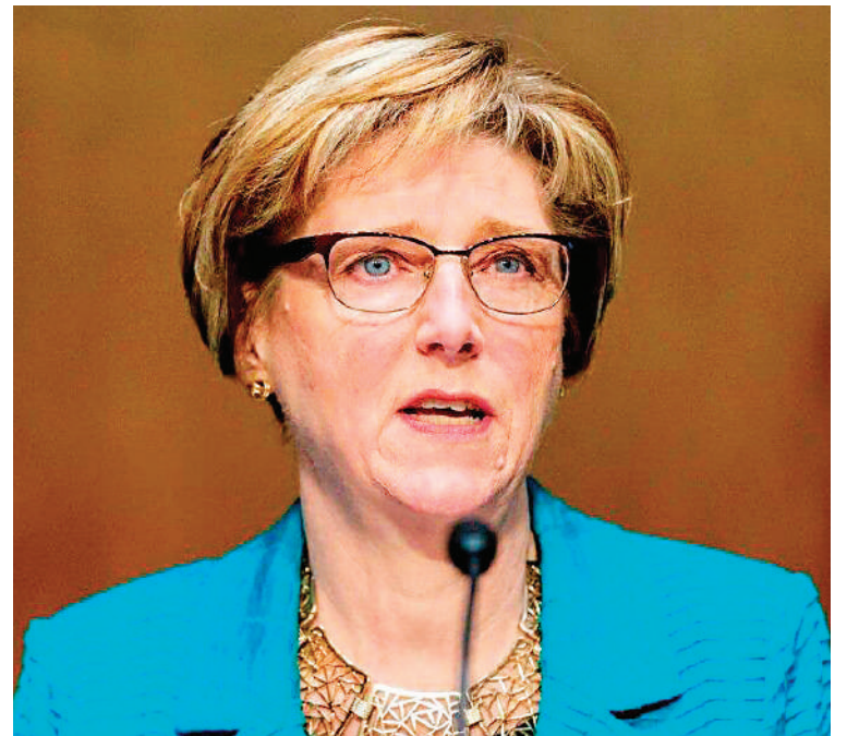
Laura Dogu, embajadora de Estados Unidos en Honduras.

Reiteró también que la extradición es muy importante tanto para Honduras como para Estados