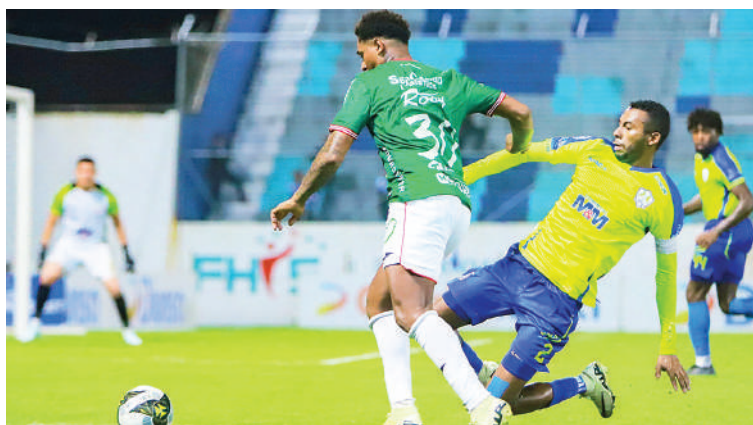
Los verdolagas quedaron eliminados en el repechaje frente a Potros.