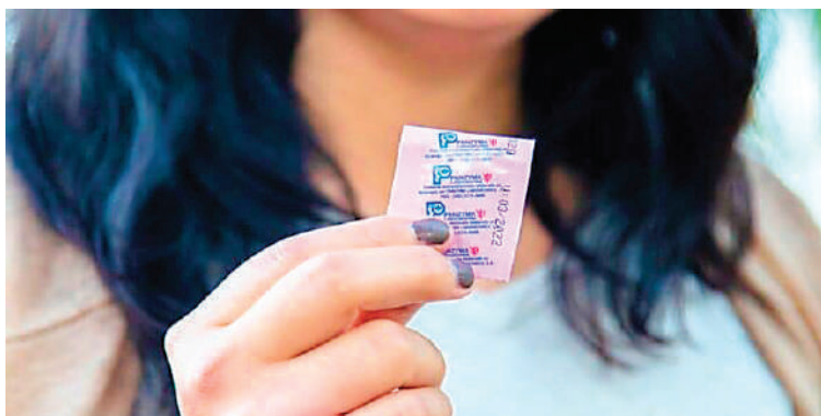
La pastilla está disponible para menores de 16 años en todos los centros de salud de Tegucigalpa.

Agregó que “el equivalente a tomar la PAE es igual a cincuenta tabletas de planificar normales, que cada una está hecha para un día en el organismo de la mujer. Le están invitando a nuestras