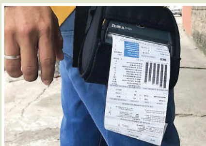
El Gobierno mantiene una política pública que absorbe los incrementos a través de subsidios.

Asimismo, destacó que el Gobierno mantiene una política pública que absorbe los incrementos a través de subsidios. “Por lo menos en lo que resta del año no se trasladará ningún aumento en la tarifa, será absorbido mediante subsidios. Sin embargo, estamos trabajando en reducir esa cuota que pone el Go-