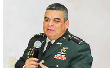
Cualquier intento de alterar el orden resultará en la suspensión inmediata de las visitas, advirtió el coronel.