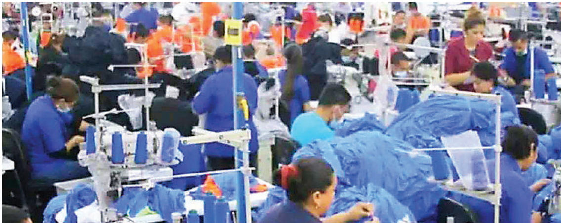
Las empresas maquiladoras siguen dejando el país por diversos factores, agudizando más la problemática del desempleo.

Dicho cierre provocará que unos 850 hondureños se sumen a las filas