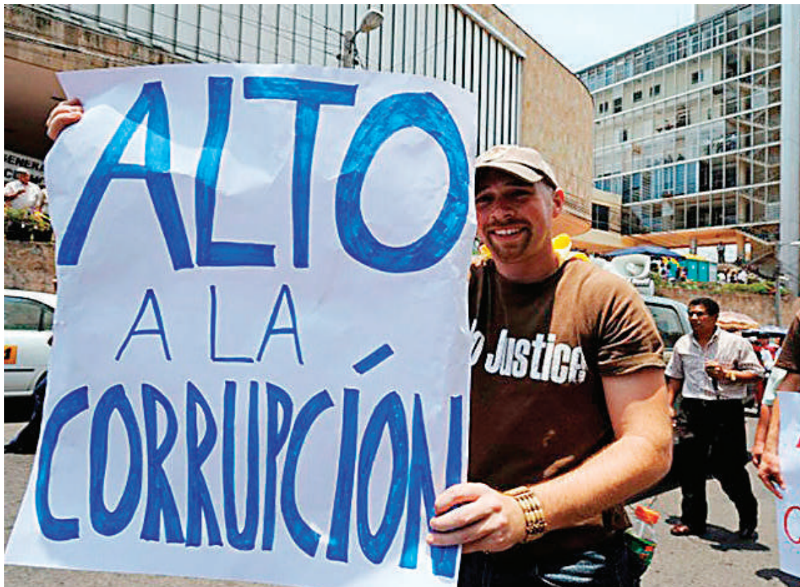
Varias organizaciones se han manifestado en contra de la corrupción en el país.

Pese a que se han creado portales de transparencia y mecanismos de control, el informe seña-