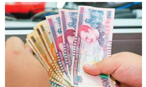
La inflación disminuyó, dice el comunicado, acercándose al objetivo del 4%.

El sector energético representa uno de los mayores retos para Honduras. La ENEE en-