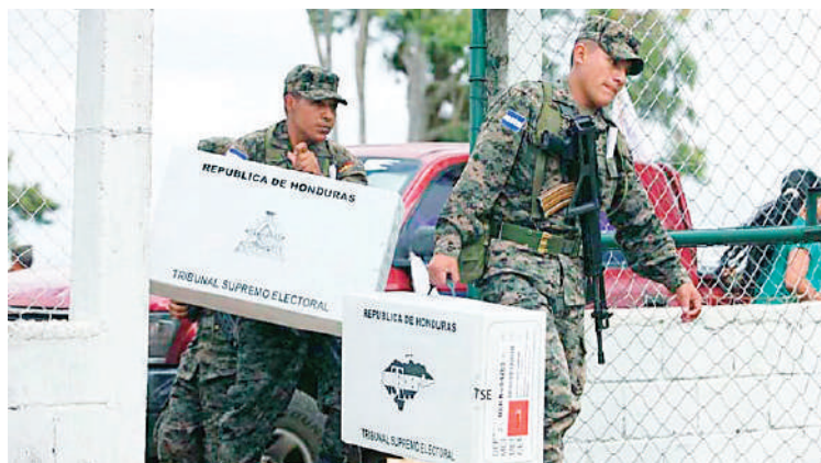
Las Fuerzas Armadas pasan a disposición del CNE un mes antes del desarrollo de procesos electorales.

Las Fuerzas Armadas pasan a disposición del CNE un mes antes del desarrollo de procesos electo-