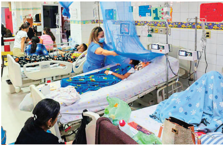
Honduras también sufrió muchas muertes y miles de casos de dengue este año.

Barbosa también alertó que el dengue, transmitido por el mosquito Aedes aegypti , «se está expandiendo en países como Argentina