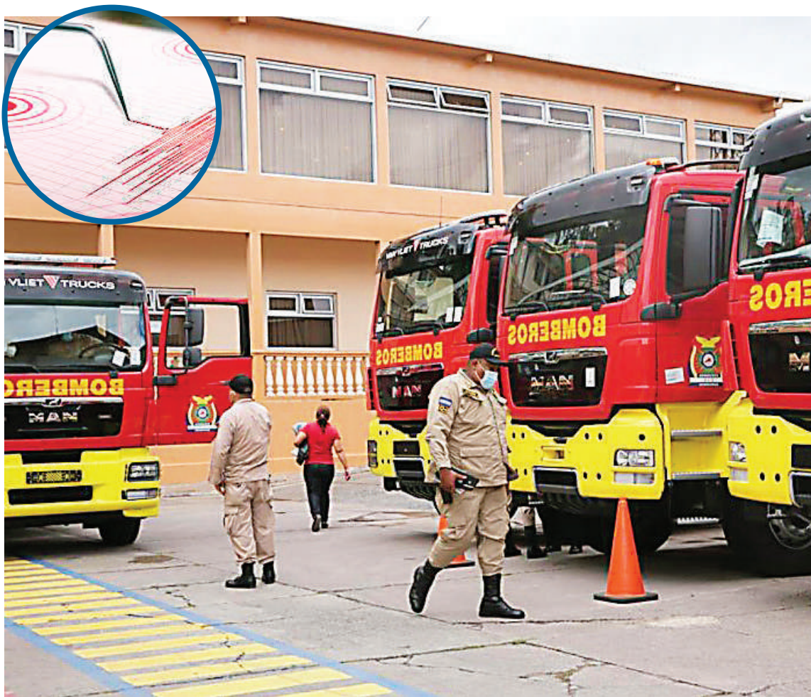
Sánchez recordó que las lluvias sobre el territorio de Honduras han mantenido los suelos saturados y puede causar deslizamientos.