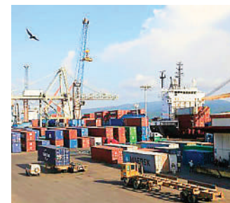
Honduras cuenta con uno de los principales puertos de Centroamérica

El OCC hizo un llamado a las autoridades y a la sociedad civil para que trabajen de manera conjunta en la implementación de recomendaciones, con el fin de fortalecer la gobernabilidad democrática y combatir la corrupción en Honduras.