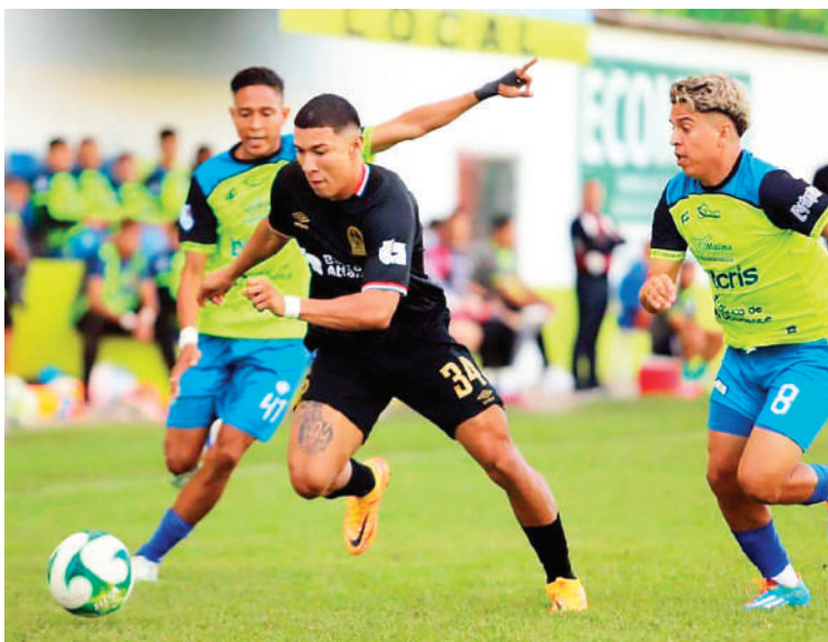
Olanchanos y capitalinos se enfrentarán por segunda vez en liguilla. Esta vez hará de locales en la casa del "León".