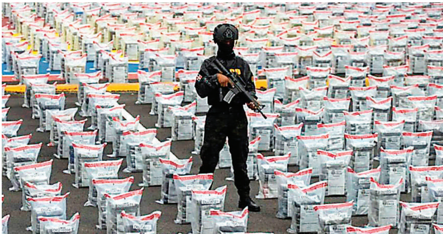
El contenedor encontrado el pasado viernes en República Dominicana transportaba 9.5 toneladas de cocaína.