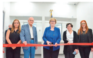
La embajadora Laura Dogu durante el corte de cinta inaugural de la Agencia Consular.

La embajadora de los Estados Unidos ante Honduras, Laura Dogu, junto a funcionarios de la Sección Consular, inauguró oficial-