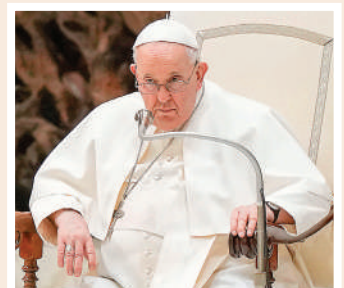
«La mujer lleva adelante una familia, lleva adelante los pueblos», expresó el papa Francisco.

«La mujer tiene esa genialidad, el genio femenino y la compasión y la tenacidad que caracterizan el ánimo femenino, añadió el pontífice argentino.