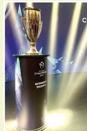
Motagua abrirá su llave en casa y cerrará en el TQL Stadium

con el equipo del estado de Ohio que se viste de azul y naranja. Si Motagua logra sortear esta llave se tendrá que medir a los Tigres de México quien, en teoría debería eliminar al Real Estelí de Nicaragua en la fase de octavos de final. Los otros centroamericanos que entraron al sorteo, Antigua de Guatemala tendrá como rival al Seattle Sounders y el Saprissa al Vancouver mientras que al Herediano le toca el Real Salt Lake.