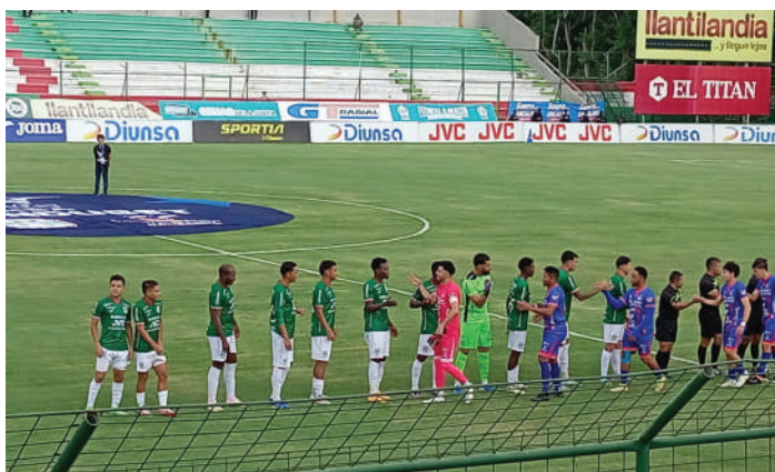
La plantilla de Marathón sufrirá varios cambios para el próximo año.