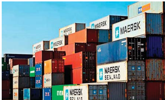
La brecha comercial que enfrenta el país es impulsada por la caída de las exportaciones y el incremento de las importaciones.

nómico que refleja el Índice Mensual de Actividad Económica