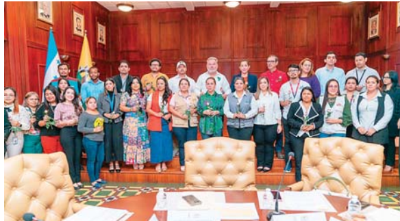
La Municipalidad de San Pedro Sula integró mesas de trabajo con representantes de las diferentes instituciones gubernamentales y oenegés.

mañana tenemos mesas de trabajo con el apoyo de la Embajada Americana, Fiscalía de la Mujer, entre otras instituciones, y estamos dando los primeros pasos para establecer el Directorio de la Mujer, con un código QR".