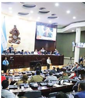
La discusión del proyecto de ley ha provocado zafarranchos en el Congreso Nacional.

La discusión del proyecto de ley ha provocado zafarranchos en el Congreso Nacional ante el rechazo de algunos diputados que consideran que tendrá consecuencias negativas para la economía de Honduras.