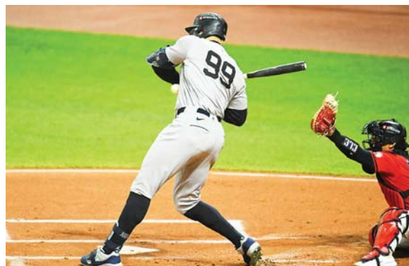
Aaron Judge, líder de jonrones de la temporada con 58.

Enfrente, los Yankees tienen como líder al implacable cañonero Aaron Judge, líder de jonrones de la temporada con 58, cuatro más que Ohtani.