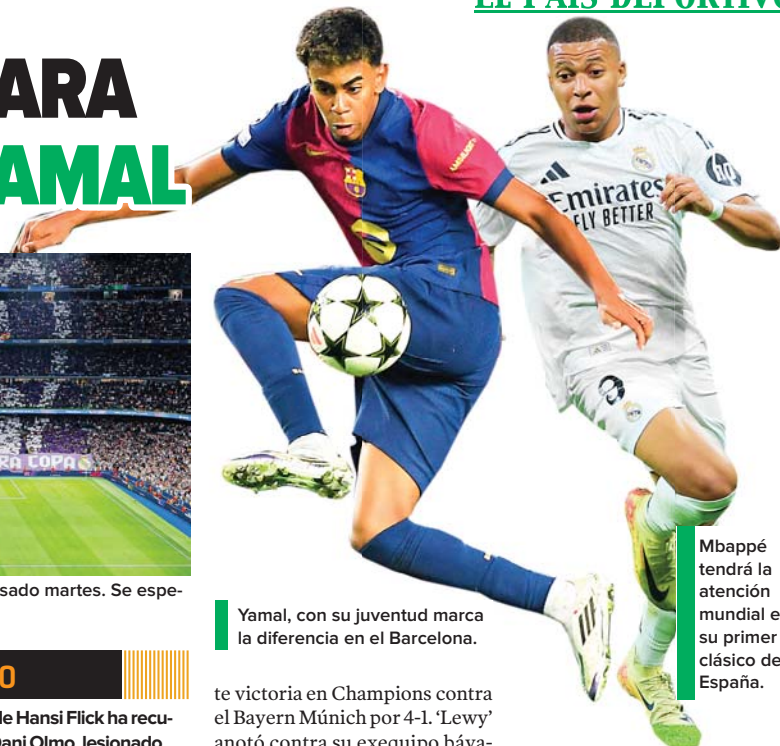
Mbappé tendrá la atención mundial en su primer clásico de España.

Ahora es el turno del francés, el futbolista más codiciado, y Lamine, la estrella más precoz que se recuerda.