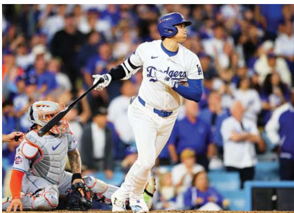
Los Dodgers tienen en Shohei Ohtani a su talismán, una máquina de batir récords.

Pero las expectativas generadas este año se han disparado a niveles inusitados debido a las estelares nóminas de ambos equipos.