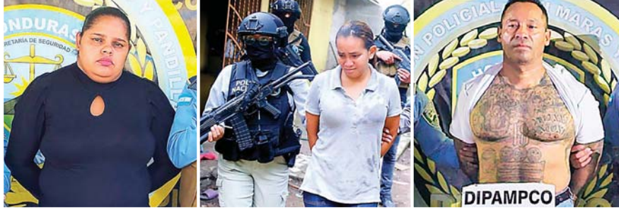
Las autoridades investigaban a esta banda desde hace un tiempo.

Las autoridades realizaron alrededor de 10 allanamientos de domicilio en diferentes departamentos del país.