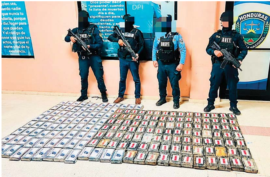
La droga fue trasladada posteriormente a la capital.