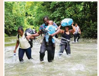
En los próximos días, Panamá podría iniciar la deportación aérea de venezolanos que atraviesan la selva a terceros países.

Hallar un tercer país que acoja a los migrantes irregulares de Venezuela sería una «solución a la crisis de los venezolanos que están cruzando por Panamá» con rumbo a Norteamérica,