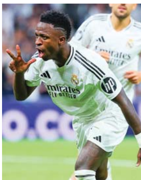
Varios aficionados han recibido condenas penales por insultos racistas contra Vinicius.

Los cuatro detenidos, según los agentes, "incitaban a los aficionados a que asistiesen al estadio a proferir insultos vejatorios y discriminatorios con connotaciones racistas" hacia el jugador, a través de esta campaña que logró viralizarse "suscitando una importante alarma social", explicaron.