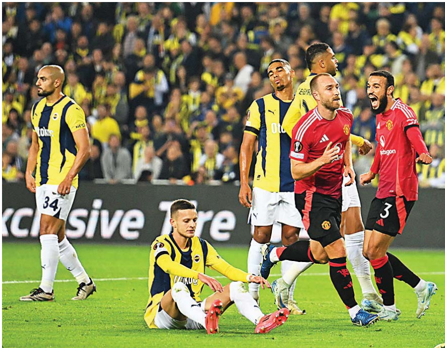
El Manchester United sigue dando tumbos hasta fuera de Inglaterra. Tampoco pudo ganar en Turquía

El técnico portugués, que dirigió al Manchester United entre 2016 y 2018, tuvo que seguir el final del partido desde la grada.