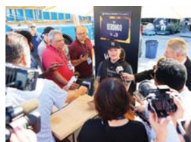
Alex Verdugo de los Yankees, conversando ayer con los medios en Los Ángeles.