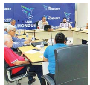
Lo hablado es lo entendido. La Primera División trabajará de forma programada con la Selección Nacional.