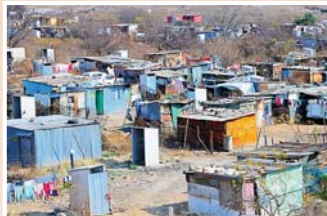
Los trastornos mentales que genera la pobreza constituyen a su vez un obstáculo para salir de ella.

Más de 970 millones de personas en todo el mundo -el 11 % de la población mundial- padecen algún trastorno mental, de ellos 280 millones sufren depresión y 301 millones, ansiedad, según el