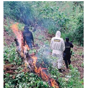
El operativo se realizó tras varias semanas de investigación y vigilancia, según las autoridades.

el área está siendo constantemente vigilada para evitar la replantación de cultivos ilícitos.