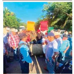
Los pobladores dijeron que seguirán protestando hasta ser escuchados.

TEGUCIGALPA. Los pobladores del departamento de Colón protestaron ayer por estar en contra del decreto 117-2012, que prohíbe la portación de armas en esta zona.