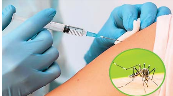
El proceso de vacunación sigue rigurosos protocolos internacionales para garantizar la seguridad de las personas, dijo la secretaria de Salud.

En lo que va del año, la Secretaría de Salud registra 146 muertes por la enfermedad, que han sido confirmadas por el Comité de Mortalidad de Dengue.