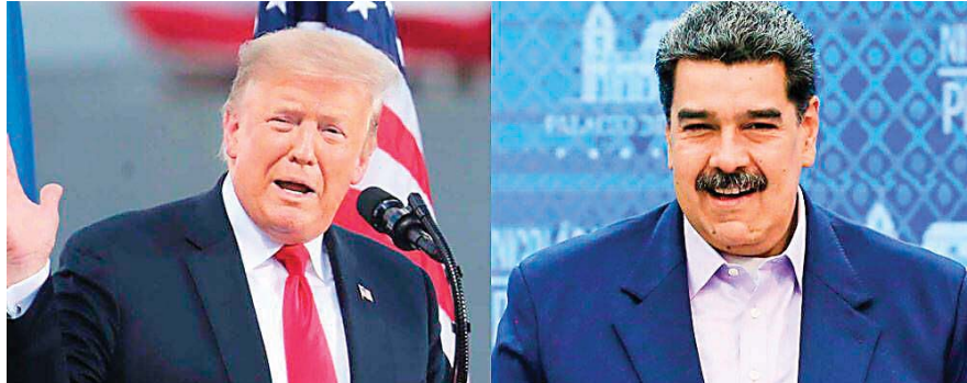
Trump, públicamente criticaba al Gobierno de Venezuela, pero en privado expresaba admiración por Nicolás Maduro.

Troye, una republicana de toda la vida que en estas elecciones votará por Kamala Harris, contó el "conflicto interno" que la atormentó durante su etapa en la Casa Blanca como asesora principal en seguridad