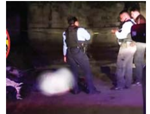
Las autoridades indicaron que se encuentran investigando el doble crimen.

En ese sentido, debido a lo encontrado en la escena, las autoridades indicaron que podría