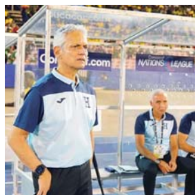
Al colombiano Reinaldo Rueda se le ha prometido todo el apoyo posible de cara a los partidos contra México.