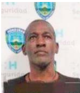
El sospechoso es nacido en Luisiana, Estados Unidos, y con residencia en la colonia Las Américas, Choloma.

De acuerdo con lo detallado en el fallo de culpabilidad, la tarde del 21 de septiembre de 2023,