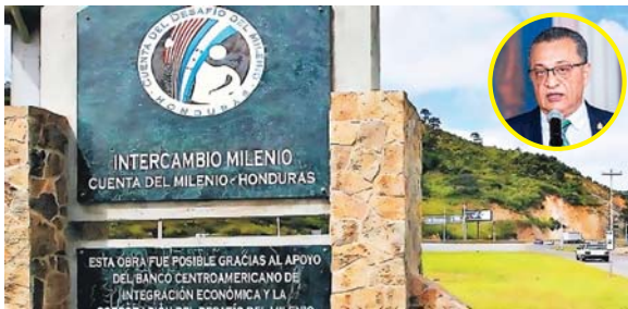
Sierra expresó que el indicador más importante es el de corrupción, ese lo evalúan con el 50 por ciento, no es una evaluación objetiva.

El presidente de la CNBS dijo que aunque se superen otros indicadores, el principal, que es el índice de control de la corrupción, no se aprobará.