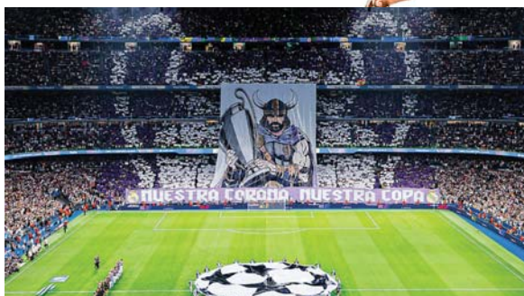
El estadio Bernabéu lució espectacular el pasado martes. Se espera el sábado otro gran ambiente.

Ahora es el turno del francés, el futbolista más codiciado, y Lamine, la estrella más precoz que se recuerda.