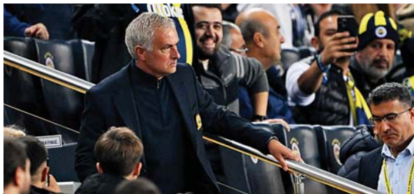
El controversial José Mourinho reclamó por un penal para su equipo y lo mandaron para las gradas