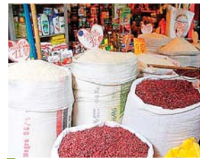
Diversos productos de la canasta básica reportan alza como efecto del deslizamiento del lempira.

En ese sentido, Iriás advirtió que los aumentos de precios reportados hasta la fecha son solo el principio, «nos viene la temporada de la Navidad», recordó, al agregar que además del deslizamiento del lempira, también está el tema de las tarifas de la energía eléctrica y más escasez de dólares.