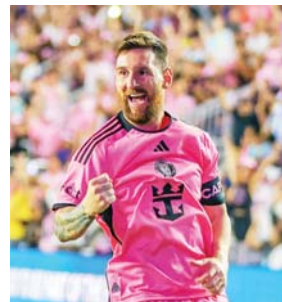
El argentino ya superó a Gonzalo Higuaín como el máximo goleador histórico del Inter Miami.

Junto a Messi, aparecen en la lista de cinco finalistas su compañero de equipo uruguayo Luis Suárez (Inter Miami), el brasileño Evander (Portland Timbers), el colombiano José 'Cucho' Hernández (Columbus Crew) y el ganador de la Bota de Oro de 2024, Christian Benteke (DC United).