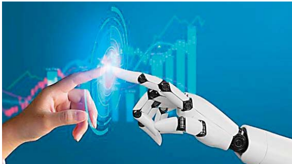
Los interesados pueden pedir más información en el Instituto de Ciencia y Tecnología de Honduras.

El embajador Luis García, de República Dominicana, expresó que están listos para capacitar a los estudiantes y hacer una alianza estratégica con esta mano de obra calificada.