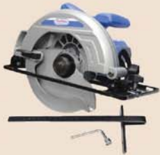
SIERRA CIRCULAR BEST VALUE #H27012 1400W T0500311

1 AÑO DE GARANTIA DE FABRICA EN TODOS LOS PRODUCTOS