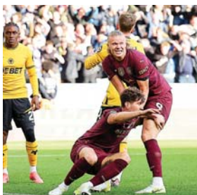
El City sufrió pero consiguió los tres puntos.

El Chelsea es sexto con 14 puntos tras haber concedido su segunda derrota de la temporada en la Premier League, dos meses después de caer ante el Manchester City.