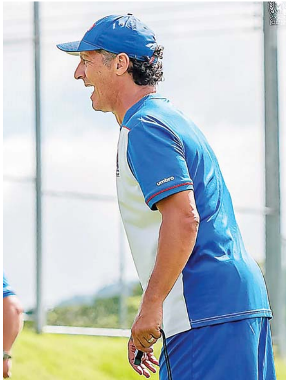
Troglio exige al jugador merengue mantener el ADN de Olimpia, ser ambicioso y querer más goles.

El DT argentino reconoce que para volver a competir se debe mejorar varios puntos. “Nos faltó intensidad en los últimos 15 minutos finales, el fútbol es así, este partido era para mantener el arco a cero, pero Recordó que en el medio tiempo le explicó a la plantilla lo que podría suceder si se confiaban. “En el vestuario mencioné lo que quería que no pasará y pasó, había que jugar con la misma intensidad y el mayor respeto que le podemos dar al club visitante es aprovechando las chances, no hay que jugar con pases hacia atrás intrascendentes, prefiero ir hacia adelan-