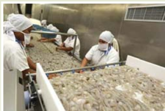
Este incidente destaca los desafíos que enfrentan los productores hondureños en los mercados internacionales.

“Los productores de camarón trabajaron para exportar los 150 contenedores y hasta se habían distribuido la parte que les correspondía y ahora deberán buscar que hacer con el producto, consideramos que esta respuesta desagradable, grosera y descortés” manifestó.