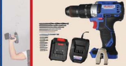
ROTOMARTILLO BEST VALUE INALAMBRICO #H27031 1/2 20V T0500315