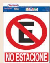
SEÑAL BEST VALUE NO ESTACIONARSE #F08111 H0201101

*Promoción válida hasta agotar existencia *Promoción aplica restricciones, Válido en compras al contado o tarjeta.