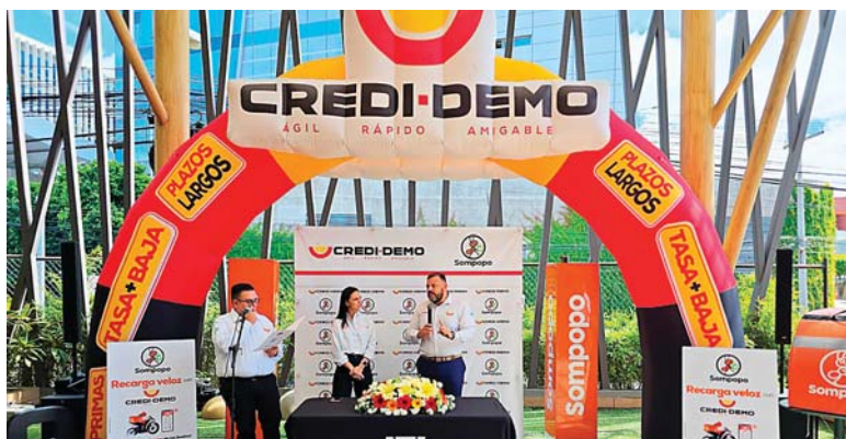
Sompopo y CREDI-DEMO se han unido para ofrecer valiosos beneficios a sus Agentes.