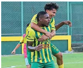
Parrillas goleó 4-1 al Brasilia y acaricia la clasificación, pero debe ganar en el Excélsior.

midió el tiempo y espacio donde estaba ubicado Lacayo y le dijo "tené, consagrate", pero el minuto delantero la quiso meter con estilo y como los grandes para terminar desperdiciando la acción y condenar a su equipo a otro empate.