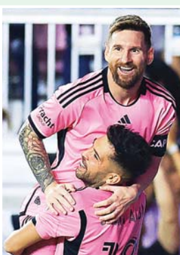
Messi, será así una de las grandes atracciones de la primera edición del Mundial de Clubes ampliado a 32 participantes.

El equipo de Messi, quien anotó un triplete el sábado, ya se había asegurado el primer lugar general de la temporada regular de la MLS, que se reconoce con el trofeo Supporters' Shield.