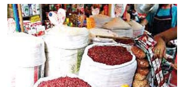
Esta semana varios productos van a reportar un aumento de precio, según la Adecabah.

“Honduras enfrenta una temporada de especulación en los precios de muchos productos a causa de la Navidad”. Adalid Irías, presidente de la Adecabah.