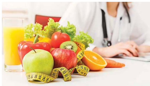
Alcanzar y mantener un peso saludable es uno de los aspectos más importantes para cuidar su salud general.

tra el cáncer de mama, o después de éste, puede incrementar tanto el riesgo de que regrese el cáncer de mama como el riesgo de tener otros tipos de cáncer.