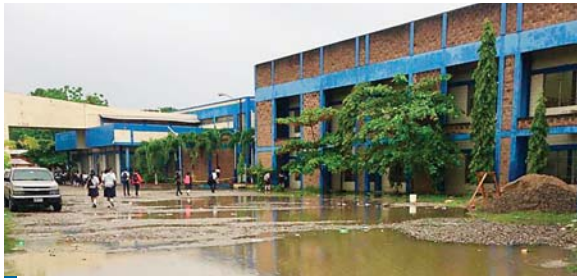
Los estudiantes están a la espera de una respuesta por parte de las autoridades.

Hicieron un llamado urgente a las autoridades educativas y gubernamentales para que intervengan de inmediato y eviten una tragedia.