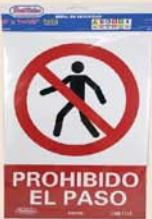
SEÑAL BEST VALUE PROHIBIDO EL PASO #F08115 H0201102