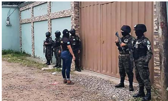
Allanaron casas de lujo que podrían estar asociadas a testaferros.

La DLCN, además, ejecutó dos eventos previos al operativo donde arrestó a otros miembros de es-