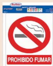
SEÑAL BEST VALUE PROHIBIDO FUMAR #F08110 H0201100