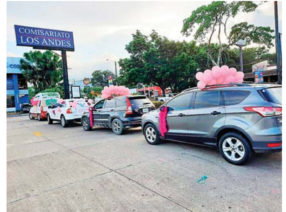
La caravana saldrá a las 7:30 de la mañana del estacionamiento de Comisariato Los Andes.