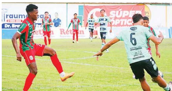
El "Monstruo Verde" estuvo a punto de remontarle al Juticalpa en tres minutos, pero se confinó a un empate.