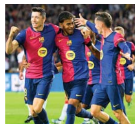
Barcelona mantiene la cima y la defenderá el sábado ante el Real Madrid.

MADRID. El Barcelona sigue su camino en la cima de la Liga española y ayer derrotó de forma contundente 5-1 al Sevilla, en el cierre de la jornada diez.