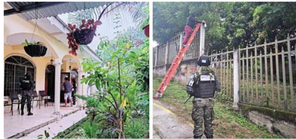
Los militares desmantelaron más de 30 cámaras de videovigilancia.