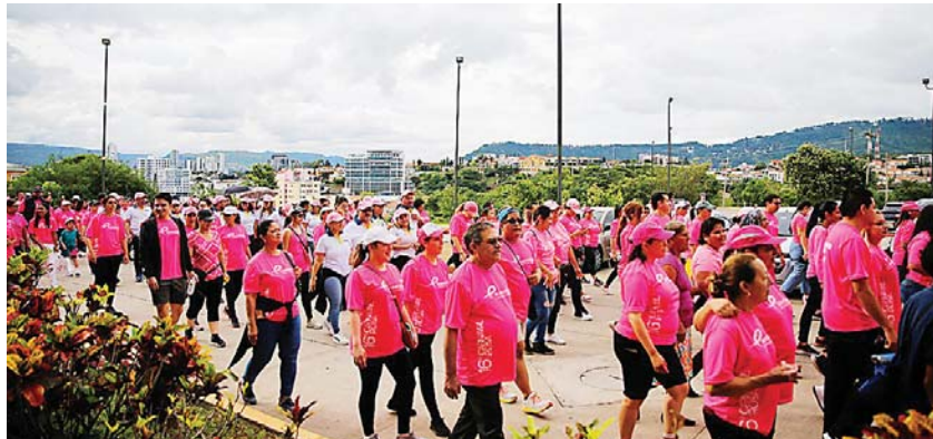
Según cifras de la Funhocam, el cáncer de mama afecta más a las hondureñas en edad entre los 36 y 55 años.

Bueso destacó que la caminata busca concienciar a todas las mujeres que una mamografía salva vidas, “quisiéramos que cada una de las mujeres se sienta muy segura que cuando tenga algún signo o un síntoma, acuda a su médico”, agregó.