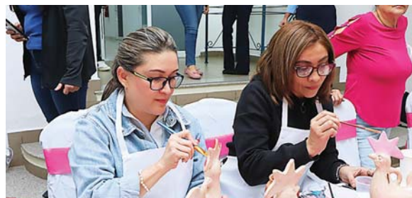
Las asistentes mostraron su creatividad en el taller de pintura.