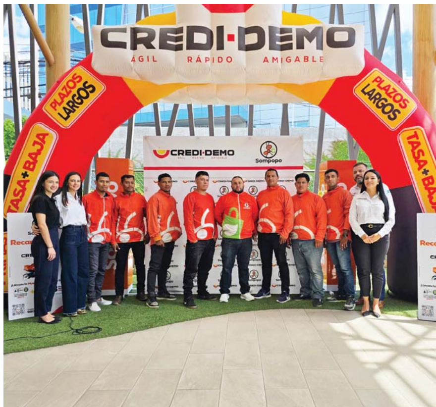
CREDI-DEMO, enfatiza su compromiso con la excelencia en el servicio.

Para más información, visita las redes sociales de Sompopo y CREDI-DEMO.