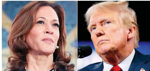
Kamala Harris y Donald Trump buscan la presidencia de EE.UU.

La campaña de Trump abraza una suerte de hipermasculinidad que alcanzó su máxima expresión en la convención republicana en Milwaukee, donde el exluchador Hulk Hogan se arrancó la camiseta en directo y el propio expresi-