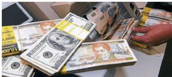
Las autoridades siguen comprometidas a implementar políticas macroeconómicas prudentes para fortalecer la estabilidad económica.

Lo anterior lo dieron a conocer a través de un comunicado del FMI