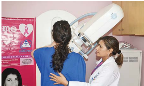
Diagnos cuenta con la tecnología más avanzada para hacer mamografías.

“Nos preocupa que en las jóvenes es un cáncer más agresivo y la ra-