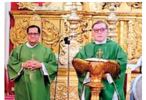
El sacerdote pidió orar por los sacerdotes que también son misioneros en todo el mundo.

Manifestó que Jesús nos llama a ser servidores de los demás y por ello la Iglesia no debe complicar la vida de nadie, en cambio de ayudar a las personas