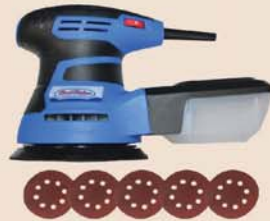
LIJADORA ORBITAL BEST VALU #H27015 350W T0500312