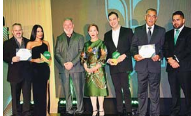
Grupo Macdel y Hush Cosmetics recibieron el reconocimiento Sello Verde.