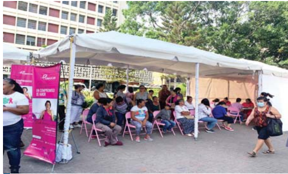
Muchas hondureñas aprovecharon la brigada médica para realizarse gratuitamente la mamografía.

Realizaron ayer una brigada médica en donde muchas hondureñas llegaron a realizarse la mamografía de manera gratuita.