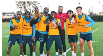
Los azules del Chelsea ponen a prueba su momento en Anfield, ante el Liverpool, líder momentáneo de la Premier.

si perfecto de temporada del Liverpool, con 9 victorias en 10 partidos entre todas las competiciones.