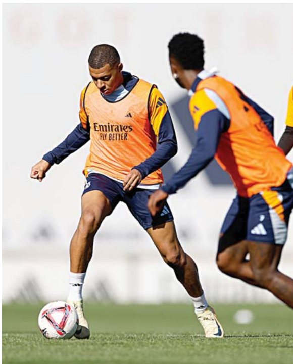
Mbappé quiere olvidar las polémicas legales fuera del campo y esta tarde entra en Balaídos

En el club azulgrana las miradas están puestas en el joven Lamine Yamal, que tuvo que retirarse este pasado domingo de la concentración de la selección española por una sobrecarga en el muslo izquierdo. Yamal podría ser una baja importante para el partido que tienen los culés frente al Sevilla el domingo.