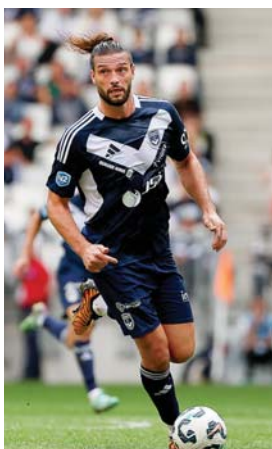
Carroll milita en el exequipo del hondureño, Alberth Elis.

“Cuando se tiene un líder con peso, que da ejemplo, los otros en torno a él quieren estar a la altura”,