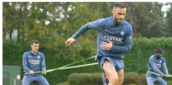
El Inter tiene la misión de salir vivo del estadio Olímpico de Roma, la capital italiana.

lanteras del campeonato, Romelu Lukaku y Artem Dovbyk en los locales (6 goles entre ambos) y Lautaro Martínez y Marcus Thuram en los visitantes (9 tantos).