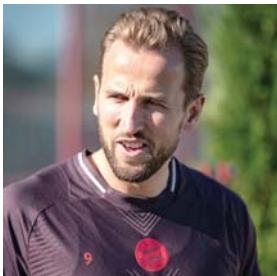
El inglés Harry Kane quiere seguir con la puntería afinada, primero el Stuttgart y luego el Barcelona en Champions.

A escasos días de visitar al FC Barcelona en Champions, los bávaros necesitan recuperar el au-