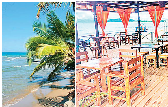
Las playas de Tela han quedado solitarias porque las personas ya tienen miedo.

Empresarios locales expresan preocupación por el tiempo que podría tomar recuperar la confianza de los visitantes.