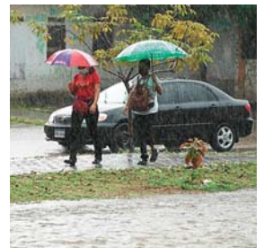
En las últimas dos semanas se han registrados aumentos en los carburantes.

TEGUCIGALPA. El Centro Nacional de Huracanes (NHC, por sus siglas en inglés) informó ayer que una perturbación en el Mar Caribe tiene un 50% de probabilidad de desarrollarse en las próximas horas en una depresión tropical, la cual provocará lluvias en Honduras y en el resto de Centroamérica y México.