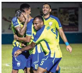
Los Potros vienen en cabalgata. Con el “Primi” llevan seis de seis y visitan al líder en el juego mas importante de la fecha.