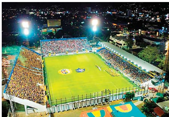
El Morazán ha sido mejorado en la cancha y la asistencia del público es impresionante.

En cuanto a la historia de los partidos en el estadio sampedrano, nos lleva a dos únicos antecedentes, ambos en eliminatorias mundialistas. El primero fue el 25 marzo 1965