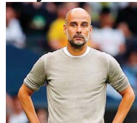
Guardiola camina con éxito en el City.

El técnico del City, en el puesto desde 2016 y campeón de Inglaterra en las cuatro últimas temporadas, defendió al germano, cuestionado en algunos ám-