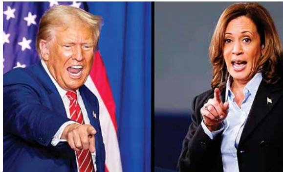
Trump ha lanzado varios insultos contra Harris.