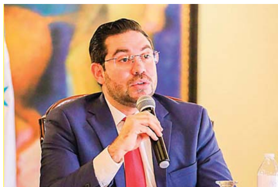
Jorge Cáliz, precandidato presidencial.

El precandidato añadió que la consulta es “para ver si la gente está de acuerdo con que los narcos se pudran en la cárcel en Estados Unidos o para ver si la gente está de acuerdo con que el gobierno de la presidenta Castro proteja a los narcos que la gente lo diga y de una vez deberíamos de preguntarle a la gente si está contenta con este gobierno”.