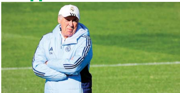
“Hablo con los jugadores todos los días, veo al jugador todos los días, trabaja muy bien”, añadió Ancelotti.

La fiscalía sueca anunció el martes la apertura de una investigación por violación tras la estancia de Mba-