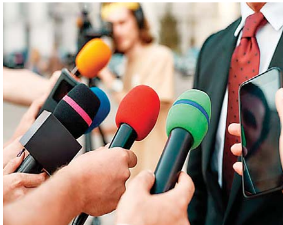
Indicaron que el Mecanismo Nacional de Protección a periodistas y defensores “no ha logrado garantizar la justicia”.

La SIP resaltó que el Mecanismo Nacional de Protección no funciona y que los periodistas se sienten obligados a autocensurarse para protegerse a sí mismos y a sus familias, mientras que otros han opta-