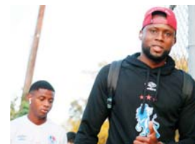
Arboleda reconoció que mucha gente no acepta jugadores naturalizados en la selección.

"Los precios de entrada se dará a conocer la próxima.