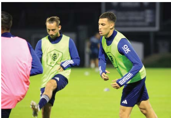
Tras su uso de un mes, el césped irá al estadio de Le Mans, donde se quedará entre cuatro y cinco años.

"Va con mi estilo de vida y mi forma de disfrutar de fútbol, era una muy buena opción para mí", prosigue, consciente de que decisión puede haber sorprendido. "Pero fue una decisión fácil para mí".