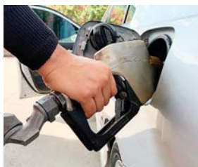
En las últimas dos semanas se han registrados aumentos en los carburantes.

SAN PEDRO SULA. Más de un lempira incrementarán la gasolina superior y el kerosene a partir del lunes, informó la Secretaría de Energía, a través de la Dirección General de Hidrocarburos y Biocombustibles.