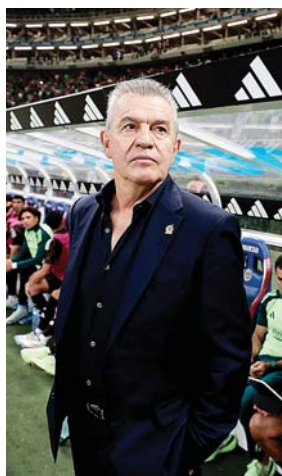
La selección de México viene a una de las pruebas más duras bajo el mando de Aguirre.