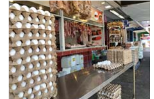
El cartón de huevos ronda entre los 85, 75 y 65, según su tamaño.

Hace cinco semanas se produjo una especulación en el precio de este producto por lo que unas 15 empresas entre productores y distribuidores han sido sancionadas.