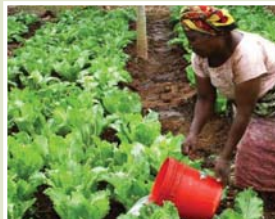
El Corredor Seco será la zona más afectada por La Niña.

Señaló que las comunidades tienen muchas experiencias de resiliencia a choques climáticos y gracias a su conocimiento se puede aprender a evitar plagas y