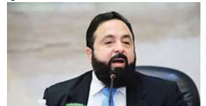
El presidente del Congreso Nacional, Luis Redondo.

"No existe ningún artículo en la Constitución, ni en ninguna ley, que prohíba, obstaculi-