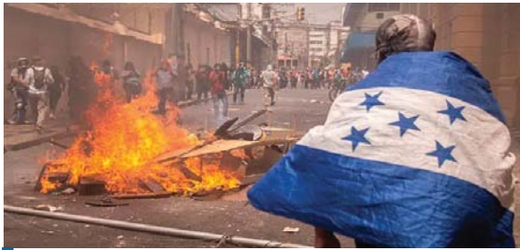
Las autoridades señalaron que usarán el Manual del uso de la fuerza y armas de fuego durante las protestas.