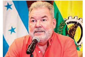
El edil invitó a denunciar cualquier práctica ilegal que involucre a empleados de la alcaldía sampedrana.

"Algunos contribuyentes me han notificado que en las oficinas de Galerías operan ciertas personas, que pueden