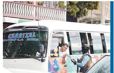
El miércoles se registró un fuerte accidente que dejó unas 30 personas heridas.