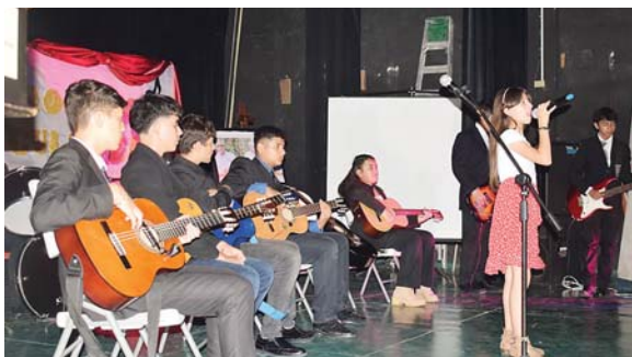
La Orquesta Juvenil de la Casa de la Cultura deleitó a los presentes.

dición, son un referente en la música, a esta agrupación que tiene una gran historia con un talento que se ha transmitido de generación en generación.