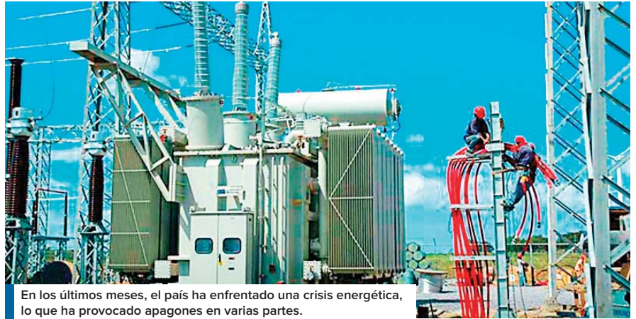
En los últimos meses, el país ha enfrentado una crisis energética, lo que ha provocado apagones en varias partes.

Además de cuestionar al Gobierno por no hacer una licitación para la compra de energía, señaló que el principal problema de la estatal de energía son las pérdidas