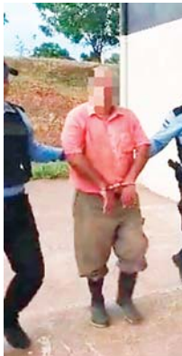
El detenido fue puesto a la orden del Ministerio Público para seguir el procedimiento conforme a lo establecido en Ley.

El detenido es originario y residente en el mismo lugar donde realizaron los hechos.