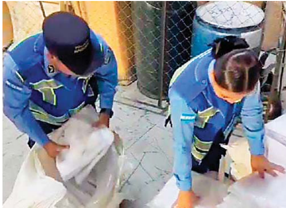
Los agentes inspeccionaron la mercadería que permanecerá en predio fiscal.

Al momento de realizar la inspección fueron encontrados 467 fardos con zapatos, sandalias y ro-