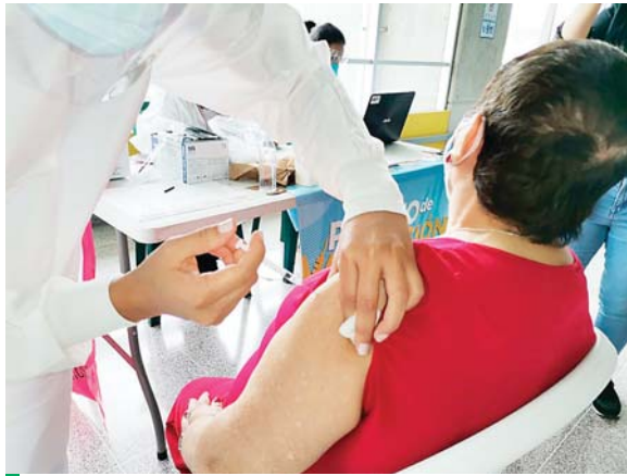
Las personas afectadas son las que no han completado el esquema de vacunación.

Señaló que en estos municipios se están diagnosticando entre 75 a 150 casos de COVID-19 a