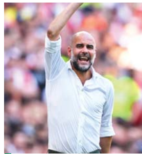
Pep Guardiola ha marcado historia con el City.

da, con 84 puntos en su casillero, y 88 goles a favor para finalizar en segundo puesto, el Ar-