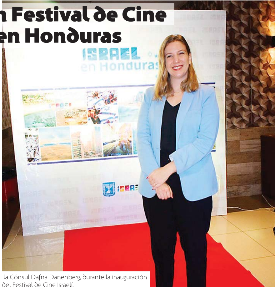
la Cónsul Dafna Danenberg, durante la inauguración del Festival de Cine Israelí.

Dafna Danenberg agradeció la presencia de los invitados especiales y mencionó que este tema representa un ejemplo de las relaciones bilaterales entre las naciones hermanas de Honduras e Israel.