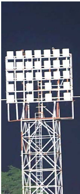
Una de las primeras torres en ser utilizadas.

Tiene dos amplios camerinos para los equipos y también arbitral.