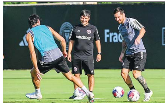
El Inter Miami es el peor equipo de la MLS, pero con Messi han repuntado en la Leagues Cup