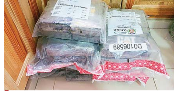
La droga fue hallada en dos lugares distintos de la embarcación.

La mercadería permanecerá en calidad de depósito temporal en un predio fiscal ubicado en la zona norte.