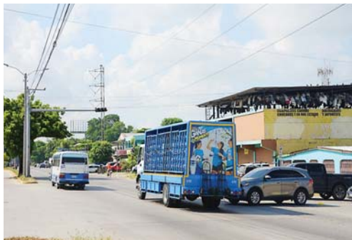
Este semáforo lleva más de 20 días sin funcionar.

SAN PEDRO SULA. Conductores que circulan por el Bulevar del Este, expresaron que es necesario que ya se arregle el semáforo que está ubicado a la altura de la colonia Satélite, para evitar que siga habiendo accidentes.