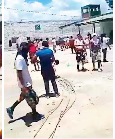
El caos inició con un incendio de colchones dentro de las celdas, luego se generó desorden en el que hubo heridos de bala y con piedras.