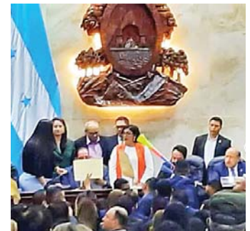
El mensaje de los diputados a la sociedad es que todo se resuelve con violencia, dice capellán de las FF.AA.

La cordura debe ser algo que rija a todos los hondureños, por lo que debe primar el diálogo y no promover la violencia, que es lo que se ha hecho hasta entonces. Para el sacerdote, el mensaje de los di-