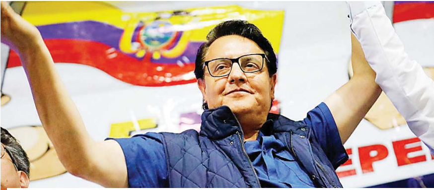
Los migrantes saben de los riesgos que se corren y prefieren "pedirle a Dios que interceda por ellos".

QUITO, ECUADOR. En el día que debía celebrar un año más de su primer grito de independencia, Ecuador amaneció ayer jueves de luto e indignado por el asesinato del candidato presidencial Fernando Villavicencio, periodista y exasambleísta, que ofrecía para su eventual Gobierno mano dura contra la delincuencia, el narcotráfico y la corrupción.