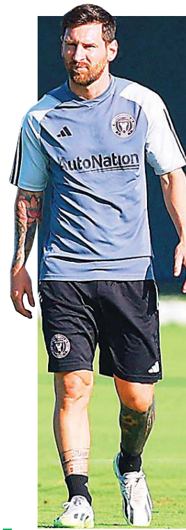
El crack argentino lidera la expedición del Inter rumbo a semifinales

El trámite de octavos de final ante el FC Dallas fue más complicado para el equipo rosado, y Messi volvió a ser determinante: anotó el primer gol del partido y rescató el empate 4-4 muy cerca del final del juego, también de tiro libre, para forzar la tanda de penales.