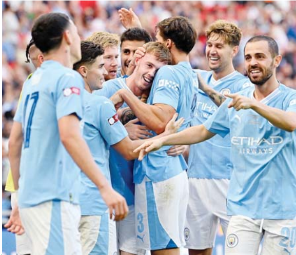
Manchester City es de nuevo el gran favorito para ganar la Premier League.

Después de haber peleado por el título la temporada pasa-