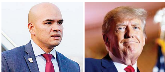
El asistente personal de Donald Trump, Waltine Nauta, dijo ser inocente.

El mandatario estaba también citado, pero pidió permiso para estar representado por sus abogados y se declaró en un documento con fecha del 4 de agosto pasado no culpable.