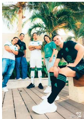
Hoy debuta el Al-Ahli donde jugarán Mahrez, Firmino, Kessie y Edouard Mendy.

En julio, el Al-Hilal habría llegado incluso a ofrecer 300 millones de euros (329 millones de dólares) para fichar al astro francés Kylian Mbappé, pero la estrella del París Saint-Germain se habría incluso negado a reunirse con los dirigentes de ese club.