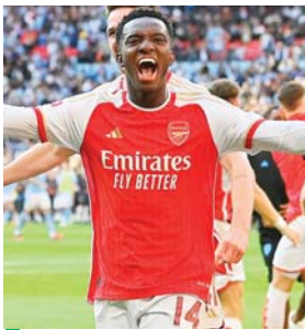
Arsenal figura como el gran competidor.