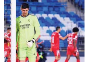
Courtois se lesionó durante el entrenamiento matinal, que abandonó llorando.

MADRID. El portero del Real Madrid, Thibaut Courtois, se rompió el ligamento cruzado anterior de la rodilla izquierda, a dos días del inicio de la Liga, informó el club merengue.