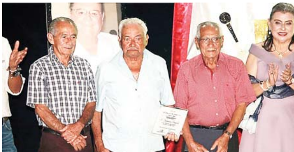
Los Hermanos Brizuela, toda una vida dedicada a la música.