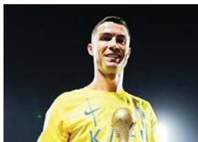
La llegada de Cristiano a Arabia desató una lluvia de estrellas a esa liga.

Varios clubes sauditas han logrado hacerse en las últimas semanas con grandes estrellas del fútbol mundial, del francés Karim Benzema a los brasileños Fabinho o Roberto Firmino, pasando por el senegalés Sadio Mané. El precedente claro está en seis meses antes: el fichaje del portugués Cristiano Ronaldo por el Al Nassr, el pasado enero.