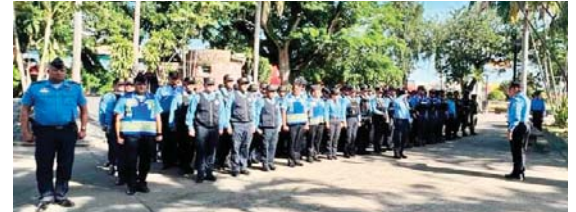
El proyecto de seguridad comenzó ayer en el parque central de Puerto Cortés.