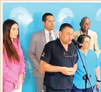
La bancada del Partido Salvador de Honduras (PSH) expuso ayer su preocupación por lo que acontece en el Congreso Nacional.

“¿Por qué llegar a estos extremos del uso de la fuerza, la violencia, los gritos y crear un circo alrededor del