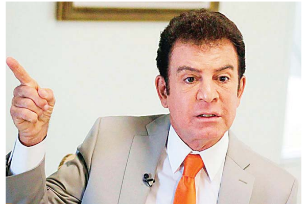
Salvador Nasralla aseguró que, junto a un grupo de abogados, está trabajando en la redacción del documento donde expondrá las razones que lo orillaron a renunciar.

El hasta ahora designado presidencial (vicepresidente) ya había adelantado que iba a renunciar a su cargo por discrepancias con el actual Gobierno, liderado por Castro, del partido Libertad y Refundación, con quien firmó una alianza de hecho previo a los comicios generales de noviembre de 2021.