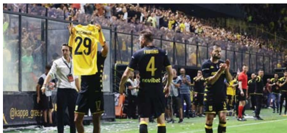
El hondureño le dedicó su gol a un aficionado del AEK de Atenas que fue asesinado antes de un partido.