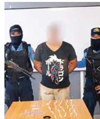
El detenido y los indicios encontrados serán presentados a la Fiscalía.

Se le supone responsable de haber cometido el delito de posesión para el tráfico ilícito de drogas, en perjuicio de la salud de la población y del Estado de Honduras.