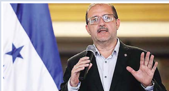
El comisionado de la Comisión Reguladora de Energía Eléctrica (CREE), Leonardo Deras.

Explicó que la licitación pública es para la generación de 480 megavatios y se dará todo el plazo para que las empresas presenten sus mejores ofertas, luego se espera que aproximadamente en dos años se lleve a cabo la construcción de plantas y que empiecen a generar en 2026.