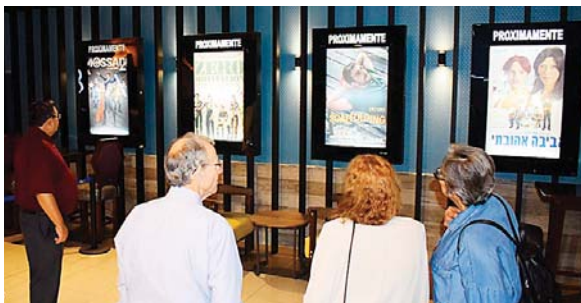
La película escogida para la inauguración del Festival fue Zero Motivation.