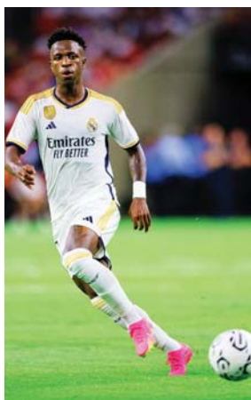
Vinicius encabeza la ofensiva del Real Madrid.

El central y volante defensivo de 25 años firmó hasta 2028 con los 'Hammers', vigentes campeones de la Conference League, para reforzar una medular que quedó mermada después de traspaso de Declan Rice al Arsenal.