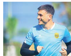
Real España juega su segundo partido en casa y deberá ganar.

Manifestó que espera mejorar los resultados a medida vayan acomodándose todos los jugadores.