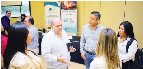
Los organizadores realizaron ayer el lanzamiento del evento que se desarrollará del 24 al 26 de agosto en San Pedro Sula.

SAN PEDRO SULA. Alrededor de 5,000 personas se esperan en la quinta edición de la Expo Logística 2023, que se llevará a cabo del 24 al 26 de agosto en las instalaciones de Expocentro en la Cámara de Comercio e Industrias de Cortés (CCIC).