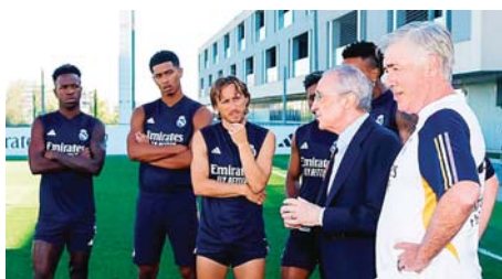
Florentino está a la espera de Mbappé, por eso se ha abstenido de fichar un centrodelantero top.