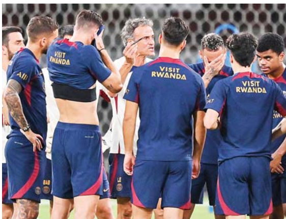
Luis Enrique con una tarea difícil de armar el PSG.

"Queremos que se quede, lo podemos repetir dos o tres veces. Pero no se puede ir gratuitamente. Es el acuerdo verbal que tenemos con él, y él dijo entonces en las entrevistas que no se iría libre. Y no es negociable", lanzó el presidente Nasser Al-Khelaifi, el 5 de julio, después de la presentación de Luis Enrique.