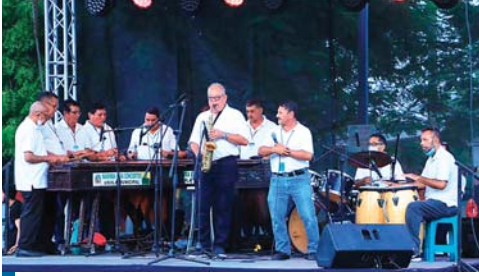
La Marimba para Conciertos puso el toque especial a la tarde cultural.