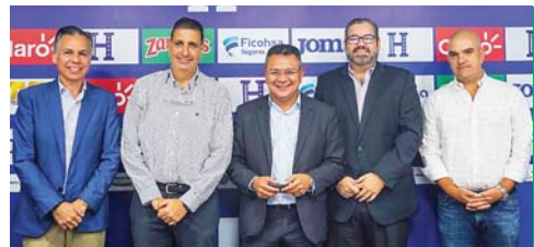
Dirigentes de Fenafuth y Liga Nacional en reunión de trabajo ayer martes.

Horas antes, personeros de la Liga Nacional brindaron detalles