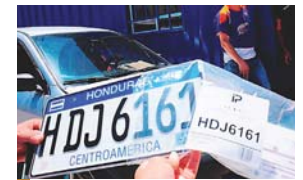
Admiten que atrasos en la entrega de placas se debe a la derogación de los fideicomisos.

“Se está buscando soluciones, ya se hizo la licitación y la misma es internacional y se tarda porque no es tan fácil, es por ello que se está dando una placa virtual y una copia en papel firmada por las