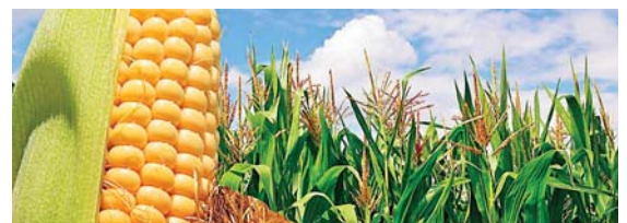
En el municipio de Esquías, Comayagua, se espera la cosecha de al menos 3 mil cargas de maíz.

A pesar de la incertidumbre por el anuncio del fenómeno El Niño, el cual provocaría una prolongada sequía, las lluvias han sido constantes y buenas para la siembra y cosecha, recalcó.