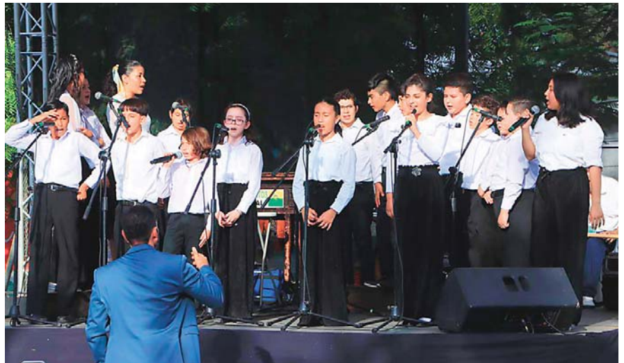
El coro infantil deleitó a los vecinos de la Rivera.