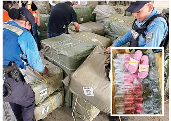
La mercadería decomisada se encuentra en un depósito temporal de un predio fiscal.

La Dirección Nacional de Servicios Policiales Fronterizos (DNS-PF), realiza diversas acciones operativas, con el fin de combatir los delitos de contrabando, tráfico de drogas y de personas.