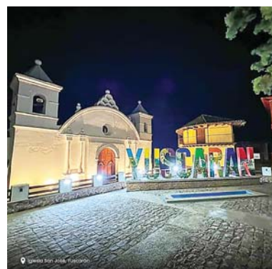
El pintoresco municipio de Yuscarán vivirá un gran día.