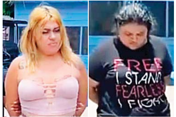
Ambas féminas serán acusadas por los delitos que se les imputan.

Por otra parte, en el barrio El Centro, de Nacaome, fue cap-