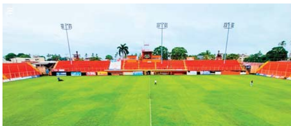
El estadio Lito Pérez, casa del nuevo club de la “Barbie”.