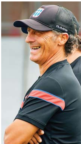
Al entrenador del Olimpia se le comenzó a cuestionar hasta por la falta de refuerzos.

Según Troglío, esto es normal porque hay personas que solo están esperando resultados como