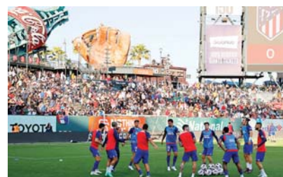
El Atlético de Madrid de Simeone se armó con jugadores sin mucho nombre.