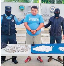
Alias “El Gordo” fue sorprendido por agentes policiales quienes le decomisaron la droga.

Asimismo, 96 bolsitas con hierba seca, supuesta marihuana y una mochila color negro, en la que transportaba el alucinógeno.