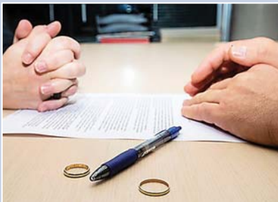
El divorcio supone la disolución del vínculo matrimonial tras una sentencia judicial.

Las solicitudes de divorcio en Honduras se han incrementado en los últimos meses en Tegucigalpa, de acuerdo con datos de los Juzgados de Familia.