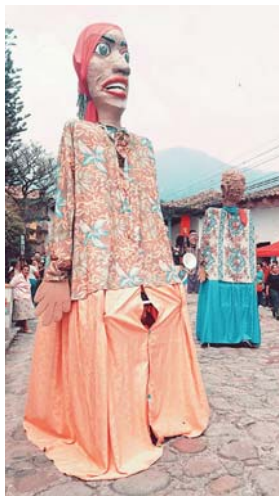
El baile de los gigantes es una de las tradiciones de la comunidad.

Al crearse el departamento de El Paraíso en 1869, Yuscarán adquirió la categoría de municipio y a la vez de “cabecera departamental”; aunque en el año de 1872 fue suprimida, restableciéndose en 1874. Después de ser un gran centro minero pasó a convertirse en centro productor de aguardiente, generando al Estado de Honduras importantes ganancias.