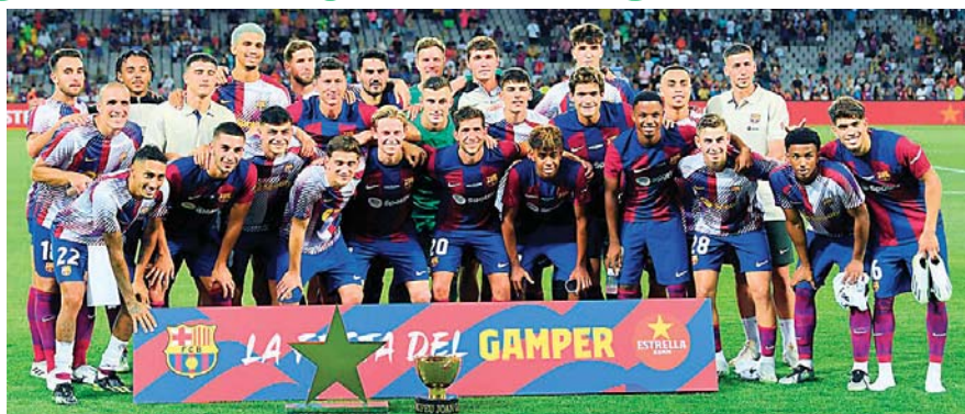
Barcelona es el vigente campeón y el rival a vencer para esta temporada.

Mientras espera una decisión del internacional francés para moverse, según la prensa española, el Real Madrid sigue con su transición generacional con la llegada del joven prodigio inglés Jude Bellingham, de 20 años, procedente del Borussia Dortmund por 103 millones de euros (110 millones de dólares).