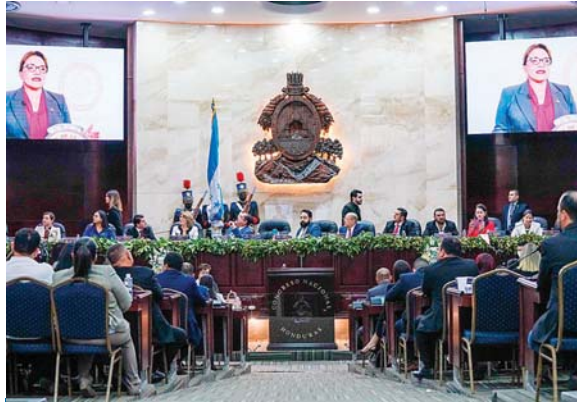
La Misión Internacional de Observación (MIO-Honduras) concluyó ayer su visita a Tegucigalpa

La Misión también sugirió a todos los partidos políticos conducir