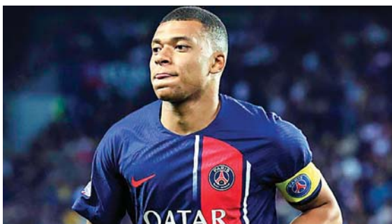
Mbappé ha sido apartado del grupo principal.