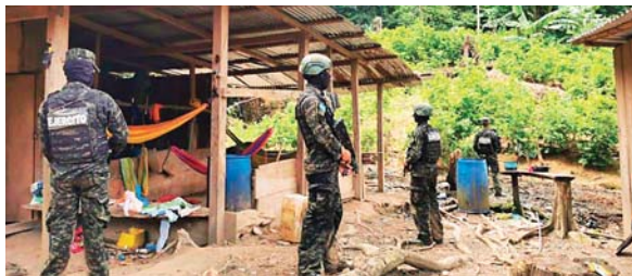
En el lugar del decomiso no encontraron habitantes.