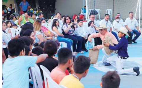
Los actos de teatro no podían faltar.