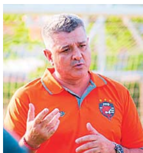
Ya habló con la plantilla y expuso sus objetivos

ha tenido un crecimiento importante. Honduras está intentando crecer, acepto que por el momento ha bajado, pero eso tiene que ver con las generaciones de futbolistas, siempre quieren comparar y no todas son iguales”.