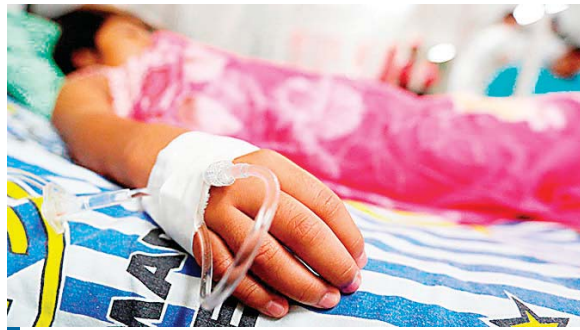
Las autoridades aseguran que se encuentra haciendo constante monitoreo, lo que ha permitido que los casos no lleguen a hospitalización.

Según comentó, en la vigilancia que hacen las autoridades de Salud se realizan visitas a las regio-