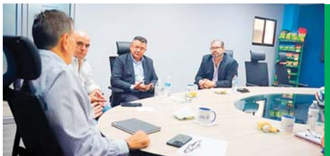
Total colaboración para la Selección Nacional de Reinaldo Rueda han prometido.

La idea es establecer un bien común donde no se afecten los intereses de los clubes de Primera División mientras éstos les prestan la total colaboración a los microciclos de Reinaldo Rueda y