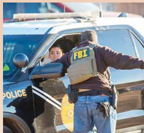
El sospechoso había amenazado en distintos mensajes en internet a Biden.