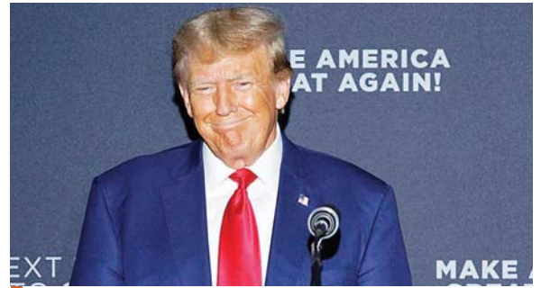
El expresidente Trump se ha declarado no culpable de todas las acusaciones.

A Trump y Nauta se les leerán los cargos adicionales imputados el pasado 27 de julio a cada uno por el fiscal especial Jack Smith, quien también actúa en el caso contra el exmandatario por el caso relacionado con la toma del Capitolio el 6 de enero de 2021 por partidarios suyos que querían impedir la