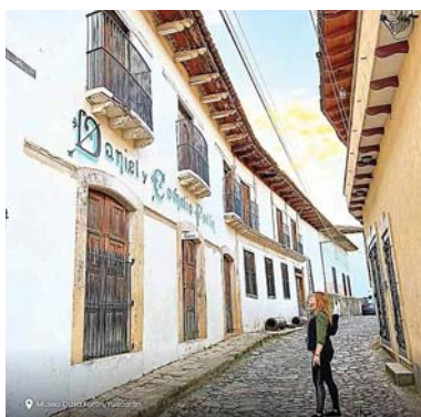
El casco histórico fue declarado Patrimonio Cultural de la Nación.