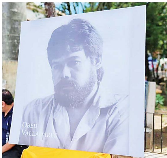
El Día Municipal del Folklor lleva el nombre de “Obed Valladares”, escultor expresionista, fue catedrático de la Escuela Nacional de Bellas Artes. Realizó estudios de restauración y rescate arqueológico de cerámica precolombina y colonial en Panamá. Sus trabajos fueron admirados en exposiciones personales, colectivas e industriales a nivel nacional e internacional. En vida expuso sus obras en museos en Washington, Costa Rica y Tegucigalpa.

Ubicado a 68 kilómetros de Tegucigalpa, al oriente del país, se localiza el municipio de Yuscarán, siendo la cabecera administrativa del departamento de El Paraíso. Es un pintoresco lugar que conserva la mayor parte de su infraestructura colonial.