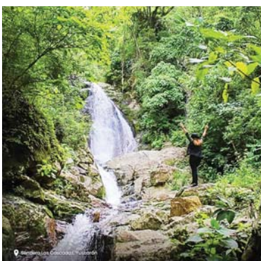
También resalta por poseer magníficas reservas naturales como el sendero Las Cascadas.