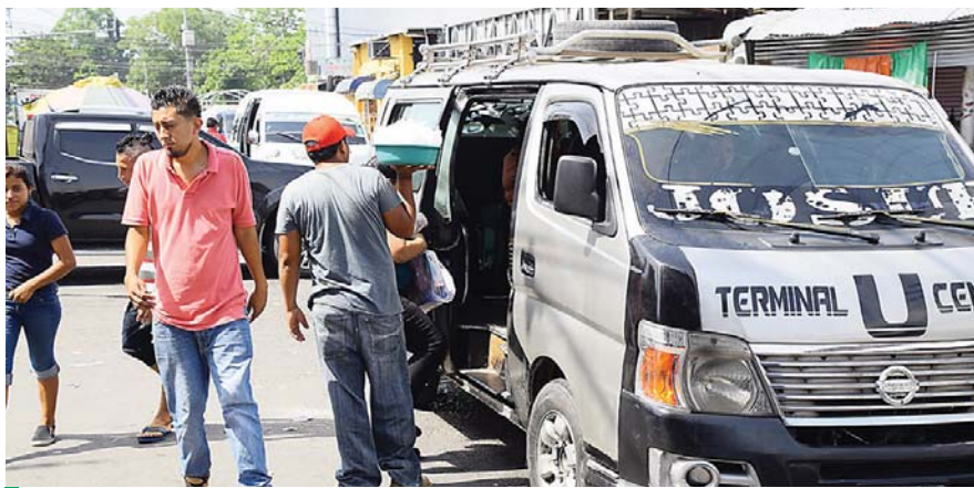
Según las autoridades, más de 1,400 autobuses circulan en San Pedro Sula.

Barahona dijo que, en este caso, los inversionistas del sector del transporte público tendrían que aportar un 10% en este proyecto, el cual sería de 120 a 140 millones de lempiras.