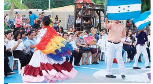
La Danza Folklórica Esencia de Honduras mostró su calidad artística.