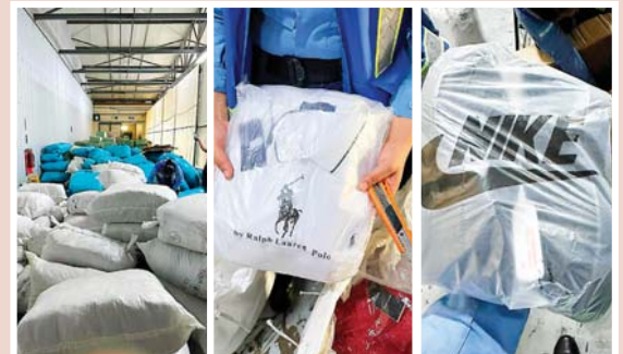
El nuevo contenedor fue abierto para constatar el valor de la mercancía, que se estima en 10 millones de lempiras.

Se destacó que los productos decomisados ya fueron remitidos a un predio fiscal para su correspondiente custodia y se teme que más contenedores estarían ya en