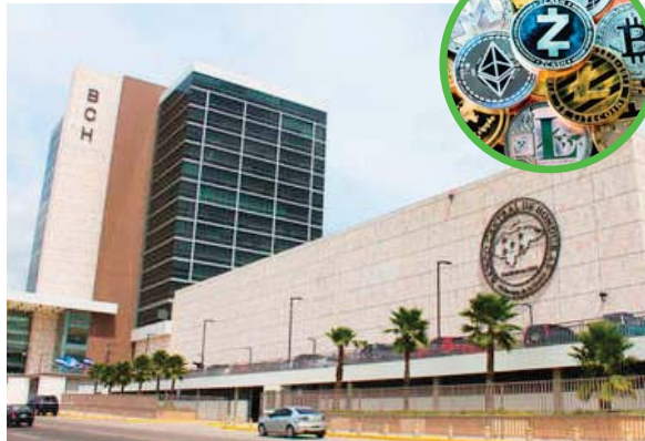
Según el BCH, las iniciativas planteadas conllevan beneficios e implicaciones para los usuarios.

Algunos economistas dicen que esto tiene un trasfondo inesperado y otros manifiestan que esto permitirá dinamizar las transacciones financieras.