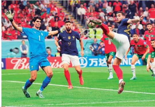
El tanto que daba giro al partido.