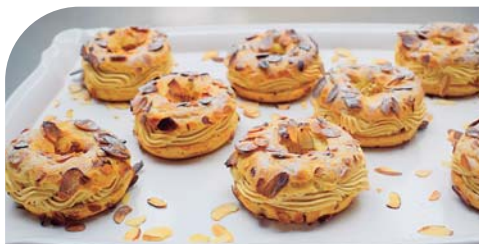
Paris-Brest, hechas con crema de almendra.