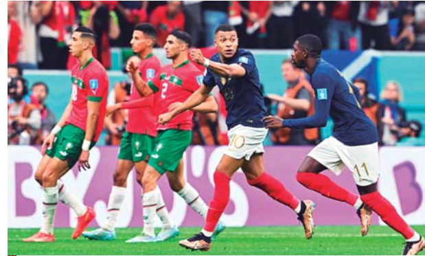
Marruecos quedó triste, los franceses celebraron.