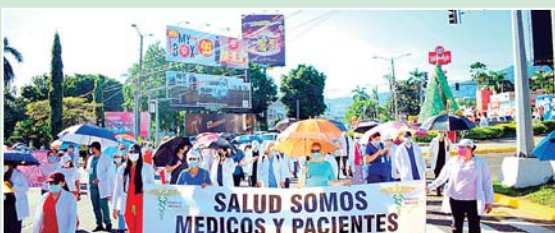
Los médicos se manifestaron ayer en la Avenida Circunvalación de la Ciudad Industrial.

“Exigimos los pagos que no se les han hecho a muchos. Únicamente exigimos lo que nos corresponde por ley no son aumentos los que estamos pidiendo”, concluyó.