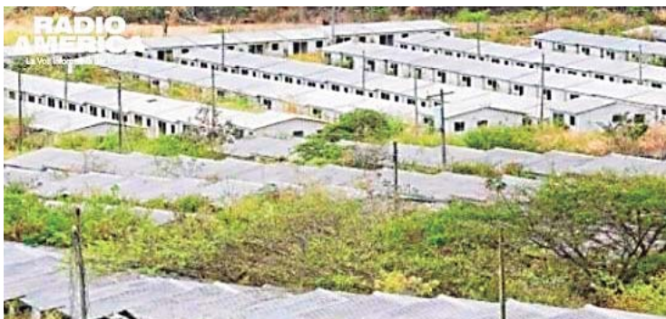
Vista del proyecto habitacional Ciudad Mateo en la capital de la República de Honduras, Tegucigalpa, en foto de archivo.

Adelantó que si todo se da como lo planean, los primeros procesos de licitación se harían entre julio, agosto, septiembre, en octubre del 2024, para finales del 2024 o inicio del 2025 poder estar entregando la primera vivienda.