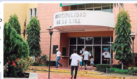
Imagen de la fachada frontal del edificio de la Alcaldía de La Lima, desde hace 7 años funciona con una planta a base de gasolina.