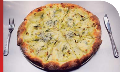
Pizza artesanal, hecha con papa, queso azul, romero y piñones.

Así que, si todavía no has degustado los platillos de la cafetería del Supermercado Junior en el barrio Suyapa, te recomendamos que lo hagas, seguro te encantarán y puedes acompañarlos con jugos naturales con frutas de temporada, el inigualable té frío con jengibre, melaza y hojas de té verde, entre otros.