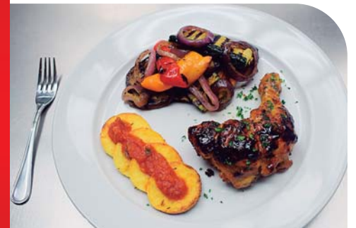
Un delicioso almuerzo con pollo relleno, gnocchi y vegetales rostizados.