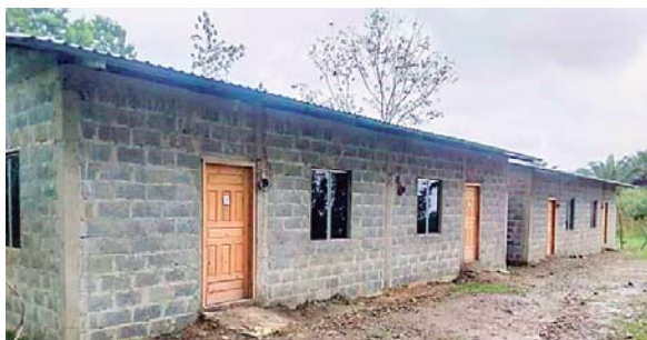
Las cuatro casas fueron entregadas a cuatro familias en la comunidad de Florida, por el proyecto Betesda.

TELA. - El proyecto Betesda hizo entrega de cuatro casas nuevas a cuatro familias que perdieron sus viviendas durante las tormentas de Eta y Iota, en la comunidad de Nueva Florida, Yoro. Las casas se construyeron gracias a varios voluntarios que apoyaron en la construcción de forma gratuita.