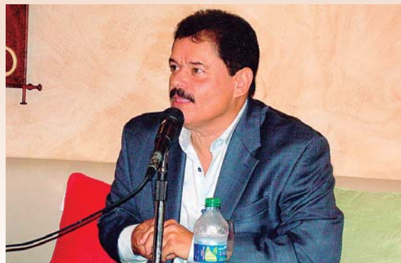
Lalo Rodríguez tenía 64 años de edad y más de 45 como cantante.

“Una de las voces más hermosas que mis oídos han escuchado y escucharán. Su timbre único, afinado y potente, hicie-