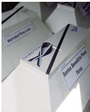
Cada cuerpo en su ataúd y bien identificado.

SAN SALVADOR, EFE. El Instituto de Medicina Legal de El Salvador entregó ayer los restos de diez víctimas de la masacre de El Mozote y sitios aledaños, hecho ocurrido en 1981 que fueron exhumados en noviembre de 2019, según informó un abogado de los familiares.