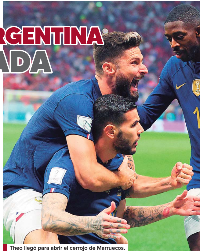
Theo llegó para abrir el cerrojo de Marruecos.

Los marroquíes de Walid Regragui lucharán por el tercer puesto contra la Croacia de Luka Modric, el sábado en el estadio Khalifa de Doha.