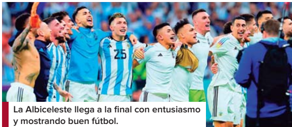
La Albiceleste llega a la final con entusiasmo y mostrando buen fútbol.

DOHA. La selección de Argentina disputará este domingo su sexta final de una Copa del Mundo, una historia que comenzó hace casi un siglo cuando jugó y perdió la de Uruguay 1930 con la figura de Guillermo Stábile, ganó con el matador Mario Alberto Kempes en casa en 1978 y en México '86 con Diego Maradona, que sufrió el sinsabor de la derrota en Italia '90, como en Brasil '14 le ocurrió a Leo Messi, que ahora tratará de tomar-