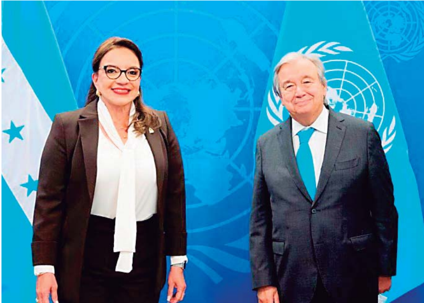
La presidente Xiomara Castro y el secretario general de la ONU estarían hoy en la firma del memorándum de instalación de la Cicih.