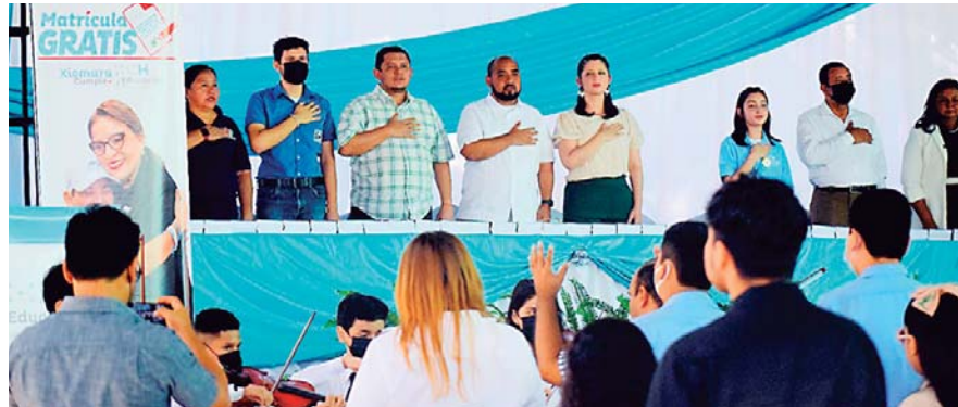
Las autoridades educativas realizaron ayer el lanzamiento de matrícula gratis, en San Pedro Sula.

“Venimos a hacer el lanzamiento del programa de la matrícula gratis en el departamento que tiene la mayor densidad poblacional del país, vamos a entregar más de 358 millones de lempiras a los centros educativos, hay una relación directa entre el número de niños matriculados y la cantidad de recursos que van a llegar y eso nos va a permitir que los pa-