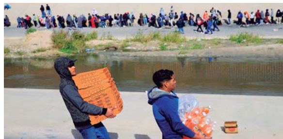
Ofrecen pizzas desde 250 hasta 500 pesos que equivale a 12.5 y a 25 dólares y cafés.

Las autoridades sanitarias de Panamá informaron de tres nuevos casos de la viruela símica, lo que elevó a 66 los contagios de la enfermedad confirmados. El Ministerio de Salud (Minsa) indicó que, de los 66 casos acumulados, 26 están activos, con 19 de ellos en aislamiento domiciliario y 7 aislados en instalaciones sanitarias. Las personas afectadas tuvieron exposición con otras contagiadas.