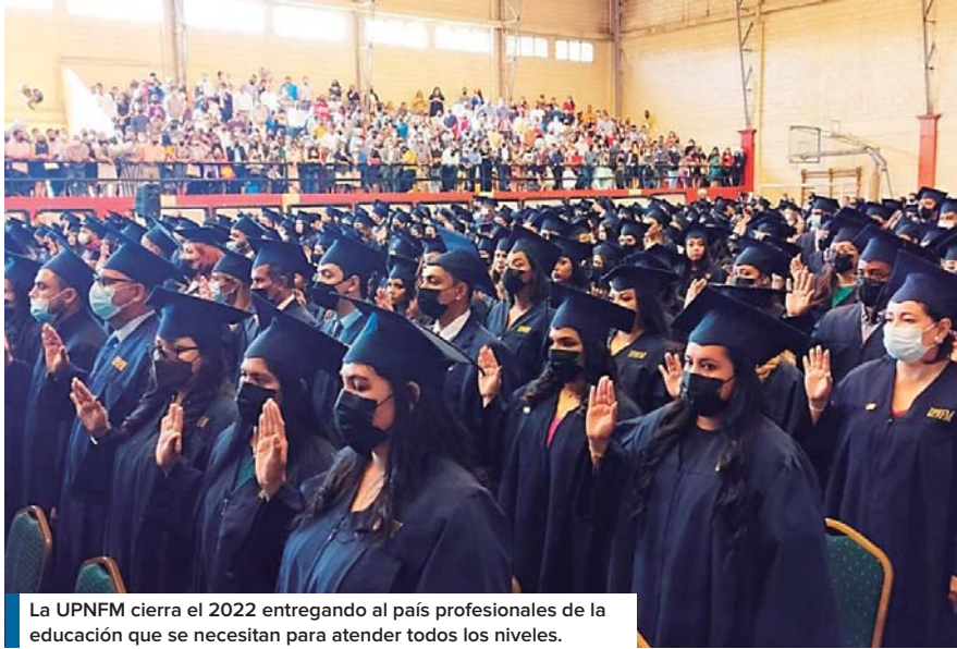
La UPNFM cierra el 2022 entregando al país profesionales de la educación que se necesitan para atender todos los niveles.

En solemne ceremonia de graduación, entregan 481 títulos profesionales en los niveles de doctorado, maestrías y licenciaturas.