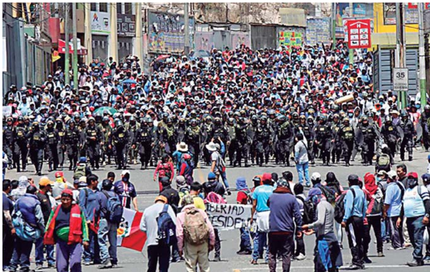
Las protestas en el país han dejado pérdidas humanas y ciento de policías y militares heridos.