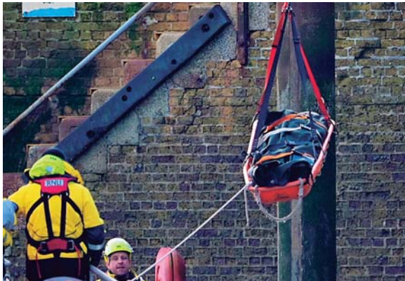
Después de varias horas de búsqueda, los rescatistas hallaron y sacaron los cuerpos.

A las aguas del canal han acudido además buques procedentes de las