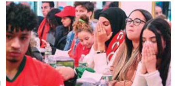
Lamentaron no llegar a la final, pero están contentos de su selección.

RABAT. Pese a la tristeza que se apoderó de las calles marroquíes tras la eliminación de Marruecos frente a Francia 0-1 en las semifinales del Mundial de Catar, varios marroquíes salieron a las calles a celebrar a su selección en signo de respeto y orgullo por haber llegado más lejos.