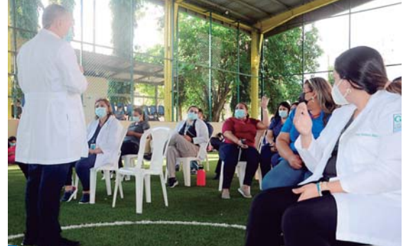
Los pocos nombramientos que se han hecho, son más de lo mismo dijo Flores.

El exviceministro de Salud, Roberto Cosenza, señaló ayer que aplicar la quinta dosis no es una solución, ante el incremento de casos de COVID-19, indicó que el país debe definir una estrategia contra la pandemia y no solo aprobar la aplicación de una quinta dosis de la vacuna.