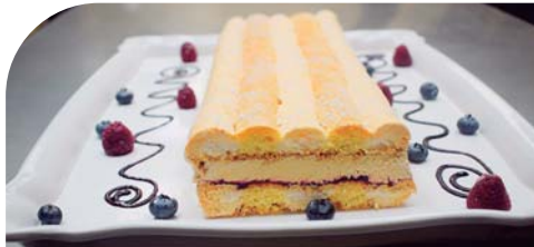
Cardenal, es un postre de Viena, elaborado con merengue, dedos de señorita, crema de vainilla, café y jalea de frambuesa.