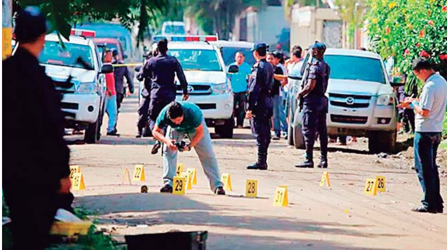
Mientras tanto, hasta noviembre, el Observatorio de la Violencia de la Universidad Nacional Autónoma de Honduras había registrado la muerte violenta de 273 mujeres.