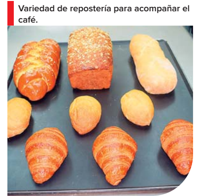
Variedad de repostería para acompañar el café.