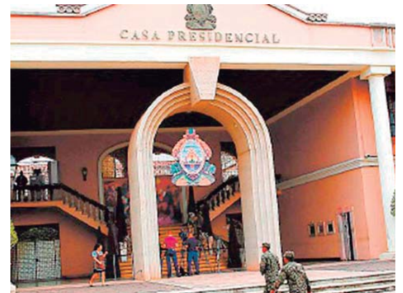
La Casa Presidencial si podrá hacer compras directas por seguridad nacional.

Este decreto permite a la administración presidencial omitir los procesos de licitación pública y privada para así poder contratar empresas o personas a discreción, pero no deja claro si los proveedores tendrán que cumplir con los requisitos estipulados en la Ley de Contrataciones del Estado.