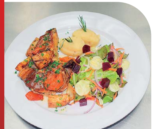
Chuleta de cerdo horneada con puré de papas y ensalada.