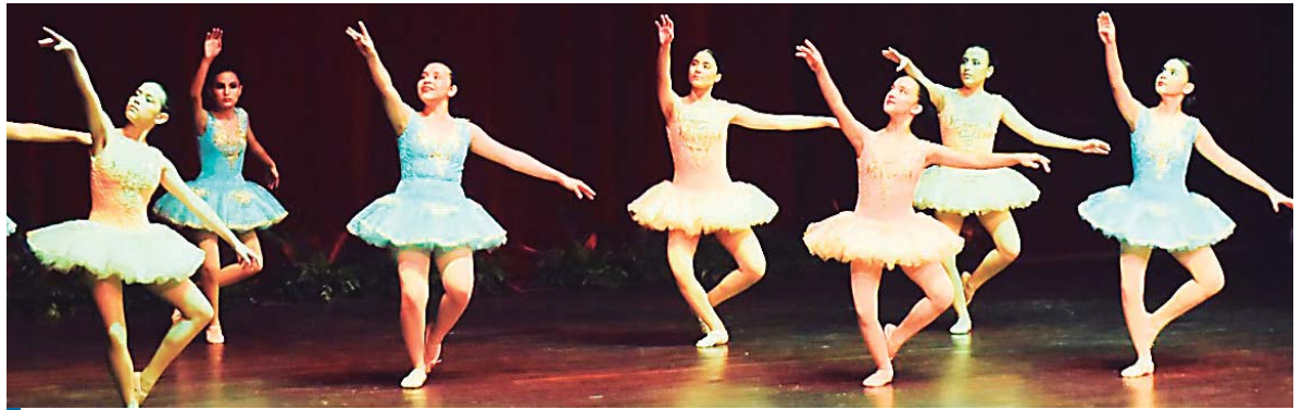
Integrantes del Centro Contemporáneo de Danza durante una presentación en el Teatro José Francisco Saybe realizada en el marco de su 25 aniversario, hoy, en la ciudad de San Pedro Sula (Honduras).