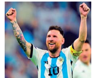
Messi no solo se limita al Mundial en las marcas para la historia con Argentina.

"Al final, lo que queremos es lo otro (ser campeón del mundo con Argentina). Está bien todo esto, pero lo importante es poder conseguir el objetivo grupal, que es lo