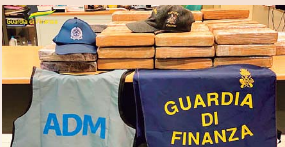
La Guardia de Finanza italiana aseguró un total de 62 fardos de cocaína.

ROMA, EFE. La Guardia de Finanza italiana incautó un cargamento de 72 kilos de cocaína pura, procedente de Ecuador, la droga iba oculta entre cajas de bananas, en el puerto romano de Civitavecchia que de haberse vendido habría alcanzado un valor de 7 millones de euros en el mercado.