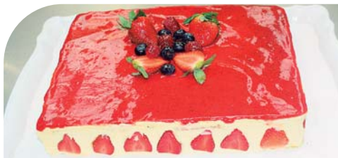
Pastel típico de Francia, su nombre es Fraisier y está elaborado con crema de vainilla y jalea de fresas.