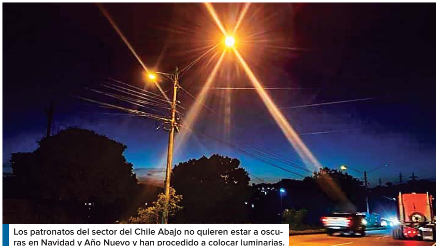
Los patronatos del sector del Chile Abajo no quieren estar a oscuras en Navidad y Año Nuevo y han procedido a colocar luminarias.