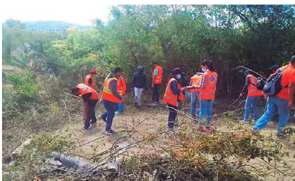
Personal de Protección Humanitaria de Copeco realiza limpieza en el proyecto habitacional Ciudad Mateo, para su habilitación como un asentamiento humano.

El ejecutivo de Injupemp recordó que, “Arturo Tróchez, je-