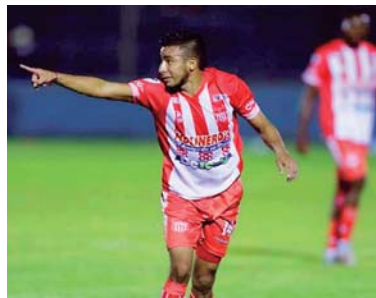
El talentoso lateral derecho de los rojos estará jugando en el Real España el próximo torneo.