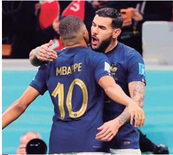
Abrazo de agradecimiento de Theo con Mbappé, quien hizo el esfuerzo en la jugada.