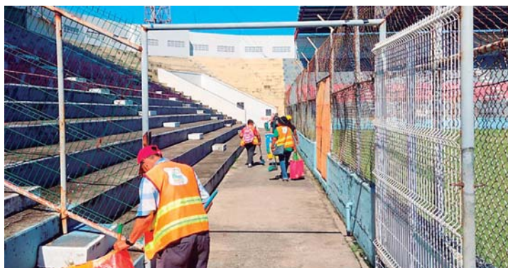
La alcaldía de La Ceiba habilitó una cuadrilla de empleados para asear el Estadio Ceibeño.

SANPEDROSULA. — Tras muchos "estira y encoge", además de las múltiples negativas del Motagua por viajar hasta La Ceiba para jugar la gran final y el Olimpia agotando los procesos legales para que les habilitaran cualquiera de los estadios sampegranos, la gran final de este sábado se jugará en el Estadio Ceibeño.