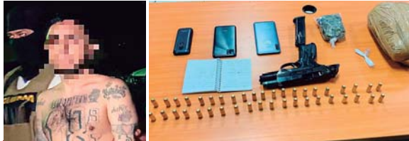
Alias “Dexter” ya había sido apresado en el 2011 por los delitos de homicidio, atentado y portación ilegal de armas.

El apresado es conocido en el mundo criminal con el alias de “Dexter”; según información de los agentes, supuestamente sería un miembro de alto rango de la Pandilla 18.