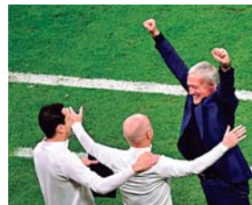
Deschamps, de 54 años, destacó la actuación de su equipo al clasificarse a una nueva final.

DOHA. El seleccionador francés, Didier Deschamps, celebró la clasificación de Francia a la final del Mundial de Catar, aunque aseguró que aún les falta dar un paso más: conquistar el título ante la Argentina de Lionel Messi. “Hay una emoción, un orgullo. Obviamente fue un paso importante, pero falta uno más. Esta-