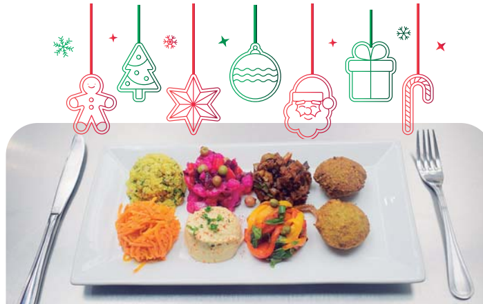
Plato vegetariano que incluye: quinoa, zanahoria, hummus, ensalada de remolacha, falafel, peperonata y caponata de berenjena.