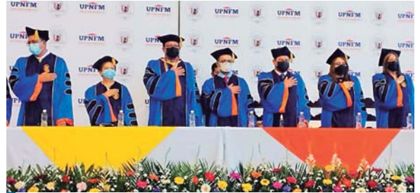
La UPNFM es la única alma máter especializada en la formación de docentes de la región centroamericana.

La ceremonia incluyó la entrega de los reconocimientos a la excelencia académica Summa Cum Laude, Magna Cum Laude y Cum Laude a los destacados estudiantes de pregrado y postgrado que destacaron a lo largo de su formación.