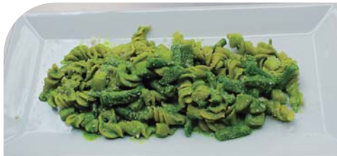
Pasta fusilli con salsa pesto hecha en casa, papa y habichuelas.