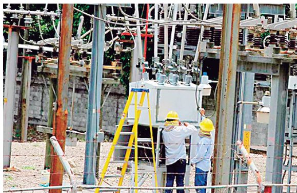
Con los recursos económicos que ahora cuentan el país van a mejorar el desempeño operativo y financiero del subsector eléctrico.

Mejorarán el desempeño operativo y financiero del subsector eléctrico, actividades que están alineadas con los objetivos del Gobierno.