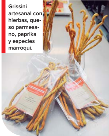
Grissini artesanal con hierbas, queso parmesano, paprika y especias marroquí.