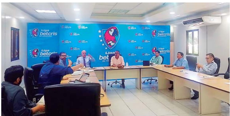
La Liga Nacional se reunió por horas para ratificar a La Ceiba como escenario de la final del Apertura.