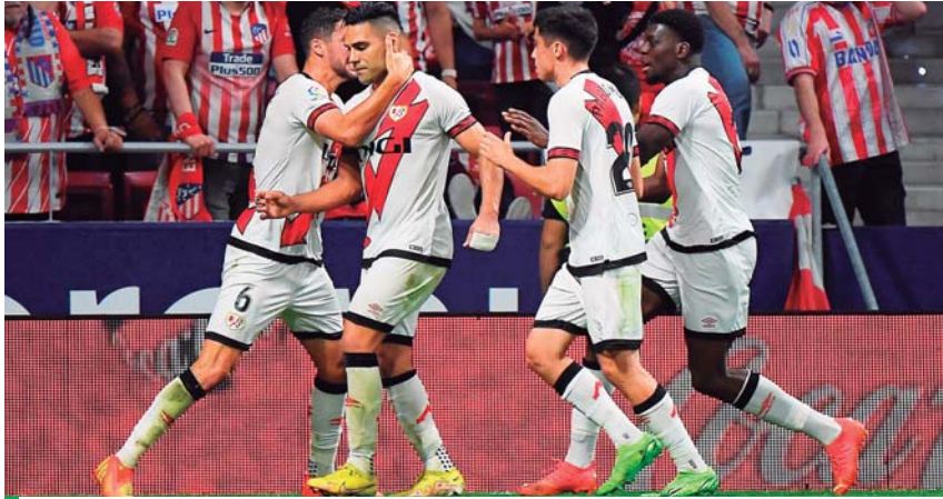
El colombiano Falcao sorprendió al Atlético.