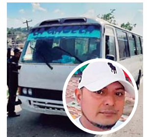
El motorista de este bus también fue ultimado a disparos.

CHOLOMA. Un motorista de bus y un taxista fueron asesinados ayer en distintos sectores del municipio de Choloma.