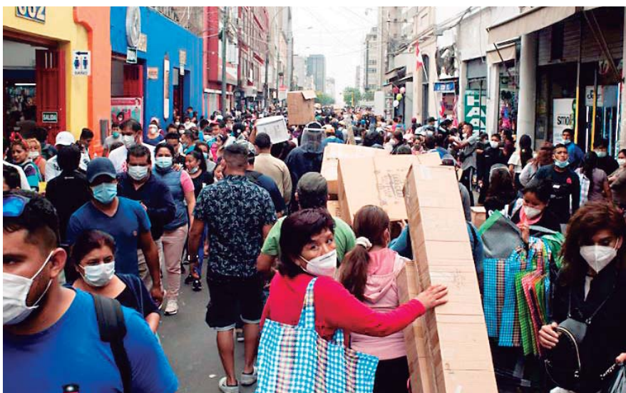
La temporada navideña es una época en la que se incrementan las contrataciones por hora o temporales.