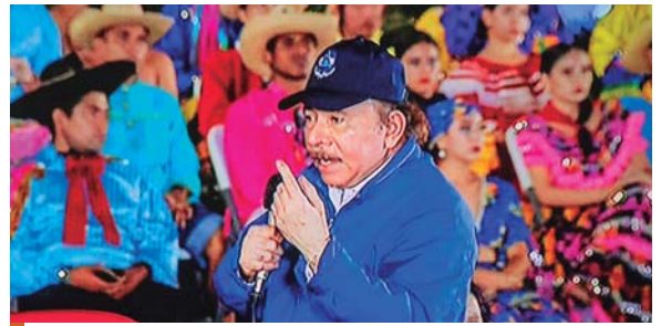
El presidente de Nicaragua, Daniel Ortega, en sus mandatos ha tomado decisiones que han dejado huellas en otros países.

Nicaragua atraviesa una crisis política y social desde abril de 2018, que se ha acentuado tras las controvertidas elecciones generales del pasado 7 de noviembre, en las que Ortega fue reelegido para un quinto mandato, esto ha desencadenado diversas situaciones dentro de su país.