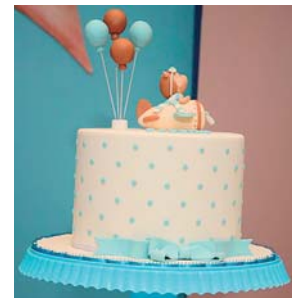
El tierno pastel de la celebración reflejaba los buenos deseos para la futura mamá.