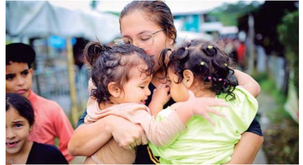
Hombres, mujeres y niños sufren en el Darién, muchos presentan enfermedades debido a la situación en la que viven.

La jefa del Comando Sur de Estados Unidos, Laura Richardson, cerró ayer una visita a Panamá con una gira por la provincia del Darién, la selva fronteriza con Colombia por la que están entrando decenas de miles de migrantes que viajan hacia EE.UU., en la que afirmó que ambos países seguirán trabajando ante los desafíos de la migración y el crimen organizado.