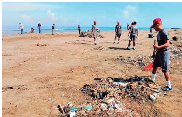
Con rastrillos en mano, los voluntarios emprendieron su labor.

Además, se trabaja en los ríos para identificar de dónde proceden los