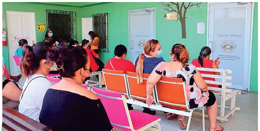
La Liga Contra el Cáncer atiende diferentes tipos de cáncer, los pacientes acuden de todas partes del país.

“Cuando se encuentra algo que no está bien, se acude al médico, entonces algunas veces podemos presentar un pequeño bulto o podemos presentar también alguna una adenopatía en la axila y algunas veces cuando ya está un poco más avanzado siempre este bultito que era pequeño se puede hacer un poco más grande y le deforma un poco la mama, puede haber cambios de coloración y dolor”, subrayó