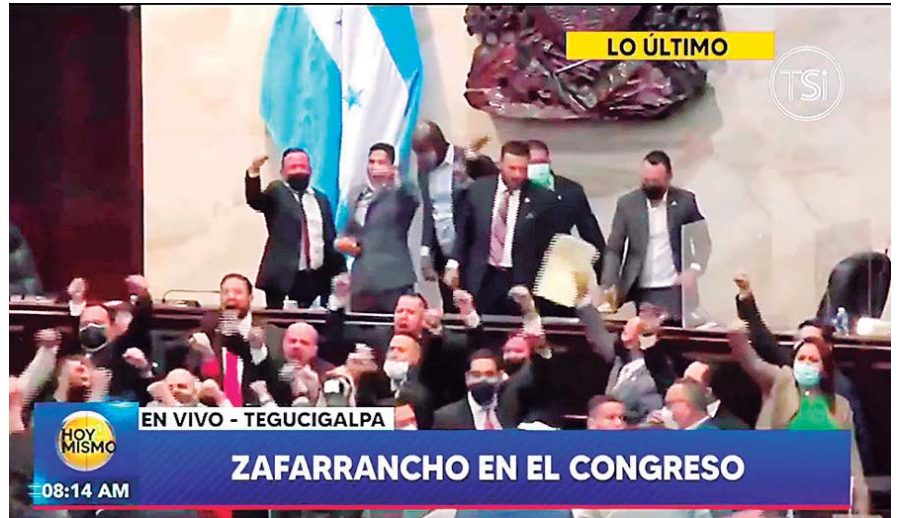
Foto de archivo del zafarrancho que se dio previo a la elección de la Junta Directiva del Congreso Nacional.

Afirmó que están en la disposición de poder ayudarles para que