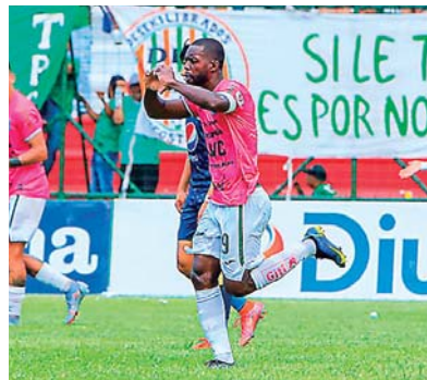
Real España llega motivado tras haber vencido 4-1 a Victoria.