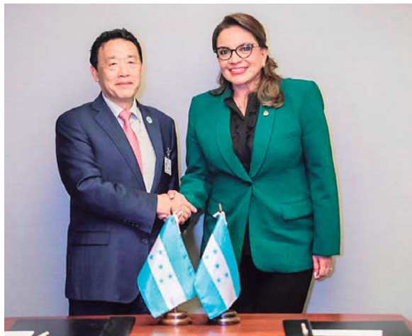
La presidente de Honduras, Xiomara Castro, y el director general de la Organización de las Naciones Unidas para la Alimentación y la Agricultura (FAO), QU Dongyu.