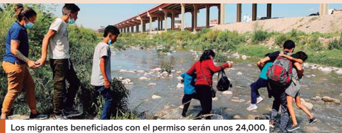
Los migrantes beneficiados con el permiso serán unos 24,000.

WASHINGTON, EFE. Estados Unidos inició ayer el proceso de solicitudes para acceder a los 24,000 permisos migratorios temporales para venezolanos, como parte del pacto cerrado con México para reducir los cruces de migrantes en la frontera. “Esperamos que este esfuerzo reduzca los números récord de venezolanos que buscan entrar de manera irregular a Estados Unidos”, explicó el Departamento de Seguridad Nacional (DHS).