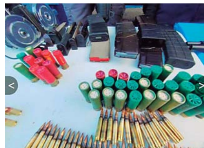
Armas de grueso calibre fueron incautadas en el operativo de ayer.

Elementos de la Dirección Policial Anti Maras y Padillas Contra el Crimen Organizado (Dipampco), la Policía Nacional y Policía Militar participaron en la detención e incautación.