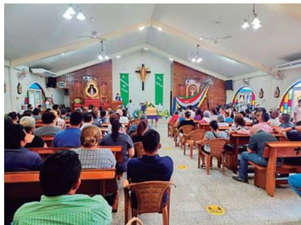
La Misa de Cuerpo Presente se realizó en Parroquia Nuestra Señora de Suyapa.