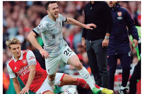
La baja de Jota es un balde de agua fría para Portugal.

nales del Chelsea - Tottenham del mes de agosto (2-2) y no ha vuelto a jugar desde entonces.