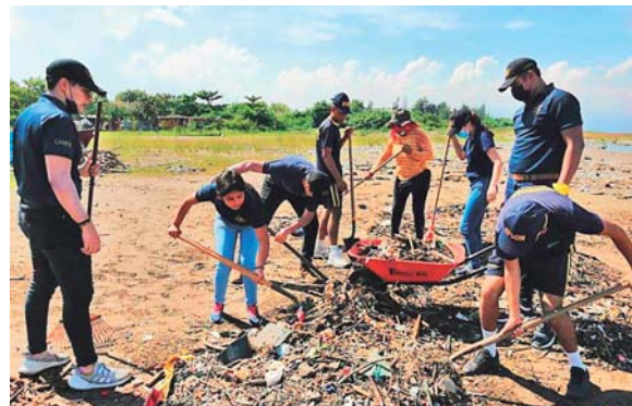
Afanados y con buen tiempo se desarrolló el operativo.

residuos, para contribuir a la modificación de hábitos y comportamientos que producen la contaminación de estos espacios.