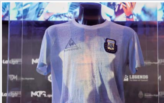
La camiseta mundialista de Maradona.

BUENOS AIRES. La camiseta que utilizó Diego Armando Maradona en la final del Mundial de México 1986, que ganó la Albiceleste, regresó a Argentina tras ser donada por el alemán Lothar Matthaus, su rival en el partido decisivo. “La camiseta utilizada en la final del Mundial 86 por nuestra leyenda Diego Armando Maradona regresó al país. Sí, regresó a la Casa del Fútbol Argentino. Armadura, reliquia y tesoro de uno de nuestros máximos exponentes del fútbol mundial”, informó la Asociación del Fútbol Argentino (AFA) a través de las redes sociales.