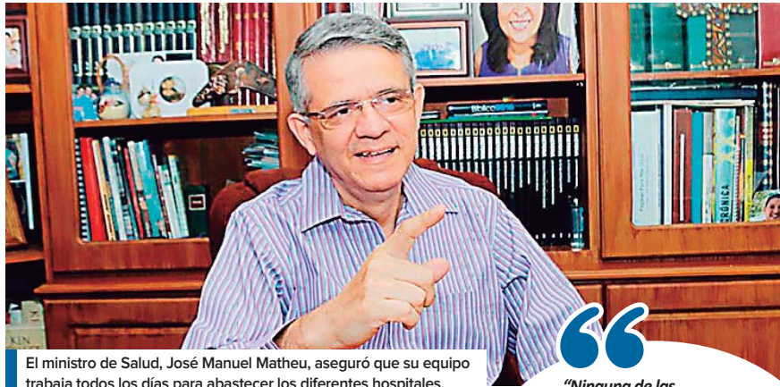
El ministro de Salud, José Manuel Matheu, aseguró que su equipo trabaja todos los días para abastecer los diferentes hospitales.

El funcionario defendió la dotación de medicamentos en la red sanitaria pública y dijo que los directores de los hospitales le reportan hasta un 70% de abastecimiento. Según comentó el funcionario, su equipo trabaja hasta los fines de semana para lograr abastecer los recintos hospitalarios.