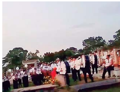
La banda del Perla del Ulúa interpretó notas de ocasión.

lió hacia el cementerio William Hall, donde descansarán sus restos.