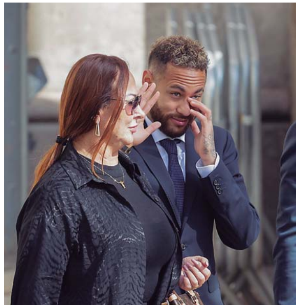
Neymar dejó ayer Barcelona y volvió a París.

“Neymar nunca participa de negociaciones”, ratificó después su padre, quien reveló que el club blanco les envió propuestas desde 2009.