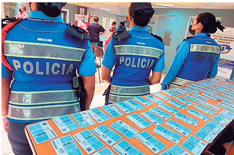
Pese a las advertencias, cientos de conductores continúan manejando bajo los efectos del alcohol.

La Dirección Nacional de Vialidad y Transporte (DNVT) aseguró que estos percances son la segunda causa de muertes violentas en Honduras.