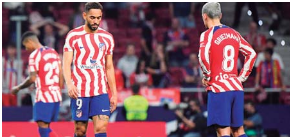
El equipo colchonero dejó escapar dos puntos en casa.

MADRID. El Rayo Vallecano empató 1-1 en el campo del Atlético de Madrid en la 10ª jornada de LaLiga, salvando un punto en el descuento ante los rojiblancos, que se mantienen en el tercer puesto del campeonato español.