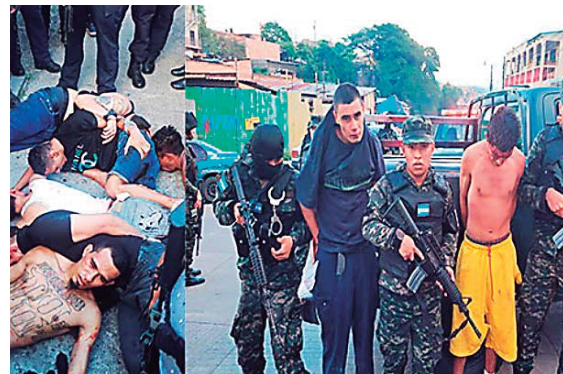
Varios de los detenidos pertenecen a la Pandilla 18, dijo anoche la Policía.