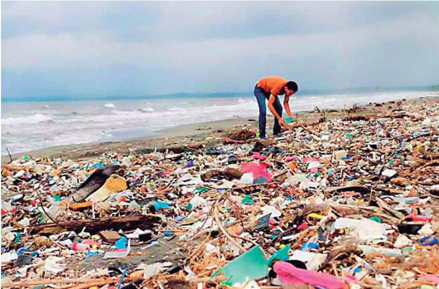
Pese a las advertencias, cientos de conductores continúan manejando bajo los efectos del alcohol.

El Diario La Prensa Libre de Guatemala dedicó un amplio reportaje sobre la contaminación de desechos que genera Guatemala por la cuenca del río Motagua y que inunda nuestras riberas del Golfo de Honduras, especialmente sobre las playas de Puerto Cortés, Omoa y Roatán. El diario chapín analiza con expertos los diferentes escenarios a darse en caso que Honduras se atreviera a reclamar a Guatemala. Aunque no lo dicen, es evidente la pachorra de nuestras autoridades frente a este problema ambiental que genera daño y pérdidas a varios municipios, a pesar de tener “materia jurídica para emprender un proceso de demanda contra el Estado de Guatemala”, como dice el diario Prensa Libre.