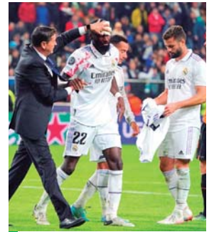
Antonio Rüdiger recibió un duro golpe el pasado martes.

Este le ocasionó una rotura de mandíbula por la que solo paró un encuentro. Menos de diez días después de la lesión, el central alemán ya estaba listo para jugar los 90 minutos de