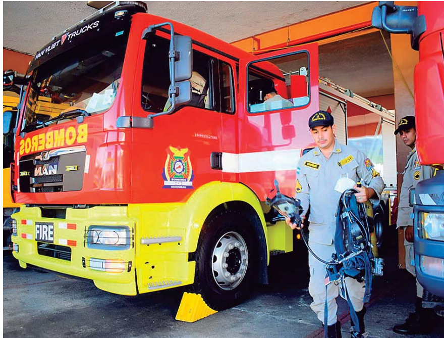
Unidades contra incendios, equipo de protección personal, lanchas, motores, chalecos salvavidas, cascos de rescate, entre otros insumos, son los que urgen en la estación de Bomberos.

“También compraríamos equipo de protección personal, autocontenido que son los cilindros que anda el bombero para poder ingresar a las estructuras respirando, lanchas, motores, chalecos salvavidas, cascos de resca-