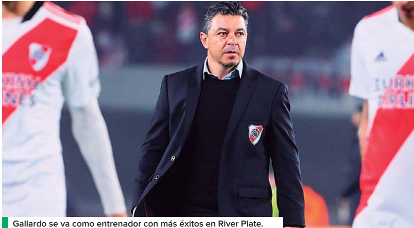
Gallardo se va como entrenador con más éxitos en River Plate.