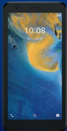
ZTE A31 Lite