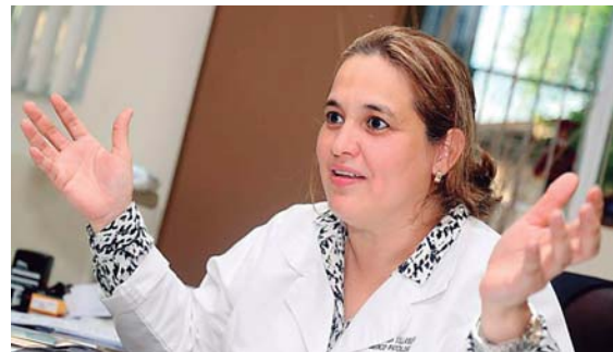
Viceministra de Seguridad, Julissa Villanueva.

El defensor de derechos humanos cuestionó por qué uno de estos cuatro reos que se fugaron estaba recluido en la cárcel de Siria y no en otro reclusorio de máxima seguridad.