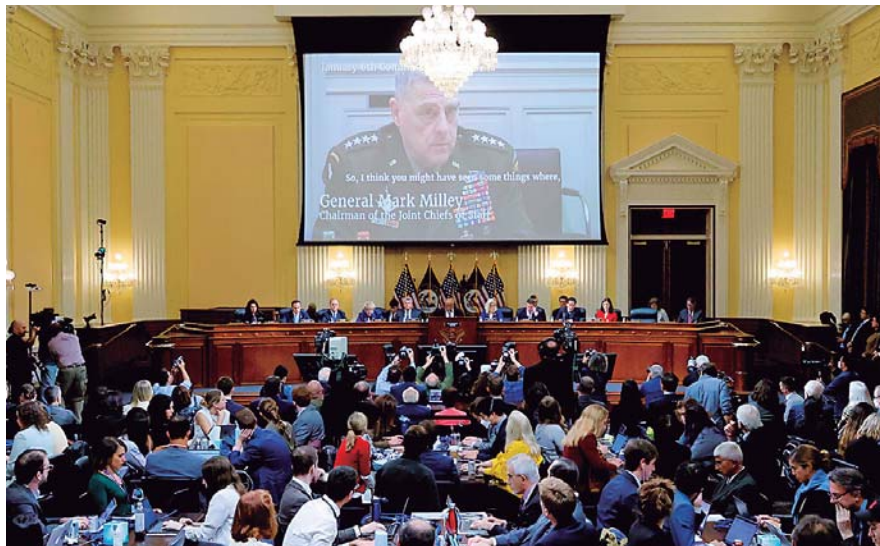
Ayer se realizó la novena audiencia pública del comité de la Cámara de Representantes.

Entre la noche del 4 de noviembre y la madrugada del 5 de noviembre de 2020, Trump declaró su victoria en las elecciones presidenciales, pese a que aún no había finalizado el conteo de votos, muchos de los cua-