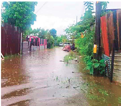
Buscarle una nueva salida al macro canal de la 7 avenida por el sector de El Faro.