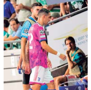
No está en peligro la presencia de Ángel Di María, no juega la Copa del Mundo.

Di María fue sustituido el martes debido a su lesión a los 23 minutos del duelo que su equipo perdió en Haifa.