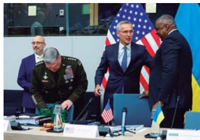
El jefe de Estado Mayor del Ejército de EE.UU., Mark A. Milley, el secretario de Defensa de EE.UU., Lloyd J. Austin III, el secretario general de la OTAN, Jens Stoltenberg y el ministro de Defensa de Ucrania, Oleksii Reznikov.

“Sin embargo, la admisión de Ucrania en la OTAN otorgaría a esta participación de modo automático una nueva cualidad, ya que implicaría el artículo quinto (sobre de-