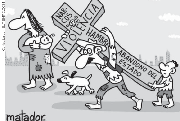
Caricaturas - ELTIEMPO.COM

Somos un medio veraz, objetivo y profesional, que entrega a diario contenido informativo. Nos dedicamos a buscar la noticia con pasión para llevarla hasta sus hogares a través de nuestro medio escrito, con el profesionalismo, objetividad, imparcialidad y orientada desde una perspectiva que resalte los valores humanos, profesionales y la mejor visión de nuestro país. Brindamos a nuestros anunciantes un espacio rentable para promover sus productos y servicios.