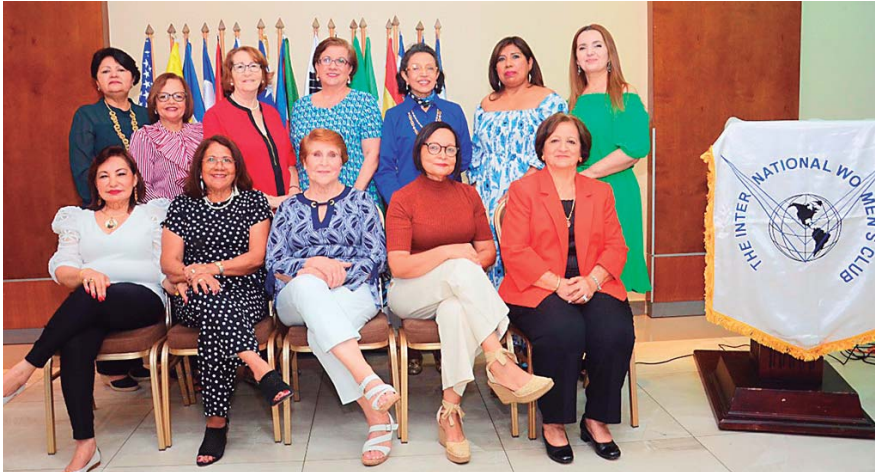
Las apreciadas damas del Club Internacional de Mujeres posaron para el lente de Diario EL PAÍS.

SAN PEDRO SULA. Las apreciadas damas del Club Internacional de Mujeres festejaron su tradicional té mensual para dar inicio a las actividades de ayuda de la organización luego de dos años inactividad por la situación sanitaria que se ha dado a nivel mundial.