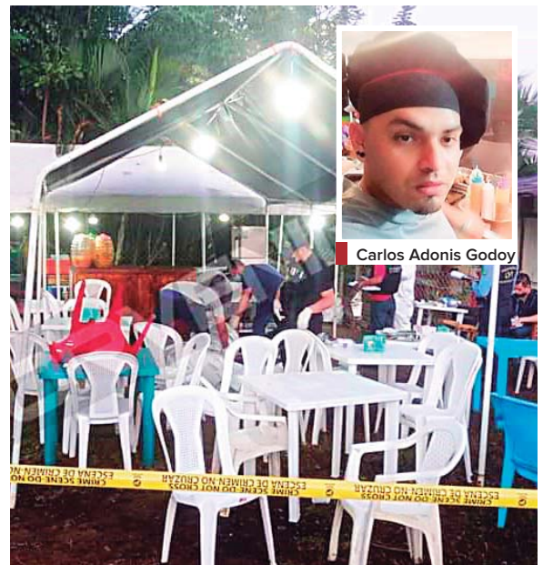
Hasta el momento se desconoce el móvil que dejó las tres víctimas en la zona.

Según informaron, los dos desconocidos fueron contratados por Godoy para hacer una zanja, únicamente por ese día, dinero que les serviría para continuar su viaje, ya que iban rumbo a Estados Unidos.