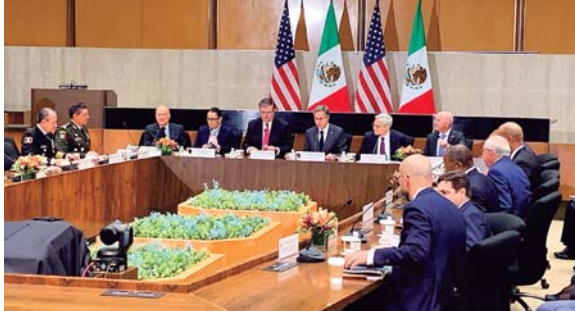
El secretario de Seguridad Nacional de EUA, Alejandro Mayorkas se reunió el canciller mexicano, Marcelo Ebrard, y otros funcionarios de ambos países.

El secretario de Seguridad Nacional afirmó que los migrantes que atraviesan