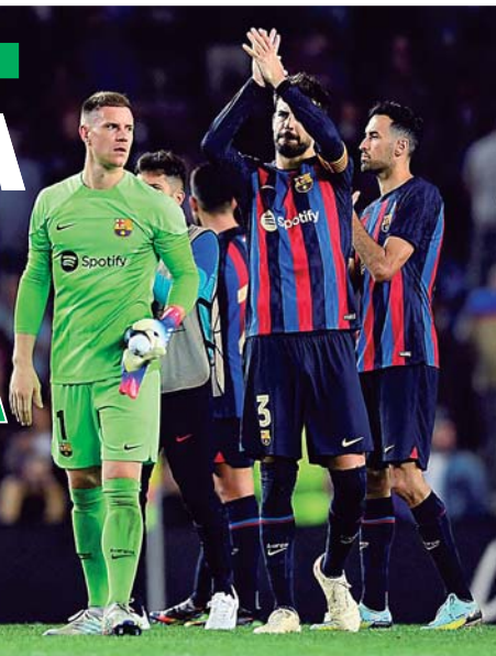
La temporada pasada la eliminación del Barcelona fue un duro golpe también.

“Con los fichajes que hemos hecho, debemos aspirar a algo mejor”, Sergio Busquets.