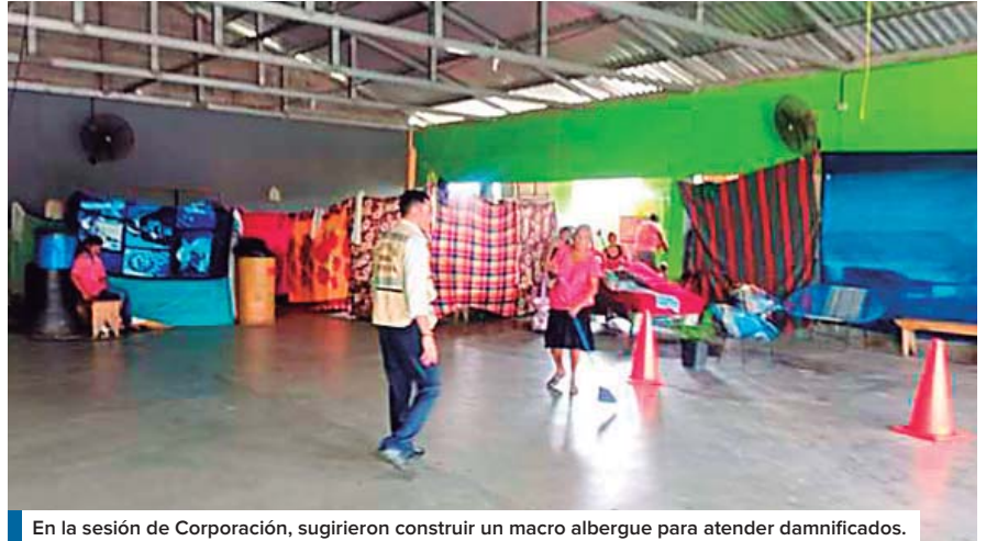
En la sesión de Corporación, sugirieron construir un macro albergue para atender damnificados.

La sesión extraordinaria de la Corporación Municipal también aprobó la compra de 10 vehículos para el próximo año, así como un par de camiones para evacuar a los pobladores cuando las circunstancias lo requieran.