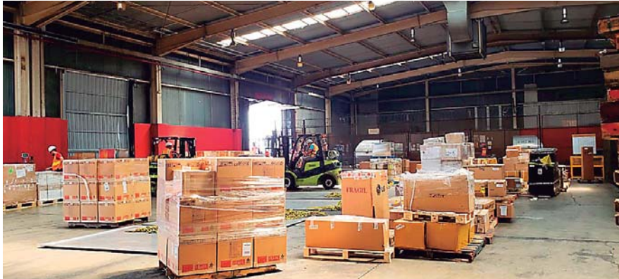
Las autoridades han decomisado cigarrillos, bebidas alcohólicas, decomiso de armas, más de 4 mil municiones en una encomienda en San Pedro Sula.