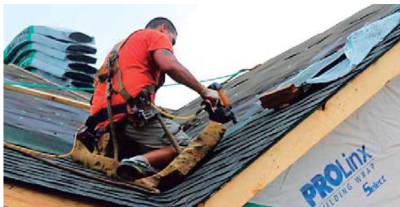
El canciller Enrique Reina dijo que son mecanismos positivos de migración regular que beneficiarán a Honduras.

El canciller, Enrique Reina, agradeció al gobierno de Estados Unidos la decisión. "Recibimos con beneplácito el anuncio de @DHSgov de los EEUU de incrementar en 64,716 las visas #H2B destinadas a ciudadanía de Honduras, Guatemala y El Salvador con programas de migración circular temporal. Son mecanismos posi-