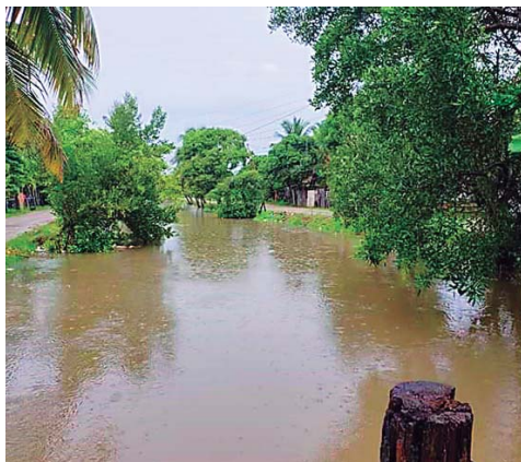
Las zonas inundables van a ser controladas de manera efectiva.