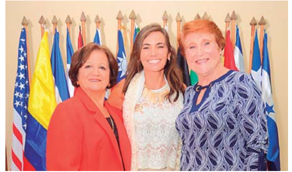
Las apreciadas damas compartieron una linda tarde luego de mucho tiempo de no compartir juntas.

Cabe mencionar que el Club Internacional de Mujeres es caracterizado por brindar apoyo a los sectores más necesitados en varias regiones del país y la actividad con la iniciarán en esta ocasión será una celebración a los niños en la aldea El Porvenir, en Siguatepeque, en las próximas fechas.