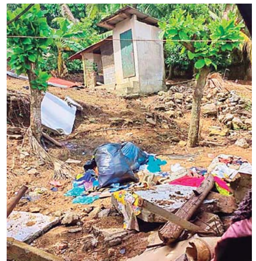
La Corporación también prohibió la construcción en zonas vulnerables de Puerto Cortés.