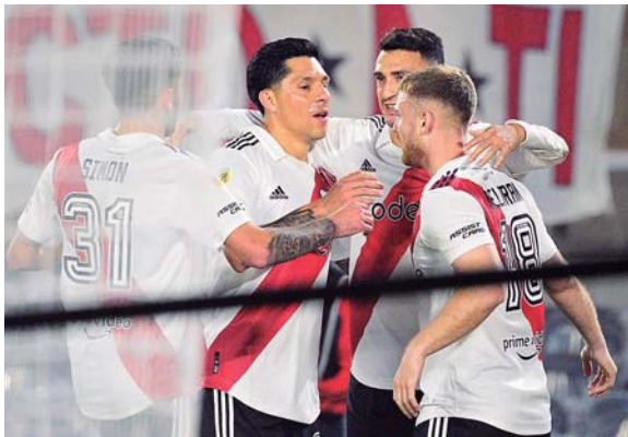
El equipo millonario vivió una época de oro con Gallardo.

Con 44 puntos, River escolta al líder Boca Juniors, con 48 unidades y un partido menos, en la Li-