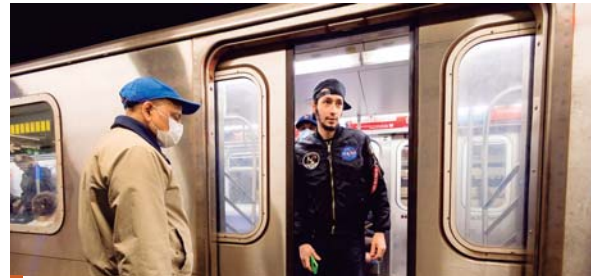
La extensión de la declaración de emergencia lleva en vigor desde enero de 2020.

Un grupo de 17 legisladores de la Cámara de Representantes escribieron una carta pidiendo a Biden acabar con la medida y un senador republicano introdujo una resolución para que la Cámara Alta vote sobre lo mismo.