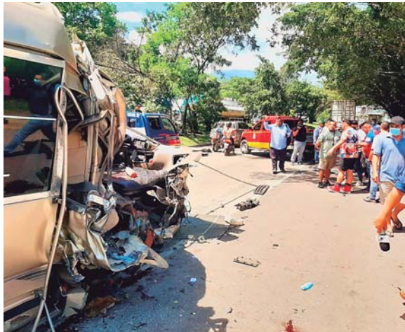
Los lugareños de la zona donde ocurrió el accidente se acercaron para apoyar a los heridos que pedían auxilio.