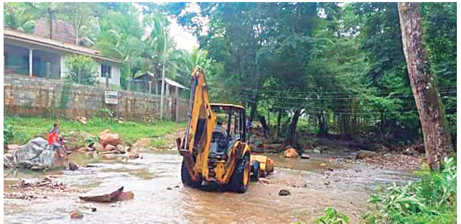
Dragado y construcción de bordos es una prioridad inmediata establecieron en la sesión de Corporación Municipal.