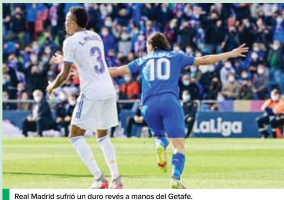
Real Madrid sufrió un duro revés a manos del Getafe.

Con un equipo plagado de jóvenes, Barcelona venció al Mallorca. Con este triunfo, el Barça se sitúa en la quinta posición con 31 puntos, a solo uno de las posiciones de Champions. Triunfo muy meritorio de los de Xavi, que llegaban a Mallorca con 16 bajas. Sufrieron, pero acabaron sumando los 3 puntos.