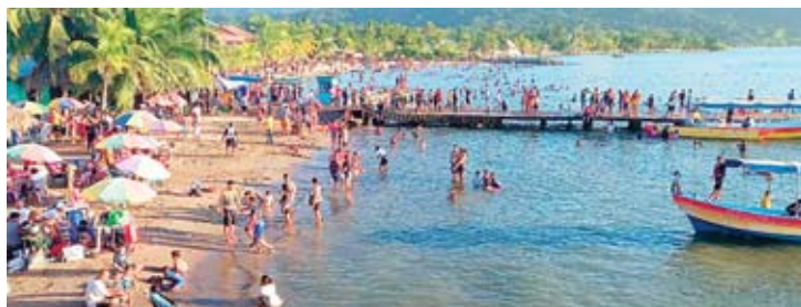
Los bañistas, como es tradición, llegaron a las playas para pasar un buen tiempo en familia.

La preferencia por estas playas se debe a que el sector restaurantero y las autoridades le han apostado este año a reinventarse dentro de la economía ofreciendo productos de buena calidad y un