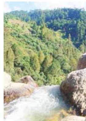
Las autoridades esperan continuar durante este año 2022, la protección del pulmón que tienen en la zona.

Esta cordillera es una extensa y angosta prolongación montañosa de 50 km de largo y 5 km de ancho, conformada por las siguientes montañas y cerros: Cerro Azul, Montaña de Joconal, Montaña de Cangual, Montaña Granadillo y Montaña de Pacaya.