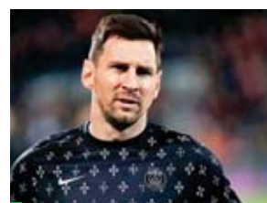
Messi se mantendrá en Argentina hasta dar negativo.