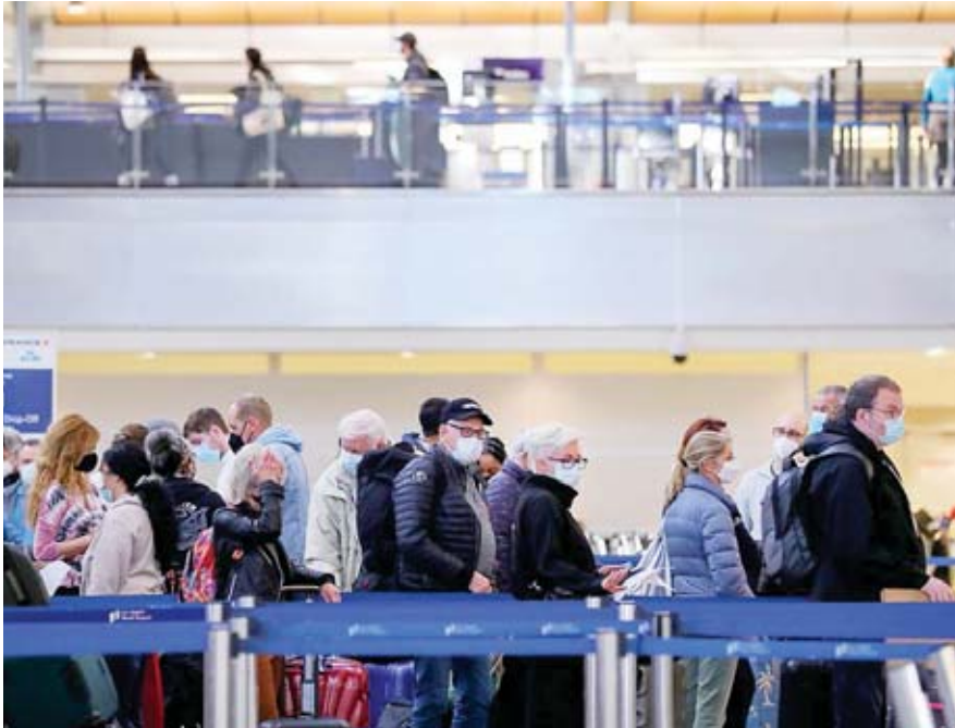
Pasajeros a la espera de facturar sus vuelos en la Terminal Internacional Tom Bradley del Aeropuerto Internacional de Los Ángeles.