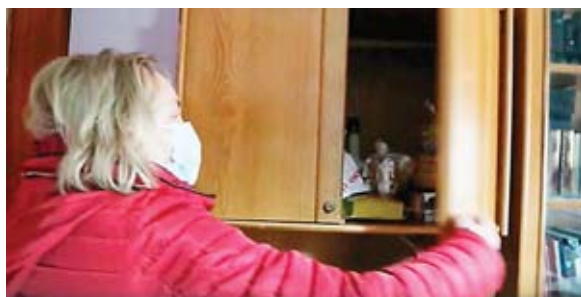
Una voluntaria abre la portezuela de un armario, la cual tiene un chip que manda una señal al abrirla y cerrarla.

que una mujer mayor besa todos los días al acostarse y al levantarse.