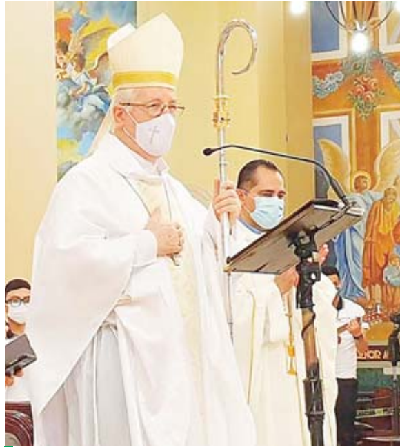
El obispo de la Diócesis de San Pedro Sula, monseñor Ángel Garachana Pérez.

El obispo dijo que San Mateo explica que estos sabios de oriente eran paganos gentiles para el pueblo de Israel, ya que así eran llamados los que no pertenecían a su raza y a su pueblo, no obstante, es-