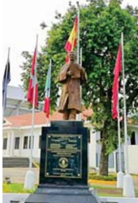
El monumento de José Cecilio del Valle es una escultura en pie, diseño clásico en bronce de 2 metros de altura.

En alusión a este evento, indicó que desde inicios del presente año se aprobó el programa del