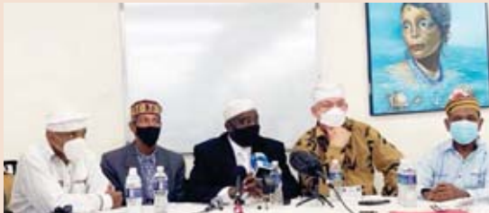
Las predicciones fueron presentadas a la prensa en la Asociación Cultural Yoruba de Cuba.

Las indicaciones resuenan tras un año marcado por la pandemia y el cierre de los colegios por el coronavirus, pero también de las protestas sociales y la polarización política. Los sacerdotes piden además "establecer acuerdos favorables sobre políticas migratorias para