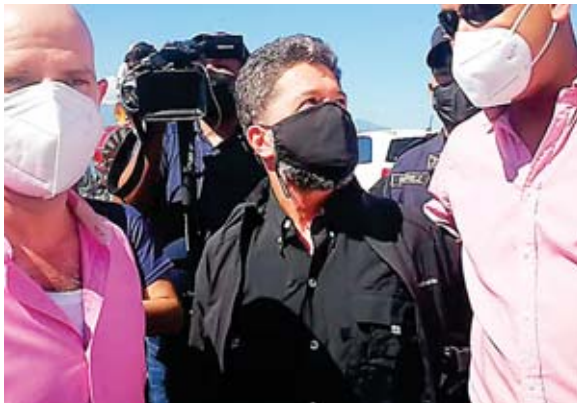
El general (r) Sabillón Pineda retornó ayer al país después de cinco años de estar exiliado en los EE.UU.

Sabillón Pineda ingresó por la terminal aérea sampedrana Ramón Villeda Morales, donde lo esperaba parte del equipo de transición del Gobierno electo de Xiomara Castro, entre ellos el empresario Pedro