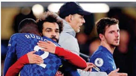
Ambos clubes se terminaron dando un abrazo, pero dejan escapar al City.