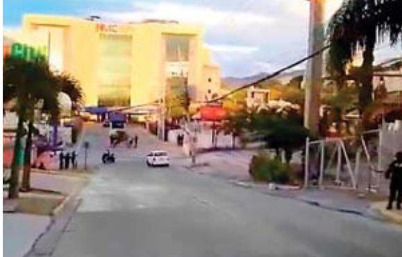
Avilez fue intervenido quirúrgicamente el 17 de diciembre.

La presencia de los agentes de la Policía Militar del Orden Público (PMOP) ha alarmado a los ciudadanos que circulan por el lugar, quienes ya han su-