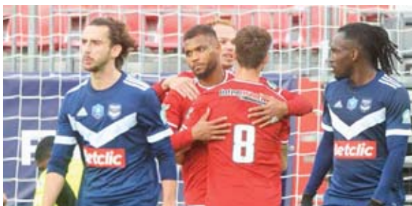
Brest terminó celebrando, Girondis recibió una paliza dolorosa.

Pese a siete casos de COVID-19 en su plantel, el Mónaco evitó un resbalón en su partido y ganó 3-1 en el terreno del Quevilly, de la segunda división.