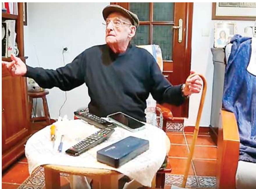
Uno de los participantes en el programa conversa frente a una mesa con varios dispositivos que tienen chips. Al manipularlos se activan.

Los chips se han instalado también en andadores, un rosario o el portarretratos de la foto