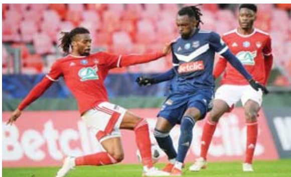
Alberth Elis fue titular con el Burdeos, pero tantas bajas les terminó golpeando.

Un penal de Wissam Ben Yedder y un doblete de Kevin Volland clasificaron al equipo del Principado, bajo la atenta mirada desde la grada del hombre que parece su futuro entrenador, el belga Philippe Clement.