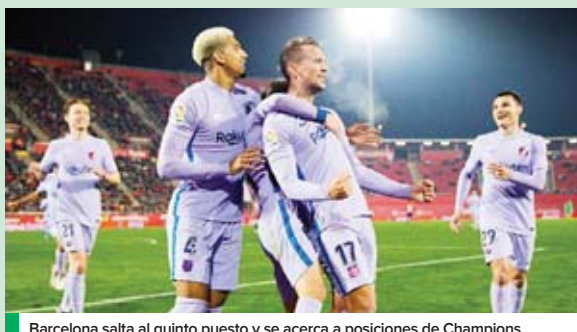
Barcelona salta al quinto puesto y se acerca a posiciones de Champions.