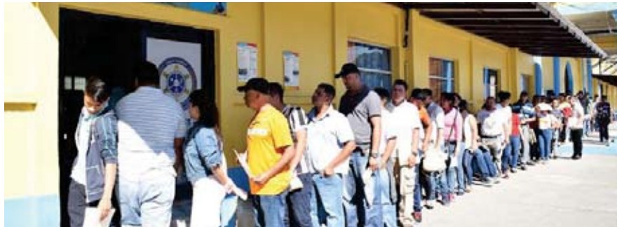
Los mayores de 25 podrán hacer este proceso ya sea vía internet o presencial y con el mismo costo de 200 lempiras.

Para los interesados, la institución policial puso a disposición una plataforma web, específicamente www.serviciospoliciales.gob.hn en donde todas las personas podrán solicitar sus anteceden-