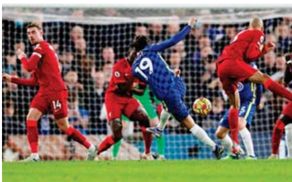
Tanto Chelsea y Liverpool animaron el 2022 con buen fútbol y goles.

En el 42', el croata Mateo Kovacic acortó la desventaja con una volea y en el 45'+1' el estadounidense Christian Pulisic puso el 2-2 definitivo, asistido por N'Golo Kanté.