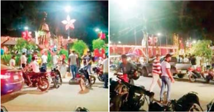
A sabiendas que las personas se relajarían para las festividades, Salud previó un aumento de casos de COVID-19 para las próximas semanas.

OLANCHITO, YORO. Pese a que las autoridades recomendaron celebrar las fiestas decembrinas y el recibimiento de año nuevo de manera prudente con las medidas de bioseguridad y sin exposición a la aglomeración de personas, cientos de ciudadanos hicieron caso omiso y se aglomeraron en el parque central de esta ciudad durante la noche del 31 de diciembre pasado.