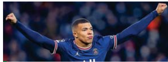
Mbappé es libre y puede escoger seguir en el PSG o no.

Los brasileños Alisson Becker y Roberto Firmino, y el defensa alemán Joel Matip, fueron descartados por el Liverpool al dar positivo en coronavirus.