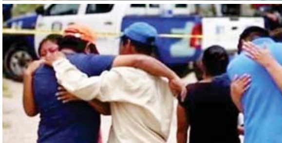
El hecho ocurrió debido a una discusión bajo los efectos del alcohol.

pos de la Dirección Policial de Investigaciones (DPI) iniciaron con las labores de búsqueda en los centros asistenciales cercanos hasta dar con su paradero.