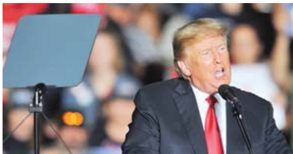
De enfrentar una acusación, Trump podría ver afectadas sus aspiraciones políticas futuras.

El "Selecto Comité para Investigar el Ataque del 6 de Enero al Capitolio