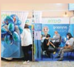
Israel ha comenzado a aplicar una cuarta dosis.

gripe y de Covid-19 a la vez preocupa por el elevado riesgo para la población, sobre todo vulnerable, ya que las dos enfermedades afectan al sistema respiratorio superior, alertan los expertos.