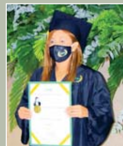
Los graduandos posaron con sus títulos universitarios, dejando lindos recuerdos por su gran logro.