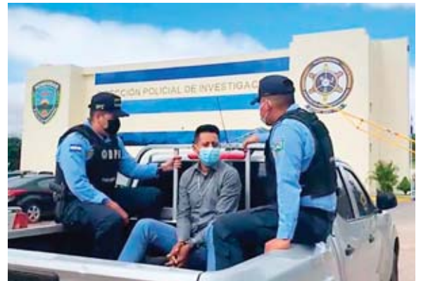
El detenido fue puesto ante las autoridades competentes para que se proceda conforme a ley corresponde.

acuerdo con investigaciones técnicas de la Unidad Especial Contra Delitos Electorales del Ministerio Público y testimonios de algunos testigos, estas personas, adulterarían actas para favorecer a