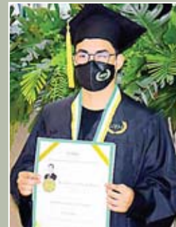
Uno de los graduandos durante el recibimiento de su título universitario.

Los ahora profesionales se mostraron muy contentos por el nuevo logro estudiantil en sus vidas y con muchas metas más por cumplir.