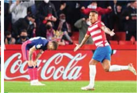
El Atlético de Madrid sufrió su cuarta derrota consecutiva ante el Granada.