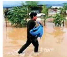
Un habitante de las zonas en riesgo decidió salir solamente con una mochila en la que llevaba pocas pertenencias.

Copeco llegó ayer en horas de la tarde con ayuda humanitaria para