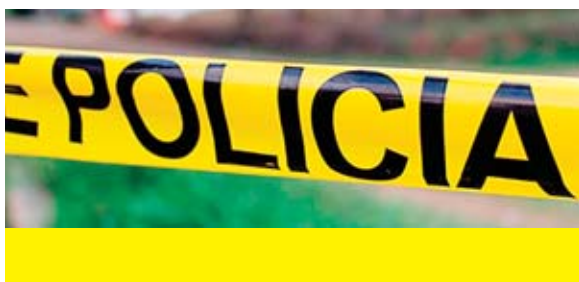
La víctima quedó recostada sobre una acera.

Los testigos llamaron al Sistema 911, lo que permitió la llegada de una ambulancia con paramédicos de la Cruz Roja, pero estos certificaron que el vigilante ya no tenía signos vitales.