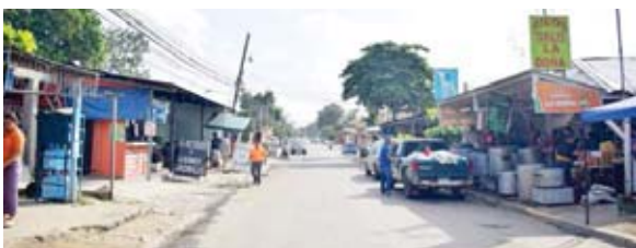
Esta famosa cuadra está ubicada en la colonia Luz del Mundo 7 calle, entre la 19 y 20 avenida. Tiene más de 30 años de funcionar.