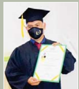
Los nuevos profesionales compartieron su especial logro junto a sus familiares.