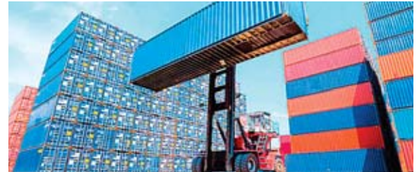
Las exportaciones de mercancías generales de Honduras a Taiwán han crecido desde el año 2015.

La Decisión No. 17 se refiere a la modificación de conformidad con el tratamiento arancelario para 25 productos, incluidos preparaciones y