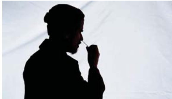
El porcentaje de detecciones de la variante ómicron en sus secuencias ha subido del 0.1% de hace una semana al 1.6% en la actualidad.

manal, la OMS insiste en que no hay todavía datos sobre si ómicron produce casos más o menos graves de COVID-19, aunque el aumento de las hospitalizaciones en países donde su pre-