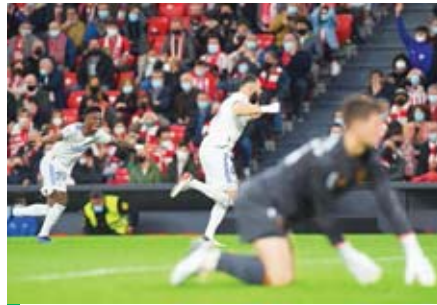
Con un doblete de Benzemá, el Real Madrid derrotó al Athletic de Bilbao.

decide si como directivo o técnico. Antes de ‘colgar los guantes’, Buffon no descartaría probar suerte en otro continente e incluso, reveló que le parecería interesante jugar en la Liga MX o incluso la MLS.