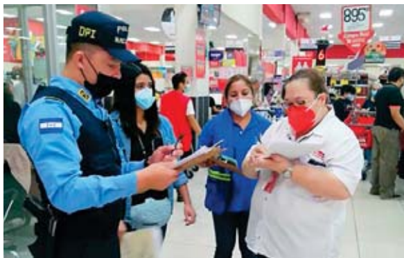
El operativo se está realizando a nivel nacional.

Entre otras cosas se busca hacer respetar el decreto que congela los precios de la canasta básica.