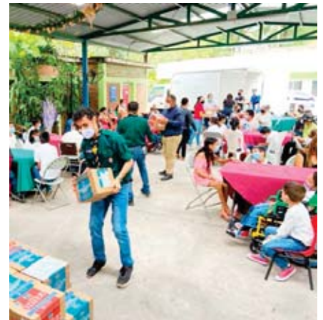
La leche recolectada ya está siendo distribuida.

esta iniciativa beneficia a muchas instituciones que realizan una gran labor social, que ayudan a mejorar la nutrición de grupos vulnerables y mejoran la calidad de vida de las personas. Juntos Sula, Scouts y Tetra Pak logramos sobrepasar la meta que nos habíamos propuesto”, manifestó.