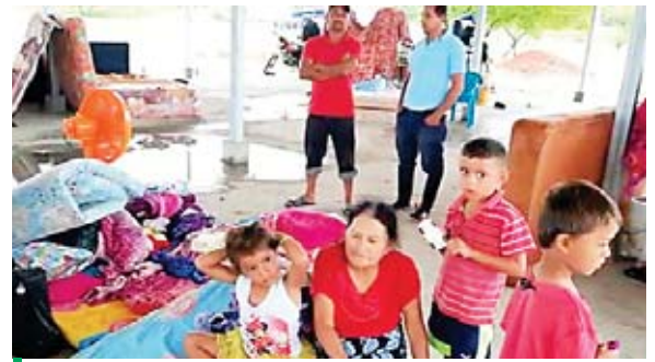
En el grupo de los refugiados se encuentran niños pequeños y adolescentes, quienes descansan a la intemperie.