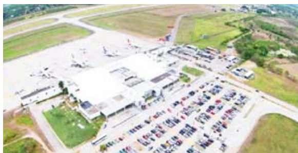
Señalando que este debe ser un instrumento de desarrollo para atraer inversión e impulsar el comercio.

De acuerdo con el comunicado emitido ayer en horas de la tarde, dicha entidad debe estar integrada por actores locales y regionales como la municipalidad sampedrana, CCIC y otras gremiales que comparten el objetivo de par-