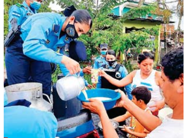
Una de las tareas que más le satisface de su trabajo es servir a los demás.

Sindy se ha destacado por su ardua labor comunitaria, quedando captada en cámaras tras llevarles momentos de alegría a niños y jóvenes en diferentes