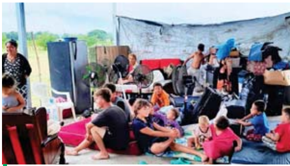
Varias familias se refugiaron en una galera tras haber salido de imprevisto de sus viviendas inundadas.

“En San Pedro Sula no hubo ninguna afectación, pero sí de estas familias que se estarán apoyando mientras estén en los albergues, recibirán ayuda humanitaria que in-