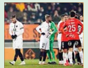
Ramos recibió una tarjeta amarilla en el minuto 81 y la segunda en el 86.

Además, el partido quedará marcado para Ramos, exdefensa del Real Madrid, por ser expulsado por primera vez en Francia después de recibir dos tarjetas amarillas en tan sólo cuatro minutos de juego en el choque.