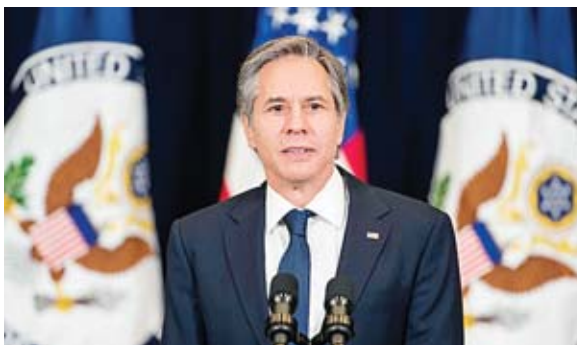
El presidente estadounidense, Joe Biden, envió un memorando dirigido al secretario de Estado, Antony Blinken, y difundido por la Casa Blanca.

Además, Biden instruyó a los representantes de EE.UU. en cada banco multilateral de desarrollo que "voten en contra y hagan todo lo posible para denegar cualquier presta-