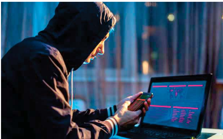
A pesar de los riesgos, una abrumadora mayoría de CFOs aseguró que continuará el traslado de los sistemas financieros o ERP de su negocio a la nube.

La encuesta de Deloitte Global sugiere que, en la construcción de una empresa protegida y avanzada en tecnología, los desafíos más importantes para CIOs y CISOs en la gestión del riesgo cibernético son la transformación/ TI híbrida (41%) y la ciberhigiene (26%). Como resultado, las empresas potencian el Ze-