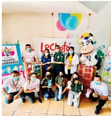
La actividad se llevó a cabo en cinco ciudades.

“Nuestros clientes a nivel nacional donaron un total de 15,160 vasos de leche, por lo que SULA entregó a la Asociación de Scouts de Honduras 15,600 vasos. Sabemos que