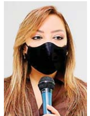
El recuento de candidatos a alcaldes se realizará cuando termine el escrutinio especial.

Barahona también confirmó que, pese a las constantes denuncias sobre la manipulación de actas electorales en el nivel electivo de diputados, en el TJE no tienen en su agenda ninguna impugnación que pertenezca al Congreso Nacional.