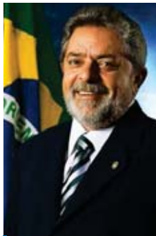
Luiz Inácio Lula da Silva