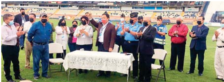
La CONAPID le entregó la comisión de traspaso las llaves del Estadio Nacional para que se comience con el montaje del escenario.

instalaciones, también se indicó que se han hecho las evaluaciones correspondientes para determinar qué áreas no serán habilitadas y dónde serán ubicados los asistentes, considerando también las medidas de bioseguridad.