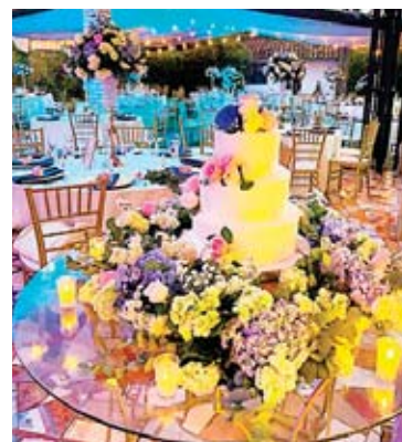
El pastel de bodas fue elaborado especialmente para la pareja de esposos Aguilar - Caballero.