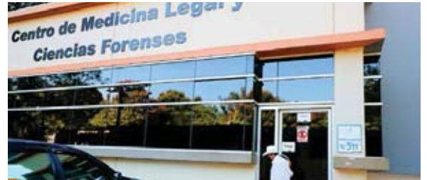
El crimen organizado es responsable del 70% de las muertes violentas de mujeres en Honduras.

Según las cifras oficiales, el país acumula hasta el 17 de diciembre 3,481 homicidios y un promedio diario de 9.9, por lo que, de continuar con ese índice, apunta a cerrar el año con más de 3,500 muertes violentas.