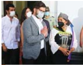
Boric, diputado y ex líder estudiantil de izquierda, agregó que respeta “plenamente” la autonomía de la asamblea.

Convocar el referéndum de salida, firmar el texto o implementar las nor-