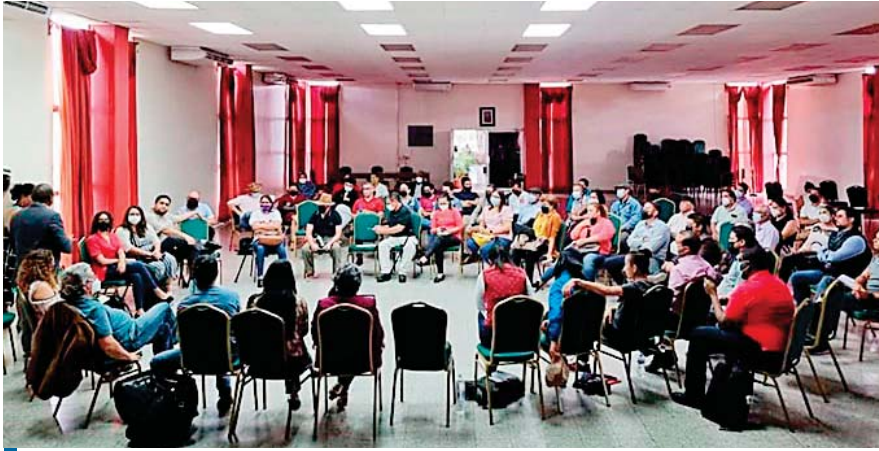
Ya se han realizado varias reuniones previas con organizaciones indígenas.

SE INTEGRARON DECENAS DE PERSONAS EN LOS EQUIPOS DE TRABAJO