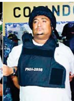
Desde el 2014 se han extraditado a 27 hondureños, acusados en Estados Unidos por narcotráfico, lavado y otros delitos de crimen organizado.

la realidad", y que concluirán su mandato en febrero de 2023, como manda la ley.