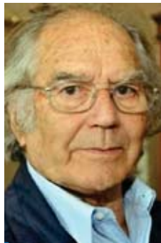
Adolfo Pérez Esquivel.