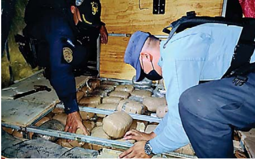
Los agentes cuando extraían el alucinógeno del piso del camión.