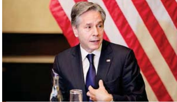
El secretario de Estado de Estados Unidos, Antony Blinken, envió un comunicado informando sobre esta donación.

Otros 170 millones de dólares se destinarán a Unicef para ayudar a la distribución de vacunas en todo el mundo, mientras que 20 millones serán para el Programa de las Naciones Unidas para el Desarrollo (PNUD) con la meta de abordar el impacto económico y social de la pandemia, inclui-