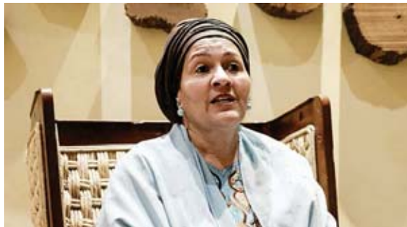
La vicesecretaria general de la Organización de Naciones Unidas (ONU), Amina Mohammed, durante una entrevista con EFE, en San José, Costa Rica.

Mohammed afirmó que la pandemia es un problema de salud, pe-