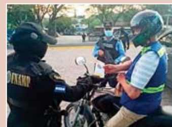
Los agentes conversaron con conductores, transeúntes y comerciantes.

Además se recolecta información de interés para dar con el paradero y captura de miembros de estructuras criminales. Durante los operativos, los agentes explican a la población los pasos a seguir al momento de ser víctimas de amena-