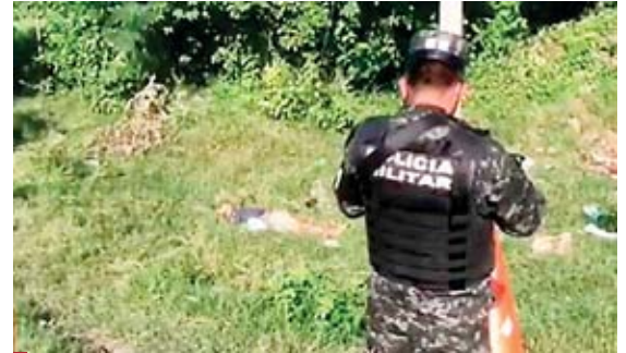
Agentes de la Policía Militar llegaron a resguardar la escena.

En el municipio de Jano, Olancho, la Policía Nacional detuvo a dos ciudadanos por el delito de "robo con fuerza", luego que despojaron de su vehículo a un motociclista. Los sospechosos son dos agricultores, de 24 y 18 años, residentes en la aldea Tepusteca, Olanchito, Yoro. Los agentes respondieron con inmediatez al recibir una comunicación del Sistema 911.