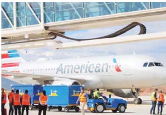
El aeropuerto internacional Palmerola sigue aumentando su tráfico aéreo luego del inicio de operaciones el pasado 11 de diciembre.

El enunciado agrega que “también se desmiente que tenga intención de que le sea otorgado sin licitación la operación del Aeropuerto Ramón Villeda Morales. En caso de haber una licitación, evaluaremos las condicio-