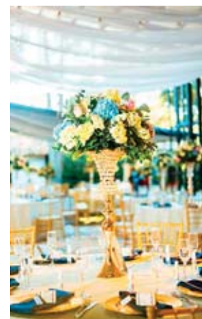
La decoración y planeación fue por parte de la firma Acontecimientos.