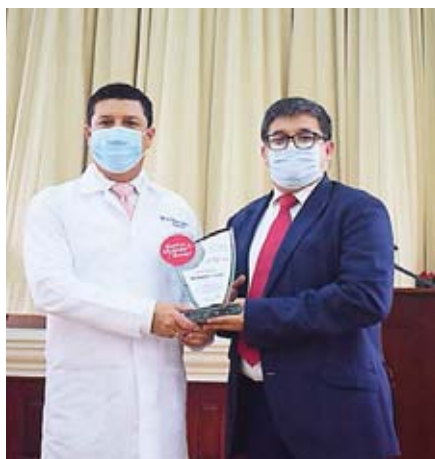
La autoridad de la iglesia entregó el reconocimiento denominado “Ilumina el Mundo con Amor 2021” al viceministro de Salud.

Indicó que no ha sido fácil enfrentarse a algo desconocido para todos, pero que gracias al apoyo de todo su equipo y de muchos colegas que lo instruyeron en su momento, se logró posicionar a Cortés como un referente en el país