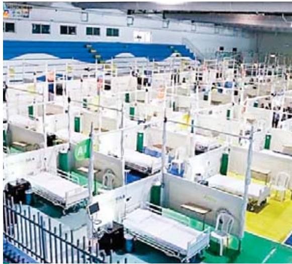
La Unidad Estabilizadora Municipal se habilitó el año pasado cuando ingresó la pandemia de COVID-19 al país.

preocupados porque la variante ómicron es algo que está afectando a nivel mundial y Honduras no es la excepción por lo que deben estar preparados si se diera un alza de los casos del virus y si se cierran los triajes y las Unidades Estabilizadoras no se podrá atender y dar respuestas al pueblo.