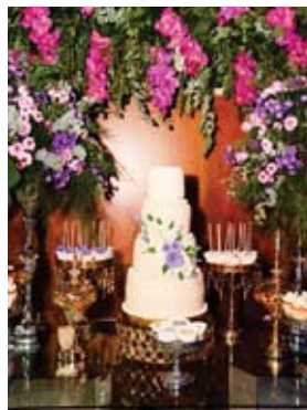
El pastel de la celebración fue elaborado especialmente para la hermosa cumpleañosera.