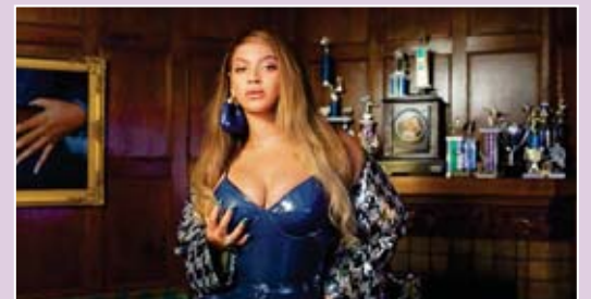
Beyoncé se une una vez más para hacer nuestros sporty chic realidad.

Los colores y el estampado de 'pata de gallo' se convierten en el punto central del lanzamiento en versiones super deportivas hasta más elevadas (y sí, con un toque de lentejuelas como la propia Queen B lo presenta). También, se contarán con piezas como un acolchado de patchwork, un bralette, una falda con un diseño único y una serie de elegantes versiones de ropa para niños.