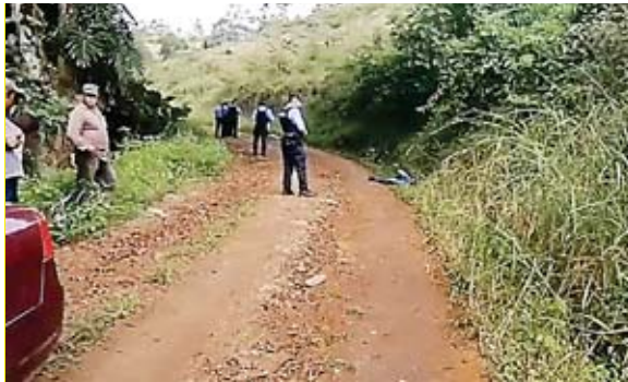
Los cuerpos quedaron a orillas de la carretera, y fueron encontrados por pobladores que transitaban por la zona.