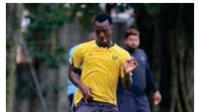
Vuelto es optimista.