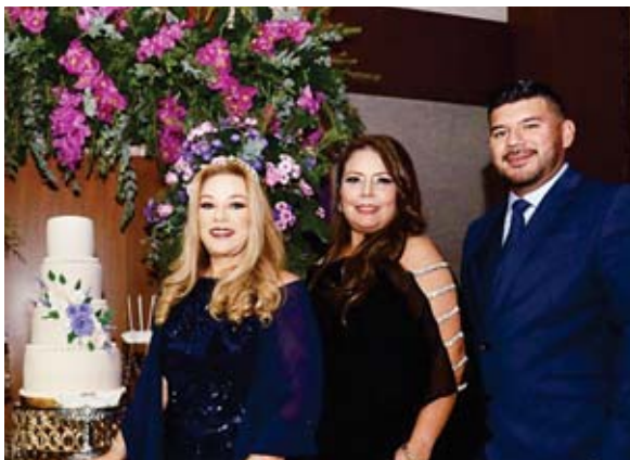
La cumpleañosera junto a su familia.