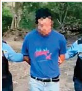
producto de las lesiones perdió el ojo izquierdo.

CHOLUTECA. La Policía Nacional arrestó ayer a un individuo acusado de sacarle a golpes un ojo a su propia hermana, por desacuerdo de una herencia. Esta acción fue ejecutada por funcionarios de la Dirección Policial de Investigaciones (DPI), en la aldea Coyalito, del municipio de Apacilagua. El detenido es un labrador de 52 años, quien, según las investigaciones, durante una discusión por una herencia, golpeó fuertemente a la ahora ofendida, quien