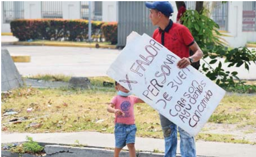
La falta de empleo ha incrementado la pobreza en el país, por lo que las personas deciden emigrar a fin de generar ingresos para el sustento de sus familias.

De acuerdo con lo explicado por el representante de la CASM, como organización que apoya a personas que fracasan en su camino hacia EE.UU., han tenido que asistir a miles de ciudadanos que son retornados, los cuales, solo este año a la fecha suma un promedio de 48 mil personas, unas 12 mil más que el año anterior donde fue-