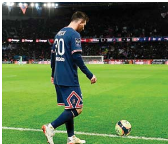
Menos golpeo, peor puntería y, según L'Équipe, menos implicación en el juego, de Messi.

Messi ha intentado menos de 10 jugadas ofensivas por partido, frente a las 15 que propone Leo se ha perdido 8 partidos desde su llegada, por falta de entrenamientos, por lesiones o por compromisos con su selección.