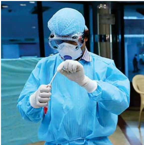
Las autoridades estadounidenses aseguran que se debe de estar preparado con los sistemas sanitarios de cada país ante la nueva variante.

Informaciones recientes indicaron que ómicron ya estaba circulando en Europa antes de que Botsuana y Sudáfrica notificaran el hallazgo.