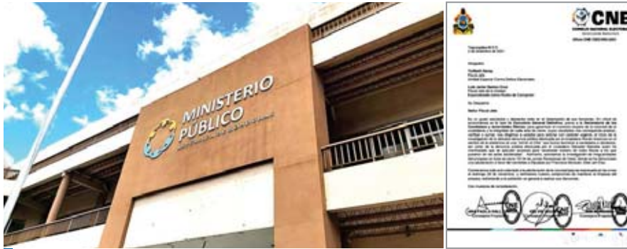
La Fiscalía Contra Delitos Electorales ha estado trabajando en todo este proceso electoral, dijo el portavoz.