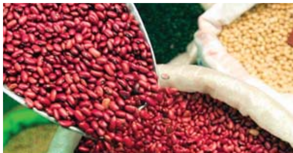
Maíz y frijoles son los productos que más han subido de precio en las últimas semanas

El maíz tuvo y tiene algunos incrementos, de 820 lempiras, está a 860 lempiras la carga y tam-