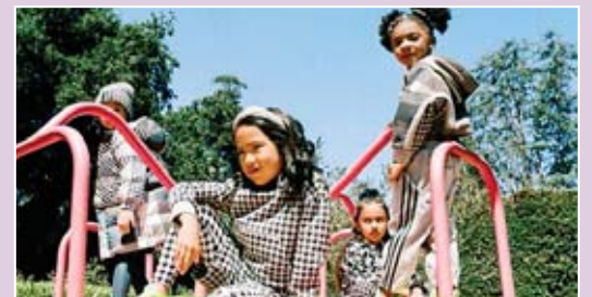
La colección está llena de detalles que logran que hasta los más pequeños se vean llenos de estilo.