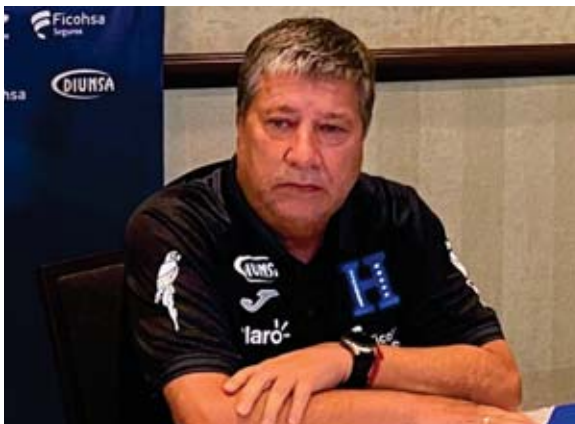
Hernán Gómez, seleccionador de Honduras.

opciones de clasificar. En enero se medirá a Canadá y El Salvador, luego en febrero visita a Estados Unidos.