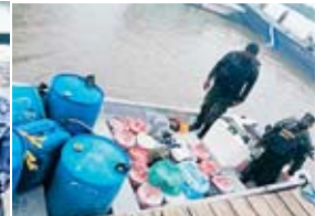
Se les decomisó 19 tambos de 5 galones conteniendo supuesta pasta para cocaína.