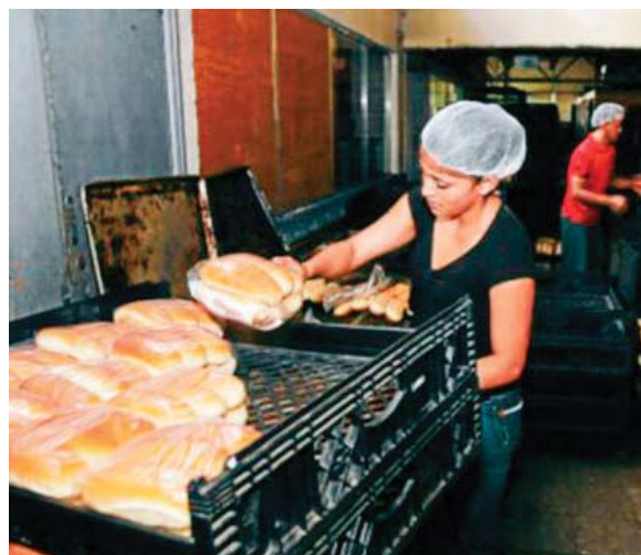
La Mipyme genera el 70 por ciento de los empleos en el país y es el principal aportante del Producto Interno Bruto (PIB).

“Si nos ponemos a trabajar podemos generar más oportunidades y evitar que nuestra gente salga del país”, consideró.