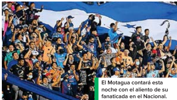
El Motagua contará esta noche con el aliento de su fanática en el Nacional.