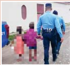
y dos años fueron trasladados a la Dirección de la Niñez, Adolescencia y familia (DINAF), en virtud de estar en condiciones de vulnerabilidad del derecho del niño.

ATLÁNTIDA. Mediante labores de vigilancia y seguimiento, en un allanamiento de morada con orden judicial, la Policía Nacional reportó la recuperación de tres menores de edad, mismos que supuestamente sufrían maltrato familiar. Según el reporte, los pequeños eran agredidos por su padre, y la madre de los mismos se encuentra hospitalizada ya que también sufrió golpes del individuo. La representante legal de La Fiscalía de la Niñez, ordenó que los menores de cuatro, tres