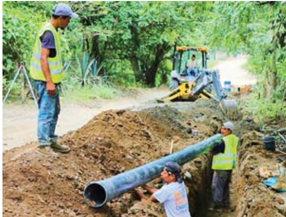
La comuna sampedrana está ejecutando varios proyectos en este sector a fin de mejorar la movilidad de los transeúntes.

Asimismo, indicó que los equipos municipales están trabajando por tramo y en la instalación de la tubería principal, tras agregar que esta obra mejorará la calidad