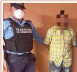
El individuo es solicitado por el Juzgado Seccional de Letras de Marcala, por lo que fue puesto a la orden de las autoridades competentes.

LA PAZ. La Dirección Nacional de Prevención y Seguridad Comunitaria (DNPSC) y Dirección Policial de Investigaciones (DPI), arrestaron ayer a un sujeto por suponerlo responsable del delito de sustracción de menores. La detención se realizó mediante vigilancia y seguimiento en el barrio San Miguel, del municipio de Marcala. Se trata de un labrador de 39 años, residente en la aldea Llano Alegre, del municipio de Santa Elena.