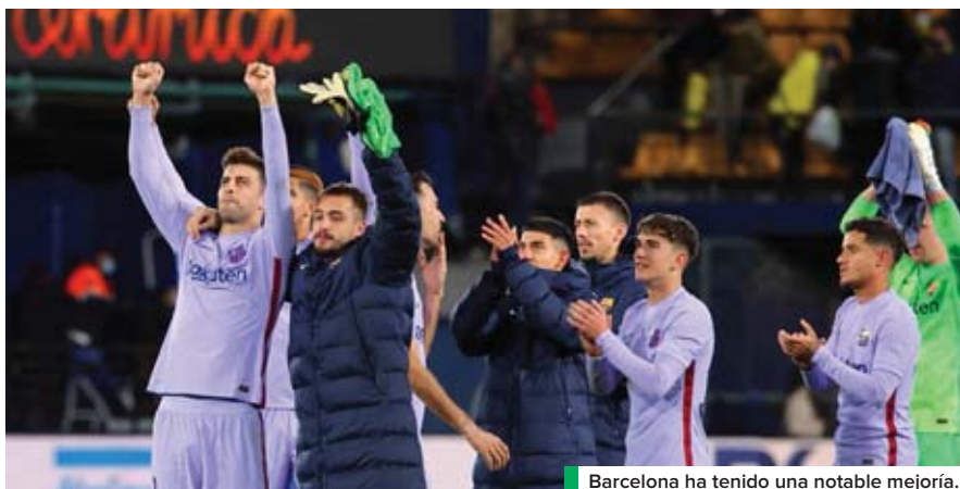
Barcelona ha tenido una notable mejoría.