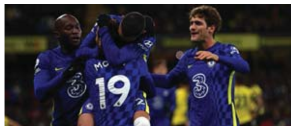
Chelsea tiene 33 puntos al frente de la Premier League.

un inconveniente. El Manchester City (2º con 32 puntos) jugará por su parte en el último turno del sábado en Watford (17º), en el duelo a priori más sencillo entre los tres en los que están implicados el trío cabecero.