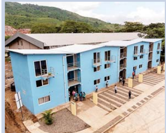
Los edificios multifamiliares son una modalidad de vivienda que se construye en Choloma Y Villanueva en Cortés, en total se construyen en estos municipios, 824 viviendas.

“Para mí significa un sueño de poder ayudar a las familias que más lo necesitan, esta es una nueva etapa atendiendo a los más afectados que lo perdieron todo después de las tormentas tropicales”, manifestó con júbilo el Presidente Juan Orlando Hernández al entregar las primeras viviendas donadas mediante el “Programa Viviendas Donadas y Financiadas”.