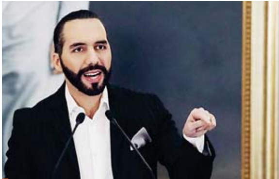
El presidente Nayib Bukele ha ganado mucha popularidad entre su pueblo y también en la comunidad internacional.

Esta empresa compartió en Twitter un gráfico que señala que el presidente Bukele encabeza la lista de los mandatarios mejor evaluados de América con el 71% de aprobación hasta octubre. Sin embargo, este dato refleja una caída en su popularidad de 13 puntos porcentuales frente al dato de marzo, cuando la aprobación de Bukele era del 84%, sin