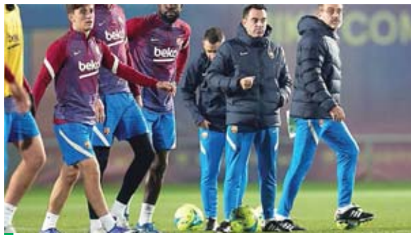
Motivado se vio el equipo azulgrana ayer en su último entrenamiento.

En la enfermería del Barcelona siguen hombres como Ansu Fati, Ousmane Dembélé o Sergio ‘Kun’ Agüero, con quien se especula que podría retirarse.