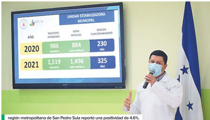
región metropolitana de San Pedro Sula reportó una positividad de 4.6%.

En cuanto al número de pacientes hospitalizados en los centros asistenciales de la zona, Cosenza indicó que, hasta la fecha, el Hospital de Puerto Cortés reporta tres pacientes hospitalizados, el Hospital de El Progreso cuatro, el Mario Catarino Rivas 11 y tres