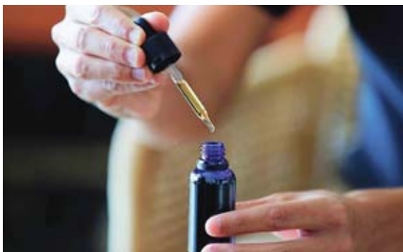
El cannabis medicinal es usado para tratar varias enfermedades.

La mesa de discusión debe revisar uno de los puntos que más polémica ha generado la ley: el número de licencias de fabricación de derivados