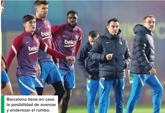
Barcelona tiene en casa la posibilidad de avanzar y enderezar el rumbo.