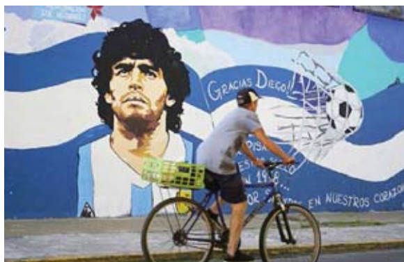
La leyenda del "10 Eterno" está por doquier.

ante River Plate el 25 de octubre de 1997, la imagen del ídolo con la casaca azul y oro advierte que allí "Diego vive".