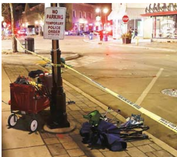
Muchos ciudadanos que estaban en el lugar, indicaron que vivieron momentos de terror ya que había heridos por todos lados.

El culpable podría enfrentar cadena perpetua por el quintuple crimen