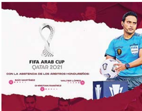
Los tres jueces hondureños que estarán en la competencia internacional.