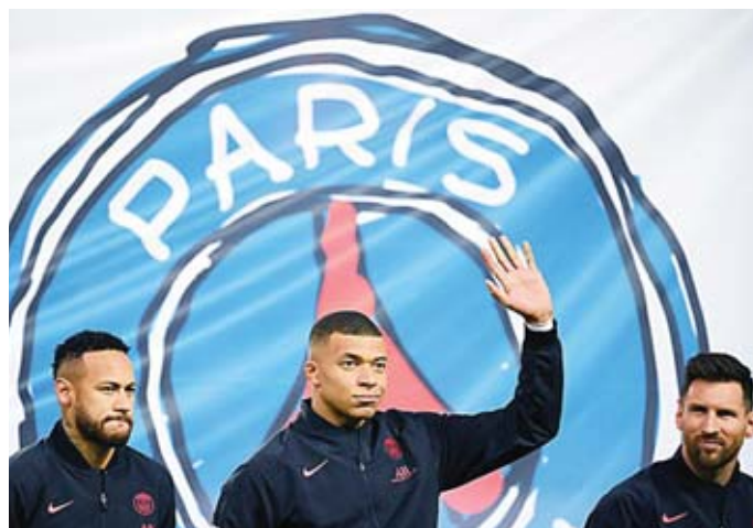
Los premiados serán elegidos por votación.

El brasileño Alisson Becker y la chilena Christiane Endler pelearán por el premio al mejor guardameta.