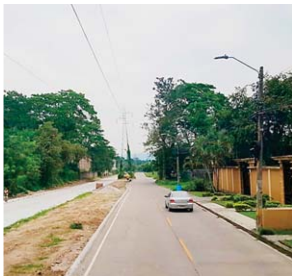
Con las dos vías pavimentadas del Bulevar Las Torres no se hará mucho tráfico y además los vehículos ya no serán deteriorados rápidamente.

El tramo de pavimento nuevo es un complemento de la 13 avenida, al Paso Merendón y al bulevar MacKay, obras ejecutadas con fondos 100 por ciento municipales.