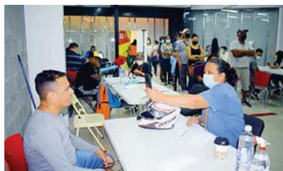
Dentro de las instalaciones del centro comercial el proceso de entrega del DNI es rápido, pero los ciudadanos deben hacer largas filas para el ingreso.

Otra ciudadana expresó que el proceso adentro es fácil y rápido, pero hay un poco de atraso en las largas filas, por eso se debe de tener mucha paciencia y contar con tiempo disponible.