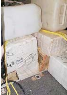
La avioneta, según las Fuerzas Armadas, llevaba 23 fardos de supuesta cocaína.

Asimismo, que en la zona del aseguramiento se continúan con las labores de investigación y decomiso de la droga.