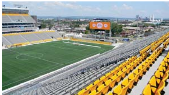
El Tim Hortons Field, de la ciudad de Hamilton, escenario del partido.

La ventaja que tienen las “águilas” ante los canadienses es que juegan la revancha en casa, partido donde el argentino espera que haya un ambiente normal pues es días después de las Elecciones Generales.