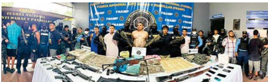
Los capturados serán presentados en audiencia inicial el viernes 26 de noviembre.