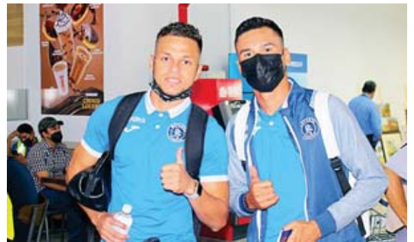
Los azules madrugaron de Tegus a San Pedro Sula, para tomar su vuelo.

Del cruce de semifinal que tendrá ante Real España, señaló “sabíamos que podían ser ellos o Vida, iban a ser equipos que por algo quedaron primero o segundo. No le pudimos ganar a Real España ninguno de los dos partidos (de las vueltas). Ahora tenemos que mostrar que estamos mejor para pasar a la final”.