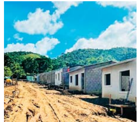
Viviendas sociales mejorarán miles de vidas en Olanchito, Yoro y Macuelizo, Santa Bárbara.