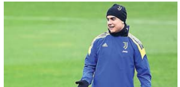
Dybala apunta al banquillo en la cita con el Chelsea.

Dybala, de 28 años, se perdió la visita al Lazio, del pasado sábado, al arrastrar unas molestias en una pantorrilla.