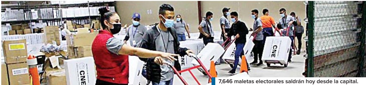
7,646 maletas electorales saldrán hoy desde la capital.