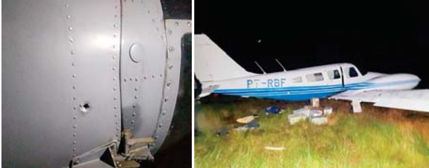
El tiroteo dejó daños en el helicóptero de la Fuerza Aérea Hondureña (FAH) con perforaciones en su fuselaje.

EN LA OPERACIÓN DETUVIERON A UNA PERSONA