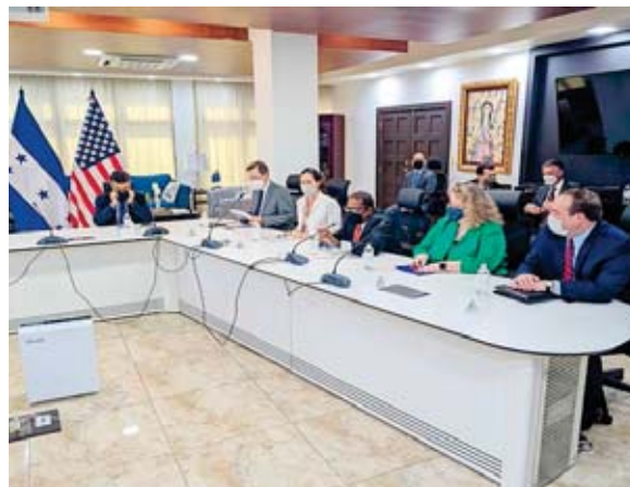
A la derecha el funcionario estadounidense y parte de su comitiva durante la reunión con el canciller Rosales, altos oficiales y los ministros de Defensa y Seguridad.

De igual manera, se sentó con representantes del Consejo Hondureño de la Empresa Privada (COHEP), con quienes “platicó sobre el desarrollo económico” pero también ratificó su mensaje sobre elecciones “que reflejen la voluntad del pueblo”, según una comunicación de la embajada estadounidense.