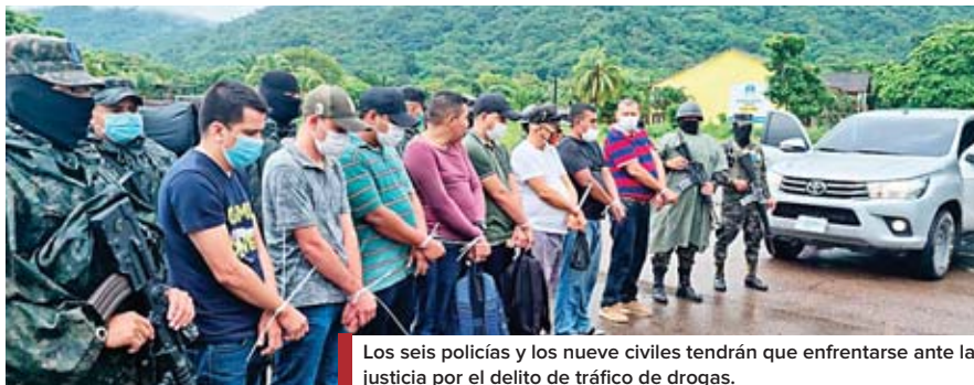
Los seis policías y los nueve civiles tendrán que enfrentarse ante la justicia por el delito de tráfico de drogas.