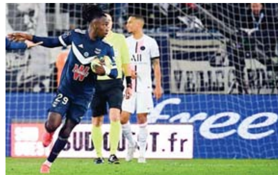
El catracho viene motivado tras anotarle al PSG.

De su encontronazo con Mbappé, expresó que solo queda como anécdota, pero que no paso a más.