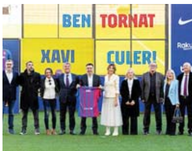
Xavi volvió a su casa para firmar como entrenador, se hizo acompañar de su familia y ante 10 mil espectadores.