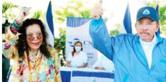
El exguerrillero sandinista, está en el poder desde 2007.

El líder sandinista, que retornó al poder en 2007 tras coordinar una Junta de Gobierno de 1979 a 1985 y presidir por primera vez el país de 1985 a 1990, partía con ventaja para ser reelegido junto con su esposa, la vicepre-