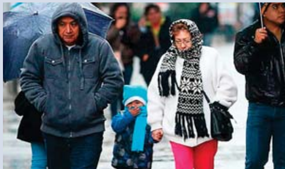
La Esperanza y Santa Rosa tendrán las temperaturas más bajas. En San Pedro Sula podrá llegar a los 19 grados, mientras que en el Distrito Central a 14.

La madrugada de mañana será más fría en comparación a la de hoy, con mayor incidencia en La Esperanza, donde llegará a los 9° grados Celsius; seguida de Santa Rosa de Copán, con 13° grados; luego Yoro, Gracias, Nueva Ocotepeque y el Dis-