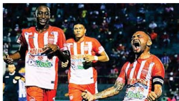
Vida ha sido uno de los grandes animadores del torneo.