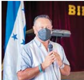
El ministro Arnaldo Bueso anunció que el inicio de las clases semipresenciales dependerá de que se haya vacunado a la totalidad de la comunidad educativa.