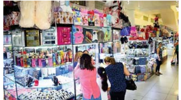
El comercio y los servicios son los rubros donde más empresas se constituyen.

A causa de la pandemia del COVID-19 y las tormentas Iota y Eta se suspendieron más de 800 mil empleos y muchas empresas cerraron operaciones a nivel nacional. Desde entonces el gobierno, la empresa privada y diversas organizaciones han ejecutado planes de recuperación económica que incluyen la vacunación, asistencia médica inmediata y reapertura de fuentes de trabajo.