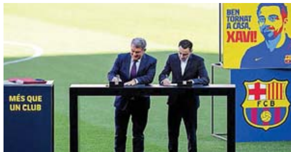
Con firma del exjugador azulgrana llega la ilusión.

Joan Laporta, sentenció que “el retorno de Xavi como entrenador marcará la historia del club”. Añadió “Xavi transmite alegría, esperanza, he visto entusiasmada a la gente como nunca”.