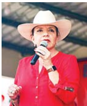
El simulacro oficial del TREP se hará en los próximos días de manera pública, con todos los actores del proceso electoral.

En ese sentido, subrayó que espera que el acuerdo político pueda convertirse en una realidad, a pocas semanas de las elecciones. Añadiendo, que como CNE mantiene un compromiso firme de ir a elecciones generales con un solo documento de identidad.