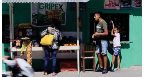
EL BCH destacó que todas las regiones del país registraron alzas en la inflación en octubre.

La reapertura total de los cruces entre México y Estados Unidos reactivará la economía transfronteriza tras el impacto estimado en 71,000 millones de dólares durante los 20 meses de cierre por la pandemia, aunque los grandes ganadores serán los comerciantes estadounidenses.