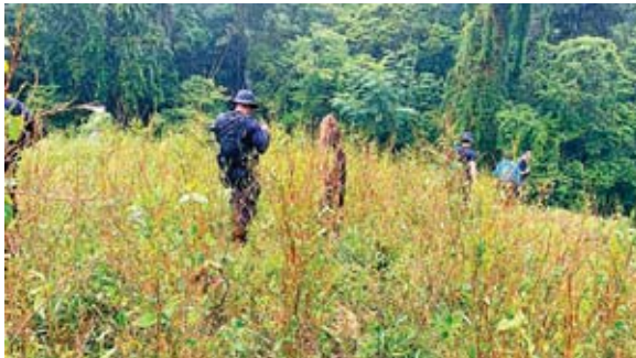
Los agentes de investigación llegaron a la aldea Pedrogoza, Iruña, donde reportaron el hallazgo, la zona se ha convertido en un área común para este cultivo.

Cabe mencionar que el pasado domingo en una zona montañosa del mismo sector, se encontraron 87 mil arbustos de supuesta hoja de coca que, sumados con lo en-