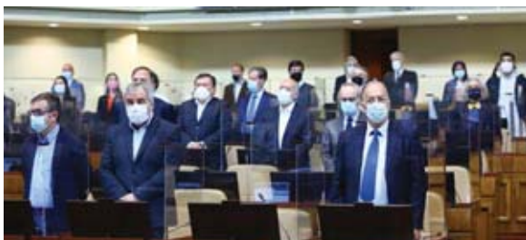
El origen de la acusación contra Piñera, impulsada por la oposición, se sitúa en las presuntas irregularidades en la venta de la Minera Dominga.