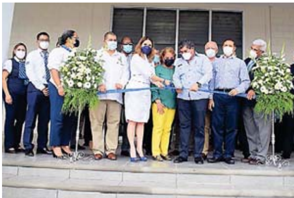
Autoridades de Migración y de gobierno inauguraron las oficinas que a partir de hoy estará prestando servicios a la población.

La funcionaria manifestó que a través de los años la infraestructura de las diferentes oficinas se ha mejorado, lo que ha llevado a que se amplíen las capacidades de atención al ciudadano. Ejemplificó que, en el caso de la Ciudad Industrial, las instalaciones se han cambiado en distintas ocasiones, primeramente, estuvieron ubicados en Los Castaños, luego en el Centro, y posteriormente en el bulevar del norte.