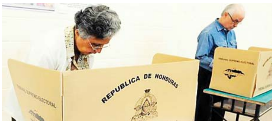
Solo saliendo a ejercer el sufragio, va a garantizar la voluntad del pueblo, indicó la representante de Panal.

Representada por diferentes sectores, Panal, promueve el voto para aquellos que estén libre de corrupción y todo aquello que atente contra el país.