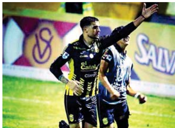
Real España sale por el primer puesto y espera un lleno en el Morazán.

El Olimpia, que quiere sumar su cuarto campeonato al hilo con Troglio, cerrará la fecha 18 enfrentando de visita al Platense.