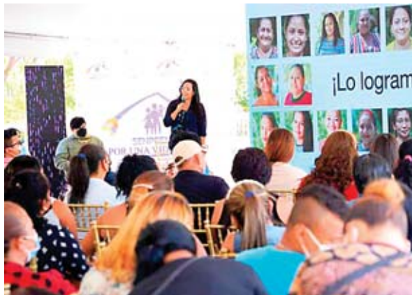
Desde 2014 al 2021 se han entregado alrededor de 40.1 millones de beneficios.

Contreras destacó que los beneficios sociales del Gobierno han sido entregados a través de 73 programas y pro-