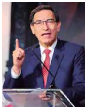
Vizcarra, de 57 años, ha tenido altos índices de popularidad en sus dos años y medio en el poder.

“Un presidente de los Estados Unidos ha mentido deliberadamente sobre la ciencia de una manera que era inminentemente peligrosa para la salud humana y que llevó directamente” a la muerte de estadounidenses. EFE