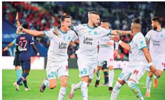
La alegría del Marsella por ganar el clásico francés.