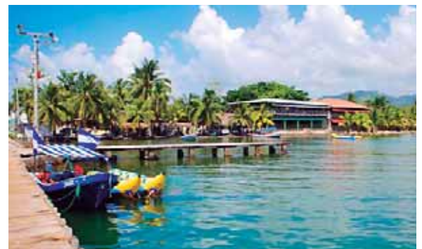
La zona costera será el epicentro de la competencia.