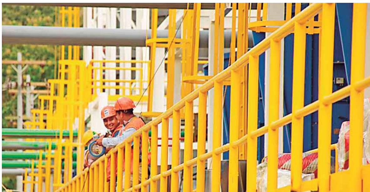
Instalar la planta generadora en La Ensenada concentró la producción de energía en un solo sitio, aunque requirió de inversiones adicionales.

Justificó que en ese momento la CREE pudo actuar de esa manera porque cuando se adjudicó la licitación existía un proyecto de la Comisión para la Alianza Público-Privadas (Coalición) para instalar una planta de 450 megas en Trujillo. Sin embargo, ingenieros de la ENEE hicieron las evaluaciones técnicas y determinaron que no existía la capacidad en el sistema de transmisión para trasladar la energía generada en ese sector al resto del país. Hacer los ajustes para conectar esa electricidad al sistema habría resultado oneroso, por lo que el proyecto de Trujillo fue descartado cuando la licitación ya había