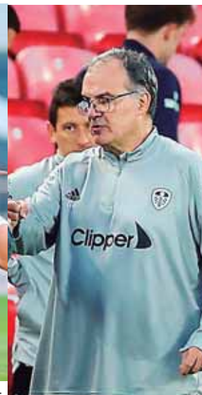
Marcelo Bielsa con el Leeds United puso en aprietos al Liverpool de Klopp.