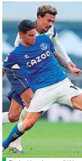
El colombiano James recibió buenos comentarios tras su participación ayer en el inicio del Everton en la Premier League.