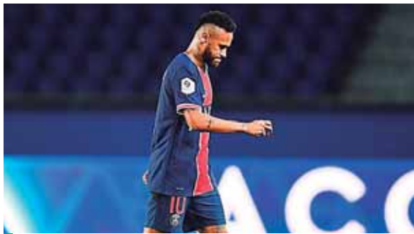
¿Racismo?, esa sería la reacción de Neymar por la actitud del argentino Álvaro González.