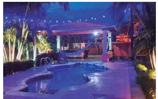
Esta será la sede del concurso.