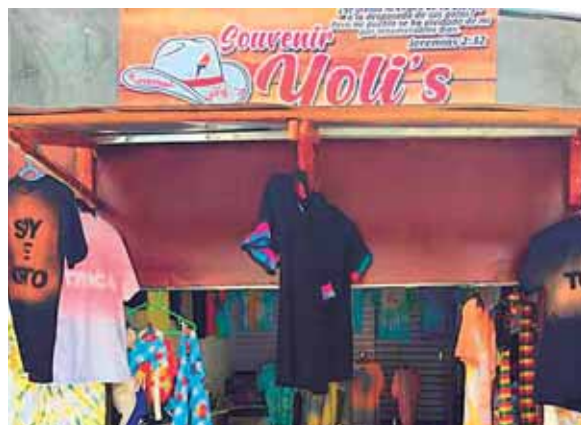
Su negocio funciona en la nueva “Plaza Provisional Guamilito” y sus productos son a precios accesibles.