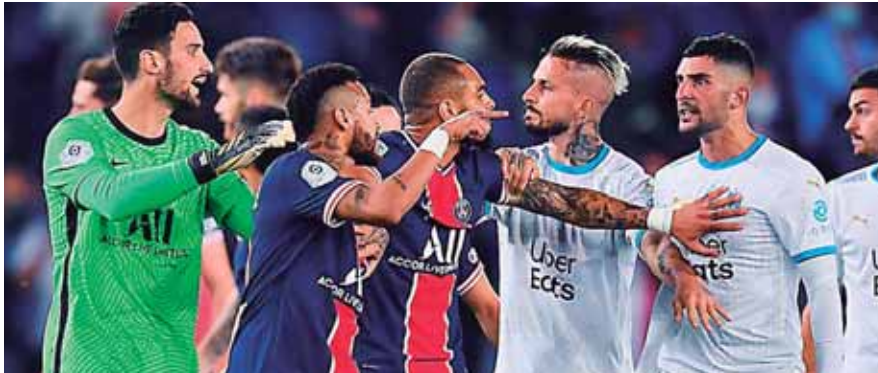
El zafarrancho al final del juego, tres expulsados del PSG. Parece que hubo palabras fuertes.

Neymar y Paredes, así como Ángel Di María, reaparecían este domingo tras recuperarse del nuevo coronavirus. Kylian Mbappé, también infectado, era todavía baja en el PSG para este partido.