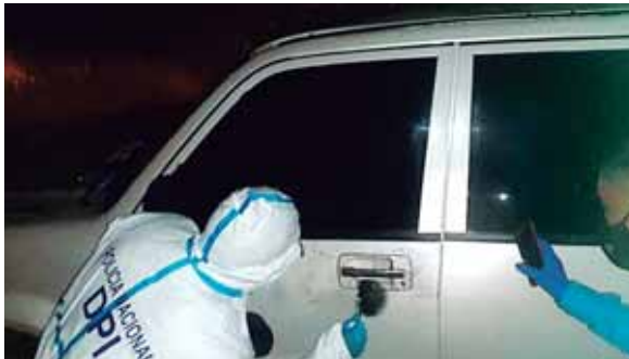
Tras el hallazgo del vehículo, los agentes de inspecciones oculares recabaron evidencia para dar con los responsables.

Preliminarmente se manejó que el dinero que robaron era el que los vendedores en carros distribuidores, habían llevado, producto de sus ventas.