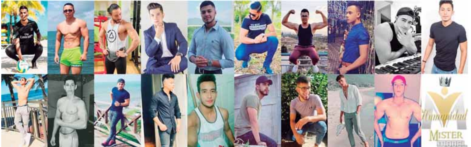
Candidatos Mister Humanidad Honduras 2020, originarios de diferentes partes del país.

SAN PEDRO SULA. Proyección Talentos Honduras se alista para el Mister Humanidad Honduras 2020, del 21 al 24 de septiembre en Marbella, Omoa, para la elección del nuevo líder nacional, imagen de obras sociales humanitarias de este proyecto reconocido.