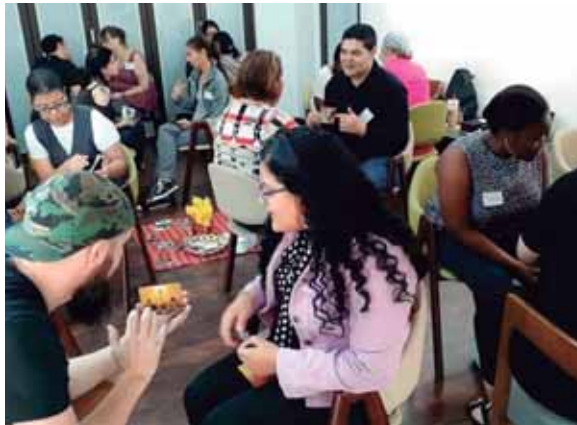
Las personas que van a sesiones a la Fundación al principio lo hacen individual, luego los integran en grupos.

"Estamos cumpliendo dos años de haber creado la fundación y en