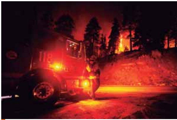
En la última semana los fuegos se cobraron 22 vidas en California, el estado de Washington y Oregon, y decenas de personas están desaparecidas.

Sus palabras suscitaron críticas de autoridades locales. “El Gobierno esconde la cabeza” con el tema medioambiental, acusó este domingo por la mañana en CNN el alcalde de Los Ángeles, Eric Garcetti. “No se