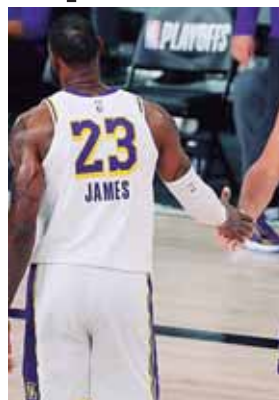
LeBron, persigue su primer campeonato con los Lakers, que sería el cuarto de su carrera.