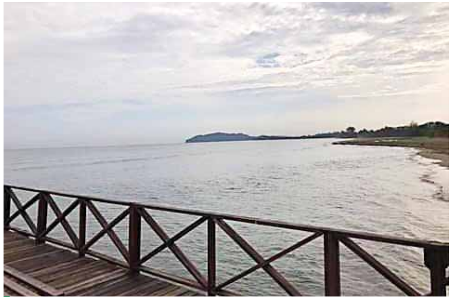
Las lluvias azotaron fuerte en la zona atlántica, en el Valle de Sula precipitaciones.

“Se debe de tomar muy en cuenta el sistema sanitario en el sentido de que si nos tocara una emergencia lo más complicado serían los albergues en un momento de evacuación de personas porque no debe de haber aglomeraciones, pero en ese caso ya hemos pensado que se dividirán a los que ya tuvieron CO-