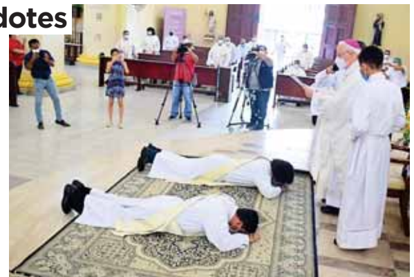
El Obispo Ángel Garachana realizó el acto de ordenación sacerdotal en un solemne evento en la catedral San Pedro Apóstol.

"Para ser sacerdote no puede ser cualquier persona que no sea capaz de entablar una relación con diversos tipos de personas, se requiere madurez psíquica y pastoral para atender la realidad que Honduras necesita", aseguró Estévez. (J.C.)