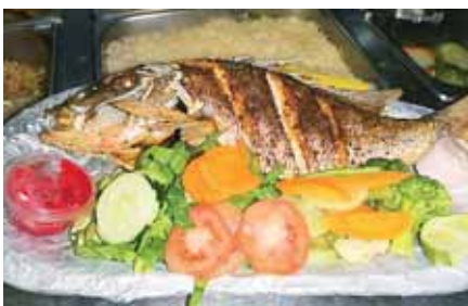
Los emprendedores han sido capacitados para obtener las mejores imágenes y videos de los productos que ofrecen.