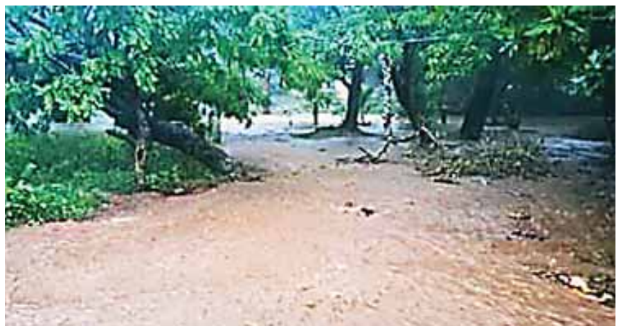
Los municipios afectados fueron José Santos Guardiola y Roatán en Islas de la Bahía.