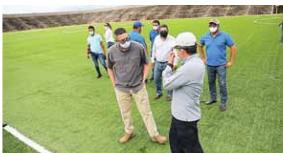
El mandatario Juan Orlando Hernández junto a las autoridades locales supervisando la obra.

El estadio, con el nombre de Roberto Suazo Córdova, quien fue presidente de Honduras del 27 enero de 1982 al 27 de enero de 1986, fue construido con capacidad para 25 mil espectadores.