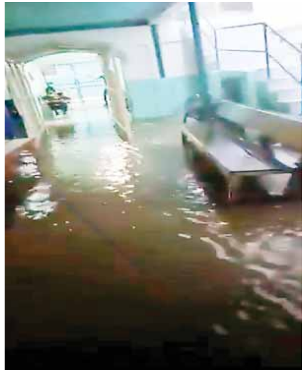
El hospital público de Roatán se inundó producto de las lluvias.

Especificó que el departamento de Islas de la Bahía, que anteriormente estuvo en alerta amarilla, ya