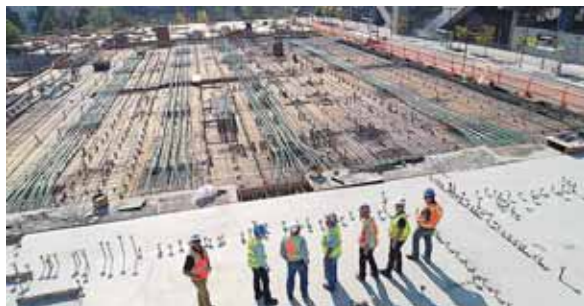
En agosto la empresa planteó la firma de un nuevo contrato luego de que la CSS pidiera la cotización de unas adecuaciones a la obra.

Este proyecto es investigado por la Justicia de España en una causa en la que FCC está imputada por haber pagado sobornos que suman 82.7 millones de dólares, como la misma empresa ha admitido según la información judicial española, para obtener este contrato y otros pa-