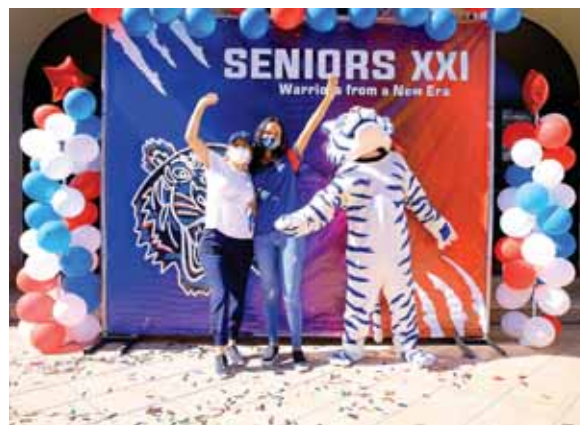
Los padres de los seniors de la Episcopal El Buen Pastor posaron felices con sus hijos.