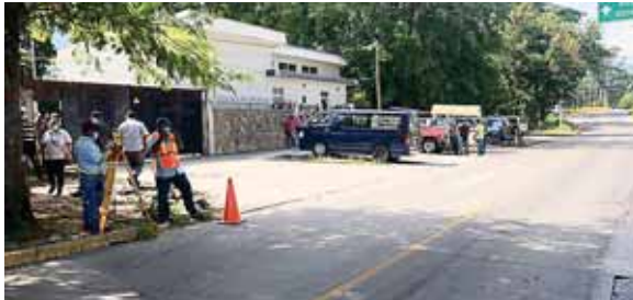
Según la mayoría de investigadores, el nuevo coronavirus fue transmitido probablemente al hombre por un animal.

Aparentemente Ortega, al percibirse de la intención de los matones intentó huir, por lo que los gatilleros lo persiguieron. Aún con vida el ex edil, fue auxiliado y se in-