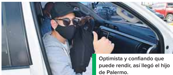
Optimista y confiando que puede rendir, así llegó el hijo de Palermo.