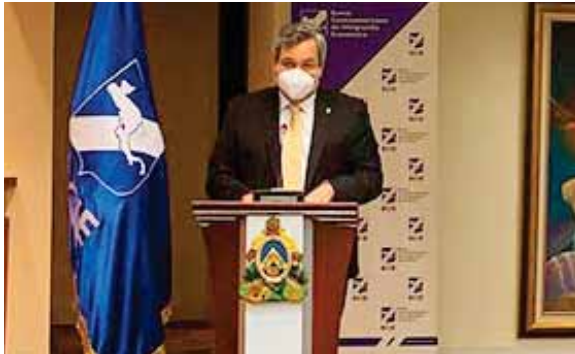
La Asamblea es espacio de diálogo anual y en esta ocasión sirvió para analizar oportunidades para la región.

“El BCIE arriba a su 60 aniversario y es evidente que la institución se ha fortalecido, buscando su propia identidad como banco de desarrollo. Después de varias reformas corporativas, el banco ya se ha posicionado con liderazgos