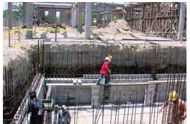
La próxima semana se comenzará con los trabajos de fundición de una parte de lo que es el piso del segundo nivel.