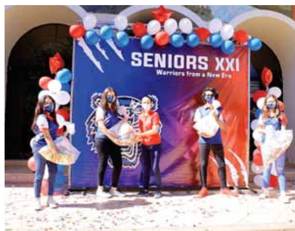
Momento en que los Seniors hacían entrega de alimentos y medicamentos a los empleados del departamento de apoyo y seguridad de la escuela.