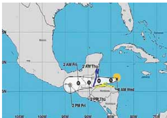
Nana tocó tierra la madrugada de ayer en la costa de Belice como huracán de categoría 1.

Los meteorólogos estiman que el centro de Nana estará sobre el norte de Guatemala y el sureste de México a lo largo de ayer y la próxima noche, para hoy moverse al Golfo de Tehuan-