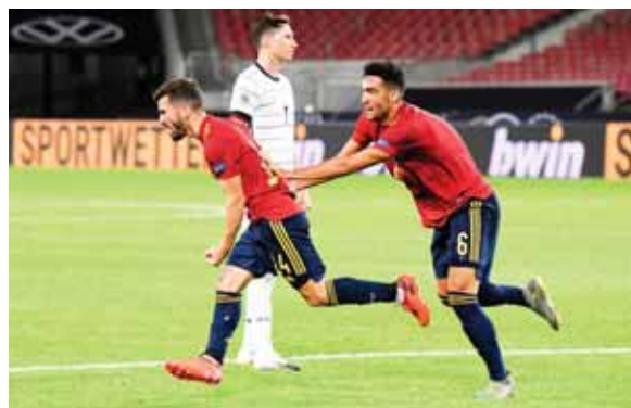
España parecía tener todo perdido, pero rescató un punto frente a los alemanes.