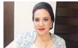
La primera dama recordó que la situación migratoria ha sido una realidad en la región centroamericana.

Lo que los migrantes están enfrentando es una situación muy difícil. No hay que satanizar a los migrantes, ellos no son delincuentes,