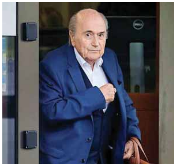
Sepp Blatter sin el poder que le daba la presidencia de la FIFA, se vio apagado.

El caso es todavía más complejo en tanto que existe un “convenio” escrito firmado en 1999, después del ascenso de Sepp Blatter a la presidencia de la FIFA: pero prevé un salario de 300,000 francos suizos (unos 270,000 euros) por año para Platini, lejos del millón anual reclamado por el exfutbolista.