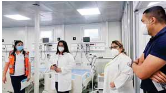
Los directores de hospitales resaltaron la tecnología con la que cuenta cada uno de los módulos de atención a los pacientes.

“Vemos salas completas con todo el acondicionamiento para este tipo de cuidados de pacientes críticos, así como también hemos visto las condiciones que reúne este hospital, lo que es el recambio de aire, que es muy importante para disminuir la carga viral en cada una de las unidades,