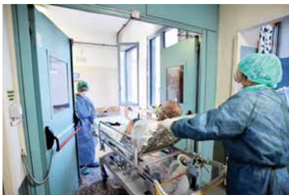
Costa Rica comenzó el lunes una etapa de 9 días de "transición" hacia una mayor apertura económica.

Para ello, estos negocios deberán cumplir una serie de requisitos y protocolos sanitarios, y probar que pueden operar como restaurantes o cafeterías.