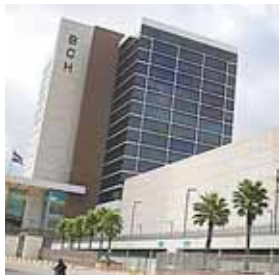
La pandemia de coronavirus ha reducido los ingresos de Honduras por recaudación fiscal.

Las medidas anunciadas permitirán liberal gradualmente 8,727.6 millones de lempiras (349.1 millones de dólares), aumentar la tasa de crecimiento, reducir el costo de oportunidad de los bancos, y podría propiciar