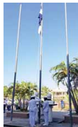
En la Base Naval la Bandera se izó a media asta en señal de luto por las víctimas de la COVID-19.

La ceremonia protocolar de conmemoración por el Día de la Bandera es apenas una muestra del verdadero sentimiento de Patria que se anida en los corazones