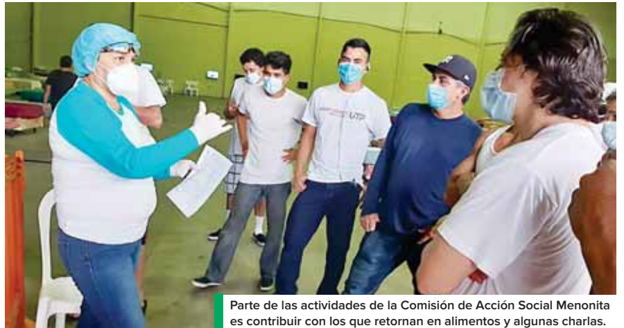
Parte de las actividades de la Comisión de Acción Social Menonita es contribuir con los que retornan en alimentos y algunas charlas.

"Viven una situación muy dramática por eso alzamos la voz en reclamo de los derechos humanos para que se les de atención integral y en estos momentos el resto de la sociedad no podemos hacernos de oídos sordos, ni ser indiferentes", expresó Ramos. (J.C.)