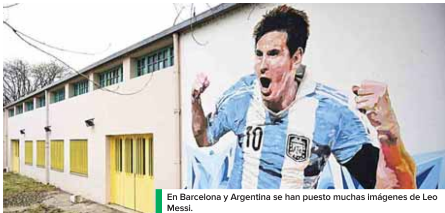
En Barcelona y Argentina se han puesto muchas imágenes de Leo Messi.