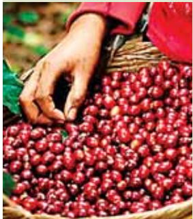
La cosecha inicia el próximo 1 de octubre y finaliza el 30 de septiembre del 2021.