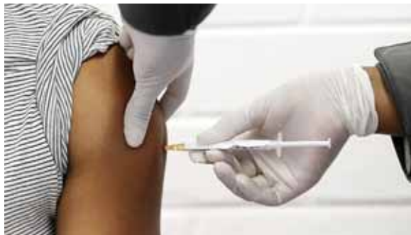
La vacuna de AstraZeneca está en la fase 3 de los ensayos clínicos, la última antes de recibir su aprobación de las autoridades reguladoras.

"Una persona recibirá una inyección de placebo por cada dos perso-