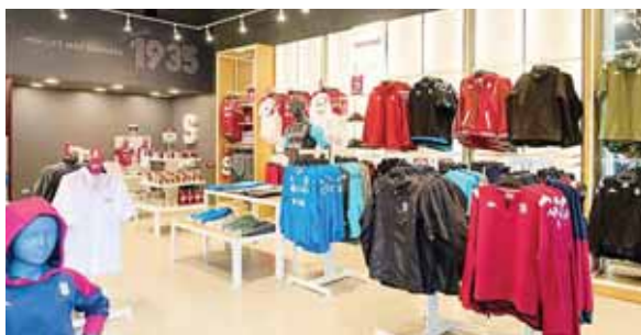
Las modernas tiendas del Saprissa en Costa Rica.

SAN JOSÉ. El Deportivo Saprissa dio un gran paso a nivel de clubes en Centroamérica y abrió tres tiendas en San José, donde sus seguidores podrán adquirir todas sus colecciones de productos oficiales.