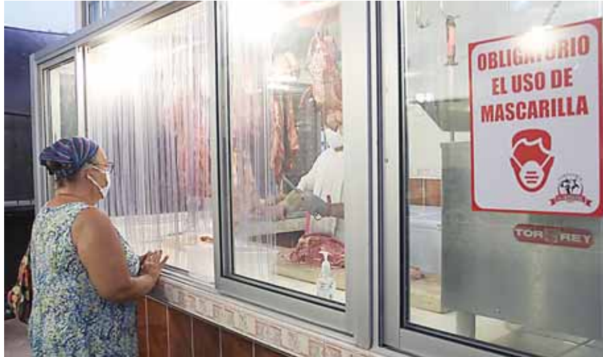
Sinager certifica el cumplimiento de los protocolos de bioseguridad de los mercados, todos los ciudadanos deben de hacer uso de las medidas de protección.

zona de entrada y una de salida, se toma la temperatura tanto al locatario como al cliente y se cuenta con una bomba de fumigación, además los establecimientos están