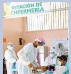
Ayer fue inaugurado el centro de triaje en la ciudad de Tocoa, tiene la capacidad de atender diariamente a 180 pacientes.

El nuevo centro de triaje de Tocoa cuenta con 2 clínicas de atención médica, 4 camillas para estabilización, área de