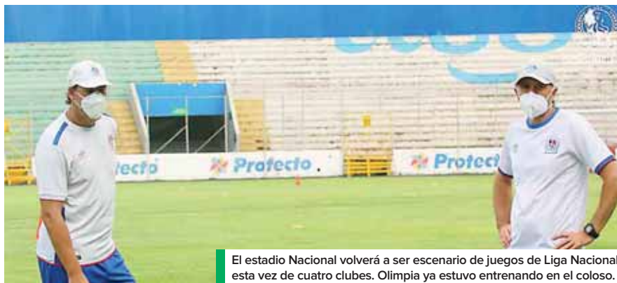
El estadio Nacional volverá a ser escenario de juegos de Liga Nacional, esta vez de cuatro clubes. Olimpia ya estuvo entrenando en el coloso.

“Es algo tomado a nivel de directiva, jugar en el Nacional, como nuestra sede temporal. Ojalá la pandemia pase y podamos re-