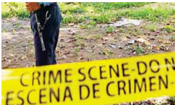
Las autoridades se trasladaron hasta el lugar de los hechos para hacer los levantamientos.

Seguidamente, agentes policiales asignados a ese sector del país informaron de otro hecho