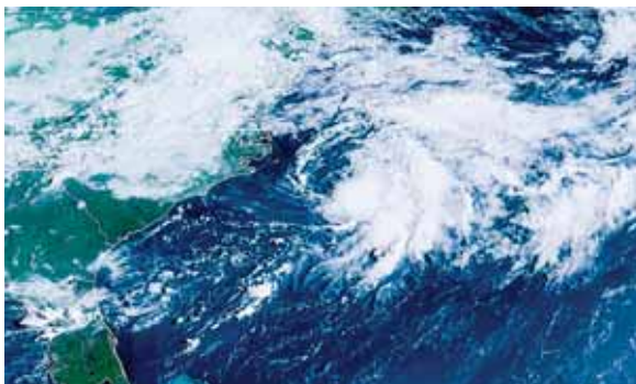
La tormenta tropical Nana se formó ayer en aguas del Mar Caribe cerca de Jamaica y se dirige hacia la costa norte de Honduras.