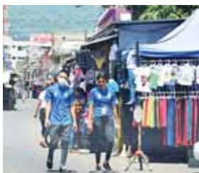
El presidente Hernández destaca que “se han evitado las consecuencias catastróficas que auguraban millones de contagios y cientos de miles de muertes”.