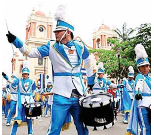
Los centros educativos sampedranos se han caracterizado por brindar a la población un espectáculo cada 15 de septiembre y este año lo harán de forma virtual.

Empresas sampedranas se siguen sumando a la tarea de donar insumos de bioseguridad para los médicos que luchan en primera línea de batalla contra la COVID-19 de los principales centros hospitalarios de la ciudad. Ayer, el Catarino Rivas y el Leonardo Martínez recibieron la donación de mascarillas, gorros, y todo lo necesario para realizar su trabajo de forma segura.