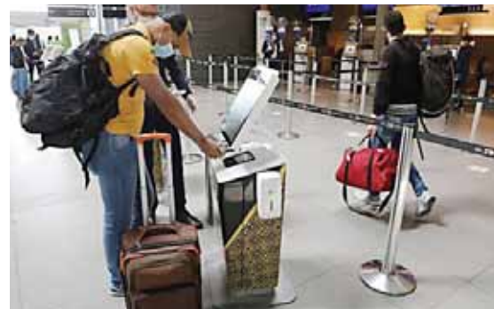
Ayer también reanudaron sus actividades las empresas de transporte de pasajeros por carretera.

Destacó que México será uno de los fabricantes de la vacuna que desarrollan el laboratorio británico AstraZeneca y la universidad de Oxford, que espera pueda aplicarse desde inicios de 2021 “de manera universal y gratuita”.