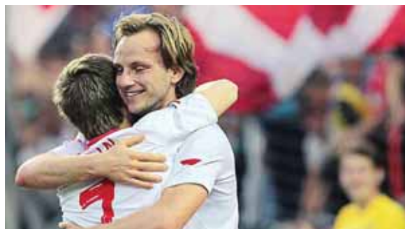
Rakitic con el Sevilla ganó la Europa League en 2014 bajo las órdenes de Unai Emery

También fue Subcampeón del Mundo en 2018 con Croacia, derrotada por Francia (4-2).