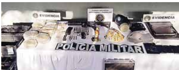
A los detenidos se les decomisó armas, celulares, computadoras, rollos de cables para la instalación de internet, entre otros.

del Valle, de esta ciudad, por suponerlo responsable de cometer el delito de extorsión continuada, en perjuicio de testigos protegidos, recuperó su libertad en el año 2017.