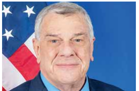
Michael Kozak, subsecretario de Estado Interino para Asuntos del Hemisferio Occidental.

Asimismo, ampliarán sobre cómo la pandemia de COVID-19, en materia de acceso a empleo, salud, vivienda y medios de vida, está teniendo graves efectos en las personas migrantes y generando crisis económicas a nivel mundial.