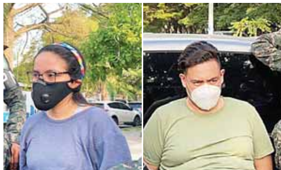
"El Koreano" y "La China" fueron detenidos en la residencial El Barrial en San Pedro Sula, ambos son integrantes de la MS-13.

Anteriormente "El Koreano" había sido detenido el 3 de noviembre del 2016, por la Dirección Policial de Investigaciones (DPI) en las instalaciones del Hospital