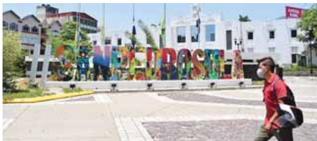
Normalmente, el primero de septiembre se realizaban actos de inauguración del mes patrio en la comuna sampedrana, por ahora fueron suspendidas.

Autoridades municipales anunciaron que este año no realizará actividades presenciales en ocasión del 199 Aniversario de Independencia Patria, debido a la pandemia de la COVID-19, por lo que instó a los vecinos a enaltecer a Honduras y rendir tributo a nuestros próceres desde casa compartiendo en familia y siguiendo las medidas de bioseguridad.