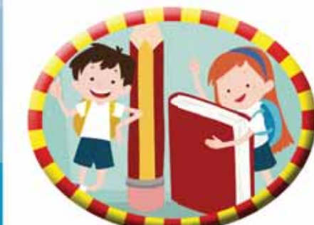
Estás dispuesto a ayudar a tus compañeros.