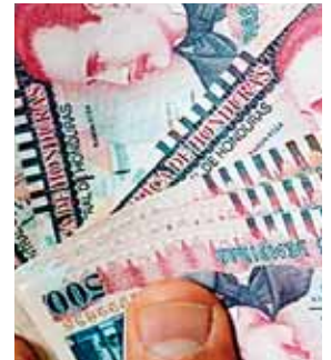
L282,405 millones suma el presupuesto del 2020 en vigencia.

“Tenemos que hacer inversiones en salud, ampliar los servicios de los hospitales públicos, contratar más recursos humanos y adquirir equipo biomédico y en educación tenemos un reto enorme porque el regreso progresivo a las clases presenciales