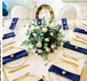
Acontecimientos se encargó de la decoración del recinto en tonos azul navy, dorado e ivory con la temática greenery.