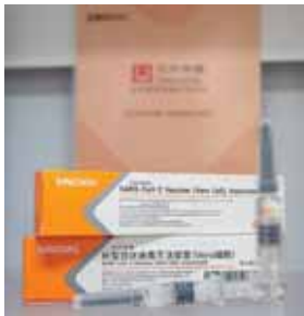
Rusia ha anunciado que ya tiene lista una vacuna y que se prepara para vacunar a su población.

China tiene avanzadas las investigaciones de dos vacunas que no han terminado la fase 3 de los ensayos clínicos, pero ha empezado a vacunar a lo que considera trabajadores esenciales.