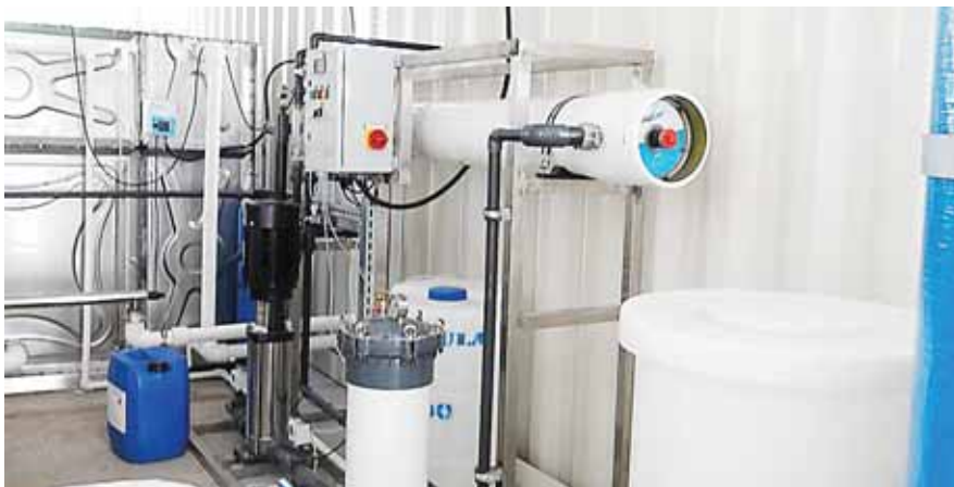
Los hospitales tienen filtros Hepa de alta eficiencia, para prevenir contaminación dentro del recinto. Succiona aire contaminado en las salas UCI, lo desinfecta y lo reenvía en forma de aire acondicionado limpio.

Hospitales móviles cuentan con equipo tecnológico de última generación, camillas, UCI y plantas de oxígeno, entre otras bondades.