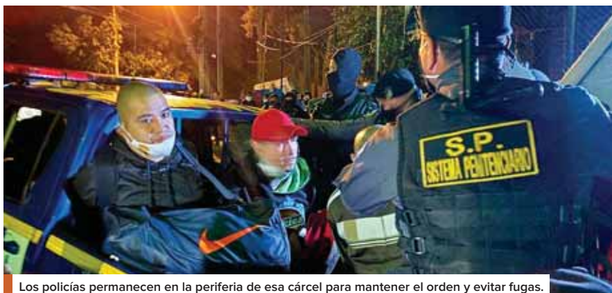
Los policías permanecen en la periferia de esa cárcel para mantener el orden y evitar fugas.