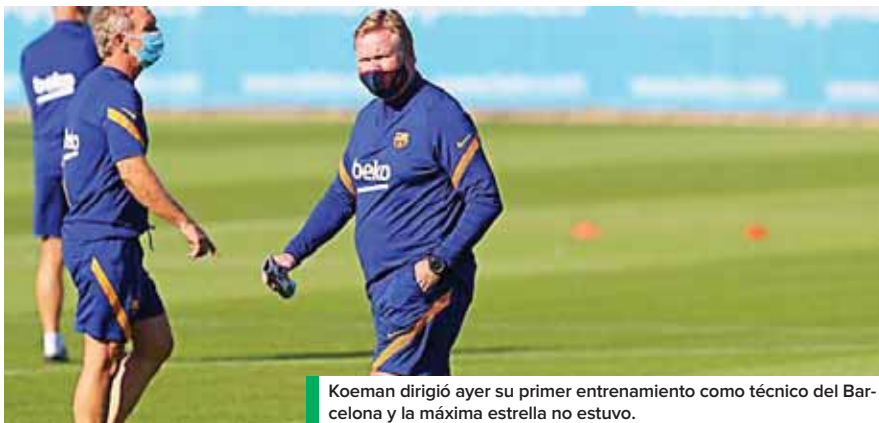
Koeman dirigió ayer su primer entrenamiento como técnico del Barcelona y la máxima estrella no estuvo.

presente temporada, interrumpida varios meses por la pandemia de coronavirus, es un argumento para dar validez a la cláusula en agosto, según su equipo jurídico.