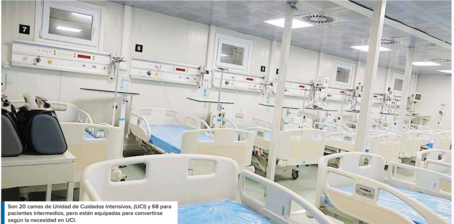
Son 20 camas de Unidad de Cuidados Intensivos, (UCI) y 68 para pacientes intermedios, pero están equipadas para convertirse según la necesidad en UCI.