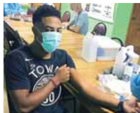
El Platense sometió a los jugadores a pruebas de COVID-19

Los rojos estarían arrancando en cancha desde este miércoles en la cancha Atlántida pues la sede del club es utilizada para atender la emergencia de salud.