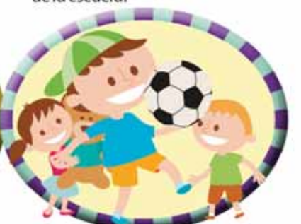
Siempre destacas entre tus otros compañeros, tus compañeros se mueven por tus buenas ideas y acciones.