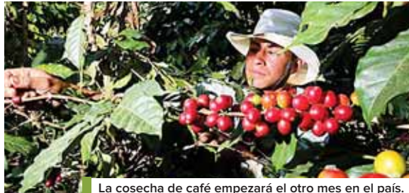
La cosecha de café empezará el otro mes en el país.

“Todo eso nos llena de optimismo, aunque lógicamente lo de la COVID-19 nos preocupa, porque sabemos que viene de las grandes ciudades a las ciudades intermedias