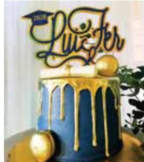
Maritza Bakery elaboró el pastel con los detalles de graduación.