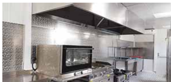
Hay equipo de lavandería, secadora y desinfección de ropa de cama y ropa del personal médico.