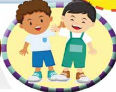
Desarrollas tu capacidad para hacer amistades.