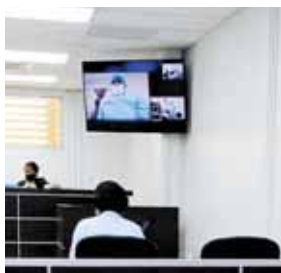
El fallo se logró en una audiencia virtual mediante un procedimiento abreviado.

llevarle dinero y cuando lo dejó ingresar a la vivienda la agarró a la fuerza. El detenido fue puesto a la orden de las autoridades correspondientes para que se le continúe el proceso correspondiente.