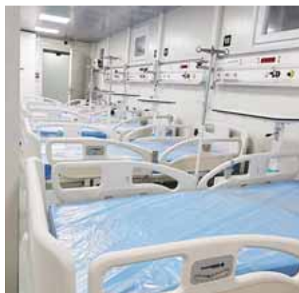
Cuenta con 91 camas, de las que 3 se utilizan para triaje y las otras 88 como unidades de alta dependencia y de cuidados intensivos.