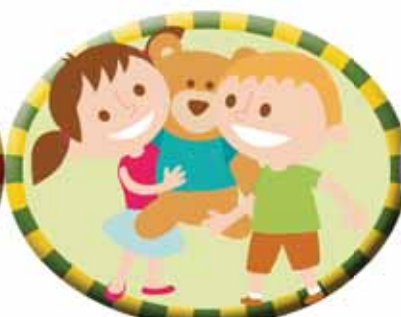
Tienes facilidad para convencer.