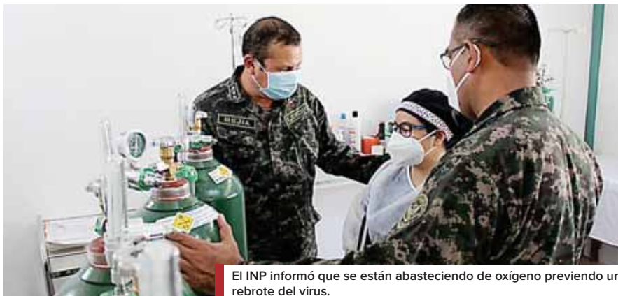
El INP informó que se están abasteciendo de oxígeno previendo un rebrote del virus.