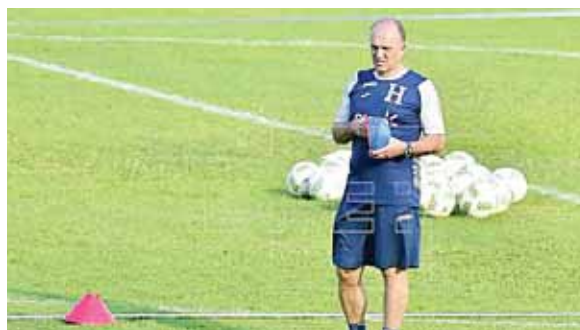
Coito ha sido duramente criticado por mantenerse en su país.

rará a competir hasta marzo del próximo año con las semifinales de la Liga de Naciones y a mitad de año tienen que cumplir cuatro partidos eliminatorios.