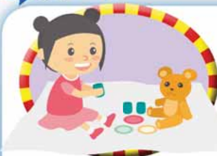
Cuentas con un alto nivel de autoestima.