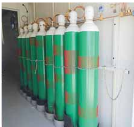
El hospital móvil cuenta con su respectiva unidad generadora de oxígeno, y cada módulo tiene su propia caja de panel de distribución de gas que distribuye los gases al lecho del paciente.