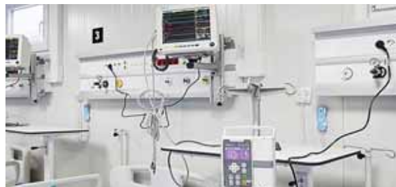
Además, las salas están equipadas con paneles de gases para UCI y monitores de signos vitales, hay 86 en este hospital.