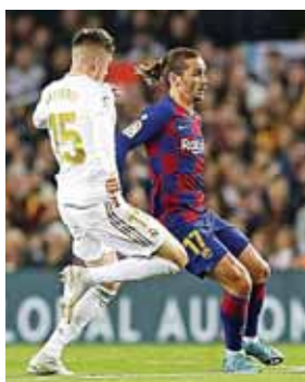
Barcelona y Real Madrid ya tienen fecha para encararse en la liga.

Por primera vez desde el establecimiento de la puerta cerrada en marzo, algunos estadios alemanes recibirán público a mediados de septiembre en la primera ronda de la Copa de Alemania, confirmó la Federación Alemana de Fútbol (DFB).