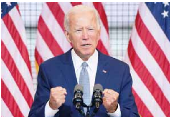
El candidato presidencial demócrata abordará la multitud de crisis que afectan actualmente a Estados Unidos.

El candidato presidencial demócrata abordará la multitud de crisis que afectan actualmente a Estados Unidos, incluida la pandemia del