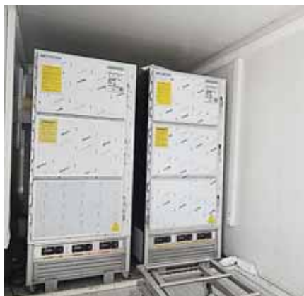
Entre otras cosas, estos hospitales móviles también cuentan con su propia morgue.