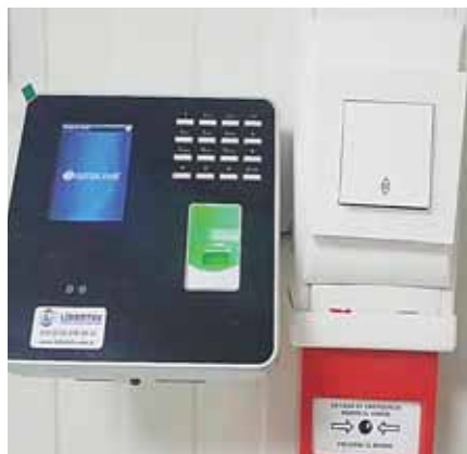
Todas las puertas tienen sensores y claves de acceso, entre ellas las de la UCI.