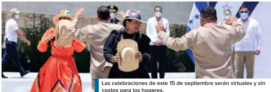
Las celebraciones de este 15 de septiembre serán virtuales y sin costos para los hogares.

Hernández expuso que “ante el peligro y ante el riesgo enorme de esta pandemia, muchos miles de hondureños se han sentado a estu-