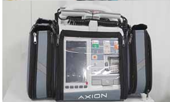
También cuentan con equipo resucitación, equipos de rayos X, dos móviles y uno estacionario.

Apuntó que “los compromisos adquiridos en la administración anterior (de Invest-H) van a ir cumpliéndose, pero no vamos a descuidar lo que viene, que es la reactivación de la economía. Los recursos van a ser utilizados en el desarrollo del agro y el desarrollo de proyectos carreteros”.