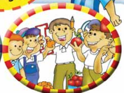
Transmites seguridad en tus palabras y en la forma de actuar dentro o fuera de la escuela.