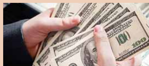
Según el Banco Mundial, 2019 fue un año récord para las remesas a nivel global, con 714,000 millones de dólares enviados.

Datos oficiales indican que el narcotráfico y las pandillas Mara Salvatrucha y Barrio 18, dedicadas a la extorsión y el sicariato, provocan casi la mitad de las 3,500 muertes violentas que ocurren cada año en Guatemala.