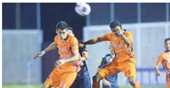
Debido a que muchos clubes no pueden llegar adecuadamente en la parte física, tendrán opción a cinco cambios.

La misma Fenafuth ordenó en su momento que era obligatorio establecer en las bases lo anterior.