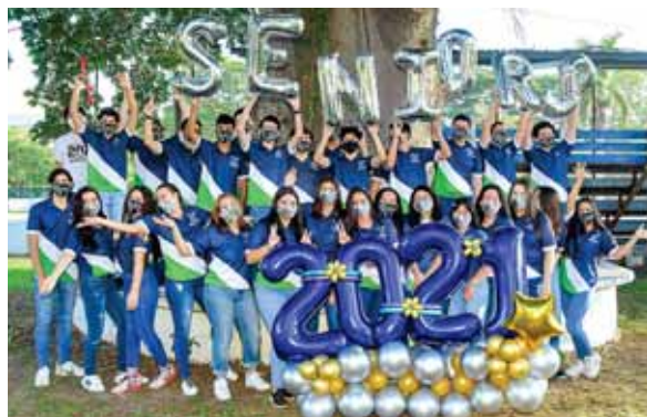
La generación 2021 de Seniors de la Academia Americana.

45 son los jóvenes que serán el ejemplo a seguir por los juniors de la institución, durante este año educativo.