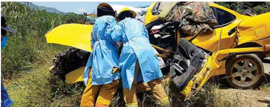
Elementos del Cuerpo de Bomberos acudieron al lugar, donde realizaron trabajos de recuperación de los cadáveres.