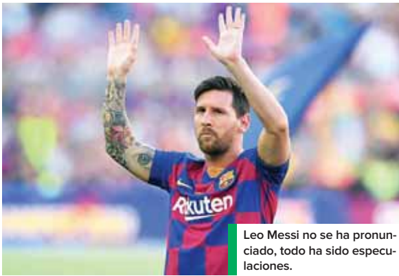
Leo Messi no se ha pronunciado, todo ha sido especulaciones.

El argentino no acudió ayer a las pruebas PCR y la Liga da la razón al cuadro azulgrana.