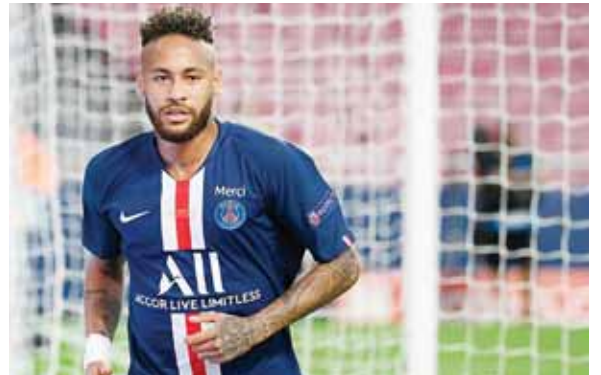
El PSG pagó 222 millones de euros por Neymar, más de 260 millones de dólares, para ficharlo desde el Barcelona FC en 2017.

La revista Forbes estima las ganancias de Neymar para este año en 95.5 millones de dólares, incluyendo patrocinios.