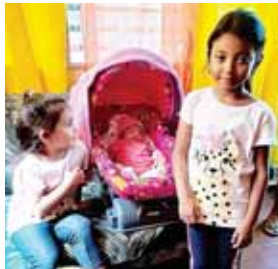
Las niñas, días antes del fatal accidente donde perdieron la vida.

Las imágenes revelan cómo el conductor de la rastra, que llevaba el derecho de vía, quiso esquivar la camioneta, pero fue a impactar con el muro de una escuela