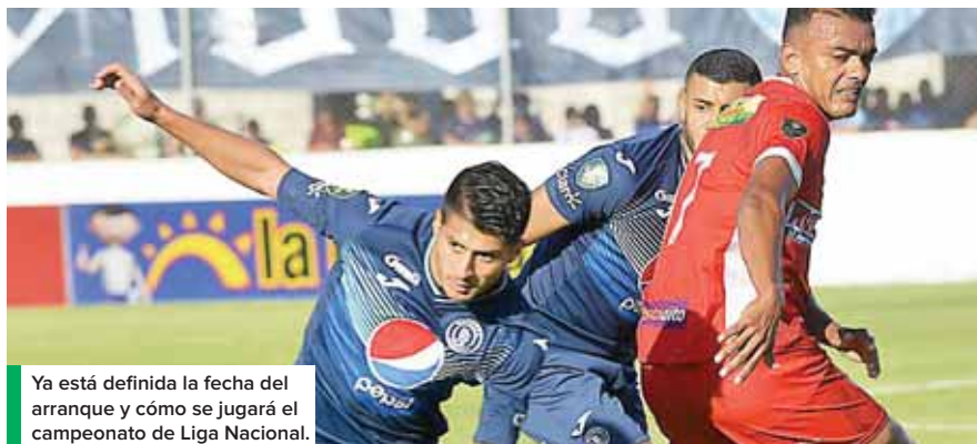
Ya está definida la fecha del arranque y cómo se jugará el campeonato de Liga Nacional.