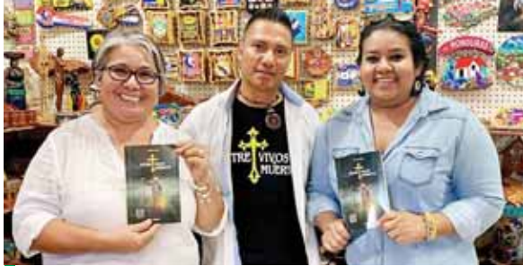
Entre Vivos y Muertos ha tenido un auge en ventas, a pesar de la pandemia que ha generado crisis económica en todos los sectores.