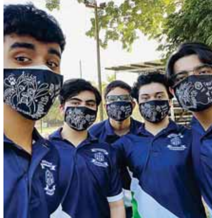
Los estudiantes compartieron una especial mañana sin olvidar las medidas de bioseguridad.