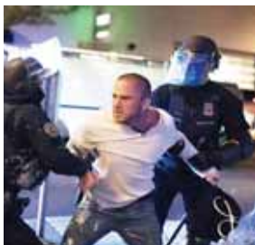
Portland ha sido epicentro de las protestas del movimiento Black Lives Matter (Las vidas negras importan).

Después de la indignación generalizada que causó en mayo la muerte en Minnesota de George Floyd, un hombre negro asfixiado por un policía blanco, la ira del movimiento antirracismo se reavivó luego de que Blake, un afroestadounidense de 29 años, recibió varios tiros hace una semana por parte de un policía que intentaba arrestarlo. Aunque sobrevivió, probablemente quede parálítico.