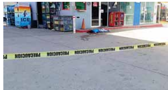
El cuerpo del ahora fallecido quedó cerca de la entrada de la gasolinera.