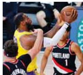
Los Ángeles Lakers conocerán hoy su rival en semifinales, puede ser Oklahoma o los Houston Rockets.

Por su parte, los Bucks derrotaron por 118 a 104 a los Orlando Magic, clasificando 4-1 a las semifinales de la Conferencia Este de la NBA, en las que enfrentarán a los Miami Heat.