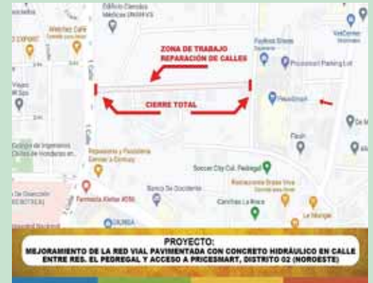
Para mejor ubicación, este es el mapa que muestra la calle que será cerrada a partir de este día hasta el 6 de septiembre.