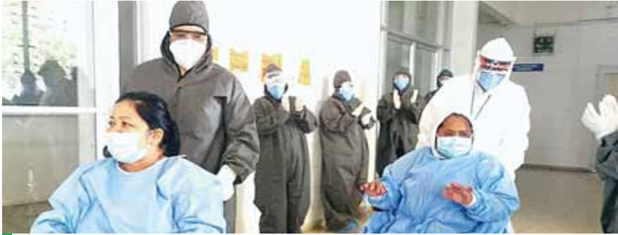
Las personas que han sido recuperadas de la COVID-19 en la Unidad Estabilizadora Municipal, se van ando gracias a Dios y al personal médico.