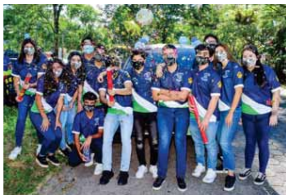
Los seniors realizaron su recorrido con autos decorados para la ocasión.