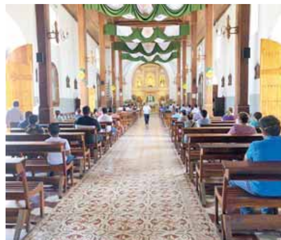
Desde marzo, El Salvador acumula 25,635 contagios de coronavirus, con 713 fallecidos.

El jefe de Estado insistió en que la iniciativa va dirigida a un sector de la población que “siendo pequeño, de 5 mil, 10 mil, o 20 mil (personas), sigue contagiado y a ellos va esta campaña”. EFE