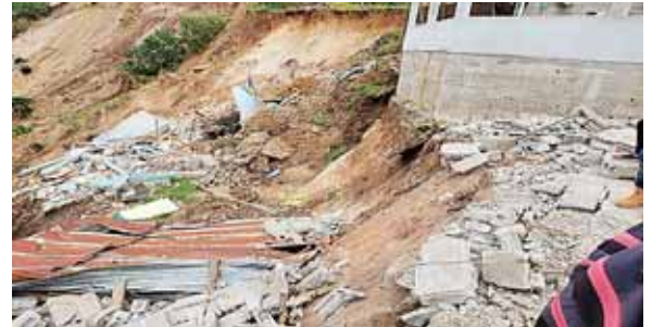
Para atender durante la emergencia a las personas que resultaron afectadas las autoridades rehabilitaron unos espacios que sirven como albergues.

Asimismo, personal técnico realizó una inspección de daños en la comunidad La Providencia, municipio Ojos de Agua, previo a la lle-