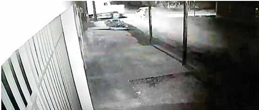
El vídeo que trascendió muestra el momento en el que la camioneta impactó con la rastra.

LOS PADRES SE MANTIENEN DELICADOS DE SALUD