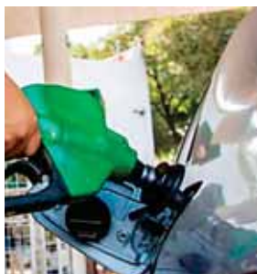
Costo del GLP doméstico y kerosene se mantiene.

La Fundación Panamericana para el Desarrollo (PADF, por sus siglas en inglés), es una organización no gubernamental internacional creada en 1962 y afiliada a la Organización de Estados Americanos (OEA), que trabaja en la región de América Latina y el Caribe para mejorar las vidas de las poblaciones más vulnerables y excluidas. Su misión es ayudar a los individuos y comunidades en las Américas a lograr progresos sustentables, económico y social, fortalecer a sus comunidades y a la sociedad civil, promover la participación democrática y la inclusión, desarrollar acciones para la promoción de la paz, la consolidación de sistemas efectivos de justicia, preparar y brindar respuestas ante desastres naturales y otras crisis humanitarias.