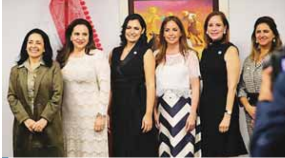
Honduras, Argentina, Belice, Brasil, Colombia, Ecuador, Panamá y Paraguay ya confirmaron su participación.

Asimismo, se contará con la participación del director de la División de Población del Centro Latinoamericano