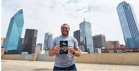
La novela cruzó fronteras y llegó hasta Dallas Texas, ya que varios lectores lo pidieron desde Estado Unidos.