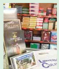
El libro está disponible en la Librería Cultura.