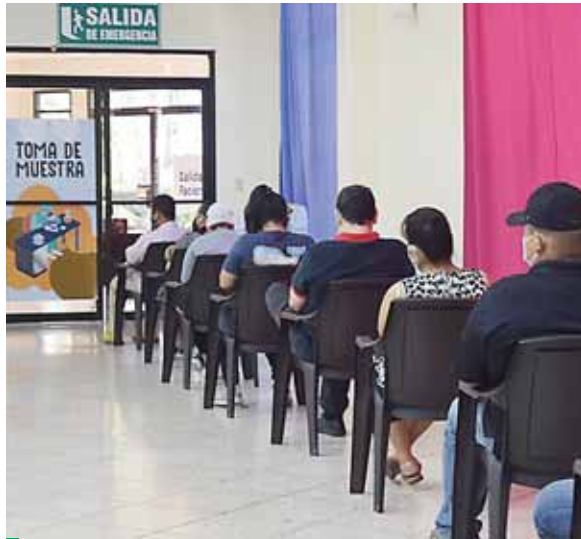
Las autoridades instan a la población para que, al presentar el primer síntoma, acudan a los centros de triajes en la ciudad en Expocentro, Infop y Colegio de Ingenieros.

“Estamos permanentemente llamándole la atención a la ciudadanía porque estamos detectando en nuestras gráficas y datos estadístico, que la población la estamos encontrando en las viviendas y a los triajes, no está llegando y eso nos demuestra que si hay un contagio alto de COVID-19 pero que no quiere acudir a estos centros. Le pedimos a la población que