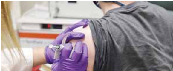
De acuerdo con las últimas cifras oficiales del Ministerio de Salud, el número de casos se elevó a 639,435 positivos a la enfermedad.

De acuerdo con las últimas cifras oficiales del Ministerio de Salud, el