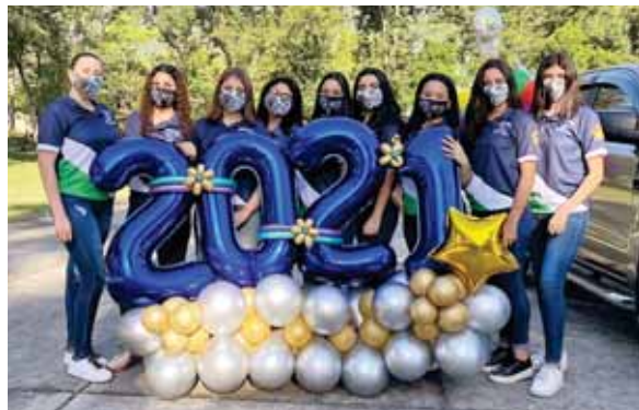
Las jovencitas aprovecharon para capturar muchos recuerdos de su gran día.