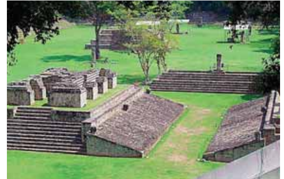
Los prestadores de servicios turísticos ya tienen los protocolos de bioseguridad que practicarán cuando reabran.

El portavoz del Cuerpo de Bomberos de Honduras, Óscar Triminio, informó que unos 400 barrios y colonias de la capital corren riesgo de deslaves y derrumbes durante la temporada lluviosa. Ese personal alertó a la población a tomar las medidas de prevención.