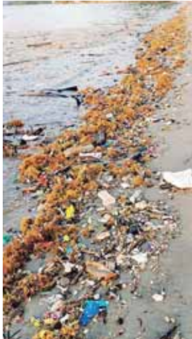
La mayoría de residuos se filtra por debajo de la biobarda que no tienen la capacidad para retener tanta basura.

Añadió que esa filtración de residuos de basura que pasan por debajo de la biobarda es la que se está recibiendo en Omoa, pero se cuenta con un equipo municipal que inmediatamente recolecta