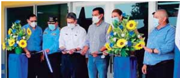
Las autoridades al momento en que estaban realizando el corte de cinta en la inauguración.

El evento de inauguración se desarrolló ayer, en presencia del Presidente de la República, Juan Orlando Hernández, autoridades de la Secre-