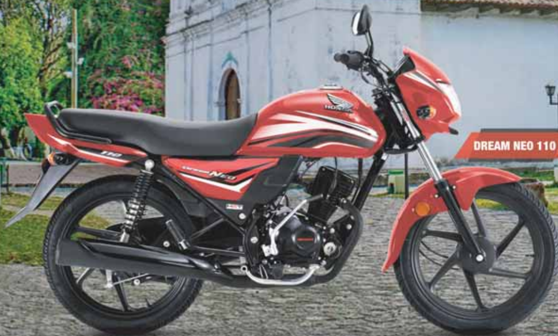
DREAM NEO 110