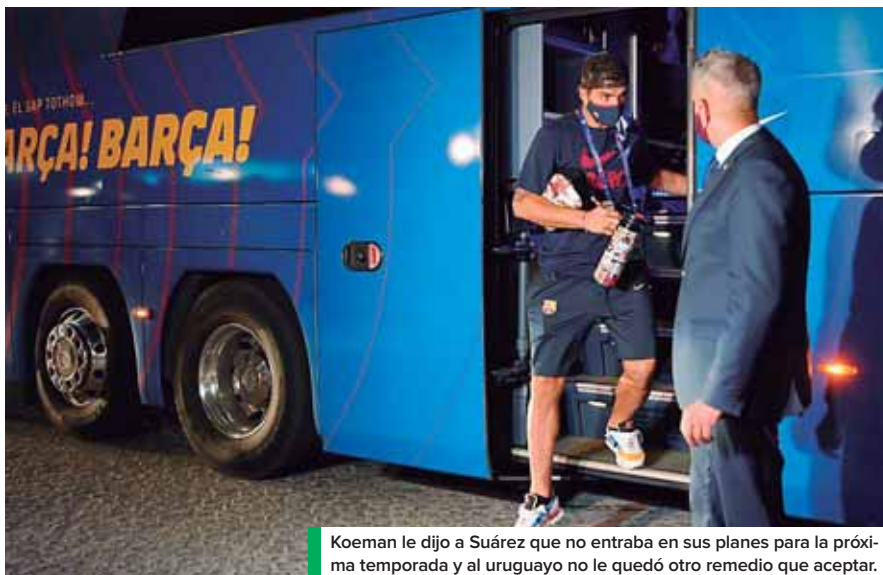
Koeman le dijo a Suárez que no entraba en sus planes para la próxima temporada y al uruguayo no le quedó otro remedio que aceptar.

BARCELONA. Cruyff fue uno de los entrenadores de quien aprendí más”, reconoció el nuevo entrenador del FC Barcelona, el neerlandés Ronald Koeman, en una entrevista difundida por la televisión del club, Barça TV.