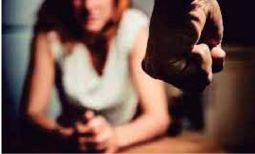
La mayoría de las mujeres que llegan a los juzgados a interponer denuncias por violencia doméstica presentan golpes en el rostro.

“La mayor parte de las denuncias vienen de los sectores de la Ri-