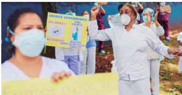
La protesta de las enfermeras se produjo el mismo día en que el Gobierno flexibilizó las medidas de cuarentena.

Según Reyes, en los últimos días han muerto tres enfermeras por el nuevo coronavirus, mientras otras