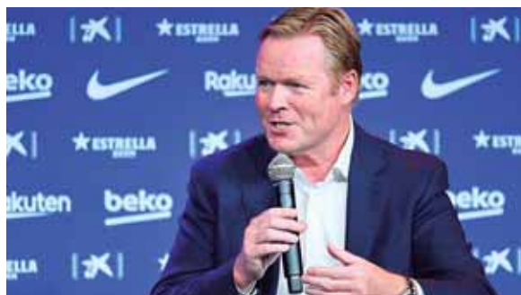
El DT holandés busca formar un proyecto con gente más joven en el Barcelona.

Ambos apenas conversaron un minuto, el técnico le comunicó sus intenciones, el futbolista las escuchó y se despidieron sin entablar mayor diálogo.