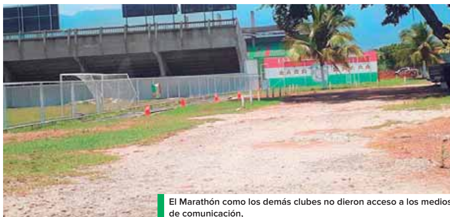
El Marathón como los demás clubes no dieron acceso a los medios de comunicación,