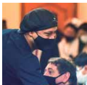
Ronaldinho y Roberto viajarán en vuelo privado cuanto antes a su ciudad de residencia en Brasil.

Usain Bolt, ocho veces campeón olímpico, dijo que está en cuarentena a la espera de tener resultados de una prueba de coronavirus. “No tengo síntomas, me voy poner en cuarentena y esperaré a la confirmación para ver cuál es el protocolo”, afirmó. “Esto solo es para que la gente lo sepa”.