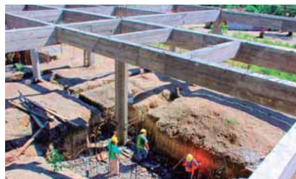
El proyecto avanza paso a paso, cumpliendo con las medidas de bioseguridad.

“En este tiempo cuando más se necesita ese macro distrito que están construyendo ahí, para mí es algo muy importante para todo