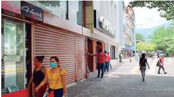
Empresarios piden amnistía tributaria para no pagar multas y recargos por intereses no pagados durante la pandemia por la COVID-19.

“El contribuyente no debería estar pagando multas y recargos, debería estar pagando solo el capital adeudado”.