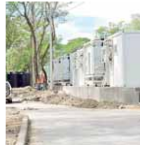
La entrega del hospital de aislamiento móvil de San Pedro Sula a la Secretaría de Salud (SESAL) se realizará en esta semana.

En ese sentido, explicaron que las fechas de instalación de los cinco hospitales de aislamiento móviles dependerá del tiempo que duren los procesos de desembarque, inspección, desaduanaje y traslado a su ciudad destino.