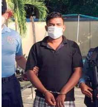
Al momento del arresto, uno de los sospechosos sufrió un accidente en su motocicleta y fue trasladado a un centro asistencial.

Al momento de su captura, y como indicio de su participación en el crimen, a ellos se le decomisó una motocicleta, color blanco/negro, sin placas, misma que es identificada como el medio en que se trans-