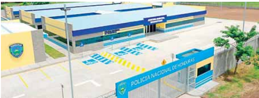
Las instalaciones son modernas y amplias, lo que permitirá más y mejores servicios para esta población.

PRÓXIMAMENTE EMITIRÁN LICENCIAS Y OTROS SERVICIOS EN ESTA CIUDAD