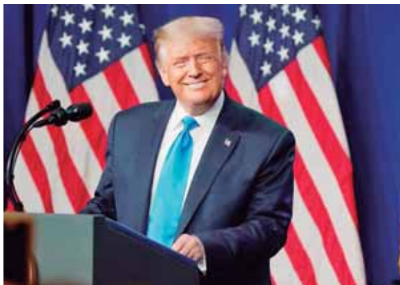
La candidatura del presidente fue respaldada de forma unánime por los 2,550 delegados republicanos.

Trump y al vicepresidente, Mike Pence, como candidatos a la Presidencia y la Vicepresidencia del país, los republicanos suspendieron las actividades del primer día de convención.