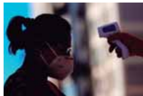
Recomiendan que los pacientes recuperados de la COVID-19 sigan llevando mascarillas y respetando la distancia social.

“Muchos creen que los pacientes recuperados de la COVID-19 tienen inmunidad contra las reinfecciones debido a que la mayoría desarrollaron una respuesta basada en anticuerpos neutralizantes en suero”,