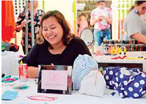
Más de 4,800 productos, en 16 categorías, los que están expuestos en las tres salas comerciales.

En esta ocasión, en el marco del mes de la familia, participan emprendedores en tres salas, una con productos y servicios ofrecidos por mujeres, otra de jóvenes y la tercera