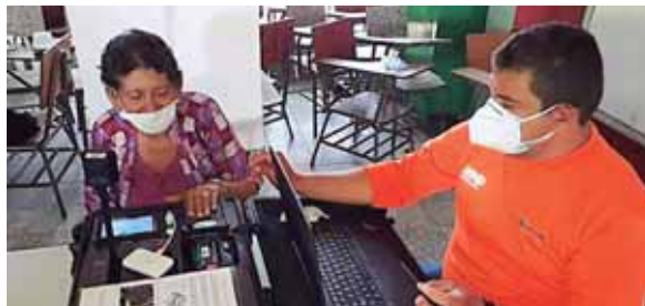
El proyecto está funcionando bastante bien desde el punto de vista de la reacción de la población.