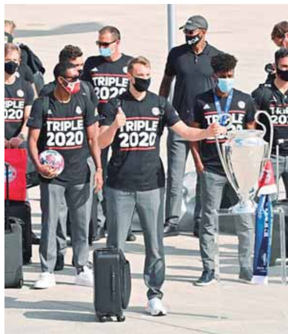
No hubo celebraciones en Múnich debido a la pandemia de COVID-19.