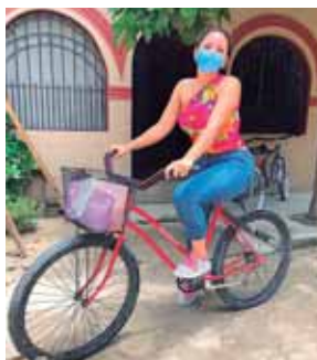
La joven emprendedora usa una bicicleta para vender algunos productos y realizar entregas.

Los diseños de cada prenda y la accesibilidad en los precios