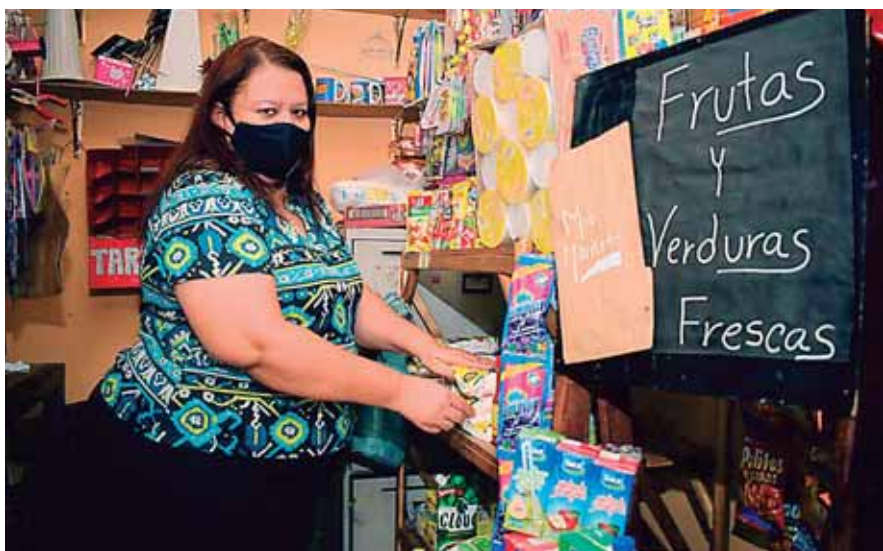
Ejemplo de coraje, superando los acontecimientos