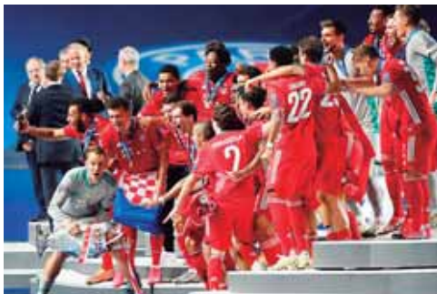
El gigante alemán cierra una gran temporada con tres títulos.

Y a la cuarta fue la pérdida para Keylor Navas. Tras ganar tres Champions como titular con el Real Madrid (2016, 2017 y 2018), el arquero tico no pudo ampliar su racha en su primera temporada con el PSG.