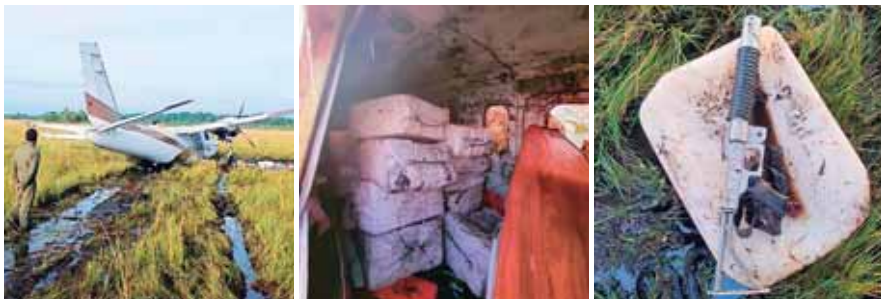
La aeronave interceptada era procedente de Venezuela y supuestamente era de matrícula mexicana. La droga y las armas decomisadas fueron requisadas por fiscales del MP.

LA ACCIÓN SE EJECUTÓ MEDIANTE ENFRENTAMIENTO