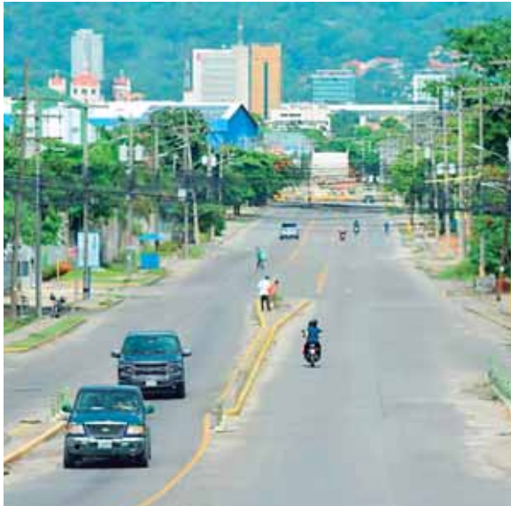
El Bulevar del Este, de los más concurridos por la población, se visualizó sin mucha afluencia de automóviles.

La Mesa Multisectorial, dando paso a la apertura inteligente de la economía en sus diferentes fases, decidió poner en marcha el plan que busca paliar el impacto financiero que los empresarios y emprendedores de los diferentes rubros han tenido, y que esperan poco a poco ir recuperando. Al igual que resto de la semana, el horario de atención será de 6:00 a.m. a 8:00 p.m.