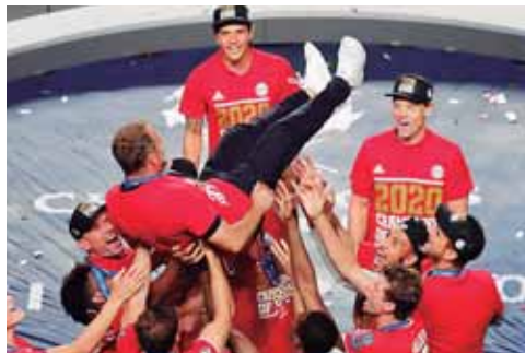
Hansi Flick en diez meses conquistó Bayern y sus jugadores lo reconocen.