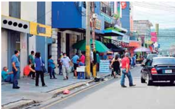
Los comercios de la tercera avenida fueron los que más visitas recibieron, sin embargo, no fue la que esperaban.