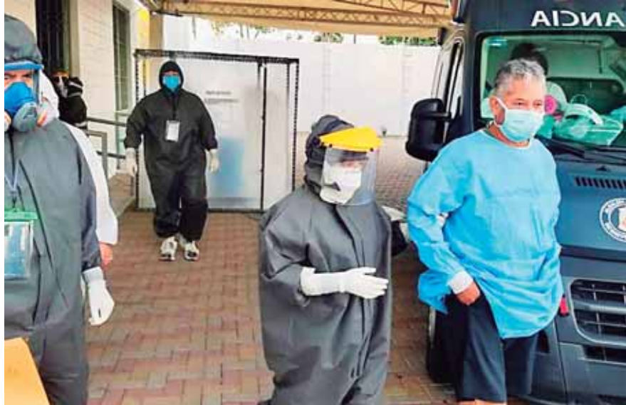
Los pacientes y familiares se van agradecidos por las atenciones recibidas en la Unidad Estabilizadora.

“Gracias a la Corporación Municipal, al señor alcalde, a todo el equipo de salud, que Dios me los bendiga a todos.