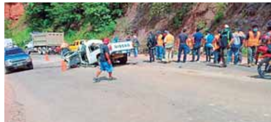
Los agentes de la Secretaría de Seguridad investigarán cuáles fueron las causas del accidente.