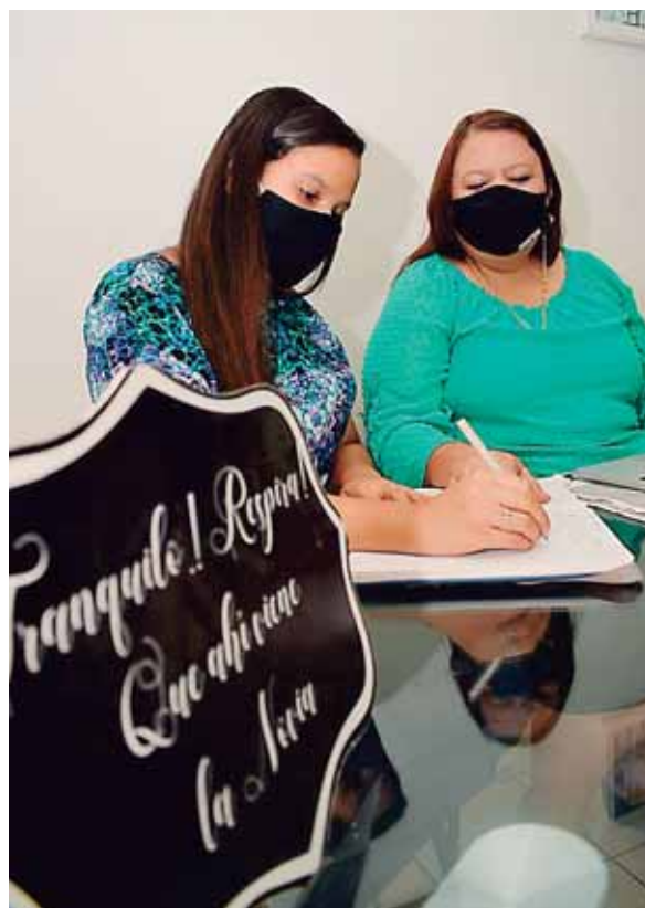
Ambas se sienten felices porque siempre tienen su agenda ocupada.