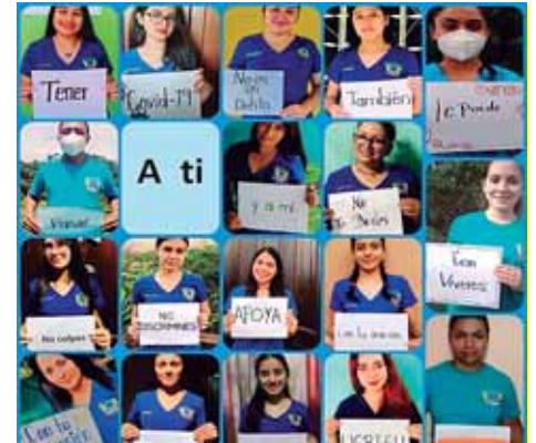
Una de las actividades virtuales realizadas durante la pandemia en la asignatura de "Psicología de la sociedad".