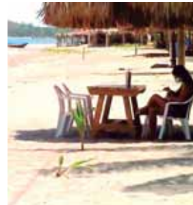
Este fin de semana las playas de Tela lucieron vacías, empresarios esperan que mejore la situación.