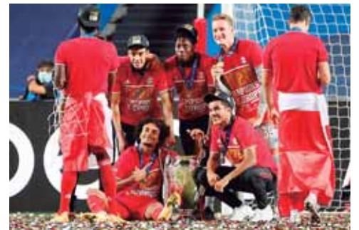
Quizás al principio no tenía muchos créditos el cuadro alemán de conseguir el Copa, pero sorprendió.