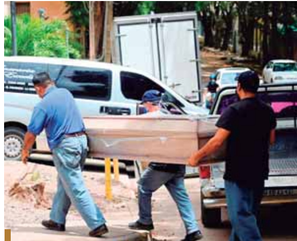
Las proyecciones del 2020 es registrar más de 30 mil defunciones.

Sin embargo, esta tarea está paralizada desde que asumieron las nuevas autoridades del RNP. De momento en los cuadros estadísticos del organismo registral como del Instituto Nacional de Estadísticas y Censos, el sub registro de defunciones anda por el 16 por ciento con relación al total de la pobla-