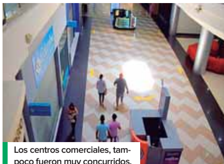
Los centros comerciales, tampoco fueron muy concurridos.