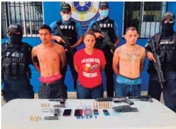
Los detenidos son presuntos miembros de la MS-13 y habrían ultimado a los hermanos Chirinos.

Dicha hipótesis se reforzó cuando, varias horas más tarde, la Policía Nacional detuvo a tres individuos supuestos integrantes de la Mara Salvatrucha 13 (MS-13) y se les remitió a la Fiscalía para que respondan por