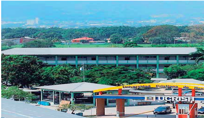
La UCRISH tiene siete sedes regionales en diferentes ciudades. El campus principal está en San Pedro Sula.

La UCRISH desde hace varios años venía implementando una modalidad "semipresencial con mediación virtual" en cuatro carreras impartidas en siete centros regionales. Pero en San Pedro Sula, que es la sede principal, esas mismas cuatro carreras, más otras cuatro, eran 100 por ciento presenciales. Las carreras "semipresenciales con mediación virtual" implicaban que un sábado se presentaban los estudiantes a clases y, el siguiente, atendían actividades a