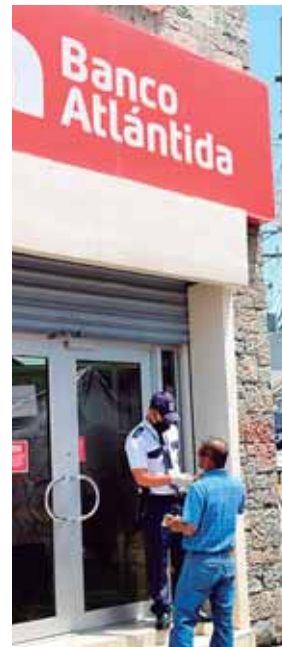
Las agencias bancarias atendieron durante los dos días, sin embargo, solo funcionaron algunas de ellas.