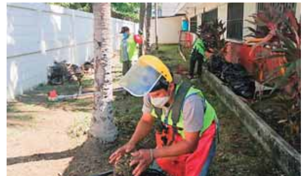
Los trabajos se llevaron a cabo en el instituto José Trinidad Reyes y Primero de Mayo, así como en la escuela Soledad Fernández.

El operativo de fumigación y los labores de limpieza se llevaron a cabo con el propósito de contribuir a proteger la salud de los vecinos que asistirán a estos lugares a efectuar tan importante trámite.