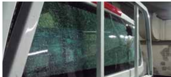
Tras lanzar piedras contra los policías, una patrulla quedó dañada.

El ahora capturado fue remitido a la Fiscalía de turno para que se continúe con el proceso legal correspondiente.