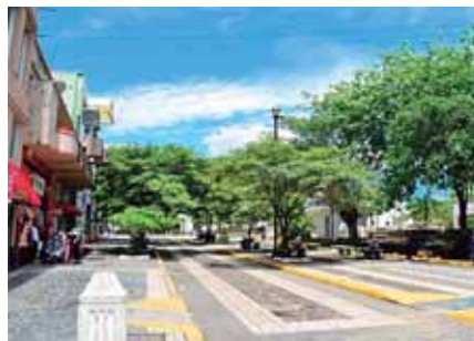
La zona peatonal lució vacía también.

El rubro de la comida rápida fue uno de los establecimientos que más visitaron los sampedranos.