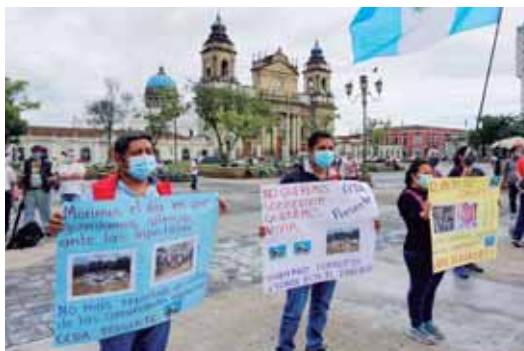
La gente no está conforme con el trabajo de Giammattei.

Días después que se registra el primer caso de coronavirus