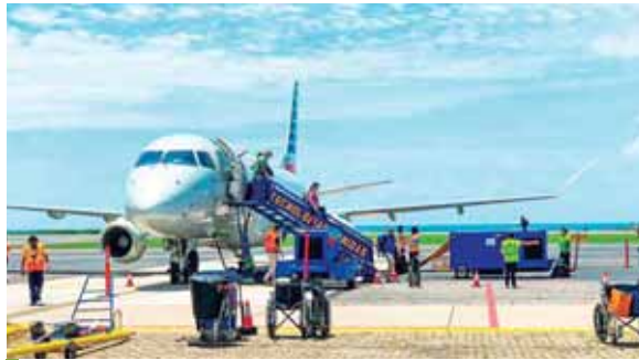
Los 67 turistas internacionales fueron recibidos por la ministra de Turismo, Nicole Marrder.

“Al final, el turismo es eso, nuevas opciones de esparcimiento a fin de retomar lo que teníamos y que habíamos perdido desde hace un tiempo