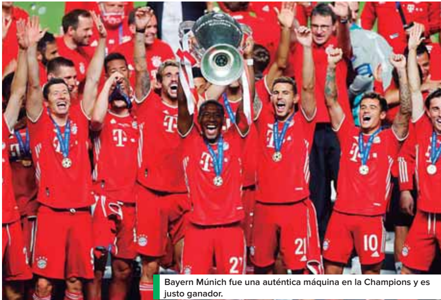
Bayern Múnich fue una auténtica máquina en la Champions y es justo ganador.

LISBOA. El Bayern Múnich conquistó su sexta Liga de Campeones tras imponerse por 1-0 al París Saint-Germain, en Lisboa, en una final disputada a puerta cerrada para clausurar una temporada marcada inevitablemente por la pandemia del nuevo coronavirus.