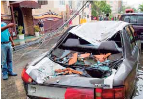
Los dos ciclones pueden impactar en un periodo de 48 horas a partir de hoy en el estado de Luisiana.

El gráfico muestra que Laura dejará Cuba como muy pronto mañana, para adentrarse en aguas del Golfo de México y dirigirse al sur de Estados Unidos convertida en huracán. Un ligero giro hacia el oeste