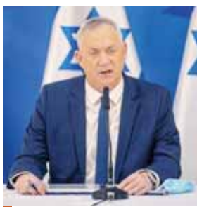
El primer ministro, Benjamin Netanyahu, subrayó que esto no significaba que Israel abandonase su intención de anexar algún día el Valle del Jordán.

El establecimiento de lazos diplomáticos entre Israel y aliados de Oriente Medio de Washington, como las monarquías del Golfo, ha sido central en la estrategia de Trump en la re-