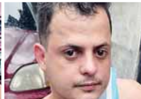
Según información los detenidos son miembros activos de la Pandilla 18.

guridad con los respectivos distintivos.