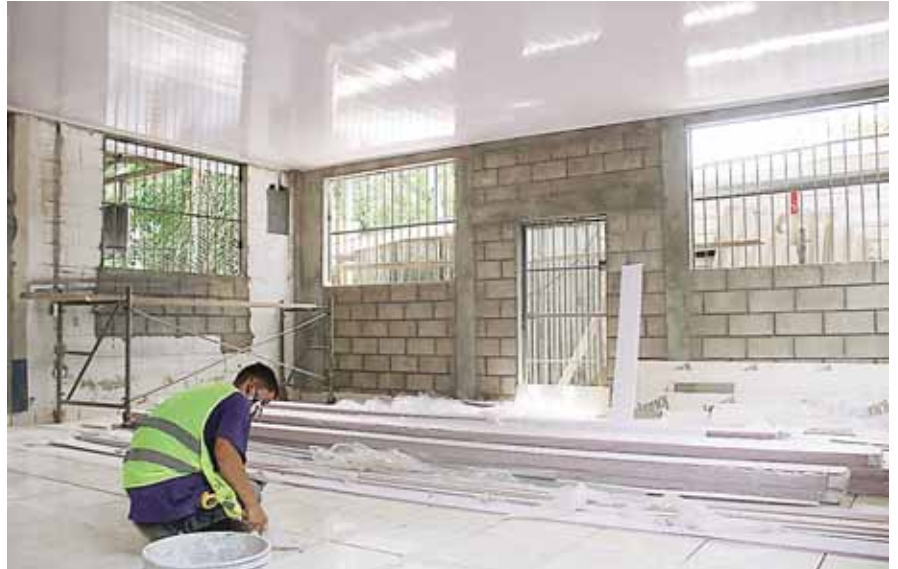
Los estudiantes de este centro educativo retornarán recibiendo clases en mejores condiciones.

La próxima semana se continuará con la instalación de luminarias y cerámica de piso,