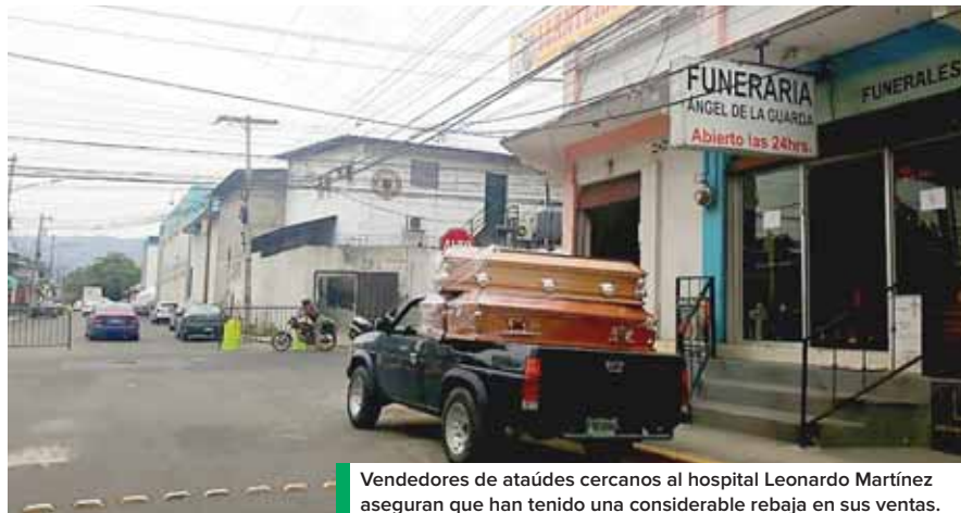
Vendedores de ataúdes cercanos al hospital Leonardo Martínez aseguran que han tenido una considerable rebaja en sus ventas.