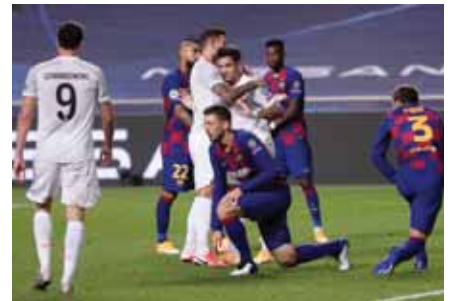
Coutinho entró y marcó un doblete, pero no celebró.