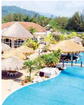
Los propietarios de algunos balnearios del país aseguran que los lugares cuentan con los espacios necesarios para el distanciamiento social.

“Estamos viendo que la pandemia nos ha dejado ya una pobreza y no esperamos que la situación económica también nos genere otra pandemia que sea