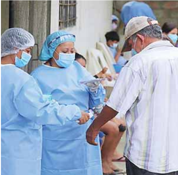
Durante estas intervenciones, se han detectado más de 1,600 sospechosos de COVID-19.