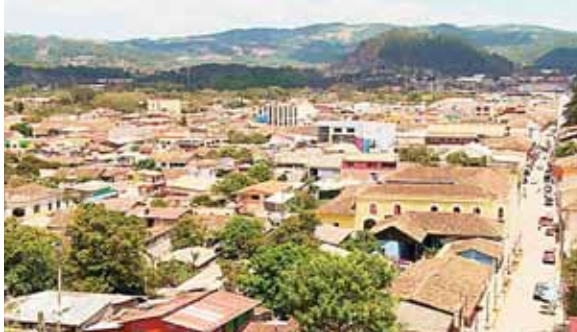
Los jóvenes de la zona de Intibucá disfrutaron de estas festividades, aunque este año ha sido diferente de manera virtual.

Asimismo, se ha realizado una fuerte promoción de los nuevos emprendedores jóvenes del municipio a través de entrevistas publicadas en los redes sociales y anuncios publicitarios en la localidad. “Ahora nos toca adaptarnos y aprender a convivir con esta situación y me siento muy