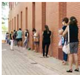
Desde que en julio aumentaran los contagios, cada región había tomado medidas.

el país, España, que lidera en Europa occidental el número de infectados con casi 343 mil, alcanzó una media de 111 casos por 100 mil habitantes en los últimos catorce días, frente a los 33.6 en Francia y 17 en Reino Unido.