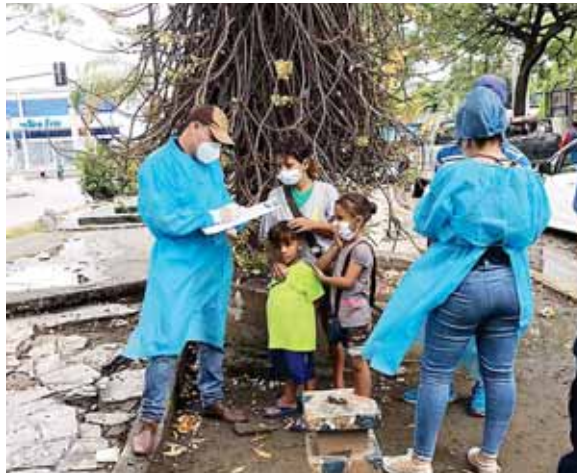
Las madres fueron sorprendidas por Dinaf y otras instituciones que realizaron el operativo en varias calles de la ciudad.

Villalvir expresó que el fenómeno de la mendicidad ha tenido un incremento como producto de