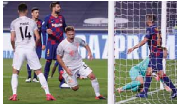
Ter Stegen fue ocho veces a sacar el balón al fondo de la red.

El Bayern Múnich protagonizó la exhibición del año en la Champions con cuatro goles en cada mitad ante el equipo de Lionel Messi.