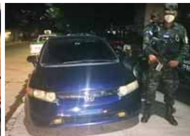
Los agentes le decomisaron a los detenidos indumentaria militar, armas y vehículos.