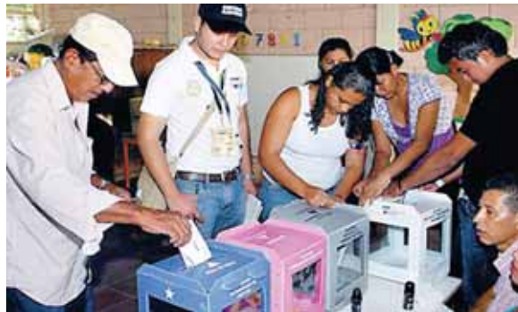
: Mencionó que nos es viable para el país pensar en este mecanismo actualmente, por la emergencia sanitaria.

No obstante, dijo que es un costo adicional que no se tenía planifi-