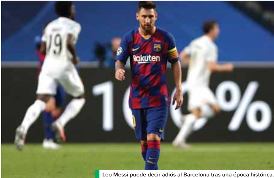
Leo Messi puede decir adiós al Barcelona tras una época histórica.

Bayern Múnich barrió 8-2 al Barcelona con un Leo Messi que no apareció en el juego.