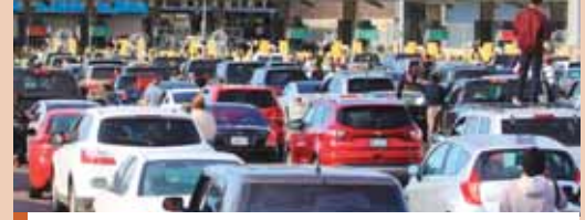
Las restricciones se mantendrán “en los mismos términos” desde su implementación el 21 de marzo.

Estados Unidos alcanzó ayer la cifra de 5.304.682 casos confirmados de COVID-19 y la de 168.318 fallecidos, de acuerdo con el recuento independiente de la Universidad Johns Hopkins. Este balance es de 60.444 contagios más que el jueves y de 1.289 nuevas muertes