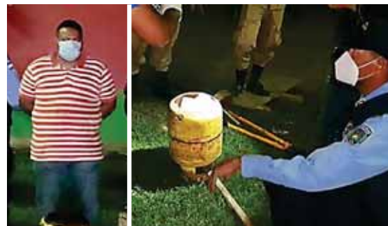
Uno de los detenidos, momentos después de haber sido capturado por elementos de la Policía Nacional. En los chimbos de almacenamiento de gas se encontró compartimientos ocultos, donde se encontró una fuerte suma de dinero.

En este caso, la FEDCV solicitó al Departamento de Patología Forense del Ministerio Público que se realizaran trabajos forenses en el sector de Sulaco, con el objetivo de exhumar varios cuerpos y recuperar elementos para cotejar las investigaciones, entre ellas ojivas, balas deformadas, muestras científicas y análisis criminalísticos.