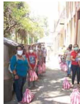
La entrega se realizó a las madres de familia de los niños beneficiados. En total fueron 145 familias las beneficiadas.

Esta iniciativa atiende a 210 niños y jóvenes de primer grado hasta el onceavo grado, en donde se les apoya con útiles escolares con su respectiva mochila, uniformes, libros para los alumnos de secundaria, clases de reforzamiento escolar en las clases de computación e inglés y también se les apoya con bolsa de alimentos para contribuir en la nutrición de ellos. De igual manera se les brinda atención médica y medicinas, y como un