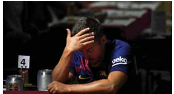
La afición azulgrana en el mundo no podía creer el desastre.