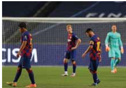
Decepción total en el Barcelona que puede comenzar a desarmarse.