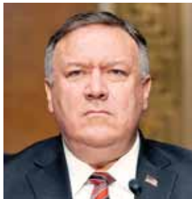
El secretario de Estado de EE.UU., Mike Pompeo, indicó que la declaración demuestra que Washington no está solo en su determinación.

Los países señalan que el proceso hacia el Gobierno de transición