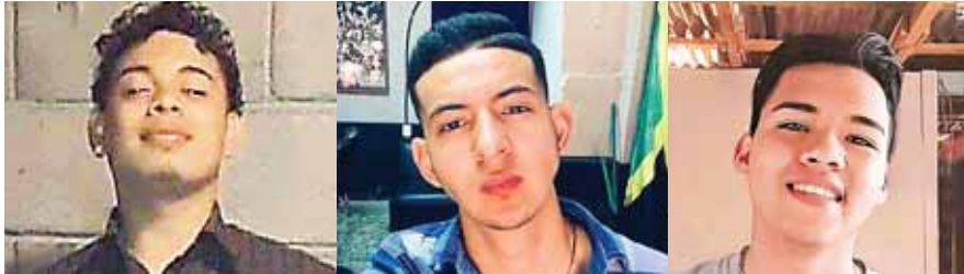
Dos de los jóvenes quedaron tendidos en la calle, mientras que otro fue trasladado al hospital, donde murió minutos después.

Las autoridades informaron que tres motocicletas fueron ubicadas