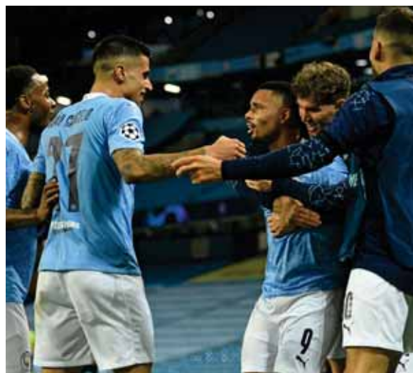
Guardiola le ha pedido a sus jugadores que no se confíen del Lyon.