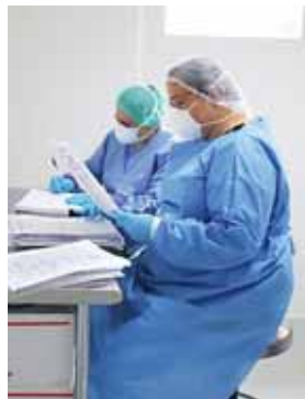
Este mismo mes iniciaría la construcción de estos dos laboratorios, con el objetivo de fortalecer el sistema sanitario del país.

“No queremos llegar a la situación de que renuncian los microbiólogos por falta de pago, por eso es importante de que se le dé la prioridad al personal de salud, en cuanto al pago”, indicó. En general, la Secretaría de Salud también ha contratado médicos generales, médicos especialistas, enfermeras profesionales, enfermeras auxiliares, todos para que trabajen en la mitigación de la COVID-19.