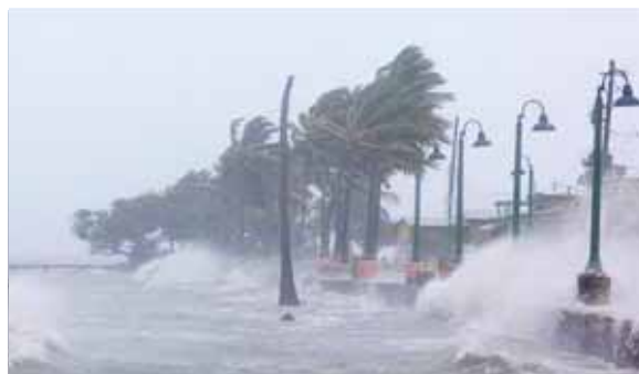
Debido a las actuales condiciones oceánicas y atmosféricas, "este año esperamos tormentas más fuertes y duraderas que el promedio", dijo Gerry Bell.

Los meteorólogos prevén que 2020 verá la formación de entre 19 y 25 tormentas con nombre, de las cuales entre siete y 11 ganarán fuer-