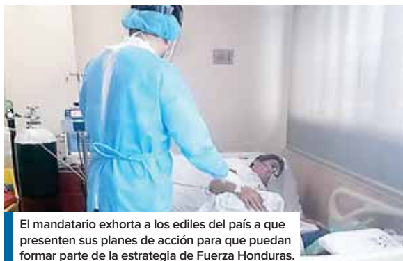
El mandatario exhorta a los ediles del país a que presenten sus planes de acción para que puedan formar parte de la estrategia de Fuerza Honduras.

“Ellos -siguió explicando Hernández- se comprometen a que, de