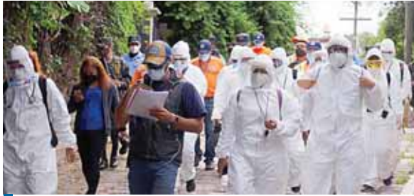
El departamento de Atlántida tiene alrededor del 4.9% de los casos totales de COVID-19 en Honduras.