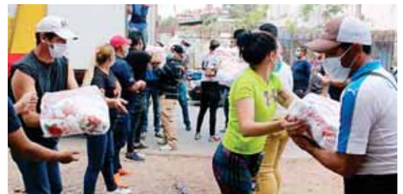
Honduras Solidaria atiende a sectores vulnerables del país.

Eso es lo que el Gobierno de la República, a través de la Secretaría de Gobernación, le ha dado a la Alcaldía Municipal de Cedros, para que no diga el alcalde que no ha recibido esos fondos, finaliza.