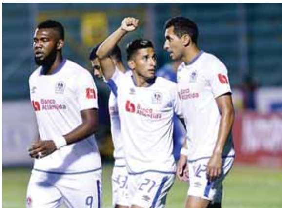
Olimpia entre septiembre y octubre debe jugar el partido frente al Impact Montreal y la Liga Concacaf, además del torneo local.

son los clubes clasificados a la Liga Concacaf, luego de su mejor puntuación a lo largo de la temporada 2019-20. El mayor inconveniente de los equipos es la falta de fecha para arrancar el campeonato en nuestro país. Incluso tampoco se ha establecido el inicio de la pretemporada y que los entrenadores consideran deben tener como mínimo 45 días de trabajo físico considerando que los jugadores llevan cuatro meses sin entrenamientos formales.