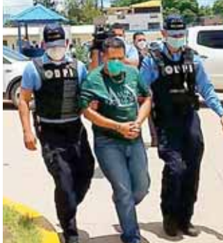
El ahora detenido fue trasladado al juzgado correspondiente para que responda por el delito que se le acusa.

El hecho criminal se registró el cuatro de julio del 2019, en horas del mediodía, en la colonia Miraflores Sur, sector número cuatro, cuando el exedil fue atacado a balazos por