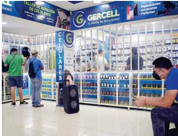
El comercio formal e informal asegura que las pocas ventas que están tendiendo les genera alivio para cubrir gastos.