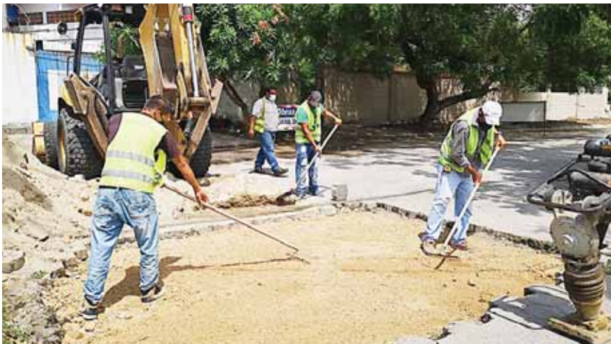
Los trabajos son ejecutado en diferentes sectores de la ciudad a fin de mejorar la circulación de los conductores.