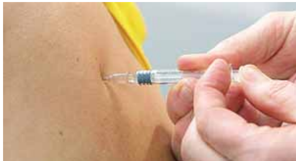
La cifra de pacientes recuperados crece rápidamente y son ya 12.2 millones.

datos otros cerca de 160 laboratorios están trabajando para conseguir una vacuna, primera que se lograría contra un coronavirus.