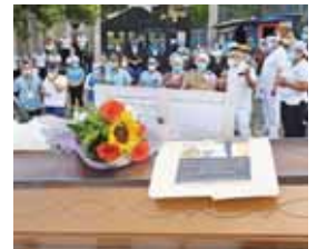
Solo en el gremio de las enfermeras se han registrado más de mil contagios y casi 20 han fallecido.

Asimismo, hay otro factor de riesgo como son los casos asintomáticos de COVID-19 y que al requerir asistencia médica no exponen que han estado en contacto