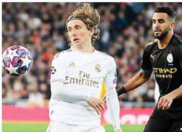
Real Madrid tiene un enorme reto de cruzarse en el camino del City en Inglaterra, una misión nada fácil.

En el Bernabéu Guardiola le dio una vuelta de tuerca al en-