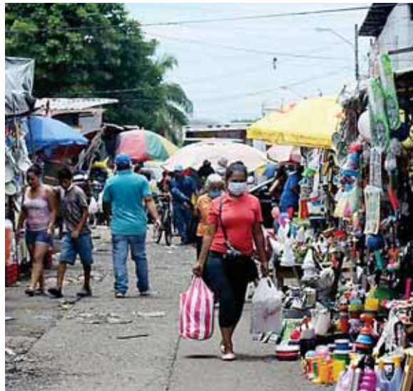
Los hondureños continúan circulando de acuerdo con la terminación del último dígito de su cédula.

El artículo 2 ratifica en todas y cada una de sus partes el Decreto Ejecutivo número PCM 068-2020, de fecha 19 de julio del 2020, contentivo de la Prórroga de las Medidas de Restricción a Derechos Fundamentales.