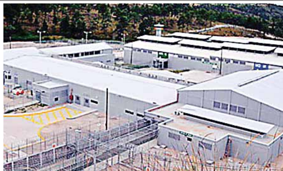
Los hombres habrían sido ultimados por compañeros de la misma celda donde se encontraban.