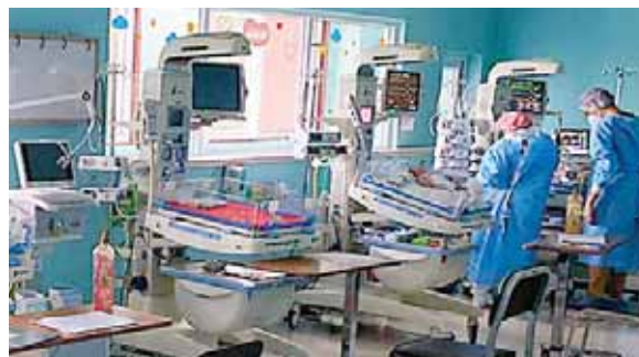
Los bebés permanecen bajo estrictos cuidados a fin de prevenir el riesgo de contagios por la pandemia.