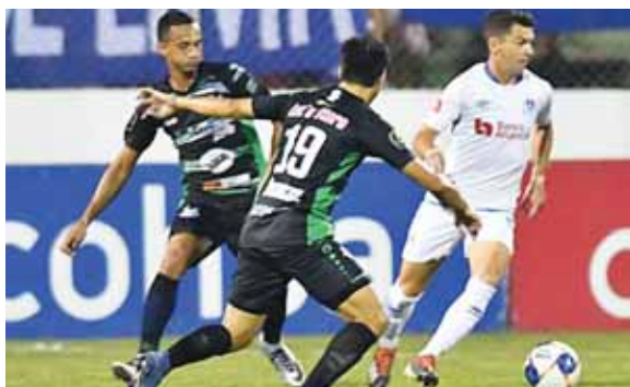
El fútbol profesional sigue en veremos ya que todo pasa por obtener recursos económicos.