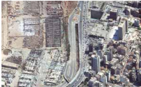
El primer ministro señaló que la investigación es una "prioridad y sus resultados deben ser rápidos".

Además, anunció tres días de luto oficial a partir de ayer para honrar