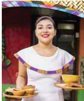
Santa Rosa de Copán demostrará todo su esplendor a través de la Feria Agostina Virtual 2020.

• CUARTA SEMANA: Tabaco / Ganadería: la producción de tabaco fortalece la cuna de la cultura y enorgullece a Honduras. Realizarán visitas para destacar las tradiciones ganaderías que son el sustento de muchas familias en el departamento.