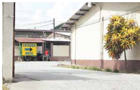
Los moteles ya están disponibles para los que requieran los servicios, con todas las medidas de bioseguridad.