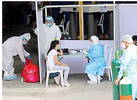
Los centros de triaje tendrán la próxima semana esta aplicación como prueba del proyecto.

López declaró que el proyecto no lo pudo adquirir cualquier persona, es decir que ha sido diseñado exclusivamente para los médicos, ya sea directores de hospitales, enfermeras y otro personal de salud, además podrá tener acceso la ministra y el viceministro de Salud, también el Presidente de la República y empresas privadas, ya que el fin primordial en estos momen-