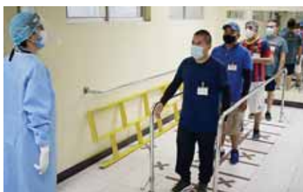
Los pacientes realizan diversos ejercicios para mejorar su condición física.