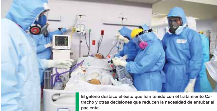
El galeno destacó el éxito que han tenido con el tratamiento Catracho y otras decisiones que reducen la necesidad de intubar al paciente.