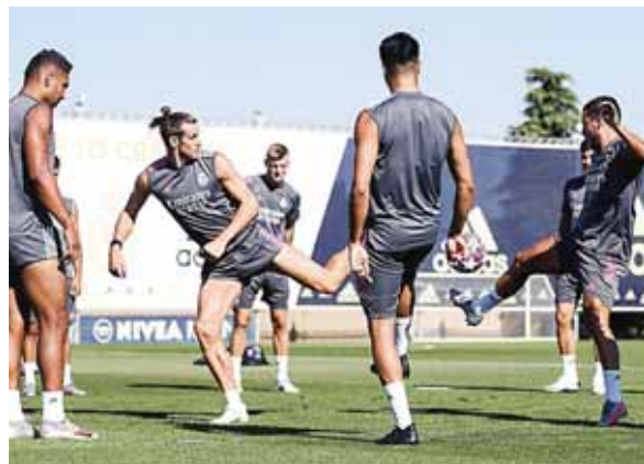
Bale todo apunta a que no tiene espacio en el Real Madrid. Se pierde mañana un partido crucial para los blancos.

Los 'merengues' siempre han perdido sus eliminatorias en Champions League cuando son derrotados en el Bernabéu en el duelo de ida. Cabe señalar que ante el City al Madrid no le basta con empatar el marcador global y debe anotar dos goles para avanzar a los Cuartos de Final. El único marcador que provocaría que el partido se definiera en serie de penales sería una victoria por 2-1 de los Merengues.