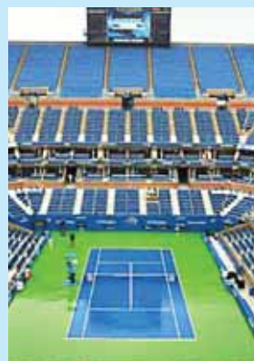
Sin público, los grandes tenistas en el mundo también verán afectados sus ingresos económicos.

El Abierto se disputará del 31 de agosto al 13 de septiembre en Flushing Meadows, Nueva York, los ganadores de las categorías individuales masculina y femenina obtendrán cada uno 3 millones de dólares.