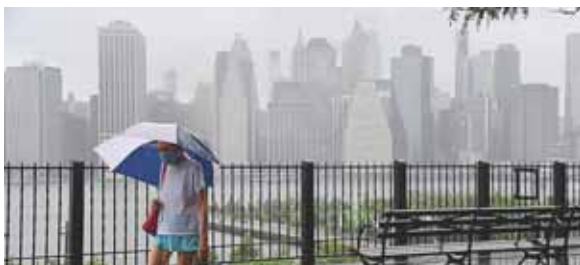
El gobernador de Nueva York, Andrew Cuomo, cargó contra las eléctricas, a las que acusó de no estar suficientemente preparadas para la tormenta.

En Connecticut la situación era parecida, con más de 720,000 hogares y negocios que continuaban sin luz este