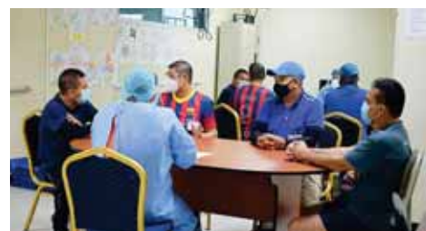
En el circuito de Terapia Grupal trabajan con el psicólogo y especialista en terapia de lenguaje. El objetivo es mejorar la función cognitiva.