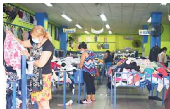
Con las medidas de protección los sampedranos buscan prendas a bajo costo en los locales de ropa usada.

Otros negocios aún permanecen cerrados, como el Instituto de la Propiedad (IP), y el Instituto Nacional de Migración (INM).