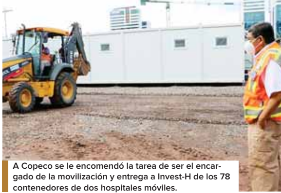
A Copeco se le encomendó la tarea de ser el encargado de la movilización y entrega a Invest-H de los 78 contenedores de dos hospitales móviles.

Luego de participar en un proceso de licitación, la empresa de transporte Tedesco junto a Copeco, trasladaron cada uno de los contenedores hacia los planteles donde se armaron los hospitales, uno ubicado contiguo al Hospital Mario Catarino