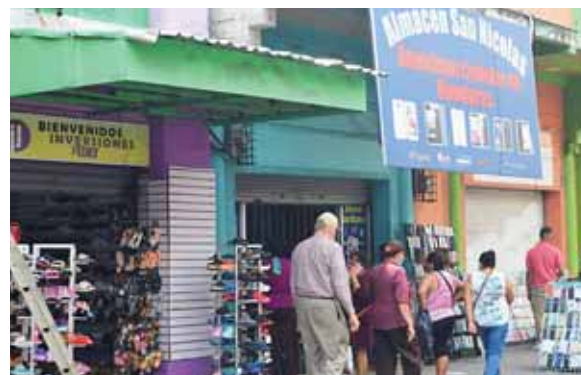
El rubro del calzado son de los negocios que desde horas tempranas abren sus pertas para probar suerte con las ventas.