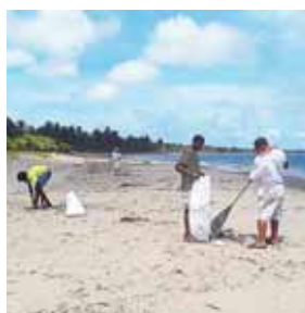
Esta iniciativa es un hecho histórico sin precedentes y con un gran impacto ambiental.

Esta iniciativa es un hecho histórico sin precedentes y con un gran impacto ambiental porque por primera vez instituciones sin fines de lucro se