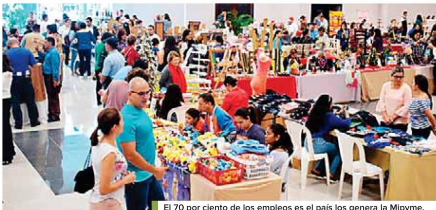
El 70 por ciento de los empleos es el país los genera la Mipyme.