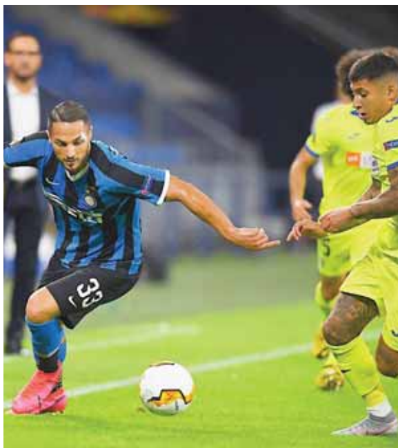
Inter de Milán terminó con el sueño del Getafe y lo eliminó de la Europa League.