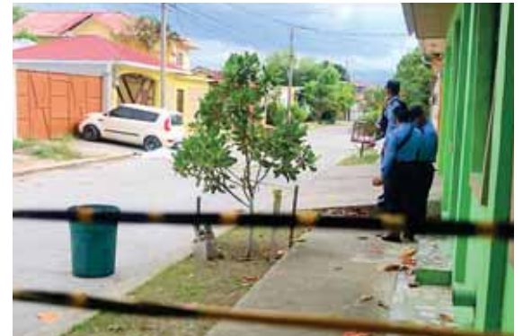
La Policía desconoce las razones del múltiple crimen.