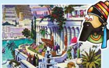
Los Jardines Colgantes de Babilonia, Irak

Construidos por el rey Nabucodonosor II en honor a su esposa en el año 600 A.C. sobre su palacio real al borde del río Eufrates en Mesopotamia. Sin embargo, no se sabe si de verdad existieron, ya que a medida que pasaron los años los jardines fueron descuidados hasta su total destrucción en el año 125 A.C. por el rey Evemero.