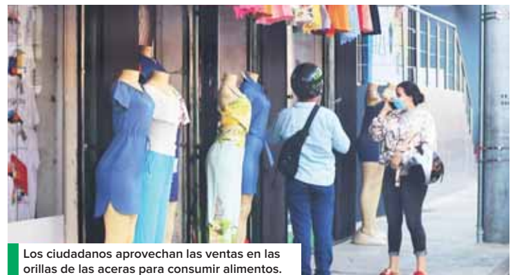
Los ciudadanos aprovechan las ventas en las orillas de las aceras para consumir alimentos.