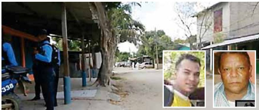
Dos de los cuerpos quedaron en el interior del vehículo, mientras que el señor quedó tirado en la calle.

Se informó de manera preliminar, que en el vehículo se encontraba una bebé de pocos meses de nacida, a quien llevaban a reconocer en el Registro Nacional de las Personas y que afortunadamente