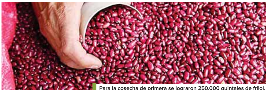
Para la cosecha de primera se lograron 250,000 quintales de frijol.