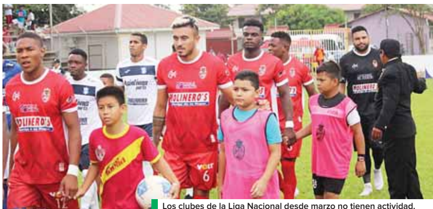
Los clubes de la Liga Nacional desde marzo no tienen actividad.

Una de las mayores exigencias de los equipos es a la federación pues consideran que no hace ningún aporte. Por ello, piden que tome un préstamo de la FIFA pues es dado sin intereses y que así sirva para la estabilidad económica de los clubes.