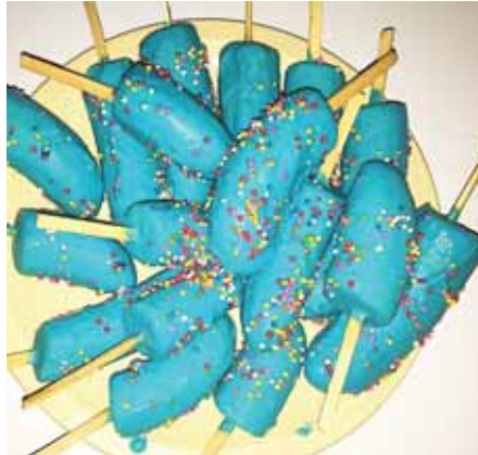
El Gum banano ha sido la nueva creación y hasta el momento ha sido bastante aceptada por los clientes al igual que los cócteles.

“Congelados Mamá Fer” es el nombre de la pequeña empre-