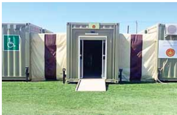
El CNA denunció ante el MP al extitular de Invest-H por los delitos de abuso de autoridad y fraude.

Todo lo anterior careció de la aprobación por parte del Consejo Directivo de la institución supuestamente estratégica para las operaciones oficiales, contraviniendo lo establecido en los artículos 15 y