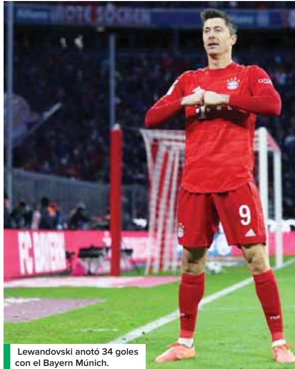
Lewandowski anotó 34 goles con el Bayern Múnich.

LaLiga se queda con 17 goles de media y en última posición, pero con 101 partidos disputados menos que LaLiga, se encuentran la Ligue 1 con una media de 15,6.