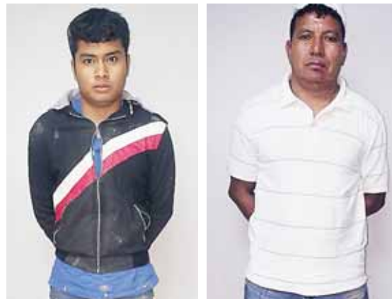
Los aprehendidos deberán responder por el delito de posesión de armas de fuego de uso prohibido.

A él se le decomisó dinero de la extorsión, dos paquetes con supuesta marihuana y un teléfono celular.