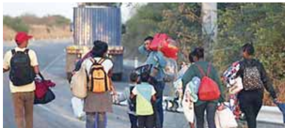
Plan Internacional implementa un programa de respuesta regional en 13 países que tiene como objetivo apoyar a las niñas, los niños.

“Los medios de supervivencia están restringidos. No hay acceso a oportunidades laborales. En los países hay miles de migrantes en circunstancias difíciles (...) Las medidas sanitarias impuestas por los países hacen que muchos migrantes se queden detenidos en las fronteras o