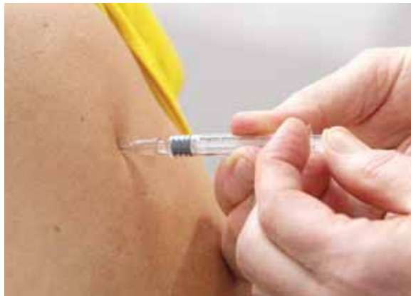
A falta de vacuna se debe seguir buscando el control de los contagios con múltiples medidas que incluyen el rastreo de casos y contactos.

tener el distanciamiento físico, lavarse las manos de forma constante, no toser al lado de otros, llevar mascarilla y reforzar la vigilancia”, insistió el experto etíope.