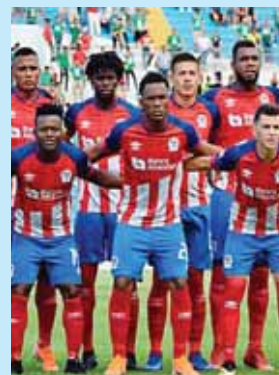
Olimpia será uno de los primeros en arrancar la pretemporada.

“La ansiedad es lógica, uno ve que está empezado todo el fútbol, no hablo de países, el fútbol es un trabajo como tantos, que encima llega una pequeña diversión a la gente que lo está pasando la en su casa desde lo animo suma eso”, señaló.