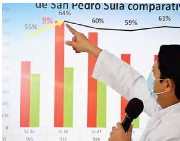
Ayer en conferencia de prensa el viceministro de Salud, Roberto Cosenza, informó sobre el descenso de casos COVID-19 en la zona norte.

Asimismo, informó que tienen el gran total de muestras procesadas