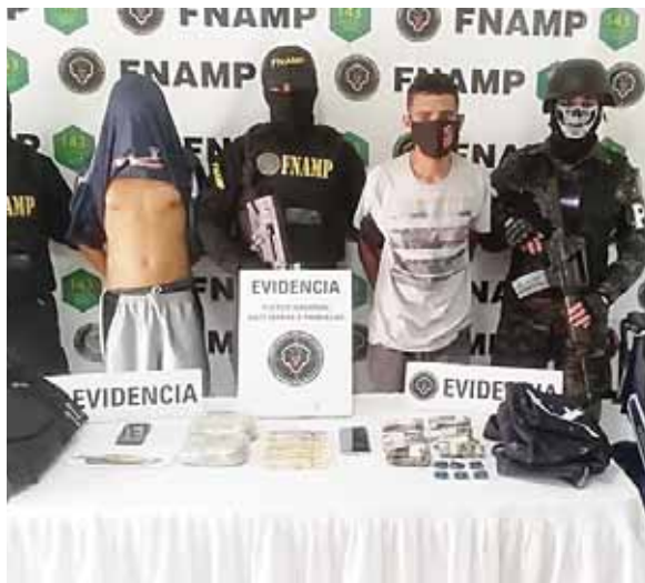
Los detenidos fueron remitidos a las autoridades correspondientes para que confirme a ley respondan por lo que se les imputa.

Al momento de su captura se le decomisó una motocicleta, una mochila con supuesta marihuana, dinero en efectivo producto de extorsión y un teléfono celular.