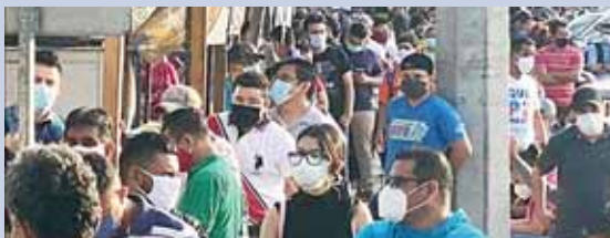
Se ha comprado que el uso de la mascarilla es un factor fundamental de protección ante el virus.

“Lo primero que quiero enfatizar es que se está acabando con la cuarentena, pero estamos a medio camino de la COVID-19, y eso es lo que tenemos que tener muy en mente y que la gente lo entienda” y agregó que “una de las cosas que sí se está claro a nivel mundial es que la mascarilla sí significa un nivel de protección ante el riesgo de la pandemia”. En ese contexto, la galena reiteró que es importante acostumbrarse a usar la mascarilla y hacerlo de manera correcta no como se mira con frecuencia en muchos ciudadanos que utilizan indebidamente