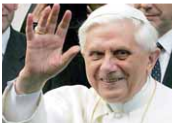
Según el diario Passauer Neue Presse, Benedicto XVI sufre de erisipela en el rostro.

Según el diario Passauer Neue Presse, Benedicto XVI sufre una erisipela en el rostro, una enfermedad infecciosa caracterizada por