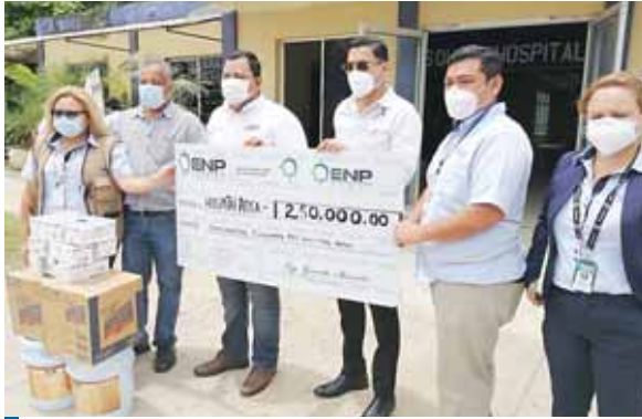
Las autoridades dijeron que respaldan el buen trabajo que hace todo el equipo de Salud Pública.