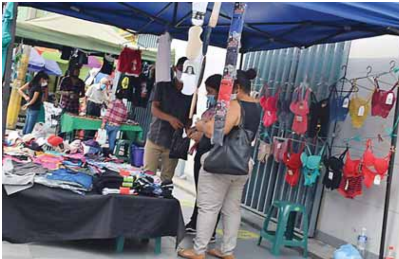
Los comerciantes exhiben sus productos para logra adquirir ventas y aunque la situación económica no es la mejor esperan están optimistas.

El vendedor dijo que los productos él los elabora, recordando la cultura de México y Guatemala, que fueron apoyados por sus artesanías, por lo que espera recibir y continuar con negocio.