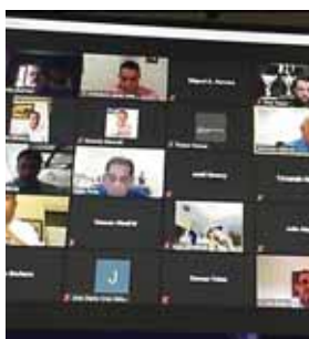
Varios presidentes estuvieron presentes en la sesión virtual en la profesional.