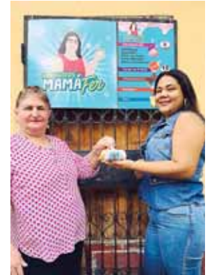
“Mamá Fer” es bastante querida por sus clientes que a diario compran sus productos.

sa que le trajo esperanza a esta esforzada familia quien al mismo tiempo aseguró que ha sido la unidad, la perseverancia y el esfuerzo, lo que ha hecho que dé buenos frutos.