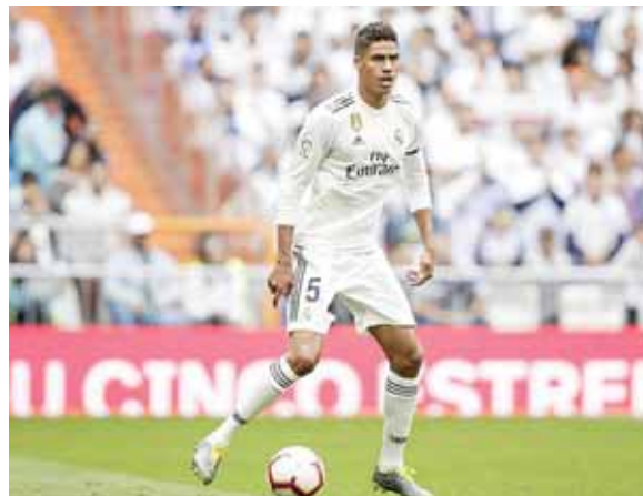
“Somos conscientes de lo que hemos logrado los últimos años y es algo excepcional”, manifestó Varane.

El viernes a la 1 de la tarde se juega el partido Manchester City-Real Madrid, el cuadro merengue debe ganar ya que perdió 1-2 en la ida.