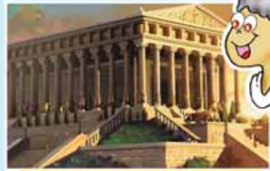
Templo de Artemisa, Turquía

Fue un templo dedicado a la diosa griega Artemisa erigido en el año 550 A.C. en Éfeso, cerca de la ciudad que hoy en día se conoce como Selçuk, en Turquía. Esta edificación estaba hecha de mármol y poseía 120 columnas de 20 metros cada una. Su interior adornado con esculturas de bronce y finas obras de arte. Sin embargo, el templo fue quemado en el año 356 A.C. por un hombre llamado Eróstrato, pero luego fue reconstruido y en el año 262 fue destruido por lo godos. Luego, bajo las órdenes del arzobispo de Constantinopla, San Juan Crisóstomo, fue nuevamente destruido en el año 400.