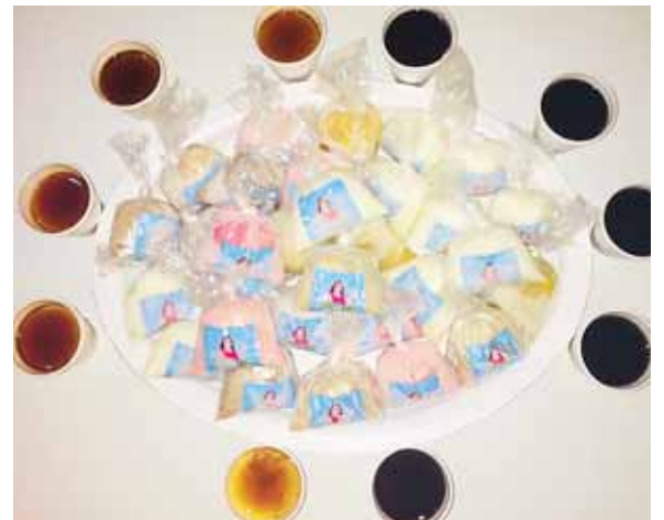
La variedad de productos y la originalidad de los sabores ha hecho que el emprendimiento crezca.

“Nuestros productos ahora llevan el ‘sticker’ con el nombre de la mini empresa, eso le da más vistosidad ya que el cliente por lo que mira compra y el ir ese ‘sticker’ en los ‘topogigios’, flanes, cócteles, gelatinas y chocabananos a ellos les gusta”, finalizó tras decir que es en las dificultades en dónde se encuentran las oportunidades y esto se logra con la ayuda de Dios.