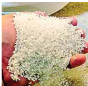
Producción nacional de arroz abastece el 37% del consumo nacional.

“Hay mucho endeudamiento y tienen que buscarle soluciones. Acompañado a eso, una vez que logras readecuar las deudas actuales se puede pensar en un capital de trabajo a corto plazo que son cantidades menores para abrir”, apuntó.