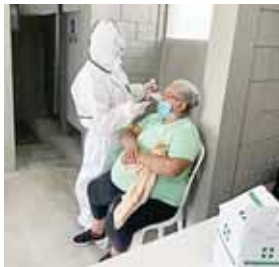
Con los recursos se debe fortalecer el sistema de salud e instalar centros de triaje.

Agregó que “esto a través de triajes, brigadas móviles o lugares de estabilización y todo esto, insisto, con la asistencia de Salud; hoy estamos viendo los primeros resultados de las