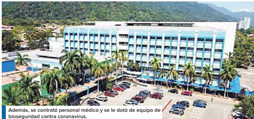
Además, se contrató personal médico y se le dotó de equipo de bioseguridad contra coronavirus.

Las mejoras se desarrollaron gracias al apoyo del Ejecutivo a través de la Secretaría de Desarrollo e Inclusión Social (Sedis), institución encargada de la reestructuración de algunas áreas del centro asistencial, refirió. “Se logró hacer una inversión importante en la remodelación de las