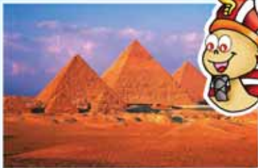
La Gran Pirámide de Giza, Egipto

Construida en el año 2560 A.C. por el antiguo Faraón Khufu que mide aproximadamente 145 metros de altura, pero con todo el proceso de erosión que ha tenido durante 4 milenios su altura ha bajado unos cuantos metros. Su construcción se justifica por el hecho de que el faraón quería tener una digna tumba para descansar. Se cree que en su momento, la pirámide de Giza, la más alta entre las tres, fue la edificación más grande construida por el hombre durante milenios.