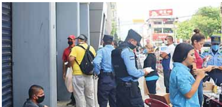
En algunos negocios la afluencia de personas no es suficiente, sin embargo, los vendedores mantienen la esperanza de iniciar con pocas ventas.