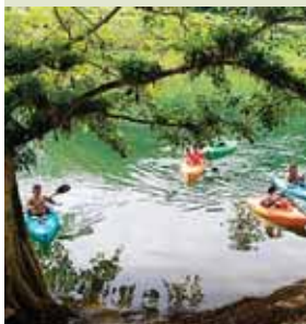
El Distrito Joya de los Lagos fue creado el 15 de mayo del 2018.

TEGUCIGALPA. El Sistema Nacional de Gestión de Riesgos (Sinager) autorizó la reapertura ordenada de los grandes y pequeños negocios que operan en el Distrito turístico Joya de los Lagos, en el sector de Yojoa, Cortés, siempre que cumplan con las medidas de bioseguridad.