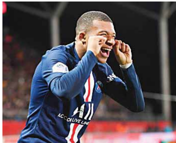
Kylian Mbappé espera ganar la Champions con el PSG y asegura que se queda en el club.

Mientras tanto, Thomas Tuchel, místico de los parisinos, respirará aliviado al saber que, al menos por ahora, cesarán los rumores en lo que alude al futuro más inmediato de Mbappé.