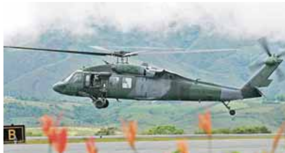
El Gobierno, a través del ministro de Defensa Carlos Holmes Trujillo, se refirió al hecho como un “accidente aéreo”.

Por las riberas del Inírida, en una estratégica zona para el nar-