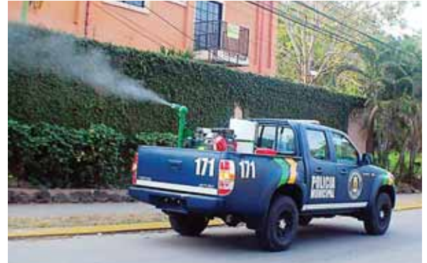
Autoridades realizan patrullajes en barrios y colonias para esparcir el medicamento que elimina de manera efectiva el zancudo transmisor del dengue.

De la misma manera resaltó que en ningún momento se inyecte con cócteles de medicamentos pues lejos de ayudar pueden empeorar la salud por lo que se debe de evitar.