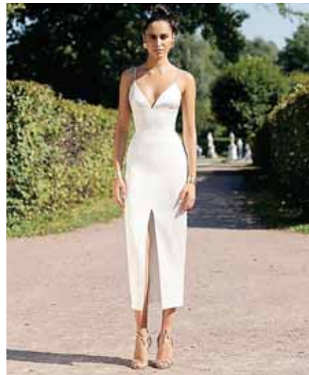
Un vestido blanco y largo.

Este look es típico de las españolas, y la verdad es algo que no sentiría de maravilla a las latinas.