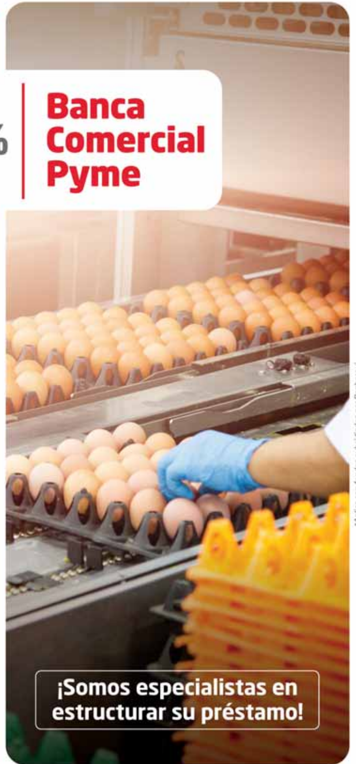
*Aplica con fondos subsidiados por Banhprovi

Consulte hoy a su ejecutivo asignado o escribanos a comercialpyme@bancatlan.hn