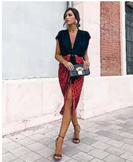
La falda drapeada de color exótico con una clásica blusa negra.

No tiene que ser carísimo de París, pero que al menos que tenga la intención de lucir sofisticado. Intenta no caer en lo casual y combinarlo con unos zapatos divinos.