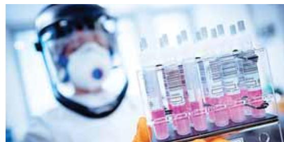
Los primeros ensayos clínicos de la vacuna de AstraZeneca produjeron una respuesta inmunitaria.

Un proceso de aplicación de la Carta Democrática Interamericana contra Nicaragua está en marcha en la Organización de los Estados Americanos, por “rompimiento del orden constitucional”, que, de ser aplicado, suspendería al país del organismo. EFE