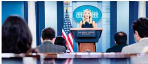
La secretaria de prensa de la Casa Blanca, Kayleigh McEnany, en la conferencia de prensa de ayer.

En su carrera criminal, los "hackers" atacaron al menos 13 empresas en EE.UU. y a otras 12 compañías localizadas en once naciones: EE.UU., Aus-