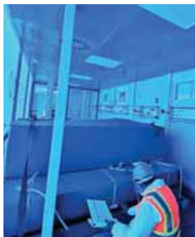
Se destinarán 10 millones de dólares para la capacitación de los maestros del país.

Lo inspeccionado ayer comprendió el equipamiento de la Unidad de Cuidados Intensivos (UCI) del hospital que se instalará en la ciudad de San Pedro Sula, por lo que ahora quedan pendientes 54 módulos que se confía pue-