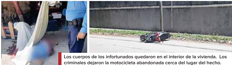
Los cuerpos de los infortunados quedaron en el interior de la vivienda. Los criminales dejaron la motocicleta abandonada cerca del lugar del hecho.

LOS SICARIOS LLEGARON HASTA LA VIVIENDA DONDE RESIDÍAN