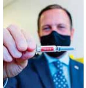
Un total de 20,000 dosis de la CoronaVac aterrizaron la víspera en el Aeropuerto Internacional de Guarulhos, en Sao Paulo.

"Durante los próximos tres meses, los voluntarios serán acompañados por un equipo