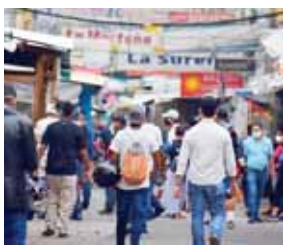
La suspensión laboral quedó indefinida por el tiempo que dure la emergencia por la COVID-19, para caso fortuito.

Enfatizó que este acuerdo contribuirá a la generación de empleo y el crecimiento económico.