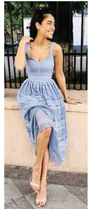
Lleva un vestido de cóctel a cualquier lugar!

Sobre todo adonde parezcas fuera de lugar, porque las reinas sí o sí tienen que lucir bien todo el tiempo y en todo lugar.