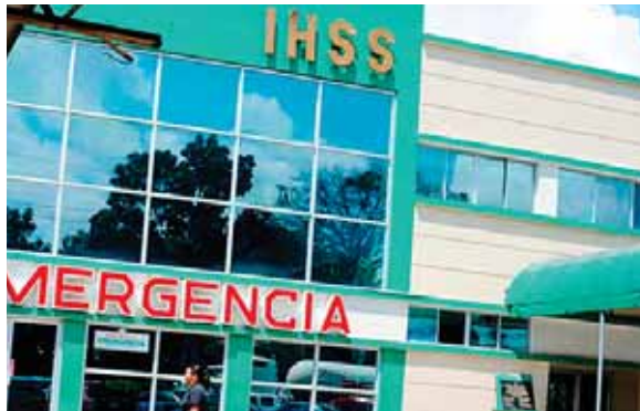
La situación generada por la pandemia ha causado un fuerte impacto en la parte médica.

“A finales de junio se han pagado unos 6.8 millones de lempiras en in-