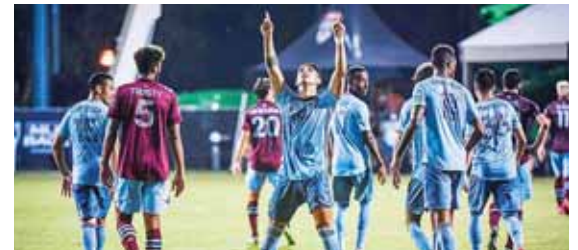
El club Kansas City tiene la obligación de ganar para clasificarse.

patan con cuatro puntos, en tercer lugar, está el Kansas City con tres unidades y de último y ya sin opciones se ubica el Colorado Rapids con cero puntos. El equipo de Espinoza, urge de una victoria para poder avanzar y no quedar rezagado. "Va a ser muy difícil solo por el clima aquí", dijo Espinoza en una entrevista en Sports Radio 810 WHB Soren Petro.