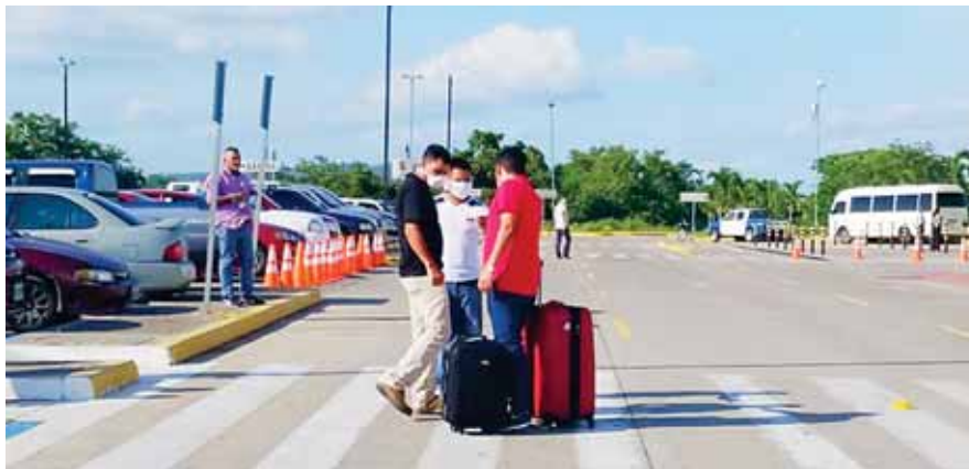
Los compatriotas se habían quedado varados en España desde que inició la pandemia, ayer hicieron posible el regreso a Honduras.

“El segundo vuelo llegará a San Pedro Sula el próximo 27 de julio con unos 274 hondureños a bordo siempre procedentes de España, pero no se descarta que se sumen