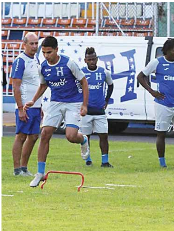
La selección de Honduras no tiene compromisos previstos para jugar en octubre y noviembre.

SAN PEDRO SULA. Las acciones que se han comenzado a tomar en el fútbol profesional para iniciar el torneo, dan alegría al seleccionador de Honduras, Fabián Coito pues los jugadores comenzarán a tomar ritmo luego de varios meses parados.