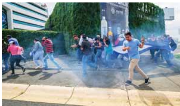
Ortega, quien ha dicho que se defendía de un intento de “golpe de Estado”, se niega a liberar de forma absoluta a más de 600 “presos políticos”.

Como ejemplo de que la represión ha continuado, el grupo Monitoreo Azul y Blanco afirmó que las posibilidades de que una perso-