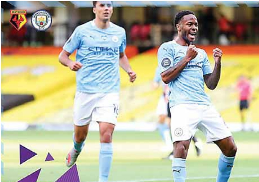
Manchester City suma 68 puntos y se mantiene segundo en la Premier League.