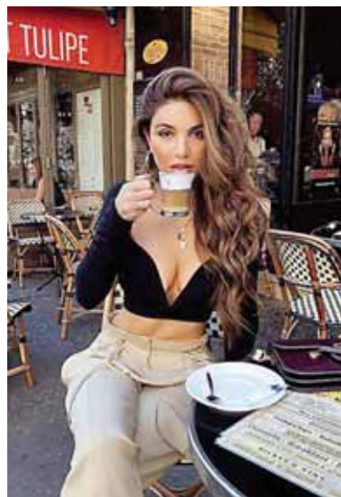
Un pantalón holgado de tono claro de tela fina con un top negro.

Imaginate en un evento formal con un vestido tan excéntrico, lujoso y deslumbrante, que hasta parecería una grosería usarlo. Pues justo ese vestido es el único que necesitas.