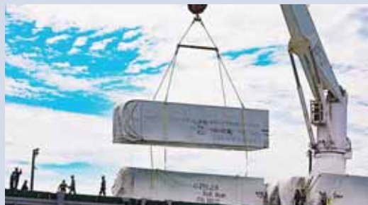
Los hospitales móviles serán instalados en Tegucigalpa y San Pedro Sula.

La modalidad descentralizada se maneja a través de las alcaldías de los otros 292 municipios, que reciben transferencias económicas del Gobierno para la compra de alimentos.