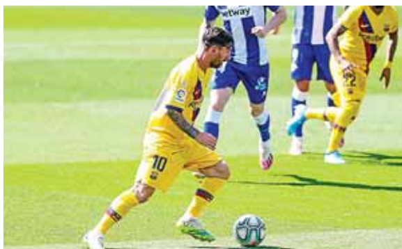
Leo Messi marcó ayer un doblete y se lleva el premio de mejor goleador de la temporada. Pero no queda conforme al no ganar el título de Liga.

“Es verdad que es una marca muy importante por lo significativo, pero me hubiese gustado acompañarlo con la Liga como en otras ocasiones