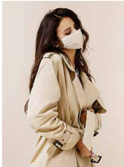
Colores neutros para ir al trabajo

Así podrás elegir más colores y diseños, y así combinarlos con tus prendas y maquillaje.