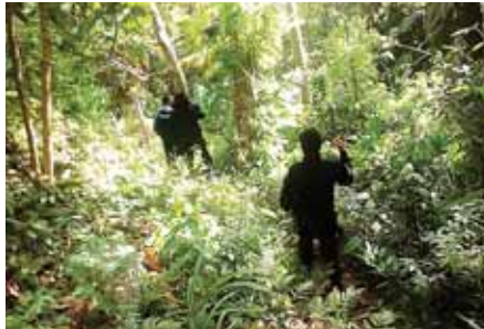
Agentes de la Policía Nacional se trasladaron hasta el lugar para hacer las investigaciones pertinentes al caso.

Luego de ocasionar los daños materiales, los criminales huyeron del lugar con rumbo desconocidos, sin que hasta ayer se conociera su paradero.