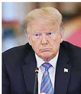
El mandatario hizo varias acusaciones infundadas o altamente especulativas.

La aparición del vídeo coincide con la supuesta fecha de cumpleaños de Oseguera, quien ha-