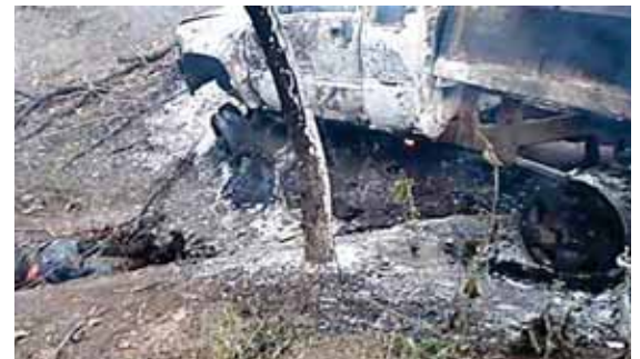
El carro quedó quemado, las autoridades aún no confirman si se incendió por el impacto o fueron los criminales.

Los cuerpos fueron trasladados a la morgue de San Pedro Sula, donde posteriormente serán entregados a sus familiares.