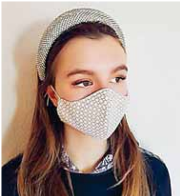
Luce genial con tus accesorios favoritos

Combina tu cubrebocas con tus diademas, ¡una verdadera chulada!