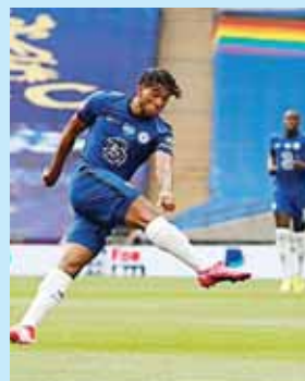
Chelsea salió bien librado ante el United y se vuelve a medir al Arsenal en una final.

Arteta mete al Arsenal en su 21ª final copera, un récord del torneo, y los ‘Gunnings’ tendrán la ocasión de acabar dignamente una temporada en la que han naufragado en la Premier League, ocupando la 10ª posición de la tabla a falta de dos partidos para el final, lejos de las plazas europeas.