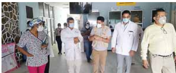
El funcionario anunció que otros dos contenedores más que ya están en el recinto hospitalario serán reacondicionados.

los porteños que hay medicinas, se les garantiza una asistencia de primera siempre que se cumplan las medidas de bioseguridad y el distanciamiento social y si los adultos mayores tienen problemas para desplazarse perfectamente pueden enviar a algún familiar a recoger su medicación normal con sus identificaciones y con gusto se les atenderá”.