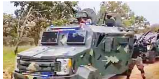
La aparición del vídeo coincide con la supuesta fecha de cumpleaños de Nemesio Oseguera, líder del Cártel Jalisco Nueva Generación.

La ola de violencia dejó 4,645 personas muertas en 2019. La mitad de los crímenes están asociados al narcotráfico y a pandillas dedicadas a la extorsión del transporte de pasajeros y a comerciantes.