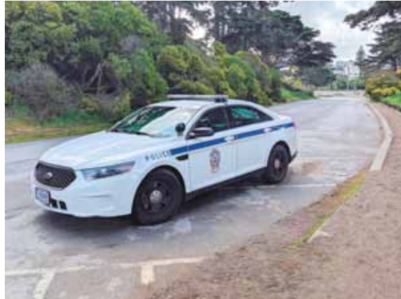
La última alerta la recibió la ciudad de Lake Elsinore el sábado por la noche.

Desde ese entonces, el hombre había estado recluso bajo supervisión del estado como resultado de una serie de juicios civiles que