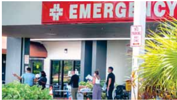
Los hospitales de Florida están atendiendo actualmente a aproximadamente 10.000 pacientes de COVID-19 y más del 20 % requieren cuidados intensivos.

El mandatario también afirmó que Estados Unidos tiene “una de las tasas de mortalidad más bajas del mundo”, algo que el entrevistador, Chris Wallace, le rebatió al recordar que, de acuerdo con el análisis de Johns Hopkins, el país es el octavo del mundo