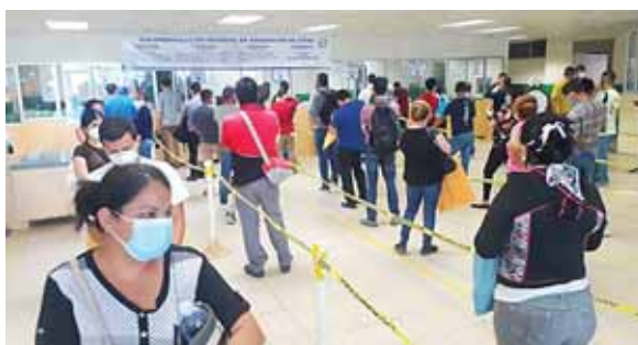
Se destinarán 10 millones de dólares para la capacitación de los maestros del país.

“Antes de abrir un triaje se busca el personal, después se le capacita en el sentido de cuál es el funcionamiento y el objetivo del centro y además