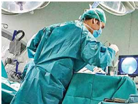
Las autoridades de Salud de esa zona piden regresar a la fase cero para evitar más contagios.

El galeno aseguró que “es un virus altamente contagioso y aunque se empleen las mejores estrategias de bioseguridad, algo puede fallar, una quitada de guantes o lentes, mala manipulación de la mascarilla, no digamos en una sala de ambiente COVID-19”