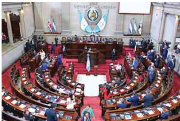
El estado de sitio debe ser ratificado por el Congreso para entrar en vigor.