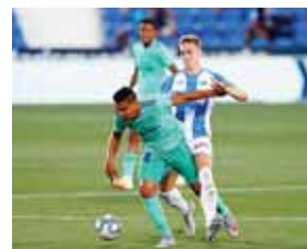
Madrid no pudo ganar en el primer partido como campeón de España.

Agregó “esta vez se vio otra cosa. Era un partido difícil de jugar por la situación en la que nos encontrábamos, por el último partido, por la hora, por el calor. El equipo respondió de otra manera a nivel de actitud, de compromiso. Creo que es un paso importante para lo que viene que va a ser muy complicado y muy importante para nosotros”,