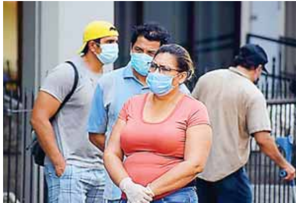
El rol de la banca es fundamental con el otorgamiento de créditos para reactivar la economía, sin ello sería imposible funcionar y apoyar el crecimiento de la economía.

Mientras el Fondo de Garantía para Empresas de Mayor Tamaño, el cual dispone de 1,900 millones de lempiras, ofrecerá garantías de has-