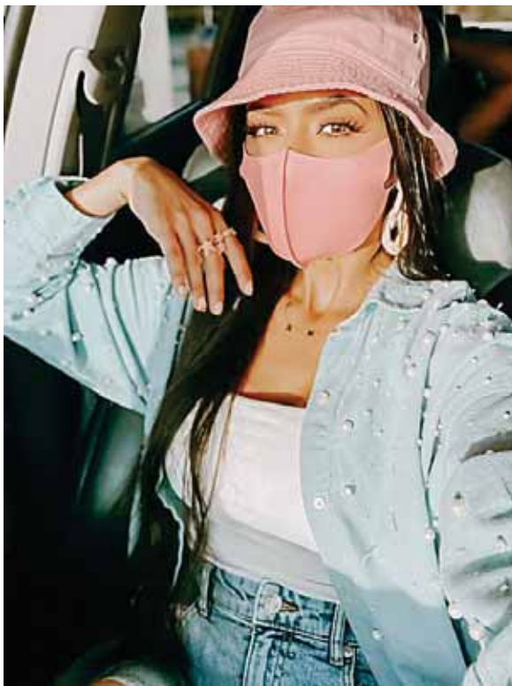
Invierte en cubrebocas lavables

Lo queramos o no, el cubrebocas se volverá parte de nuestra rutina diaria y de nuestra vida. Su uso no desaparecerá pronto y es mejor que nos vayamos acostumbrando a él, e incluso sería bueno que le agarráramos cariño y en lugar de despreciarlo y maldecirlo, usar esa energía para buscar formas de combinarlo y transformarlo en un accesorio más en nuestro look.