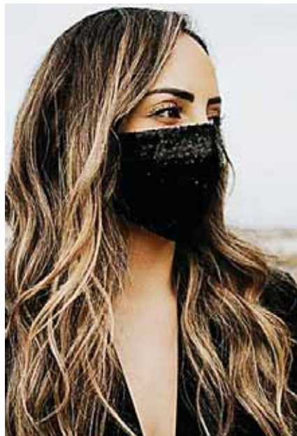
Deja que tu look brille

Métele actitud, recuerda que lo es todo.