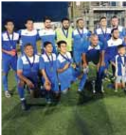
Honduras logró llevarse la segunda edición The Woodlands World Cup.

Cada partido resultó duro ya que por enfrente hubo representantes de otros países que lograron conformar un plantel competitivo. Pero finalmente se impuso la calidad y coraje de los catrachos.