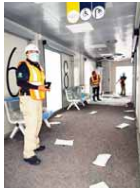
Hasta anoche se habían inspeccionado 11 contenedores, hoy seguirán con la revisión.

En ese sentido, se confirmó que los primeros módulos con los hos-