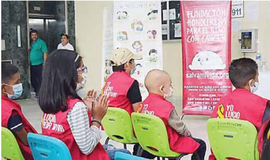
Los niños reciben las radioterapias y además la fundación trata de darles atención integral.