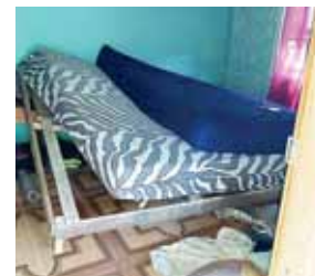
Los sospechosos irrumpieron a las viviendas de forma violenta causando daños materiales y luego se llevaron a los cuatro hombres.

sobre los territorios donde habitan. Sin embargo, no se ha determinado de manera concreta el por qué fueron sacados de sus viviendas de forma violenta.