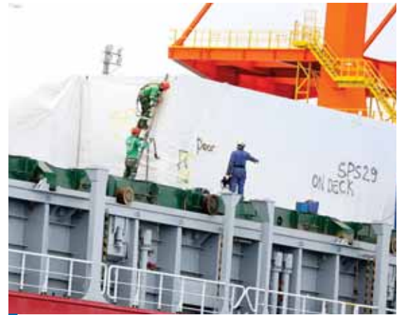
Los contenedores con los hospitales móviles llevan más de una semana en Puerto Cortés.