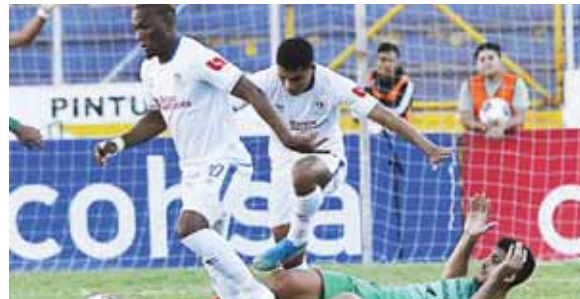
Los jugadores deberán aceptar algunas condiciones económicas pues no hay dinero, opinan los dirigentes de la Liga Nacional.

“No creo que el gobierno con tantas preocupaciones que tiene ahora mismo por la pandemia esté en capacidad de financiar el fútbol, somos los clubes y la Fenafuth los que debemos salir adelante”.