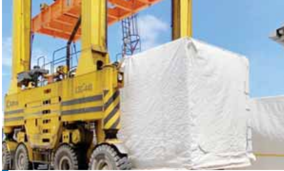
El proceso aduanero se ejecuta amparados en la normativa aduanera vigente y se cuenta con el acompañamiento del MP, la ATIC, el CNA y otros entes que avalan el proceso de desaduanaje.

Esta actividad que se ha efectuado desde el viernes anterior en el centro logístico de la Operadora Portuaria Centroamericana (OPC), donde están ubicados los 78 contenedores provenientes de Turquía, forma parte del proceso que ejecuta la inspección física de la mercancía que forma parte de su aduanaje y que concluirá con el retiro y transportación de la mercan-