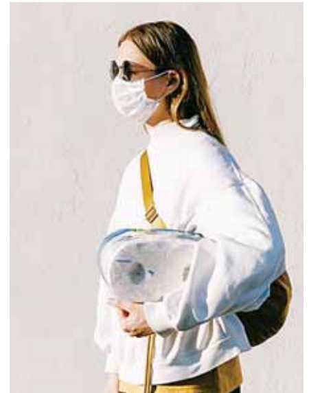
Con lentes de sol para ir al shopping

Busca un cubrebocas que te guste mucho, así usarlo no te costará.