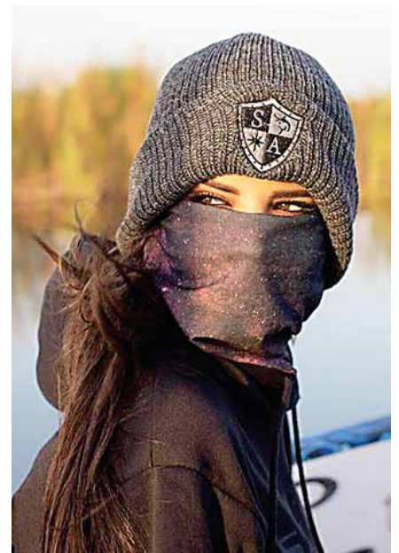
En invierno te encantarán

Para eventos formales, un cubrebocas con lentejuelas.