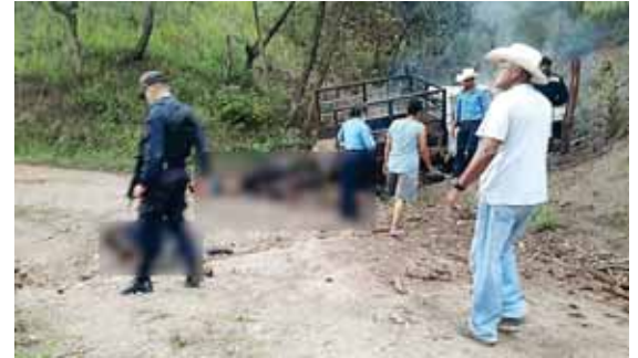
Las víctimas venían de trabajar cuando fueron sorprendidas por varios hombres fuertemente armados.

En ese sentido, el detenido fue puesto a la orden de las autoridades por el delito de portación ilegal de arma de uso comercial, asociación para delinquir y extorsión.