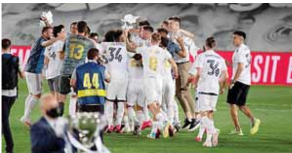
La celebración entre jugadores, no hubo aficionados.

los últimos minutos. Vicente Iborra acertó distancias y en los minutos de compensación Thibaut Courtois se confirmó como héroe del título con una genial doble atajada en el área.