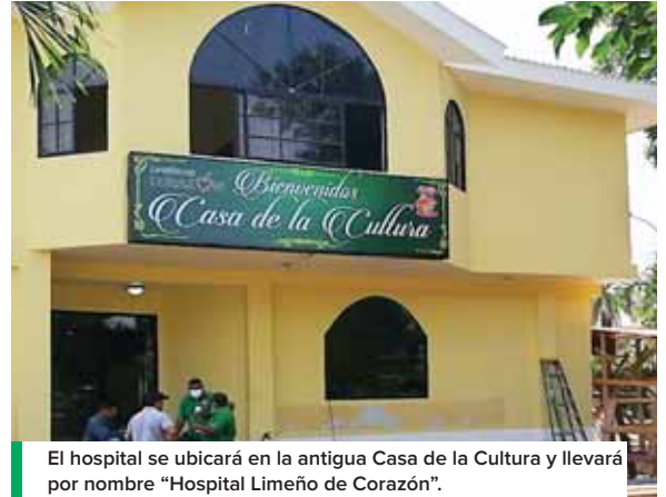
El hospital se ubicará en la antigua Casa de la Cultura y llevará por nombre "Hospital Limeño de Corazón".