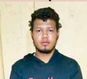
El sospechoso fue remitido a la Fiscalía de turno correspondiente para que responda por los delitos que se le imputan.

TEGUCIGALPA. La Policía Nacional a través del Departamento de Delitos Contra la Propiedad de la Dirección Policial de Investigaciones (DPI), realizó la captura de un integrante de la banda criminal “El Márgaro”.