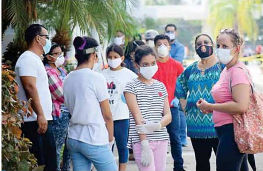
La Secretaría de Estado en los Despachos de Trabajo y Seguridad Social insta a los empleadores y trabajadores del país a cumplir las medidas dictadas por el Gobierno de la República.