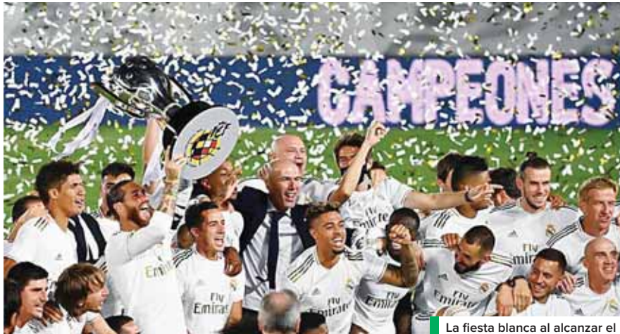
La fiesta blanca al alcanzar el título 34, muy ansiado desde hace varios años.

No hay épica posible para el Real Madrid sin sufrimientos y así fueron