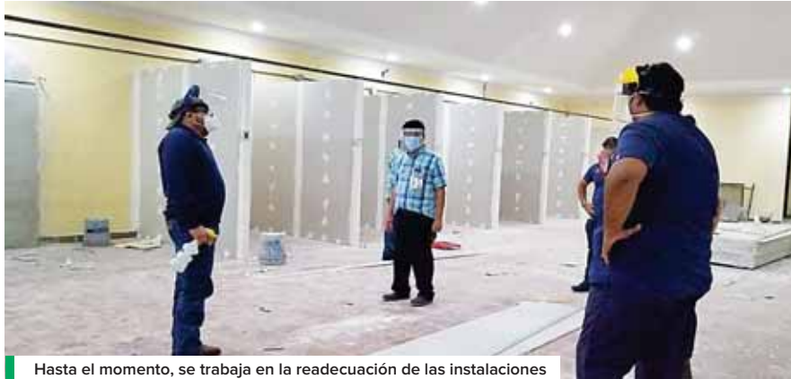
Hasta el momento, se trabaja en la readequación de las instalaciones para comenzar con el equipamiento de los cubículos.