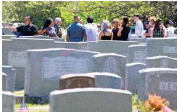
El condado de Miami-Dade, que es el epicentro de la pandemia en el estado, acumula el 23.88 % del contagio con un total de 75,425 casos.

Suárez reiteró la posibilidad de un nuevo confinamiento y cierre de los negocios, una medida que “sería la última opción”, pero que está sobre la mesa.