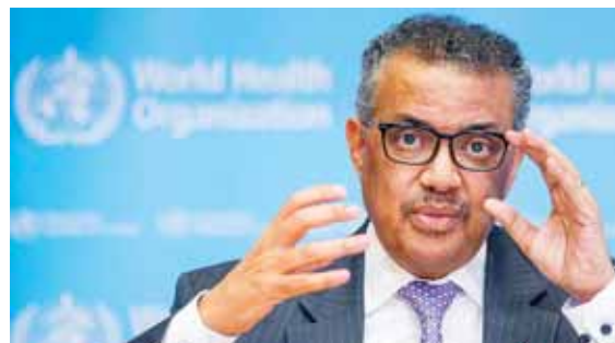
Tedros, transmitió sus condolencias a las familias de todos los que han perdido la vida debido a este virus, en España y en el mundo.

Tedros, según un comunicado de la organización en Ginebra, transmitió sus condolencias “a las familias de todos los que han perdido la vida debido a este virus, en España y en el mundo”.