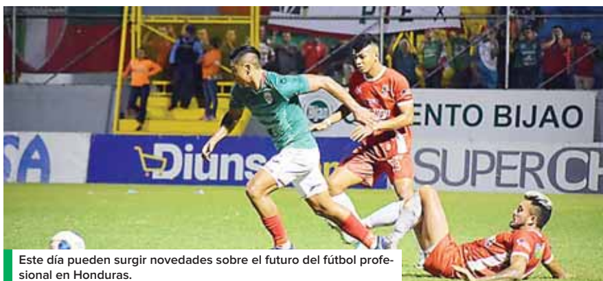
Este día pueden surgir novedades sobre el futuro del fútbol profesional en Honduras.

Debido a la falta de recursos económicos para hacerle frente a las deudas y comenzar con la planificación del torneo Apertura, ocho de los 10 equipos de la Liga Nacional, han solicitado al Banco Hondureño para la Producción y la Vivienda (BANHPROVI), un préstamo.