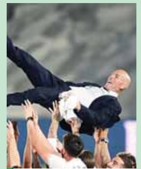
Zidane dijo que extraña no celebrar con los aficionados.

“La sensación es tremenda porque al final lo que consiguen los jugadores... Son diez victorias, impresionante. Es cosa de equipo, lo luchamos hasta el final y estamos muy contentos. No tengo palabras. Tengo una emoción muy grande”. Agregó “son los jugadores que luchan desde que estoy con ellos, tengo mi papel pero lo más importante son ellos, que creen en lo que metemos para ganar. Luchan en el campo y son un grupo, un equipo de personas humanas antes que de jugadores. Solo puedo estar feliz y contentos”. Para el DT francés todos los