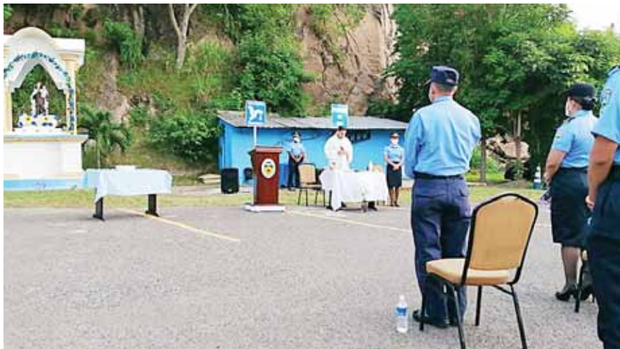
La actividad fue organizada por los oficiales alumnos del Centro de Capacitación para Oficiales de Policía (CCOP), de la Dirección Nacional de Educación Policial.

FESTEJAN A LA PATRONA DE LA POLICÍA NACIONAL