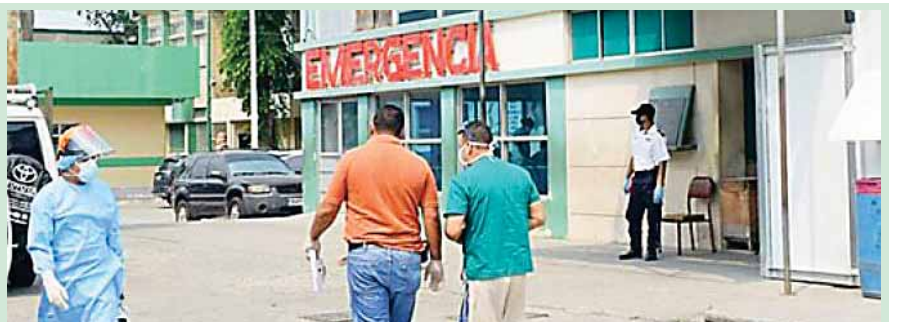
Por primera vez este país registró una leve disminución de casos.

Asimismo, se encuentran 127 pacientes estables e inestables hay 16 y 13 en la sala de cuidados intensivos, también informaron que no tienen decesos por COVID-19 en las últimas horas.