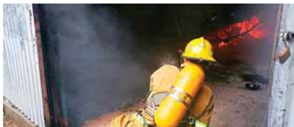
Luego de ser alertados, los Bomberos acudieron al lugar del hecho para controlar el fuego.

Los vecinos del lugar se manifestaron preocupados, ya que las llamas eran tan altas que estaban a punto de alcanzar los cables del tendido, eléctrico, lo