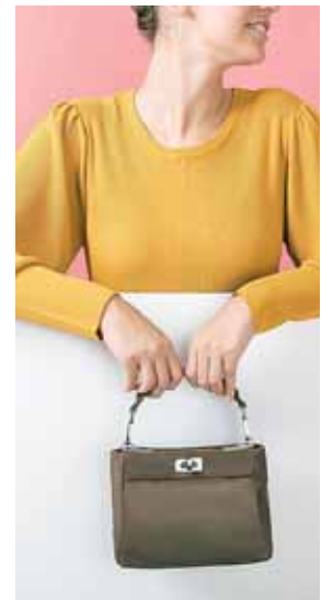
Mini bag de asa corta

Si quieres hacer que tenga un toque más elegante, acorta la cadena y acércalo más a tu cuello. Por el contrario, si quieres un estilo más relax y effortless, úsalo más largo.