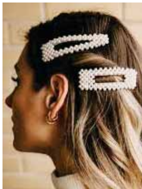
Pasadores en tendencia

Solo necesitamos una frase para explicar el por qué: son una pieza sofisticada que nunca pasará de moda.