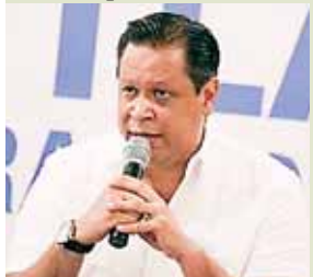
Por primera vez este país registró una leve disminución de casos.