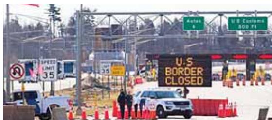
Esta confirmación llega cuando Estados Unidos lucha por controlar una epidemia que ha dejado más de 137,000 muertos.

El viaje de Tedros a Madrid, junto con el que hace dos días realizó a París para participar en un similar homenaje a las víctimas en Francia, constituyen las primeras salidas de Ginebra del director general de la OMS desde que el organismo declaró la pandemia global en el mes de marzo. EFE