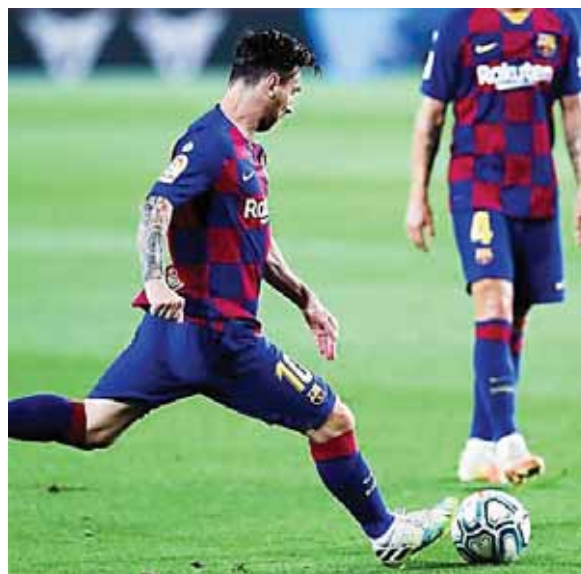
Leo Messi sabe que el Barcelona se cayó y eso le costó ganar LaLiga.