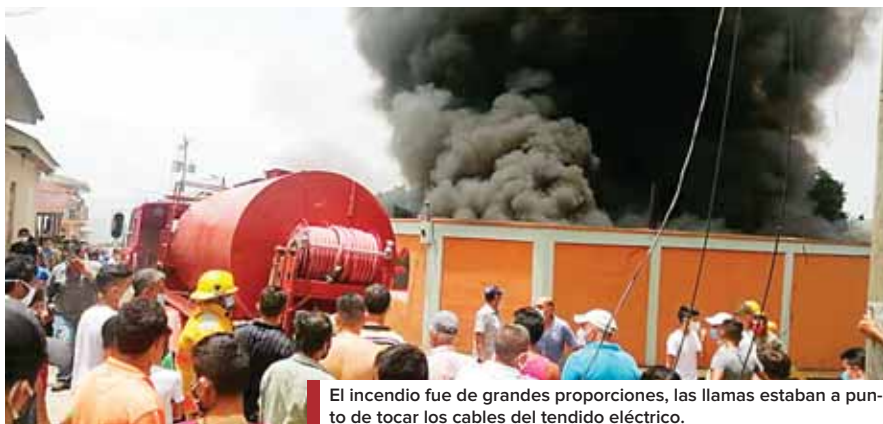
El incendio fue de grandes proporciones, las llamas estaban a punto de tocar los cables del tendido eléctrico.

La Policía Nacional reportó ayer la captura de un ciudadano, de 47 años, sospechoso de robo en perjuicio de una reconocida empresa en la zona norte del país. La acción policial fue ejecutada por agentes de la UDEP 5, en la residencial Buena Vista, de Villanueva, Cortés.