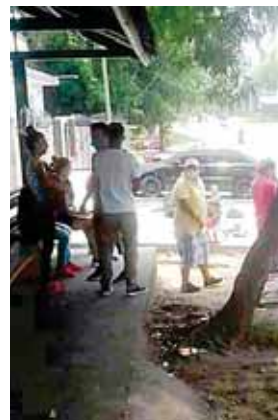
El nuevo horario es una medida temporal, con la que se pretende evitar aglomeraciones de personas y por ende el contagio de COVID-19.

Por otro lado, el Registro Nacional de las Personas (RNP), dadas las condiciones actuales, atiende por llamado las atenciones respecto a los