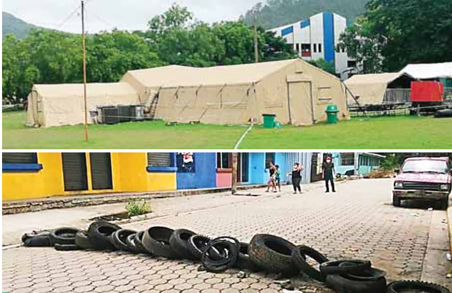
El hospital móvil seguirá funcionando en el mismo lugar, ya que la reubicación no se llevó a cabo por oposición de la población.