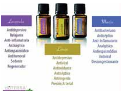
Los aceites esenciales son una excelente medicina alternativa.

están los aceites esenciales que son de mucha ayuda en estos momentos de pandemia y son fáciles de utilizar.