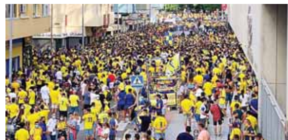
Los aficionados cadistas volverán a ver su equipo en la élite tras 14 años en segunda.

Con el retorno del Cádiz a la Primera División de España, el delantero Anthony Lozano se convirtió en el cuarto jugador hondureño en conseguirlo.