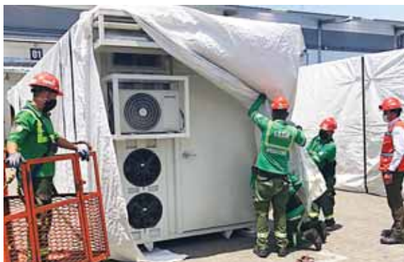
Hasta que sea revisado por las autoridades, se trasladarán a las ciudades de San Pedro Sula y Tegucigalpa, donde serán instalados.