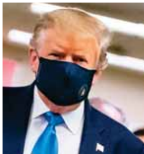
Donald Trump se vio por primera vez con mascarilla.

ORLANDO, ESTADOS UNIDOS. Disney reabrió dos de sus parques a pesar del incesante avance de la pandemia en Estados Unidos cuyo presidente Donald Trump se mostró por primera vez en público con mascarilla.