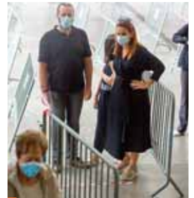
En este contexto de rebrote de la epidemia, varias regiones decidieron reforzar la obligación de llevar mascarilla.

Según las autoridades, el foco de contagio está relacionado con los trabajadores agrícolas temporales que laboran en la recolección de fruta.