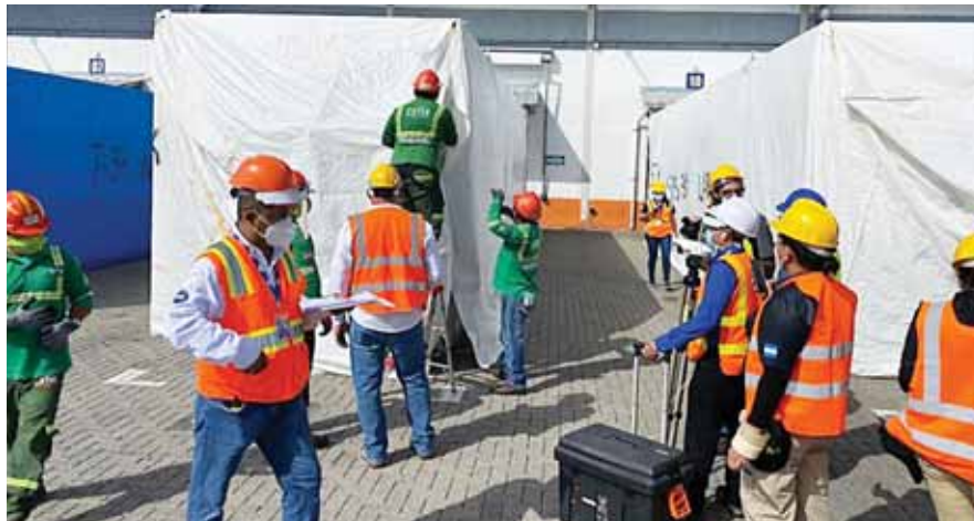
El Ministerio Público ha suspendido la inspección de los contenedores ya que hace falta una documentación.

Ese documento que dejó el capitán del barco es una especie de acta que incluso llegó sin seguro, por lo que se apremió a Invest-H a que reclame esa factura original al proveedor de los hospitales en Turquía, aunque otros aseguran que ahora se puede presentar esta documentación pos-