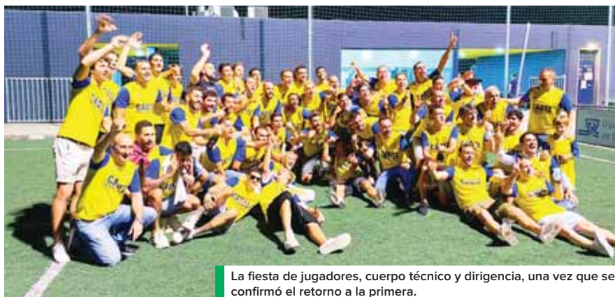
La fiesta de jugadores, cuerpo técnico y dirigencia, una vez que se confirmó el retorno a la primera.