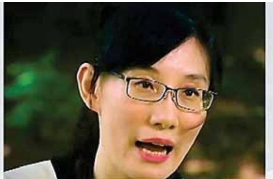
La viróloga acusa a la OMS de «corrupción» y complicidad con el Gobierno de China.

«Él me pidió que guardara silencio y que tuviera cuidado. Que no tocara la línea roja, es decir, que no fuera contra los procedimientos del Go-