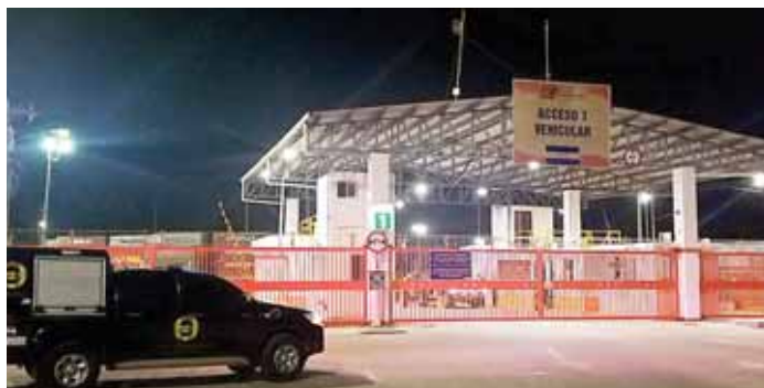
El MP continúa a la espera de que Invest-H envíe la documentación original a Aduanas para revisarlos, mientras tanto los hospitales no saldrán del predio aduanero.