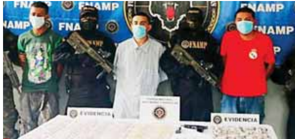
Los detenidos y la evidencia fueron puesta a la orden de las autoridades competentes para que se continúe el proceso legal.

Durante el operativo de ayer, también se capturó a Bairon Da-