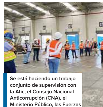
Se está haciendo un trabajo conjunto de supervisión con la Atic; el Consejo Nacional Anticorrupción (CNA), el Ministerio Público, las Fuerzas Armadas, Fusina, entre otros organismos.