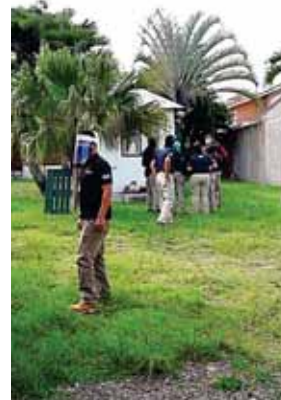
Los investigadores estuvieron por casi seis horas allanando la mencionada vivienda en El Trapiche, suroriente de Tegucigalpa.

“La misma será objeto de análisis debido a que podría estar