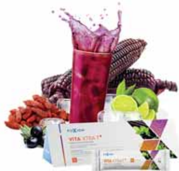
Vita Xtra T+ mejora el sistema inmunológico.

Una de las líneas es Vita Xtra T+ que mejora el sistema inmunológico, tiene todos los complementos vitamínicos incluyendo magnesio y zinc que necesitamos a diario. Es una be-