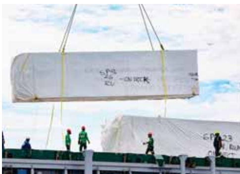
Actualmente los contenedores están el muelle de la OPC.

larios. Documento de Exoneración de la franquicia conocido como dispensa.