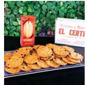
Galletas de avena integral, cero azúcar para una alimentación saludable.