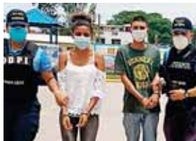
Los detenidos fueron remitidos a la Fiscalía junto con la evidencia para que respondan por lo que se les acusa.

A las personas capturadas se les encontró en posesión de dos envoltorios plásticos conteniendo marihuana, 78 envoltorios de papel periódico conteniendo la misma hierba y varios billetes de diferentes denominaciones, más una tijera.