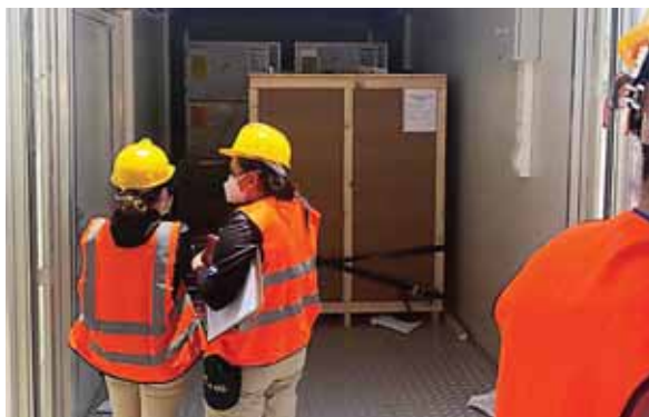
Se supo que un contenedor pudo ser revisado ya que era el único que le faltaba un sello internacional.

Factura Comercial. Conocimiento de Embarque. Permisos no arance-