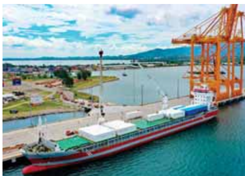
El viernes llegó a Puerto Cortés el barco que traía los hospitales móviles con 91 camas.