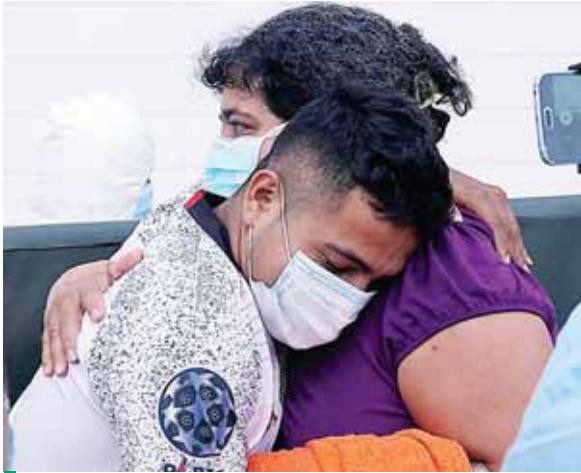
Los familiares de los pacientes al momento de recibirlos a las afueras de la sala. El llanto de felicidad se hace siempre presente.

Salvar vidas mediante una atención de calidad y con calidez es una de las principales prioridades del equipo de trabajo a cargo de la Unidad Estabilizadora Municipal, que, entre lunes y sábado pasado, registró un total de 43 altas médicas y 48 nuevos ingresos.