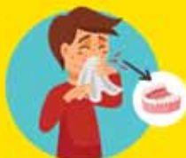
SANGRADO DE ENCÍAS, NARIZ Y ORINA

...busca el Establecimiento de Salud más cercano NO TE AUTO-MEDIQUES