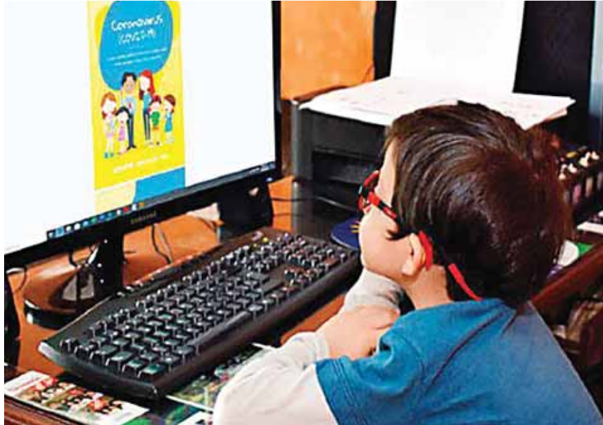
Los alumnos reciben clases por diferentes plataformas y además tiene el apoyo de la radio, televisión y medios escritos.