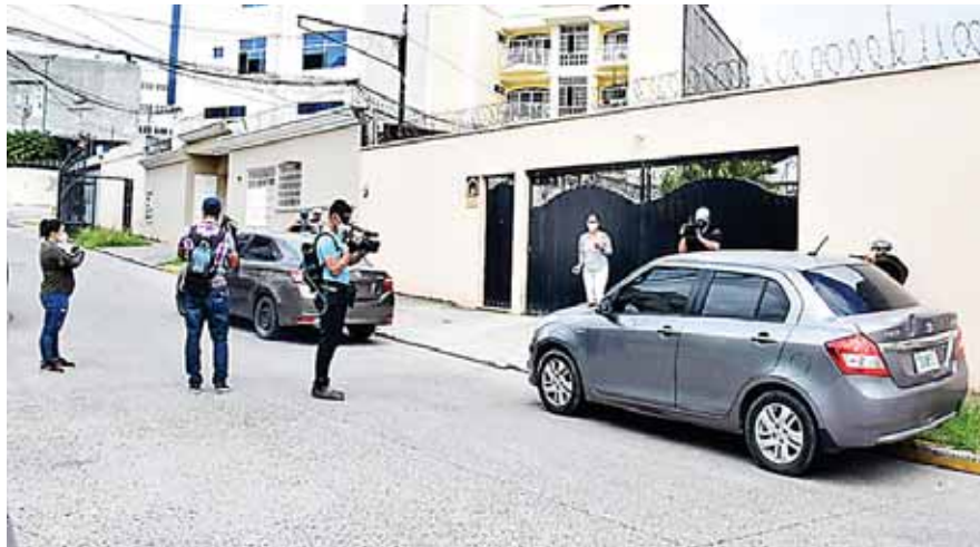
Con una orden judicial, la Fiscalía Especial para la Transparencia y Combate a la Corrupción Pública (Fetccop) allanó la morada de la madre del exdirector de Inversión Estratégica de Honduras (Invest-H).

“El Ministerio Público con esta acción pretende encontrar documentación relevante para el caso que se investiga y además que permita de una vez la inspección