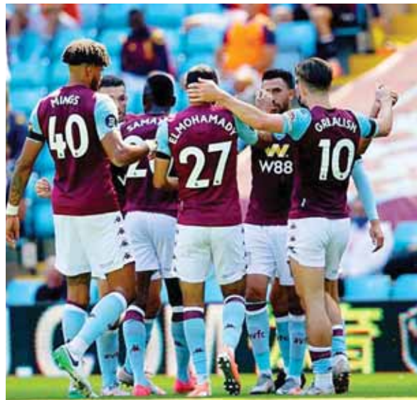
Aston Villa lucha por salvar la categoría, está en la posición 19 con 30 puntos. Norwich City descendió.