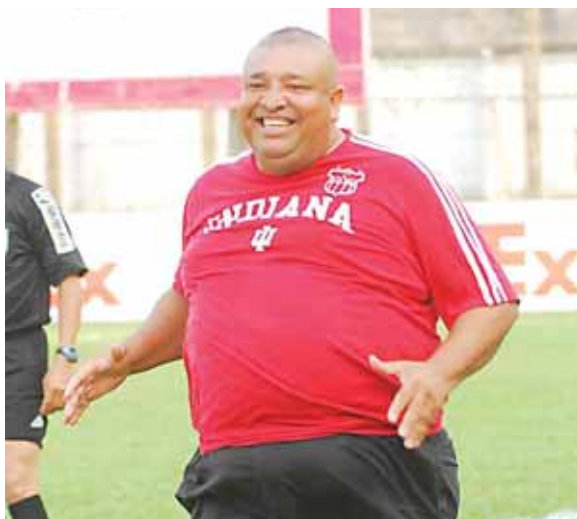
Pololo tenía una frase que retumbaba en La Ceiba: “Mientras yo esté vivo, el Vida nunca va descender” y varias veces lo vio cerca. Hoy toca darle un emotivo adiós y darle la despedida que se merece.

Cada entrenador, cada futbolista que ha pasado por el Vida tendrá una historia que contar de “Pololo”, algunos jugadores del equipo de Reservas que vivían en la sede cuentan que el les quitaba el hambre porque al darse cuenta que no tenían nada que comer ya llamaba a sus contactos y al rato ya estaba la comida para los muchachos.