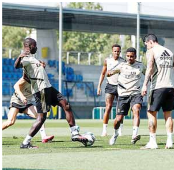
Real Madrid tiene la gran oportunidad de alejarse de nuevo cuatro puntos del Barcelona.