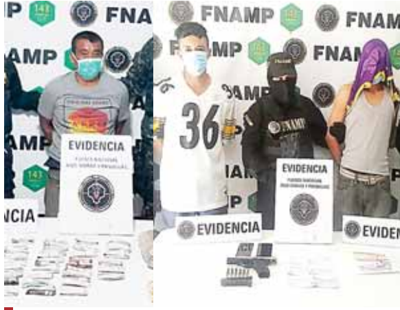
Los detenidos fueron puestos a la orden de las autoridades competentes para que respondan por lo que se les acusa.

También se les decomisó tres talonarios de rifa ficticia con los que pretendían recolectar una fuerte suma de dinero, amenazando a sus víctimas con quitarles la