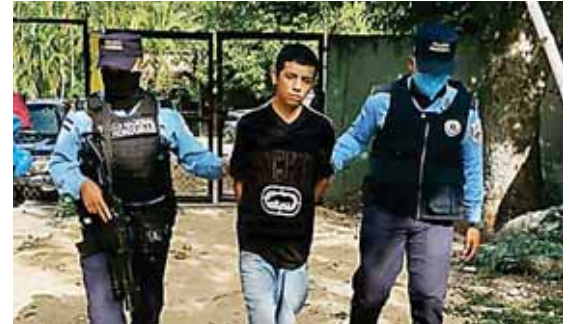
Los agentes trasladaron a este ciudadano a la Fiscalía de Turno del Ministerio Público junto a la evidencia decomisada.

Según información policial, estas dos personas son miembros de la estructura criminal MS 13 y su función era el traslado y venta de drogas en barrios y colonias de este municipio.