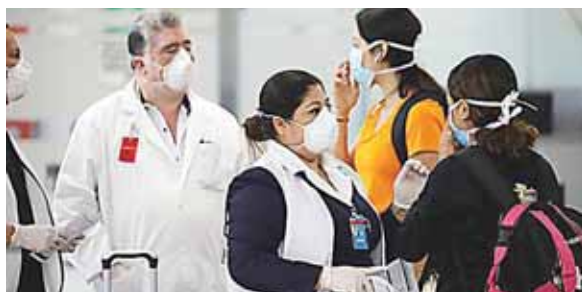
De acuerdo con información del Ministerio de Relaciones Exteriores, el Gobierno de El Salvador ha repatriado a 2,170 compatriotas.

Reiteró que el Gobierno "debe planificar e implementar una política