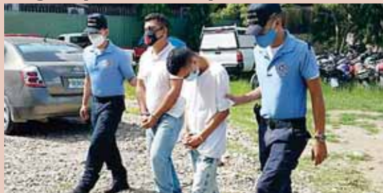
Los detenidos deberán comparecer ante las autoridades competentes para responder por lo que se les acusa.

menor de 17 años de edad, jornalero, originario y residente en el mismo municipio.