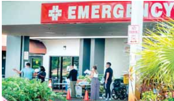
Estados Unidos añadió ayer a sus 3 millones de infecciones por la COVID-19 otros 58,000 nuevos casos.

Según datos del Southeast Texas Regional Advisory Council (SE-TRAC), los hospitales de Texas está al 95% de su capacidad en las unidades de cuidados intensivos, al tiempo que en Florida 56 centros hospitalarios han alcanzado el máximo en estas unidades críticas, con otros 35 al borde del colapso. En Florida una de cada cinco pruebas del nuevo coronavirus SARS-CoV-2 tiene resultado positivo, mientras que en Arizona esa ratio, difícil de encontrar en otra parte del mundo, es de una de cada cuatro. Este dato desmienta