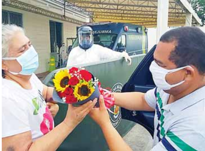
Con mucha alegría los recuperados de COVID-19 salen para reunirse con sus familiares y retornar a sus hogares.

Este lugar (la Unidad Estabilizadora Municipal) es maravilloso