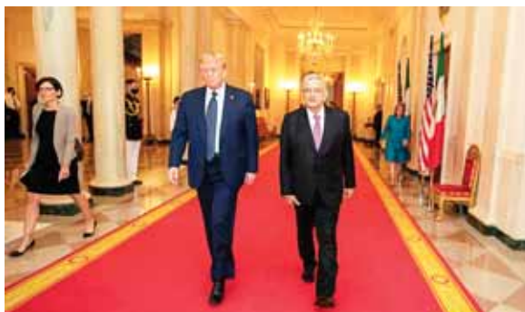
Ambos mandatarios se intercambiaron elogios, evitaron el enfrentamiento y dejaron de lado los asuntos más espinosos de carácter bilateral.

salvo que Trump consiga la reelección. Si pierde Trump, López Obrador va a tener que empezar de cero una relación con Biden”, opinó el internacionalista.