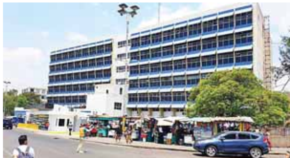
La autorización se hace para equipar más rápido de insumos el HEU y poder combatir los efectos sanitarios provocados por la pandemia de coronavirus.

Anteriormente, el Congreso Nacional había aprobado la "Ley de Auxilio al Sector Productivo y a los Trabajadores ante los Efectos de la Pan-