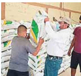
El Bono Cafetalero consiste en la entrega de fertilizante a los productores, junto con asistencia técnica, para que mejoren sus cosechas.

“Créanme que lo que estamos haciendo con estos productores y esta agroindustria cafetalera le va a impactar la vida a usted, compatriota, este es un gran esfuerzo que va a tener un