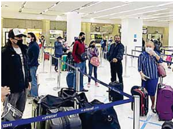
A raíz de la pandemia los hondureños se quedaron varados en el extranjero, pero el CN aprobó L8.4 millones para repatriarlos.

“El primer vuelo aterrizará en el aeropuerto de San Pedro Sula, porque estamos hablando de una aeronaue de gran capacidad pues trae a 295 hondureños que estaban en España”, según la funcionaria.