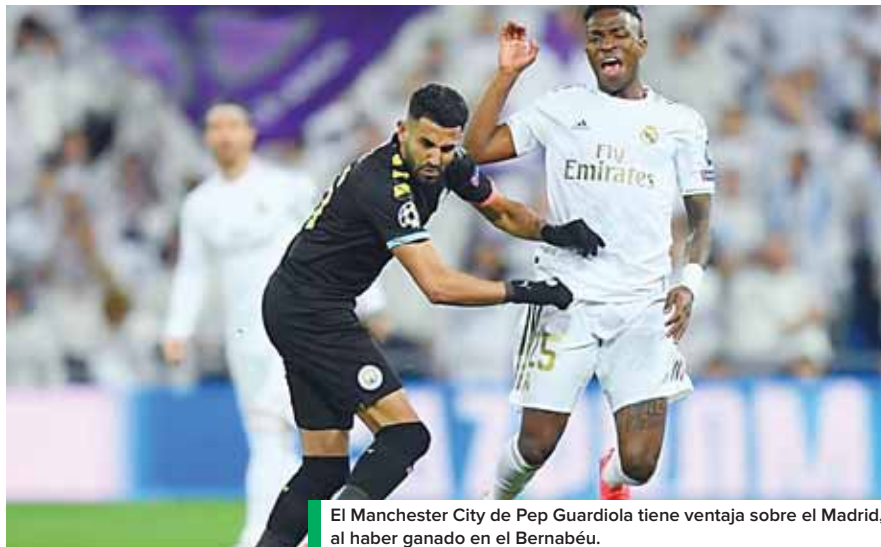
El Manchester City de Pep Guardiola tiene ventaja sobre el Madrid, al haber ganado en el Bernabéu.

El Leeds United del argentino Marcelo Bielsa está cada vez más cerca de la clasificación en la 'Premier League' tras golear por 5-0 al Stoke City, una victoria que le sirve para recuperar el liderazgo del 'Championship' (Segunda división inglesa). El conjunto de Bielsa superó sin excesivos problemas al Stoke, con un tanto incluido del español Pablo Hernández. El Leeds es líder de la clasificación con 81 puntos. En el 'Championship' suben de forma directa los dos primeros clasificados.