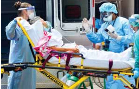
La operación está alineada con el acuerdo Stand-by que Honduras alcanzó en julio de 2019 con el Fondo Monetario Internacional (FMI).

Según el Banco Central de Honduras, el Producto Interno Bruto (PIB) del país caerá en 2020 entre 2.9% y 3.9% por el impacto del coronavirus, mientras que se espe-