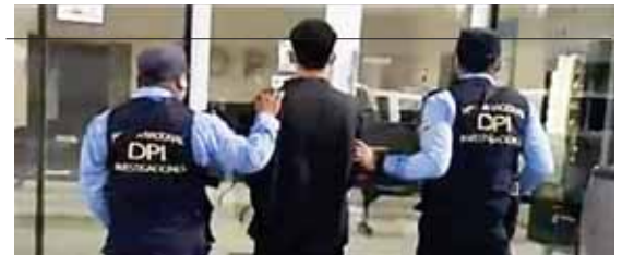
El sospechoso fue trasladado a la Fiscalía de Santa Cruz de Yojoa, donde se continuará con el debido proceso legal en su contra.

Al momento de su detención se le decomisó como evidencia, trece bolsas plásticas transparentes, conteniendo en su interior hierba seca, supuestamente marihuana.