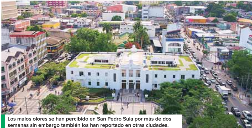
Los malos olores se han percibido en San Pedro Sula por más de dos semanas sin embargo también los han reportado en otras ciudades.

La funcionaria manifestó además que la entidad está efectuando análisis de agua residual en varios puntos de la ciudad. “Hasta este momento, no tenemos los