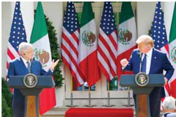
Para muchos, la cita es un “espaldarazo electoral” al magnate republicano.

Como prueba, dijo, están las ofrendas florales que AMLO depositó ante los monumentos de Abraham Lincoln y Benito Juárez, dos ex presidentes que mantuvieron “una muy respetuosa y fuerte relación” en el siglo XIX.