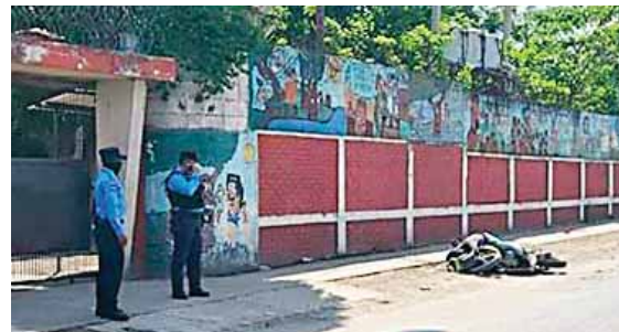
El cuerpo del joven quedó tendido en la acera, aun sobre su motocicleta.

Un joven de 19 años, originario de Lepaera, Lempira, fue detenido ayer en la aldea El Salitrillo, de Santa Rosa de Copán, luego de ser denunciado en la Policía Nacional por el supuesto delito de agresiones sexuales en contra de una menor de edad.