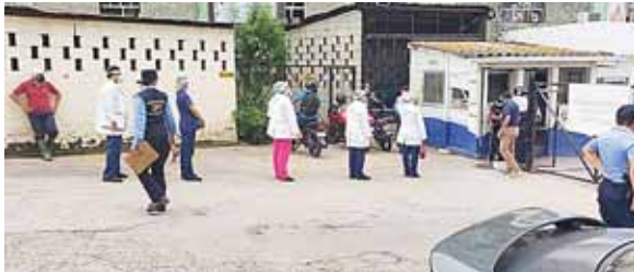
Las auditorías fueron llevadas a cabo por un equipo multidisciplinario en acompañamiento de la Secretaría del Trabajo y Seguridad Social.

En ese sentido se hicieron algunas recomendaciones, como la de cambiar los pediluvios artesanales