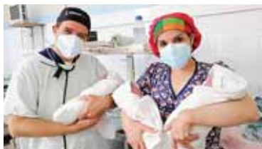
Las recién nacidas se encuentran bien en la sala de neonatos recibiendo toda la atención médica necesaria.