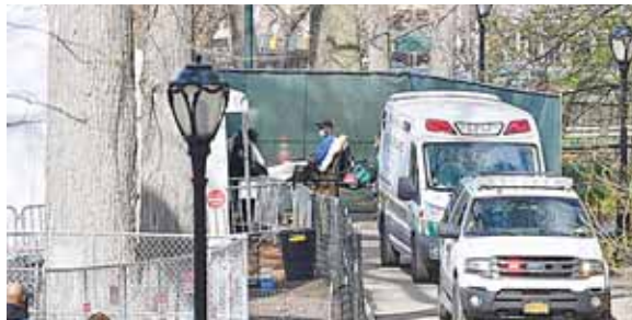
131,666 fallecidos se han registrado en Estados Unidos por COVID-19, según el recuento.

Ante esta situación, el vicepresidente estadounidense, Mike Pence, indicó que los esfuerzos del grupo de trabajo de la Casa Blanca para el coronavirus se están centrando en los estados que concentran la mitad de los nuevos contagios: Arizona, Florida y California, donde la principal carencia es la escasez de personal médico.