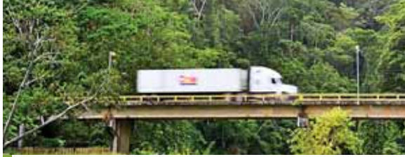
Un camión de Chiquita se dirige a Guatemala, desde donde realizan ahora sus exportaciones.

En ese sentido, Castro sostuvo que “la situación es preocupante porque unas 160 cooperativas que se dedican a la producción bananera en Guanchías y San Manuel, Cortés, ya no tendrán cómo com-