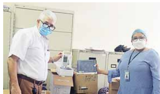
Estos implementos serán utilizados para la sala de neurocirugía pediátrica del centro asistencial.

“Apoyar a las Mipymes es una prioridad de la CCIC y este programa de capacitaciones que ha diseñado Unitec será fundamental para adquirir conocimientos que les permitan sobrevivir ante la situación que enfrentamos. Agradecemos a Unitec por este gran aporte para todos nuestros afiliados y emprendedores en general”, concluyó Barquero.