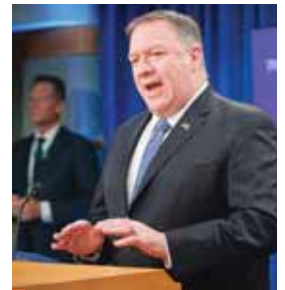
Pompeo reiteró la postura estadounidense de que la OMS no "ha sido incapaz de cumplir su propósito fundamental".

No obstante, Pompeo aseguró hoy que la OMS es responsable de "no haber prevenido una pandemia global", de la extensión del virus y con las inmensas pérdidas