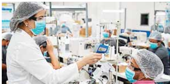
La AHM ha manifestado que en las diferentes empresas se ponen en práctica los diferentes protocolos de seguridad.

Matamoros enfatizó que la maquila se convirtió en un centro de triaje, esto debido a que cada trabajador que se presenta a sus labores se le hacen los análisis correspondientes, así como prueba rápidas, se le toma la temperatura. Agregó que si acaso está contagiado de COVID-19, se remite a su casa y se le da atención y seguimiento al caso y si en un caso se llega a complicar, les facilitan una ambulancia.