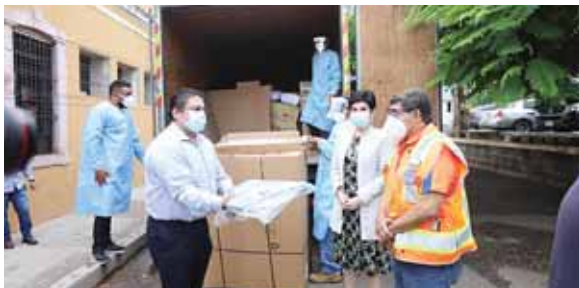
Las autoridades hicieron la entrega que incluye botas, cubre zapatos, overoles, gorros, mascarillas N95 y Kn95.

Las caretas donadas son fabricadas de botellas plásticas recicladas y