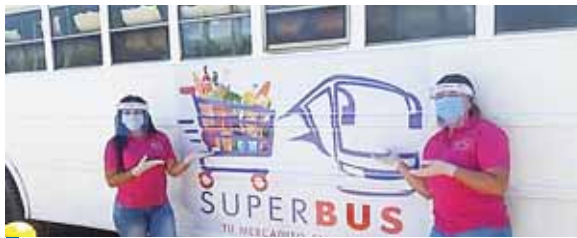
El Súper Bus le ahorrará a la población el dinero en transporte porque estará en cada barrio de la ciudad.