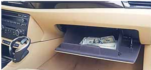
Los dólares fueron encontrados en la guatera de una camioneta de lujo, una BMW, color café.

Durante esas labores, los policías identificaron que, en el interior de uno de los vehículos, se ve una fuerte cantidad de dólares, por lo que de inmediato coordinaron con Dirección Nacional Policial Antidrogas y oficiales de aduanas UCC hacer las diligen-