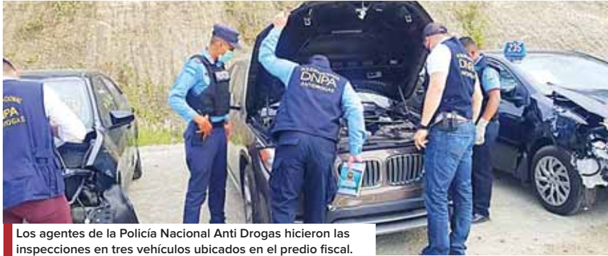
Los agentes de la Policía Nacional Anti Drogas hicieron las inspecciones en tres vehículos ubicados en el predio fiscal.

EL DINERO ESTABA EN UN BMW INGRESADO DE ESTADOS UNIDOS