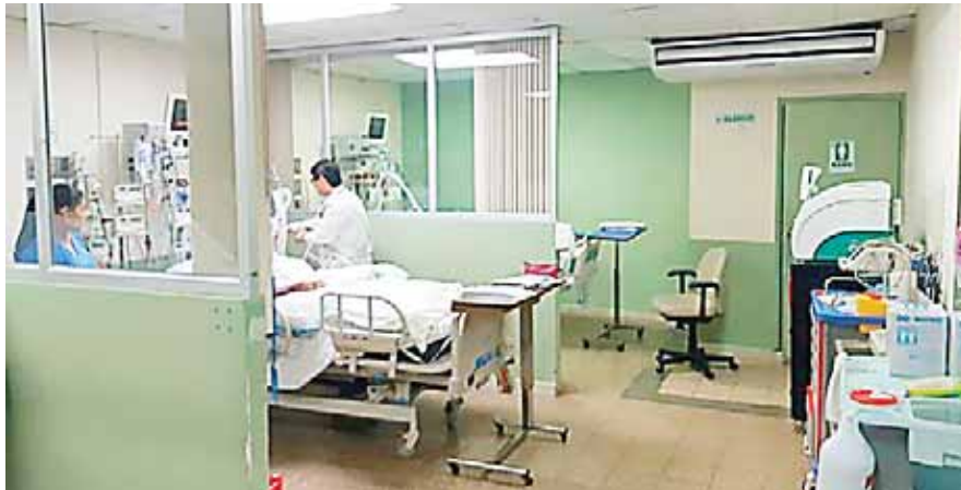
Muchas de las personas que llegan al Seguro Social en busca de ayuda médica, ya van con la enfermedad avanzada.

“Creo que nos falta mucho en los procesos generales de educación para poder respetar al ser humano: a la persona que fallece y sus familiares, pero en general, algo que es bien claro y conceptual es que a los hospitales llegan enfermos y desafortunadamente van a haber fallecidos”,