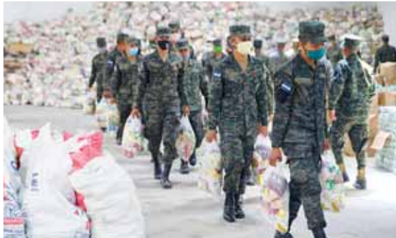
El Estado ahorra más de 15 millones de lempiras en la compra de los alimentos.

Durante la conferencia se compartieron algunos testimonios de personas beneficiadas por