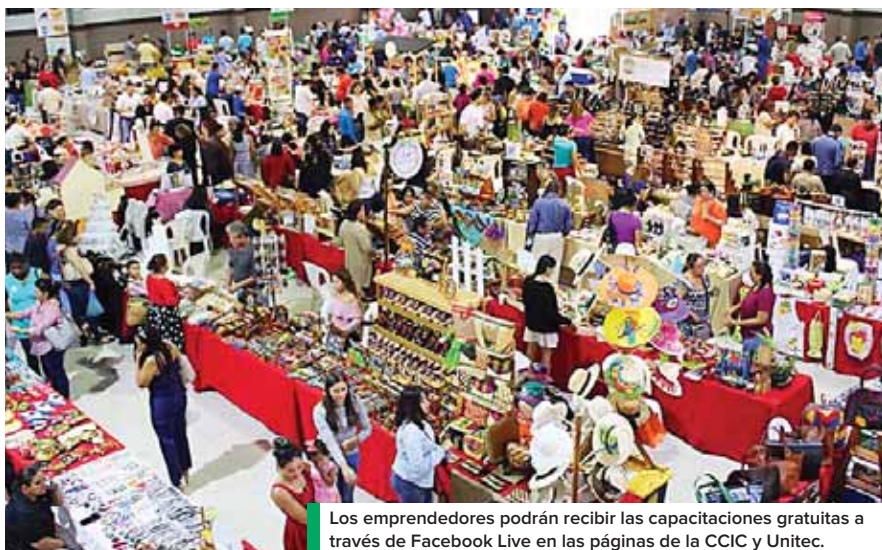
Los emprendedores podrán recibir las capacitaciones gratuitas a través de Facebook Live en las páginas de la CCIC y Unitec.