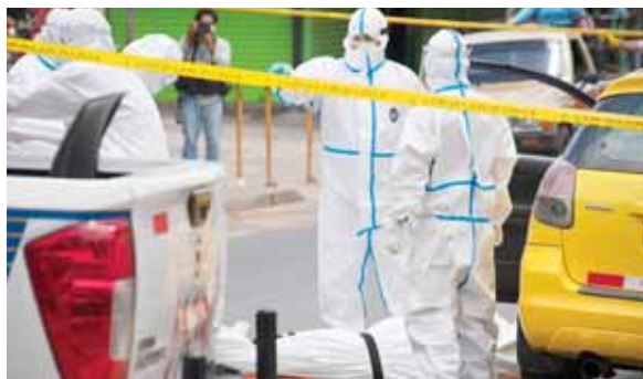
Hasta el martes, en El Salvador se registran 8,566 casos confirmados de COVID-19, de los que 235 personas han fallecido y 5,133 salvadoreños se han recuperado.