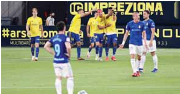
De ascender a la primera, el cuadro cadista tendrá que comprar el pase del catracho.