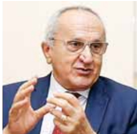
El doctor Jesús Seade tiene amplia trayectoria profesional y académica en más de varios países.

3. Trabajar en la solución de diferencias, garantizar el pleno funcionamiento del OSD y crear mecanismos para realizar un mejor se-