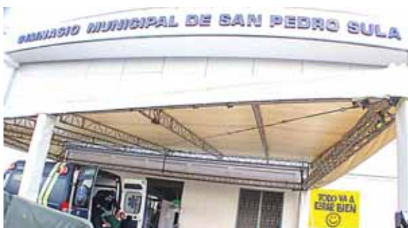
Hasta ahora, esta es la primera muerte que reporta esta sala.

El obsequio fue entregado al médico de cabecera y luego se comunicaron vía teléfono para felicitarlo y mirarlo desde lejos.