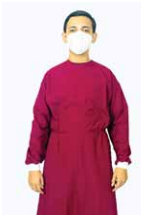
SOLRAC le dio un giro a su negocio y hoy fabrican equipo de bioseguridad.