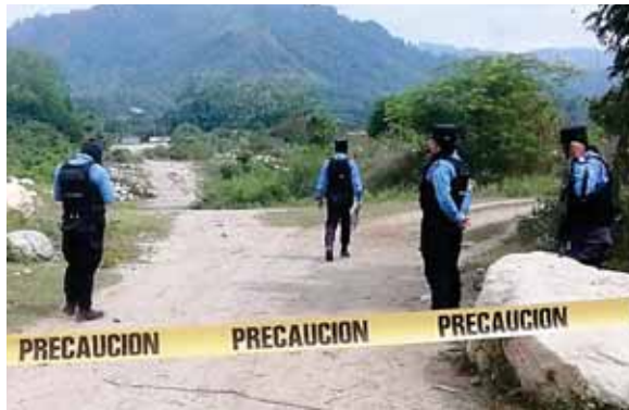
Mientras que el segundo cuerpo ejecutado fue encontrado a la orilla del río Ocotillo, en la aldea La Jutosa.

Horas más tardes, la Policía Nacional, a través del Sistema Nacional de Emergencia 911, fue alertada del hallazgo de un cuerpo en el interior de una bolsa para basura, en la aldea La Jutosa, de ese mismo