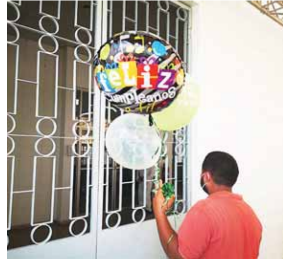
Con globos llegaron los hermanos quienes celebraron el natalicio de su padre positivo de COVID-19.

Por su parte, el neumólogo Carlos Aguilar relató que no hay una vacuna ni una cura contra la COVID-19, por lo que la población debe implementar todas las medidas de bioseguridad para evitar el contagio del virus.