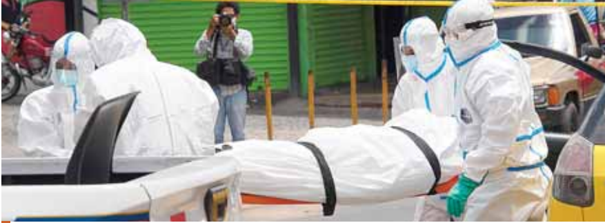
Las cifras oficiales indican que se contabilizaban en el país 7,507 casos positivos del nuevo coronavirus, entre ellos 210 fallecidos y 4,573 curados.