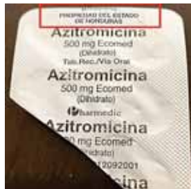
En el sobre de las pastillas azitromicina aparece que este medicamento es propiedad del Estado de Honduras, el cual está siendo comercializado.

El tratamiento MAÍZ, según han explicado algunos médicos, se apli-