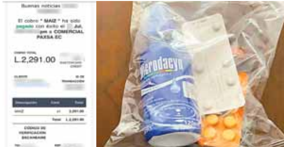
El precio total del tratamiento es 2,291 lempiras, y es enviado con las indicaciones que debe de seguir el paciente.

En este caso, la sorpresa de la persona que hizo la denuncia fue que al abrir sus medicamentos, que adquirió en una página de nombre “Biomedihm” notó que en el sobre de las pastillas llamadas Azitromicina,