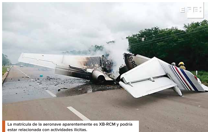
La matrícula de la aeronave aparentemente es XB-RCM y podría estar relacionada con actividades ilícitas.

Capella compartió dos videos en los que se ve la aeronave destrozada e incendiada, bajo una