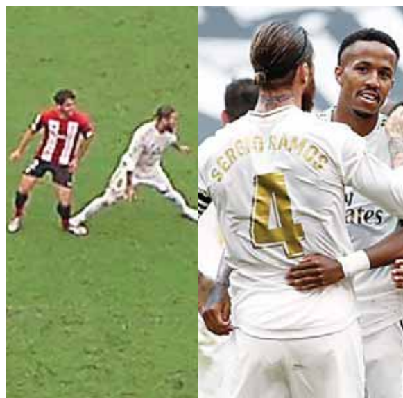
Sergio Ramos de nuevo sentencia desde el punto de penal, tres puntos que les acerca al campeonato.