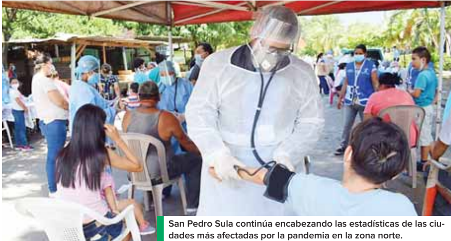
San Pedro Sula continúa encabezando las estadísticas de las ciudades más afectadas por la pandemia en la zona norte.