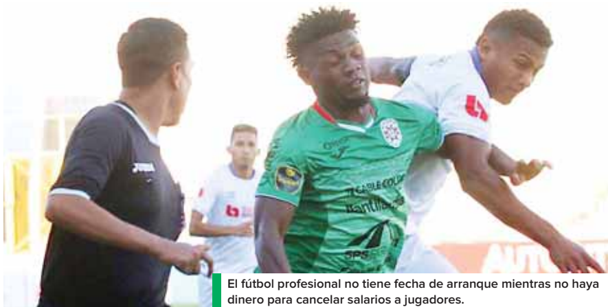
El fútbol profesional no tiene fecha de arranque mientras no haya dinero para cancelar salarios a jugadores.