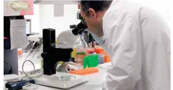
La microscópica ameba, llamada "comecerebros" se encuentra principalmente en lagos, ríos, estanques y aguas termales.

Dos cuerpos, por separado, fueron sacados el mismo día de las aguas del río Hudson por la Policía de Nueva Jersey, según informaron ayer medios locales. Una mujer, de unos 22 años, de Nueva York, fue el primer cuerpo hallado flotando cerca de la costa de Jersey City y la segunda víctima