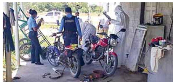
Las autoridades se trasladaron a la zona para poder dar inicio con las investigaciones y hacer el levantamiento correspondiente.

Las autoridades del Ministerio Público se trasladaron hasta los lugares de los hallazgos para hacer el levantamiento respectivo de los cuerpos y posteriormente ingresarlos a la morgue sampedrana.