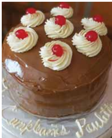
Puede hacer sus pedidos a través de Facebook: Delipostres by Jackie M.