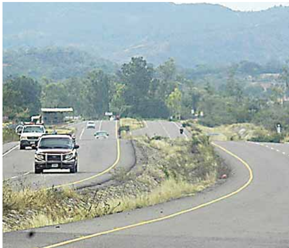
Murillo ratificó tener la disponibilidad financiera para cumplir con los gastos operativos y funcionamiento de la estatal portuaria.

Molina expresó que el Gobierno se cuidó de no afectar el fondo que la misma ENP transfiere al Ejecutivo producto de las utilidades que percibe por la prestación