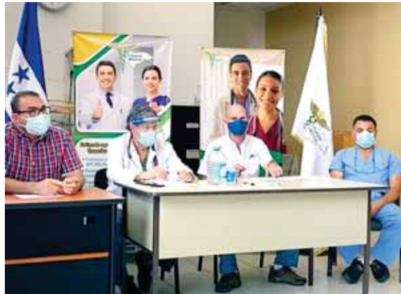
Ante el incremento de casos COVID-19, las autoridades del Colegio Médico y de la CCIC se reunieron para informar sobre la solicitud de cierre.

“¿Qué es lo que no se entiende?, ¡por el amor de Dios!, cierran to-