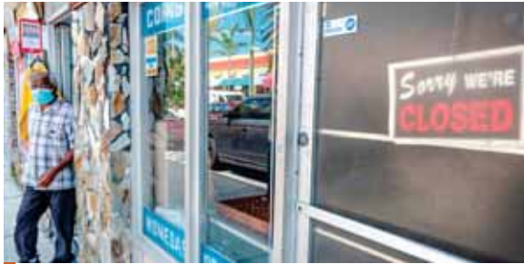
Sugieren que implementen el uso obligatorio de cubrirse la cara sobre la nariz y la boca mientras (la persona) está en un negocio u otro edificio abierto al público.

Ante el "alarmante" incremento, el alcalde de Miami-Dade, Carlos Giménez, mantiene un toque de queda por ahora indefinido, de 10:00 de la noche a 6:00 de la mañana, y tuvo sus playas cerradas durante el fin de semana festivo de 4 de Julio, incluyendo el día de hoy. El condado vecino de Broward tuvo ayer su propio récord de casos diarios, con 1,664 en las últimas 24 horas, para un total de 21,239 y 411 fallecimientos, mientras que el de Palm Beach llegó a los 16,836 pa-