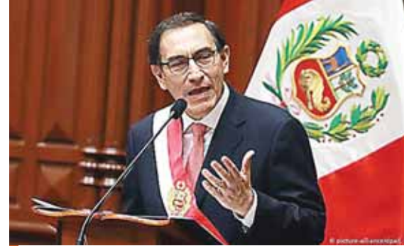
Presidente de Perú, Martín Vizcarra.

“Para que el avance de las fases del plan de reapertura económica pueda seguir, es importante que todos los salvadoreños practiquemos las medidas de bioseguridad y, si no es totalmente necesario salir, que nos quedemos en casa”, reseñó el Gobierno. AFP