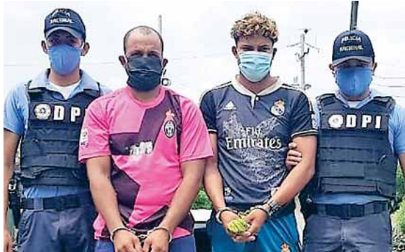
Los capturados fueron puestos a disposición del Juzgado correspondiente para su judicialización.

vo, el pasado 29 de junio del año en curso, la víctima se conducía en su motocicleta cuando fue interceptado por varios desconocidos en