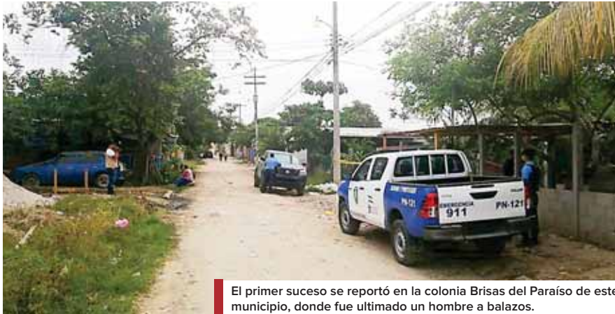
El primer suceso se reportó en la colonia Brisas del Paraíso de este municipio, donde fue ultimado un hombre a balazos.