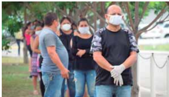
El tratamiento del virus, al ser una afección respiratoria, es cubierto como cualquier enfermedad por las pólizas de seguro.

“Las compañías de seguros garantizan la continuidad del servicio mediante canales electrónicos y virtuales que se han puesto a disposición de sus asegurados, intermedia-