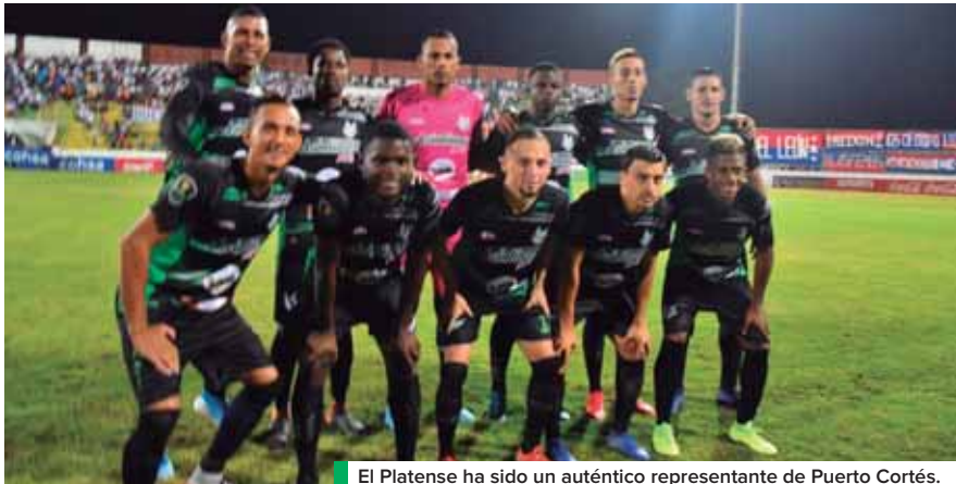
El Platense ha sido un auténtico representante de Puerto Cortés.

Con la eliminación de los torneos regionales en Honduras, se fundó entonces, la Liga Nacional No Aficionado en 1964, y el Club Platense, pasó a formar parte de