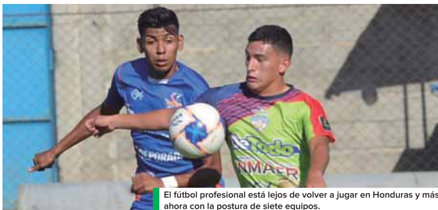
El fútbol profesional está lejos de volver a jugar en Honduras y más ahora con la postura de siete equipos.