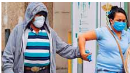
Los departamentos de Francisco Morazán y Cortés son los más afectados por la pandemia.

TEGUCIGALPA. Los muertos en Honduras por COVID-19 aumentaron ayer a 605, con 14 nuevos decesos, confirmados ayer por el Sistema Nacional de Gestión de Riesgos (Sinager).