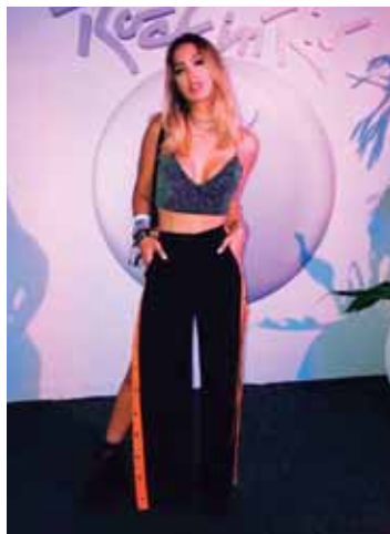
Pants con abertura

Según Pantone el color Biscay Green será un top esta primavera. No entendemos muy bien qué significa el color, pero básicamente es un color agua de ensueño para tus looks.