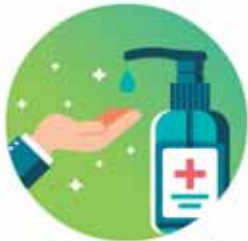
Cargar tu gel