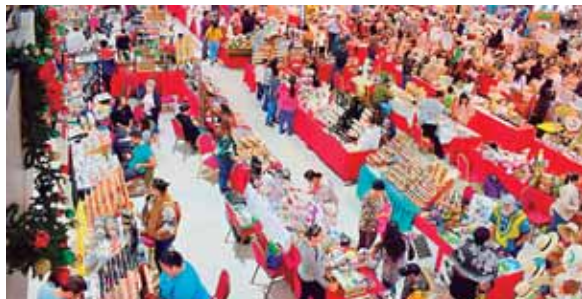
El fondo de garantía de Mipymes, el BCH aportó los primeros 1,250 millones de lempiras.

Asimismo, con el fondo de garantía de Mipymes, el BCH aportó los primeros 1,250 millones de lempiras y ya hay beneficiarios