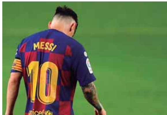
La bomba explotó luego del récord que alcanzó Messi en el choque frente al Atlético Madrid, donde celebró el gol 700 de su carrera.

se tranquilos que me voy. Puedo fallar un penal, puedo perder la Liga o que no me vaya bien en un partido, pero no quiero que me consideren la mano negra del Barcelona”, fue la frase que, en teoría, dijo el capitán del equipo a su círculo más cercano.