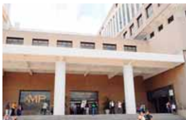
El caso surge a partir de una denuncia de la Comisión Presidencial contra la Corrupción del pasado 16 de junio.