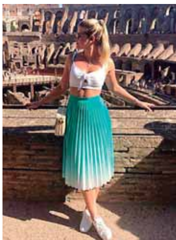
Atrévete a usar el Biscay Green

No importa el año que sea, este look siempre lucirá bien, sobre todo con prendas de calor, faldas, jeans, shorts, pescadores, nada debajo, etc.