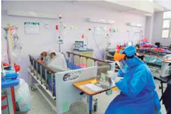
El funcionario mencionó que todavía es tiempo de hacer las cosas bien para disminuir la cantidad de muertes.

Afirmó que “el no haber reforzado nuestras propias instalaciones hospitalarias nos está pasando factura. Esto no lo digo con el