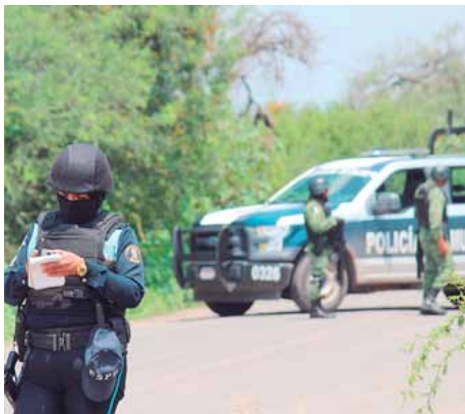
Agentes policiales llegaron a resguardar la escena del crimen, así como también a realizar las debidas averiguaciones.

APASEO EL ALTO (MÉXICO). Cinco policías estatales fueron asesinados en el municipio de Jerécuaro, en el céntrico estado mexicano de Guanajuato, donde hace unos días tuvo lugar la masacre de 26 jóvenes al interior de un centro de rehabilitación.