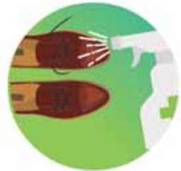
Desinfectar tus zapatos rociándolos con una mezcla de agua y cloro