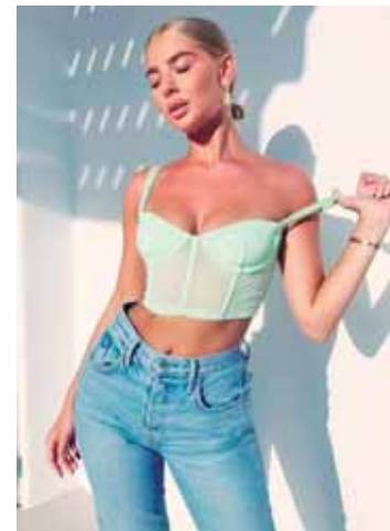
Un look con un top neón

Ya podrás salir con tus camisetas XXL sin nada encima, es decir una sudadera o suéter con tu pura playera será más que suficiente.