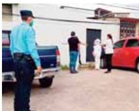
Por primera vez este país registró una leve disminución de casos.

TEGUCIGALPA. A fin de detectar posibles sospechosos asintomáticos de portar la COVID-19 ayer, agentes de prevención y seguridad comunitaria de la Policía Nacional acompañaron a funcionarios del Sistema Nacional de Gestión de Riesgos, Sinager, en las brigadas de detección y con ello evitar la propagación masiva de este virus.