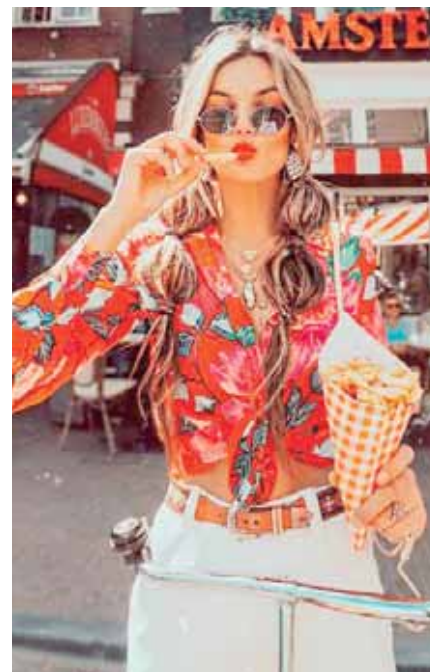
Camisas con estampado hawaiano