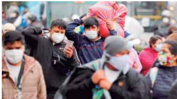
Sugieren a los países mirar sus datos de casos y decesos por coronavirus porque “los datos no mienten” y los pueden guiar al momento de tomar decisiones difíciles.

“En la OMS entendemos que hay razones económicas por las que los países necesitan abrir sus economías, que mucha gente en Latinoamérica depende de ingresos diarios, que no tienen salarios ni un cheque que les