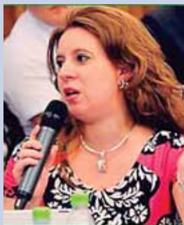
tas del Consejo Directivo de Invest-H”, afirmó.