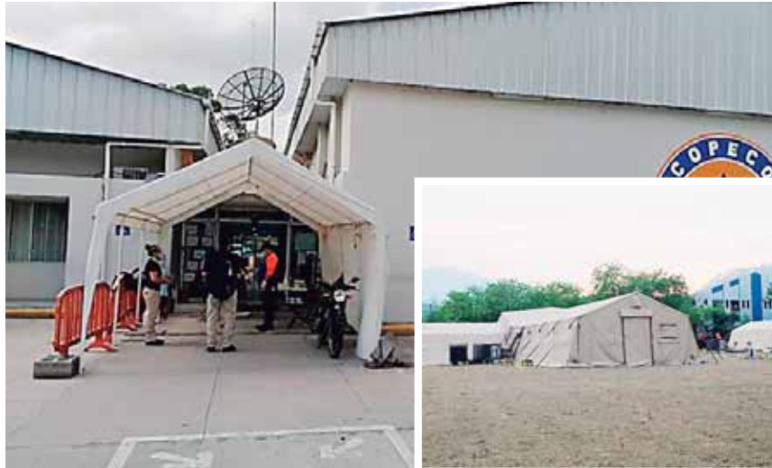
Los agentes llegaron ayer en horas de la mañana a las instalaciones de COPECO para decomisar los documentos referentes a la compra del hospital móvil.

Según Copeco, la ATIC fue citada por la Secretaría General pa-