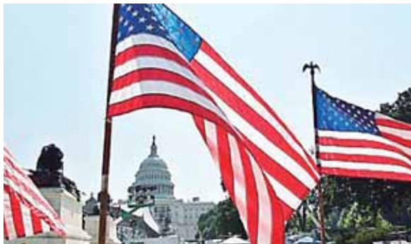
Los festejos de Trump continuarán mañana sábado en Washington DC, donde se ha programado la segunda edición del "Saludo a América".

El presidente estadounidense, Donald Trump, abrió ayer la celebración de la Independencia con una visita al Monte Rushmore, famoso por los rostros de cuatro exmandatarios tallados sobre la montaña, donde habrá una exhibición de fuegos artificiales.