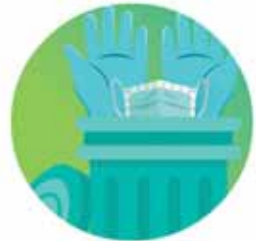
Depositar en la basura la mascarilla y los guantes