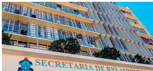
Las instituciones comenzarán a laborar hasta nuevo aviso.

TEGUCIGALPA. Debido al alto número de casos positivos de COVID-19 en el departamento de Francisco Morazán, como en el resto del país, el Gobierno de la República de Honduras ha instruido la suspensión, hasta nuevo aviso, de la reapertura de las instituciones gubernamentales.