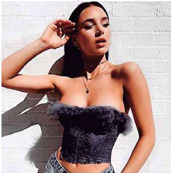
Los tops overshoulder están out

¡El calor ya llegó! Ya puedes salir de tu casa, esto quiere decir que dentro de poco los looks frescos se verán en todos lados, te recomendamos ir usando estas prendas en tendencia: