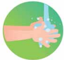
Lavarte las manos con suficiente jabón por al menos 20 segundos

Con estas sencillas medidas hacemos mucho por nuestra salud y la de los que nos rodean