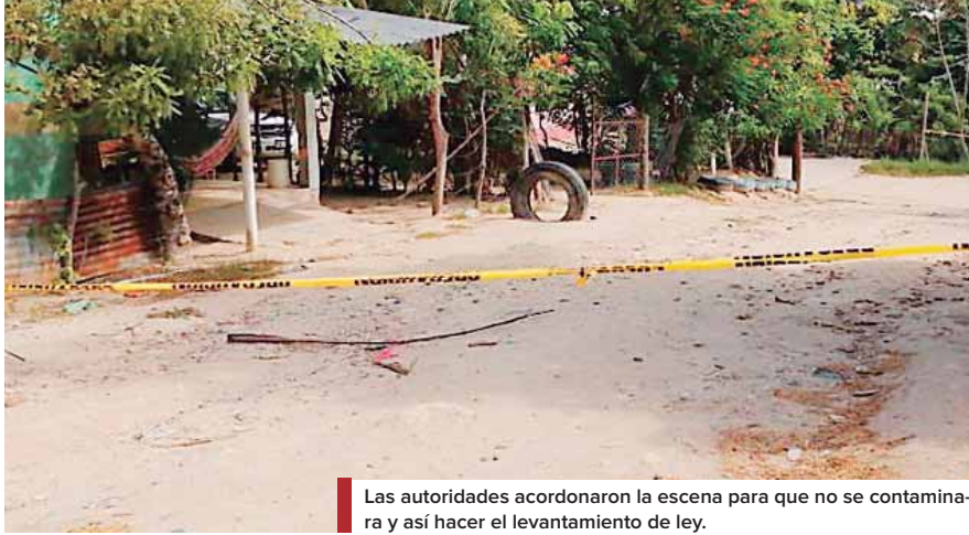
Las autoridades acordonaron la escena para que no se contaminara y así hacer el levantamiento de ley.

CINCO DESCONOCIDOS LLEGARON Y LOS ATACARON