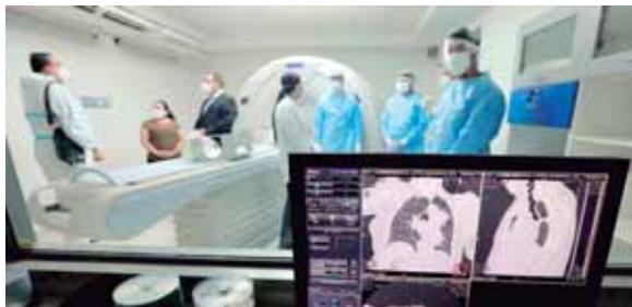
Los primeros seis pacientes fueron atendidos ayer y hay capacidad para recibir 20 personas diarias.

“La idea -continuó diciendo Batres- es diagnosticar bien y tratar bien. Aquí vamos a dar el medica-