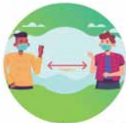
Mantener la distancia de un metro con otras personas