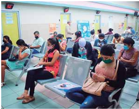
Un promedio de 17 especialidades atiende ahora la Clínica Periférica de Tepeaca.