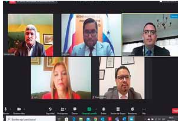
La entrega y presentación del PEI del CNE 2020-2024, se hizo en “conferencia virtual” y bajo el lema “¡La Democracia no está en Cuarentena!”

“Sino también que sea un órgano referente y que genere la confianza y certeza del pueblo hondureño, de que las decisiones de la mayoría serán respetadas, a través del empo-