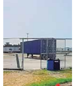
Ambos países acordaron la medida el pasado 20 de marzo.

A la semana se estima que llegaban cuatro barcos, en los cuales se manejaban alrededor de 600 contenedores entre mercancías de importación y