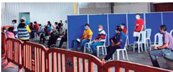
Dos triajes estarán en el bulevar Juan Pablo y en el Multimercado Mayangle.

El propietario del Mayangle está donando el espacio para que opere ese triaje en ese sector de la ciudad gemela en esta fase crítica de la pandemia, indicó. La empresa privada y el Instituto Hondureño de Seguridad Social (IHSS) acordaron construir el tercer triaje en un sector del Distrito Central (DC) para que las personas puedan a recibir atención médica temprana, afirmó.