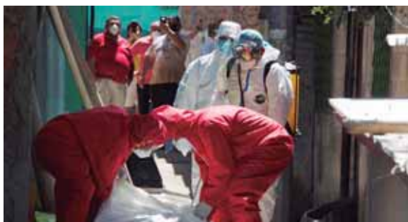
Etienne dijo que el pico de contagios en Latinoamérica se producirá en diferentes momentos.

Etienne dijo que los gobiernos deben responder a la pandemia basados en datos de vigilancia epidemiológica “cada vez más detallados”,