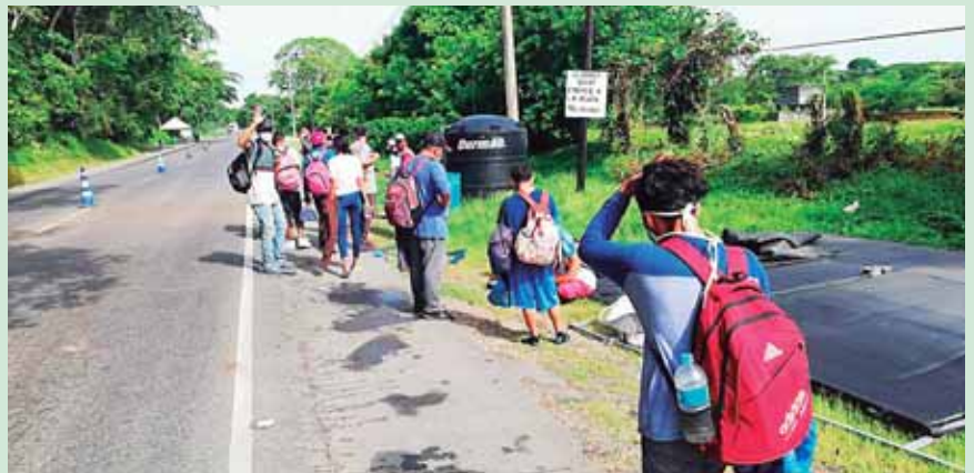
La caravana es la tercera durante el año, las dos anteriores partieron en enero por los puntos aduaneros de Corinto y Agua Caliente.

que muchos continuaron su marcha pasando por potreros. Minutos más tarde, en Cuyamel fueron detenidos varios compatriotas y en Corinto los pocos que lograron llegar fueron devueltos. Los agentes policiales dijeron haber recibido la orden de no dejarlos pasar. Cuando la caravana había avanzado las autoridades locales fueron instruidas también a frenarlos. Para muchas autoridades la contención se debió haber hecho en La Gran Terminal sampedrana. En Corinto al otro lado de la guardarraya con Guatemala desde muy temprano de ayer se vieron unidades del ejército y patrullas policiales del hermano país centroamericano en posición de alerta para frenar el eventual ingreso de