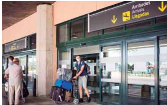
La lista de países fue aprobada por mayoría cualificada, es decir, con el apoyo de al menos el 55% de los países que representen al menos el 65% de la población.

La elaboración del listado se prolongó durante las últimas semanas por discusiones entre los Estados miembros y dejó fuera a más de 150