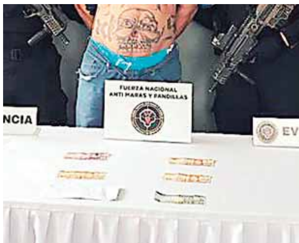
La evidencia decomisada y el detenido fueron remitidos a las autoridades correspondientes.

“El Cura” ya había sido detenido en una ocasión por asesinato el 16 de agosto del año 2000 por la Policía Nacional.