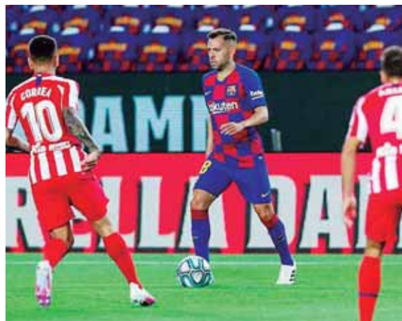
El Barcelona volvió a ceder puntos y le abre las opciones al Real Madrid.