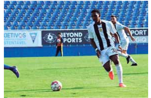
Róchez militó en el Real España y el Orlando FC de la MLS.

Róchez, había manifestado su interés de buscar nuevos horizontes, pero siempre en Europa, y tras la oferta que le hizo el club cambió de opinión. El delantero hondureño, de 25 años, llegó al Nacional en la temporada 2017/18, y en su estadía en el club, ha anotado 26 goles en todas las competiciones.