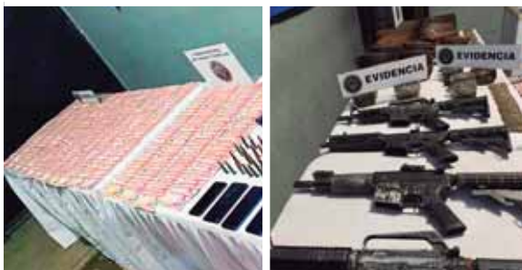
Detenciones de impacto, decomisos de droga, dinero y armas son algunos de los resultados que se han reportado durante este año.