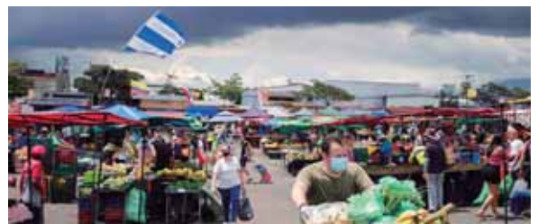
Actualmente hay 44 pacientes hospitalizados, de los cuales cinco se ubican en unidades de cuidados intensivos con edades entre los 43 y 76 años.