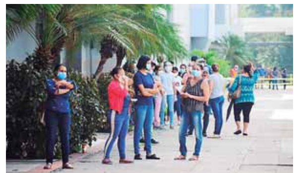
Recientemente se habilitó el centro de triaje de Expocentro, el mismo atiende unas 300 personas diarias.

Asimismo, manifestaba que al paciente se le realizó el hi-