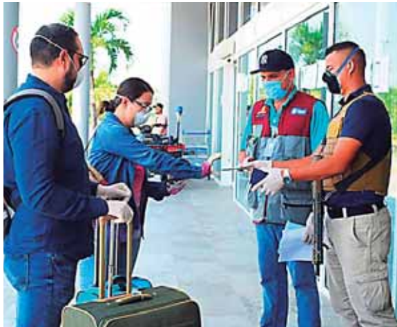
Las agencias de viajes pasan por el peor momento registrando en ocasiones un 1% por vuelos humanitarios.

“Desde hace más de tres meses la actividad está en cero en nuestras agencias, al inicio ya teníamos un 80% de baja en ventas porque