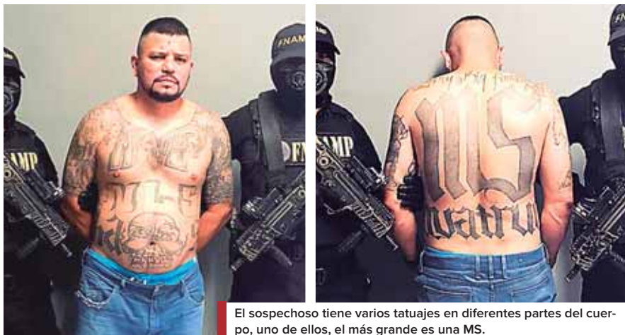
El sospechoso tiene varios tatuajes en diferentes partes del cuerpo, uno de ellos, el más grande es una MS.

“EL CURA” COORDINABA EXTORSIÓN EN ESTE DEPARTAMENTO