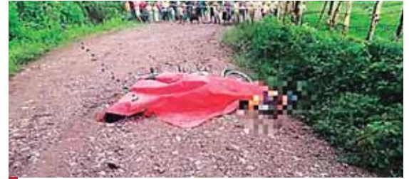
Los cuerpos quedaron tirados en medio de la solitaria calle de terracería, luego de ser atacados a balazos.

Un carpintero, de 23 años, quien es sospechoso de violación especial en perjuicio de una menor de edad, fue detenido ayer mediante una orden de captura girada el dos de septiembre del 2019, por el Juzgado de Letras Unificado de la Sección Judicial de Santa Bárbara.