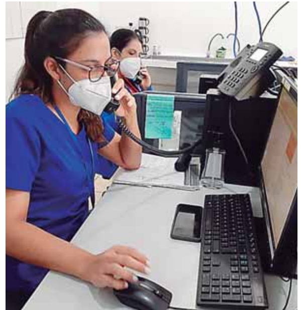
Es importante que los vecinos al presentar síntomas de COVID-19 llamen a los números telefónicos, para que puedan recibir orientación médica adecuada y la atención médica inmediata.

Con este servicio, Caballero explicó que buscan evitar que los ciudadanos asistan de manera apresurada a los centros de salud y hospitales, ya que al llamar se les orienta, dependiendo de los síntomas que presenten y si se trata de sospecha del COVID-19, les indican los lugares donde deben practicarse la correspondiente prueba y además se les brinda las recomendaciones a tomar en sus casas.