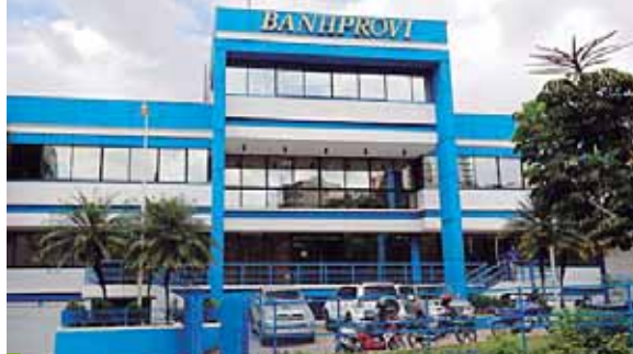
Con este alivio, se ha dejado de percibir 1,140 millones de lempiras.

“Los bancos están regulados, o sea, no pueden hacer nada que el regulador no les permita y si el regulador les permitió readequar eso harán”.