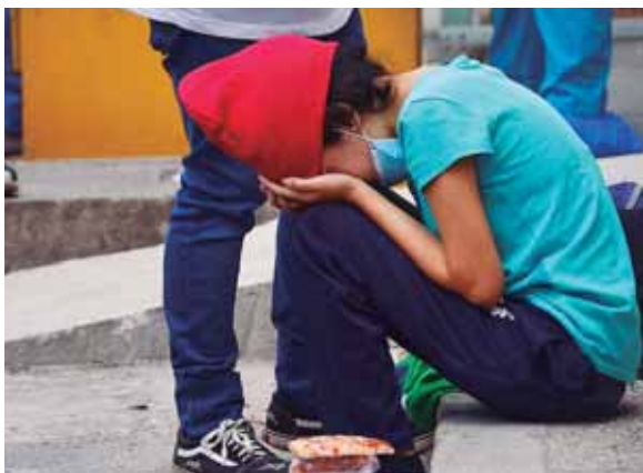
La ministra expresó que también se le está brindando el apoyo necesario al Instituto Hondureño de Seguridad Social.

“Nos hemos comunicado con las autoridades del Seguro Social y ellos tienen el mismo problema, hicieron una solicitud de los reac-