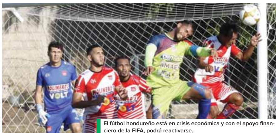
El fútbol hondureño está en crisis económica y con el apoyo financiero de la FIFA, podrá reactivarse.