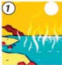
1 El Sol calienta el agua.

Todas las nubes están hechas de pequeñas gotas de agua, de cristalitas de hielo, o de ambos y puede formarse en cualquier clima, en cualquier parte del planeta, pudiendo ser de diferentes formas, que dependen de su altura y de la cantidad de aire de la atmósfera que se mueve hacia arriba.