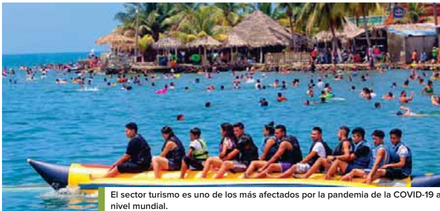
El sector turismo es uno de los más afectados por la pandemia de la COVID-19 a nivel mundial.