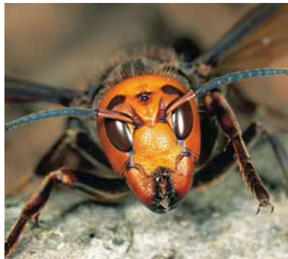
En la región no se ha detectado la presencia del insecto, pero ya se cuenta con una estrategia regional de detección temprana.

No hay que entrar en pánico, pero sí debemos estar alertas y tomar las medidas preventivas”.