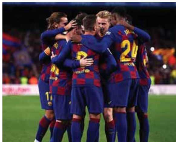
El Barcelona como el Real Madrid tienen 68 puntos en la tabla de posiciones en España.