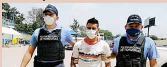
Al detenido también se le supone responsable del delito de asesinato en su grado de ejecución de tentativa y robo.

El motivo de su detención obedece a una orden de captura girada el primero de noviembre del año 2019, por el Juzgado de Letras Penal de la Sección Judicial de Tegucigalpa.