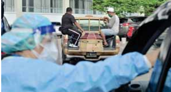
En este centro asistencial están luchando contra la enfermedad del dengue y la epidemia de la COVID-19.

Manifiestó que las muertes de personas sospechosas se dan, en su mayoría porque ya llegan complicadas y hay poco o nada que hacer para salvarles la vida.