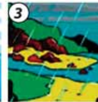
3 Las nubes se enfrían y caen en forma de lluvia.