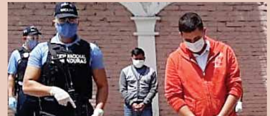
Los detenidos son un hombre de 21 y 30 años de edad, quienes deberán responder por el delito que se les imputa.

SIGUATEPEQUE, COMAYAGUA. Mediante labores de seguimiento, funcionarios de investigación de la Policía Nacional detuvieron en el peaje de ese municipio, a dos individuos por realizar el traslado irregular de siete ciudadanos cubanos.