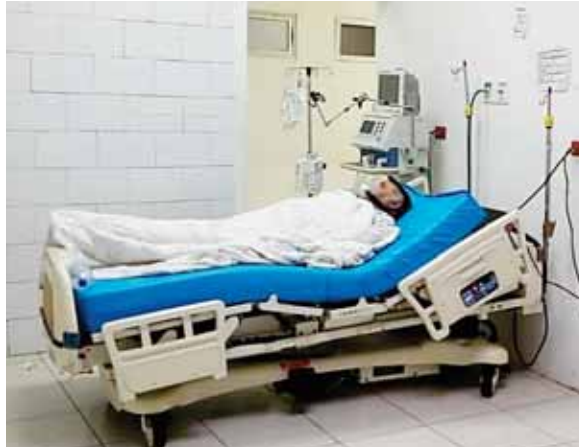
Las autoridades del centro asistencial buscan brindar atención digna a cada paciente necesite ayuda médica.