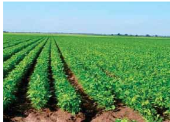
El IHMA anunció que se mantendrá una reserva estratégica de granos de unos 40 mil quintales de granos.

El déficit comercial se redujo 484.9 millones de dólares entre enero y abril de este año, en comparación al mismo período del 2019, como resultado del impacto de la pandemia que redujo en un 12.8 por ciento las importaciones de bienes.