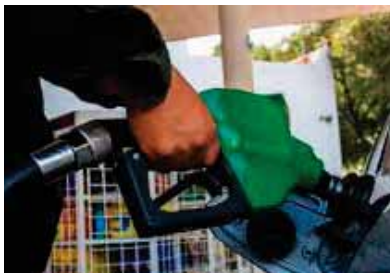
Esto obedece al aumento del precio en el mercado internacional debido al incremento de la demanda del crudo y refinados.

Reconoció que por ahora se registran algunos precios altos del frijol, “pero se debe a la pandemia, aun así muchos países vinieron a Honduras a abastecerse del grano, pese a que no era época de producción”.