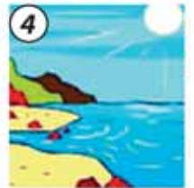
4 Caen en mares, ríos, océanos y al subsuelo.