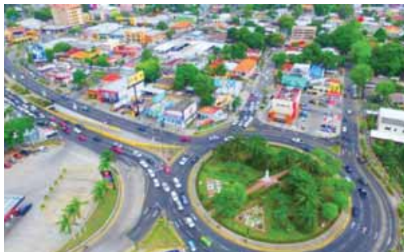
El cierre de la ciudad sería por dos semanas, ya que en San Pedro Sula los contagios no han bajado.

Añadió que “estamos presentando también un modelo de gestión para la emergencia para San Pedro Sula de acuerdo a las necesidades, donde tenga que participar las instituciones del Gobierno central, que puedan trasladar fondos para que localmente se puedan ejecutar y que se le dé más potestad al viceministro de Salud, Roberto