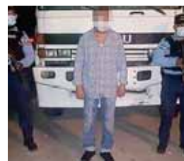
El dinero decomisado fue remitido a las autoridades correspondientes para el conteo respectivo.

de tierras, ya que presuntamente el abogado llegó hasta el lugar para entregar una orden de desalojo a los residentes de esa zona.