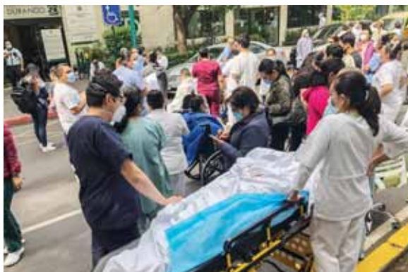
La capital de México, con nueve millones de residentes, contabilizaba 45,125 contagios y 6,116 defunciones.

El miércoles se reactivarán mercados al aire libre; el jueves, peluquerías y salones de belleza. El lunes 6 de julio reabrirán los