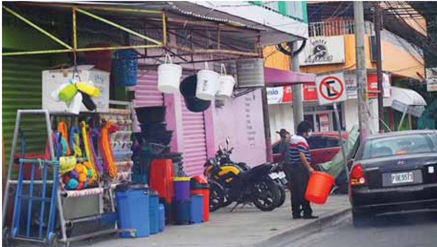
Hasta el momento, muchos pequeños empresarios no cuentan con la autorización para comenzar a funcionar.

“Hay muchas cosas que se pueden hacer para apoyar a la pequeña empresa como por ejemplo, hace poco el Congreso de la República aprobó un decreto por el Poder Ejecutivo pero lamentablemente ese decreto no tendrá ningún efecto en la economía, es insuficiente pues algunos de sus artículos indica de que se da