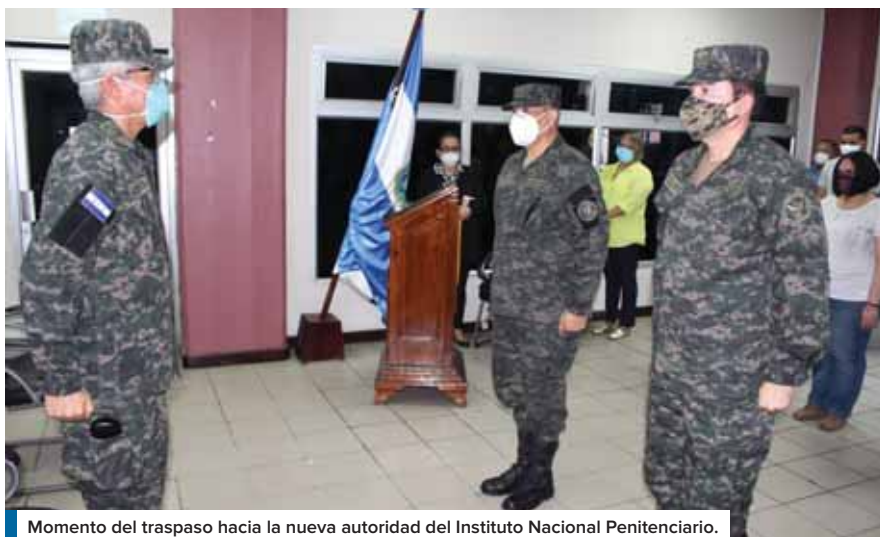
Momento del traspaso hacia la nueva autoridad del Instituto Nacional Penitenciario.

El general recordó que la mayoría de las personas privadas de libertad se encuentran en esa condición por violentar la ley, sin embargo “como autoridades se debe garantizar que las personas privadas de libertad tengan todos sus derechos, el sistema penitenciario tienen que garantizar el derecho a la salud, a la educación y los derechos que la ley establece” y continuó “debemos asegurar que en los presidios se cumplan las medidas de seguridad y evitar que desde ahí se coordinen acciones en perjuicio de la ciudadanía hondureña a quienes estamos en la obligación de proteger, enfatizó.