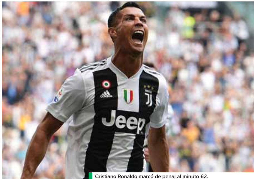
Cristiano Ronaldo marcó de penal al minuto 62.