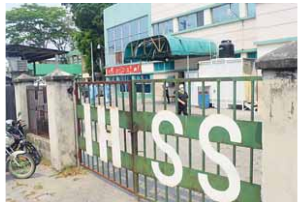
Por ahora los equipos continúan con el proceso de adecuación de la sala.

para la habilitación total de dicho espacio que constará de tres eta-