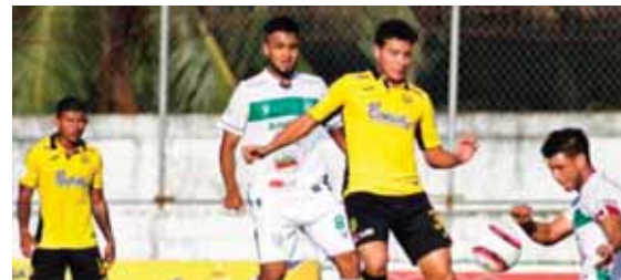
Real España tiene previsto entrenar seis semanas como mínimo antes de iniciar el torneo.