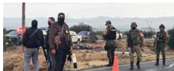
México registró su año más violento en 2019, con un total de 34,608 homicidios dolosos y 1,012 feminicidios.

Las autoridades nicaragüenses ejecutan una estrategia que denominan “Muro de Contención”, que tiene como objetivo evitar la circulación de la droga o dinero vinculado al narcotráfico en los núcleos poblacionales, para la cual mantienen “estrechos lazos de cooperación” con los países de la región, así como Estados Unidos, México y Rusia. EFE