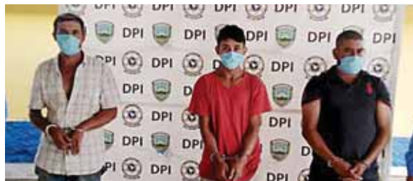
Los detenidos fueron remitidos a las oficinas de una estación policial para posteriormente ser presentados ante la autoridad competente.