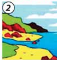
2 El agua se hace vapor y forma nubes.