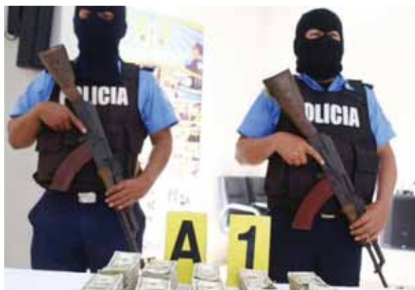
El nicaragüense detenido será remitido a las autoridades competentes para la judicialización de su caso.

Entre las evidencias que la Policía Nacional aportará estará el dine-