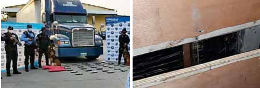
Las autoridades contabilizaban hasta ayer en la tarde 33 paquetes de supuesta cocaína. Los paquetes de la droga estaba ocultos en las paredes del vehículo que fue inspeccionado.

EL CONDUCTOR DE DICHO VEHÍCULO SE DIO A LA FUGA