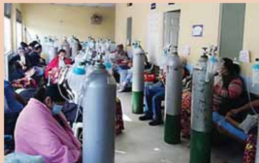
La nueva extensión del estado de calamidad debe pasar por el Congreso para su ratificación.