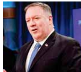
El secretario de Estado de EE.UU., Mike Pompeo, en la presentación del informe anual.

Nicaragua había estado en un listado de observación durante tres años consecutivos y este año el Departamento de Estado decidió castigar al país por no “cumplir completamente los estándares mínimos para la eliminación del tráfico de personas y no estar haciendo esfuerzos