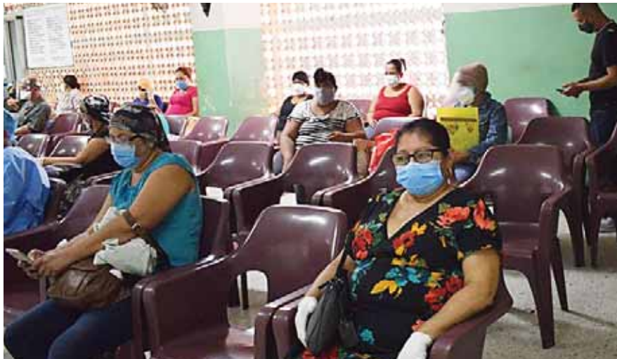
Desde que el Rivas cuenta con la máquina de fototerapia, cada día los pacientes llegan para el control de su tratamiento.

Comentó que paga 500 lempiras por las tres sesiones de la semana, sin embargo, en una clínica privada cuesta 2,000 lempiras el minuto de fototerapia.