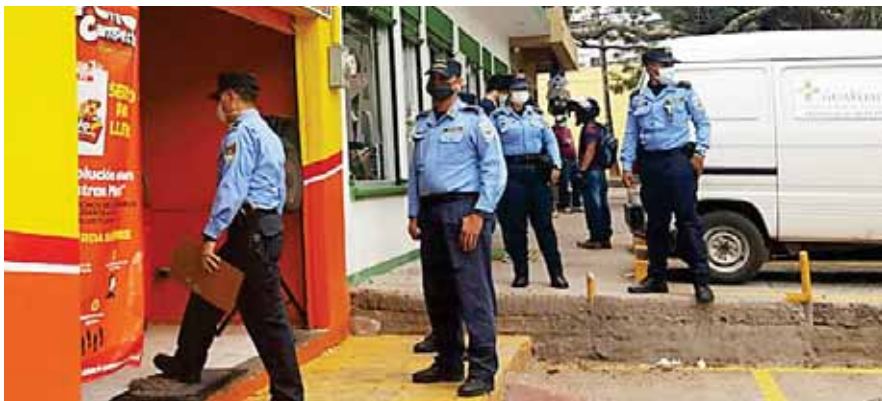
A los dueños y encargados de estos locales, se les hizo la observación de los rubros establecidos en el PCM-045-2020 y se les solicitó que acataran lo dispuesto en decreto ejecutivo.