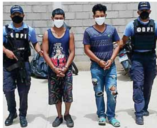
A los dos forajidos se les investiga a raíz de denuncias interpuestas por propietarios de diferentes negocios del municipio de Catacamas y zonas aledañas

En atención a una orden de captura por el delito de portación ilegal de arma de fue detenido, en sector conocido como Spring Garden de Roatán, Islas de la Bahía, un individuo de 32 años de edad, originario de Trujillo, Colón, residente en colonia Sandy Bay, de del mismo municipio de la captura.