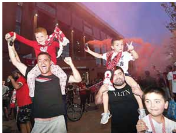
19 títulos suma el Liverpool y es el primero bajo el nombre de Premier League. Los aficionados de Liverpool en Inglaterra salieron a celebrar.