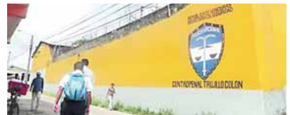
El privado de libertad, al presentar los primeros síntomas del mortal virus, fue remitido del centro penal de Trujillo a un centro asistencial, donde finalmente falleció.

preparará expediente investigativo por la comisión del ilícito de facilitación de los medios de transporte para el tráfico ilícito de drogas. Y se les decomisó, como evidencia constitutiva de delito, una mochila en cuyo interior se encontró un envoltorio conteniendo supuesta marihuana y 23 bolsas plásticas transparentes con la misma hierba.