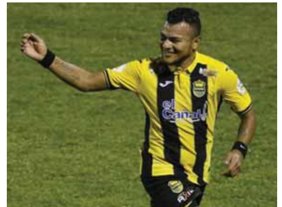
Recordó que en su primer clásico contra Real España se sintió raro.

Aseguró que creer en sus condiciones fue fundamental para levantar su nivel en el equipo esmeralda. “Nunca hay que bajar la cabeza, siempre hay que creer en uno, por eso tuve un buen nivel en Marathón y por eso me llamó nuevamente el Real España, me fui con la esperanza de volver y aquí estoy, quería demostrar que los directivos estaban equivocados”.