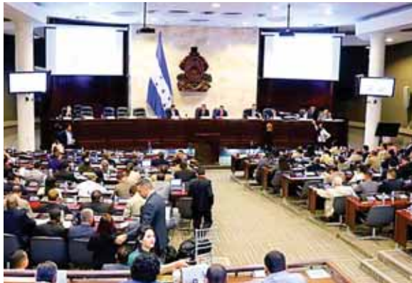
Con 112 votos a favor se aprobó el Código Penal en vigencia desde ayer.

“Como cualquier ley de la República, el nuevo Código, a lo lar-