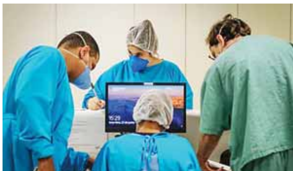
El ministerio de Sanidad reportó ayer 28,330 fallecidos por COVID-19, tres más que la víspera y once adicionales en la última semana.

Otro brote que “preocupa” se registra en un centro de acogida de Cruz Roja en Málaga (sur), con 89 casos, detalló Simón, que habló de un tercer brote importante, pero “más pequeño” en Cantabria (norte).