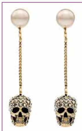
Aretes con diseños originales

Colores, mezcla de materiales y originalidad al 100% Los aretes que incluyen piedras variadas serán la máxima tendencia de la temporada. Su estilo tan particular le dará un toque único a cualquier atuendo. Sí o sí los tienes que tener.