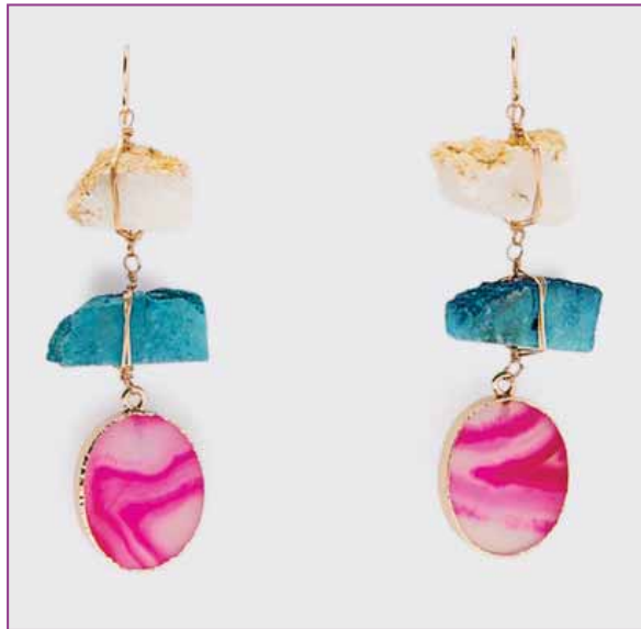
Aretes estilo geodas

Para crear balance, elige un makeup súper natural, de esta manera tus aretes serán los protagonistas. También es una buena idea llevar el pelo recogido, ya sea en un bun bajo o una pony tail, ¡tú elijes! El punto es presumir tus aretes.