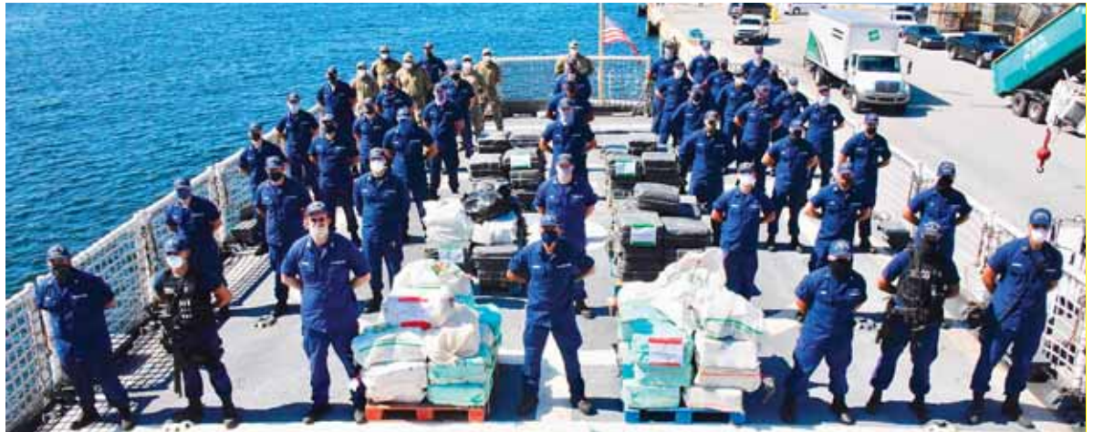
El buque Vigilante participó en una operación conjunta multinacional de narcóticos de cuatro días con las Fuerzas Armadas de Honduras.

Precisó que el buque Vigilante participó en una operación conjunta multinacional de narcóticos de cuatro días con las Fuerzas Armadas de Honduras y luego trabajó con la Armada colombiana en las interceptaciones de tres presuntos buques de