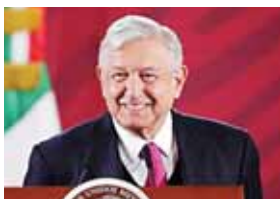
López Obrador, quien puso en venta el lujoso avión presidencial, anunció que viajará en vuelo comercial.

MÉXICO, MÉXICO. El presidente mexicano Andrés Manuel López Obrador rechazó ayer que su visita a Estados Unidos, el primer viaje que realizará al extranjero, sea utilizada para reforzar la campaña para la reelección del mandatario estadounidense Donald Trump.