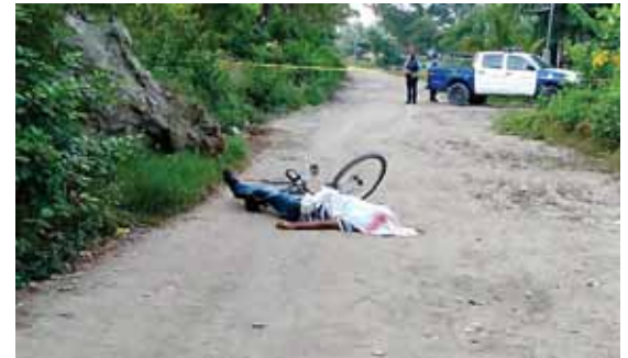
Tras cometer el sangriento hecho, los victimarios huyeron del lugar con rumbo desconocido, dejando abandonado el cuerpo del malogrado ciclista.

Cabe mencionar que por este mismo ilícito, el pasado 18 de junio se realizó la detención de otros dos integrantes de la organización delictiva, quienes se encuentran reclusos en un centro penitenciario del país.