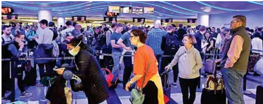
Tanto la UE como EE.UU. mantienen en general las restricciones de viaje entre sus territorios, y pidió.