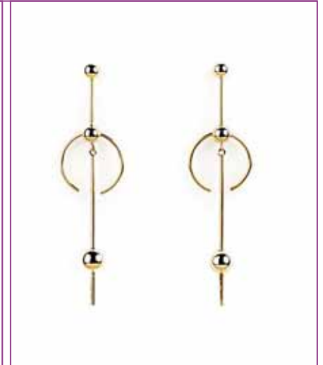
Aretes minimalistas nacionales

Las piezas statement deben estar sí o sí en tu joyero, éstas son básicas para aquellos momentos en los que quieres darle un toque especial a tu look. Para que sean 100% funcionales, busca que tus aretes tengan un diseño único, además de un color brillante, pero ojo, éste deber ser tonos neutros para que los puedas combinar con varios looks. Aunque si eres más arriesgada, puedes llevar pizas totalmente fuera de lo común.