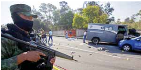
Según medios locales, en estas balaceras intervinieron grupos ligados a los hijos de “El Chapo” Guzmán y de Ismael “El Mayo” Zambada, considerado número dos del grupo criminal.

“La mayoría de la gente se ha ido. Pero nosotros no, porque aquí están los animalitos”, dijo a la AFP Modes-