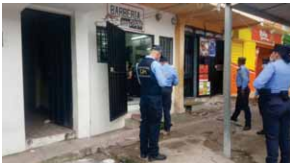
Las autoridades hicieron inspecciones en diversos comercios.

Como recordarán, el pasado 21 de junio, mediante comunicado se giró la disposición de cierre temporal de la economía en el Distrito Central, debido al alza de casos positivos por CO-