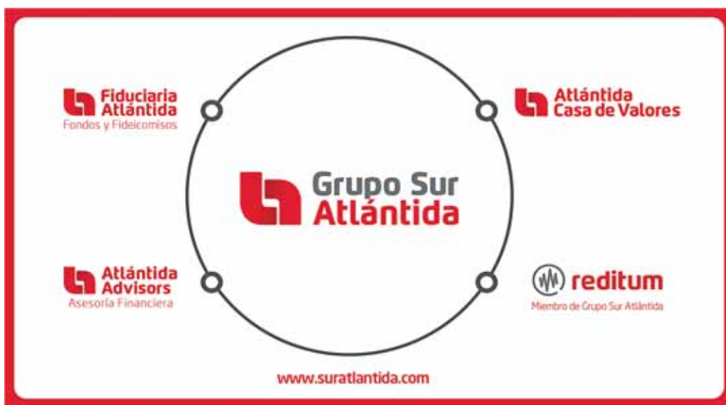
Grupo Financiero Atlántida continúa a paso firme su proceso de expansión.

“La pandemia es pasajera, es temporal, el mundo aprenderá a vivir con esto y nosotros juntos más aún”, concluyó.