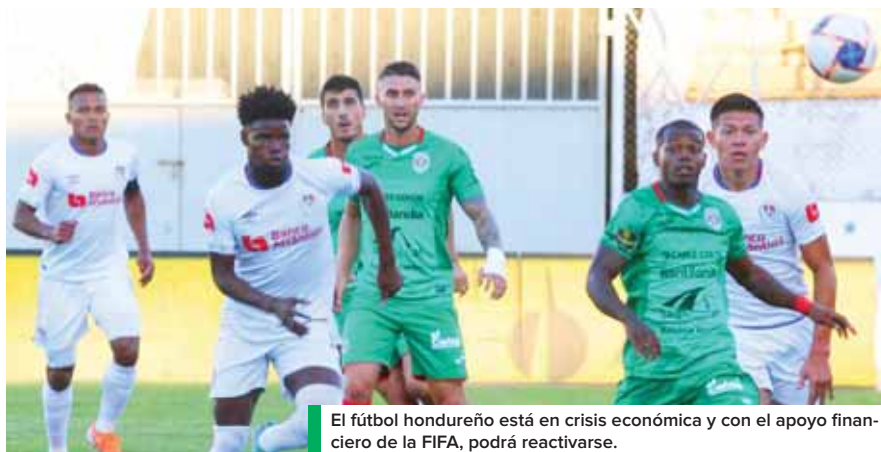
El fútbol hondureño está en crisis económica y con el apoyo financiero de la FIFA, podrá reactivarse.

Las federaciones podrán dirigir tanto las subvenciones como los préstamos a la comunidad futbolística en general en sus respectivos territorios, incluidos clubes, jugadores,