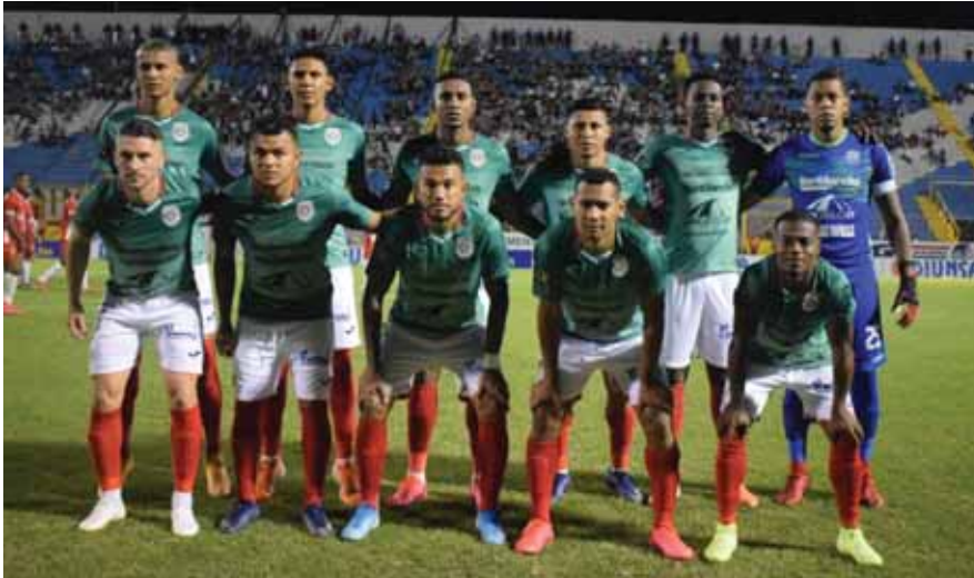
El Marathón ha bajado la planilla para poder hacerle frente a la situación económica.