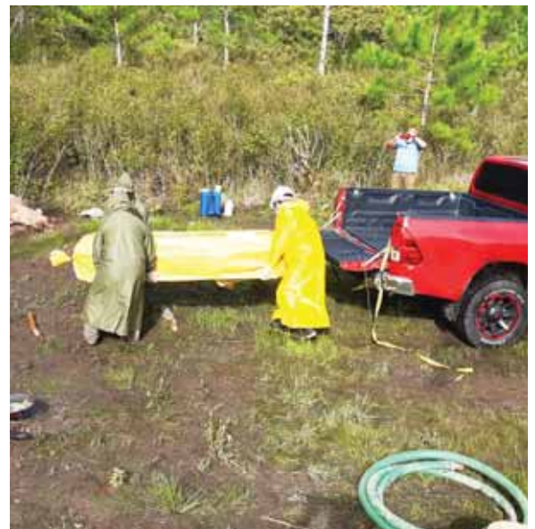
Entre las personas muertas por sospecha de COVID-19 hay un hombre y dos mujeres.

El funcionario edilicio explicó que los 6 casos adjudicados a ese municipio, no son personas que residen allí, sino que se trata de agentes policiales que, para tomar su cuarentena, fueron aislados a la jefatura municipal de la Policía en ese municipio, ya que se trata de instalaciones adecuadas para que los policías puedan tomar su reposo.