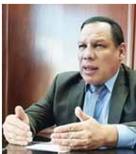
que se debe de poner todo el esfuerzo para vencer la pandemia.

“Y es que, si nos contagiamos del virus, la posibilidad que nos atiendan