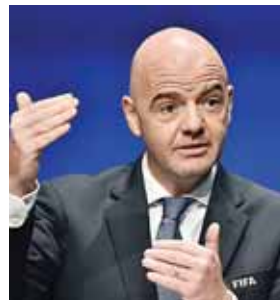
Infantino anunció que habrá una supervisión en el manejo de los fondos entregados a cada federación.