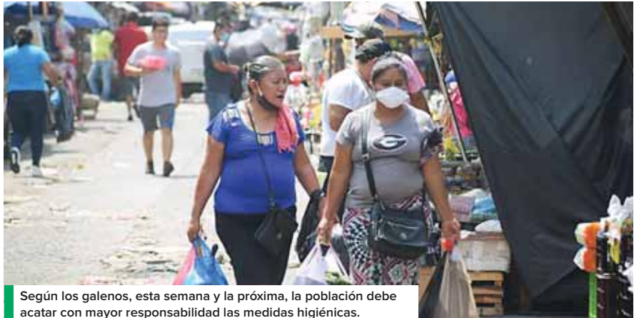
Según los galenos, esta semana y la próxima, la población debe acatar con mayor responsabilidad las medidas higiénicas.

Asimismo, la epidemióloga y ex ministra de Salud, Roxana