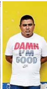
El ciudadano de origen guatemalteco fue puesto a la orden de las autoridades correspondientes, tras encontrarle 85 mil 105 quetzales.