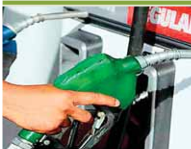
Gas LPG doméstico mantendrá su valor de L230.83 este mes.

El cese de operaciones de la transnacional aparte del remanente administrativo también liquidará a una media docena de contratistas locales que prestaban servicios de refrigeración, electricidad y mecánica que le daban mantenimiento a los contenedores que se exportaban con fruta. Este personal suma unas 200 personas.