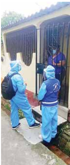
Unas 1,500 casas visitaron las brigadas médicas en la capital, informaron las autoridades.

“En el punto fijo que se ha instalado aquí ya lleva reportados unos 15 casos positivos los cuales ya se les empezó a dar el tratamiento para que no se complique su salud”, concluyó.