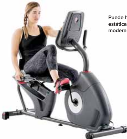
Puede hacer bicicleta estática a un ritmo moderado.