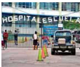
Todas las salas habilitadas en el Hospital Escuela para atender pacientes con COVID-19 están abarrotadas.

Medina reconoció que “la situación del Distrito Central (DC) desde el punto de vista epidemiológico y de salud pública representa un enorme reto para las autoridades, dado que se ha convertido ya en el epicentro de la pandemia a nivel nacional”. “Eso es así porque aquí se encuentra la población más numerosa y sumado a ello se puede mencionar la actitud de algunos pobladores de colonias, barrios y visitantes y vendedores en mercados quienes no han guardado las medidas de bioseguridad”, afirmó el experto.