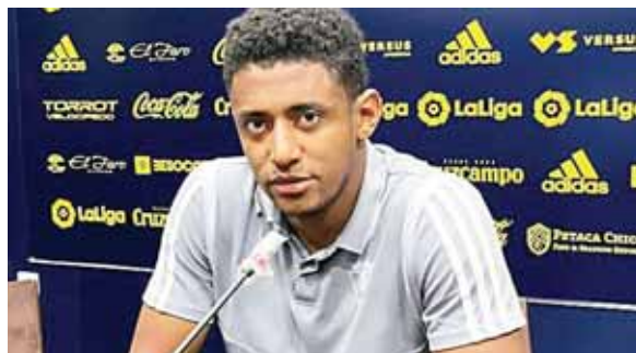
El catracho compareció ante los medios y aceptó que el miércoles será duro en Huesca.