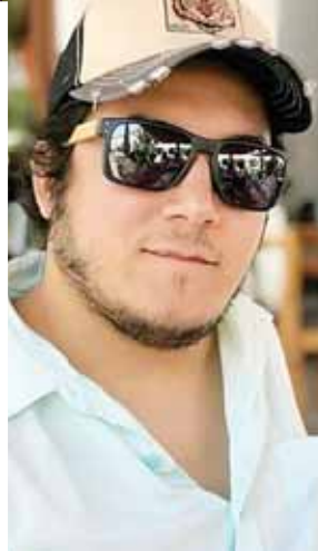
Los dos hermanos eran unos comerciantes muy reconocidos en la Capital Industrial.

cabada por agentes en la escena, los hermanos fueron raptados eso de las 6:00 de la tarde del viernes, desde su vivienda ubicada en la colonia Villas del Sol, hasta donde llegaron varios individuos fuertemente armados y vestidos con uniformes similares a los de la Policía Nacional.