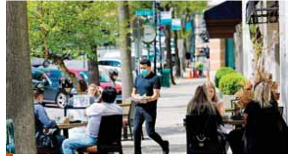
Con la primera fase, que entró en efecto en la ciudad de Nueva York el pasado 9 de junio, ya volvieron a sus puestos de trabajo unas 400,000 personas.

Tres jóvenes mineros artesanales que permanecían bajo tierra desde el pasado miércoles fueron encontrados sin vida ayer en la galería abandonada de una antigua mina ubicada en el noroeste de Nicaragua, informó una fuente de la Alcaldía de Villanueva.