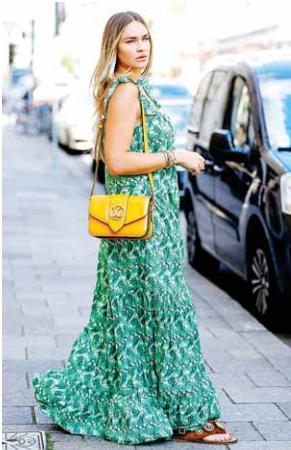
Vestidos largos con sandalias, ¡un win!

Llega el verano, y con él la oportunidad de usar sandalias todos los días. ¿Pero con qué ropa usarlas? ¡Te decimos los mejores trucos!