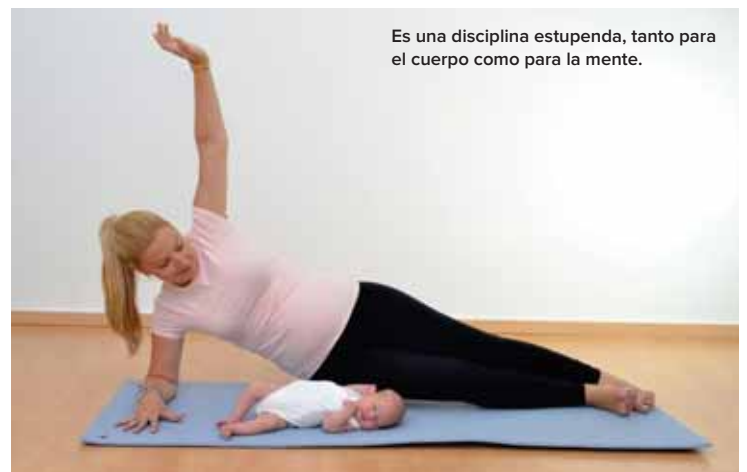
Es una disciplina estupenda, tanto para el cuerpo como para la mente.