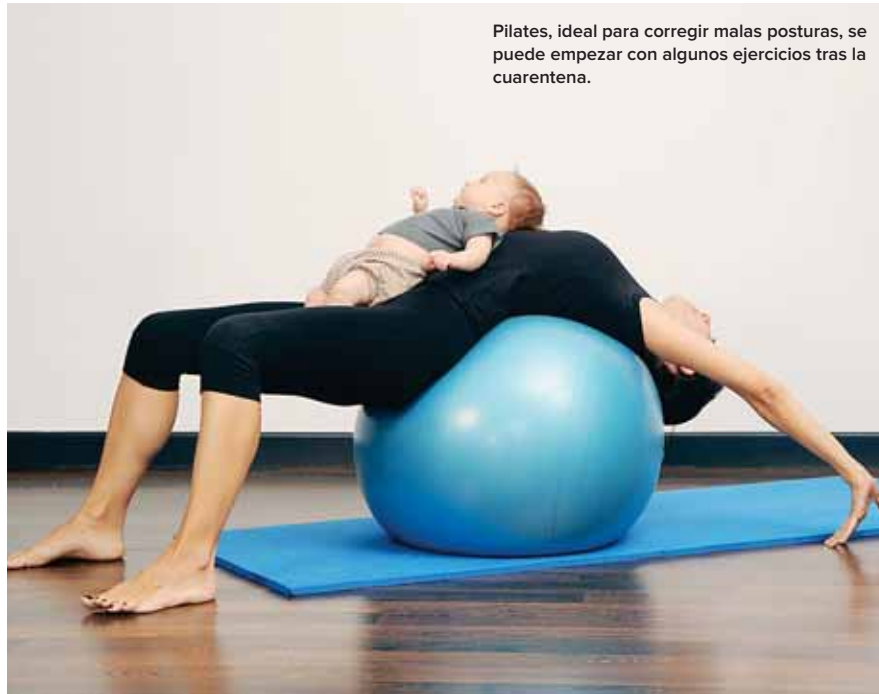
Pilates, ideal para corregir malas posturas, se puede empezar con algunos ejercicios tras la cuarentena.

A la hora de reanudar la actividad física tras la cesárea, hemos de practicar los ejercicios adecuados y en el momento apropiado. El objetivo no es solo adelgazar o eliminar el exceso de grasa, sino también fortalecer las articulaciones, tonificar los músculos, e incluso corre-