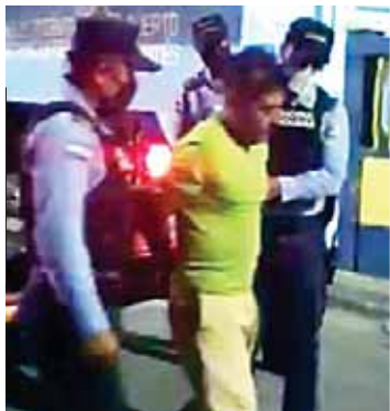
El detenido fue puesto a la orden de las autoridades correspondientes para que responda por lo que se le imputa.