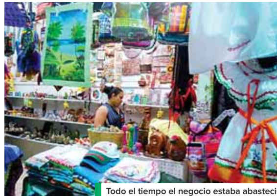
Todo el tiempo el negocio estaba abastecido, el incendio lo redujo a cenizas.

“Ha sido difícil ver que solo las cenizas quedaron, cada vez que me acuerdo de mis locales abastecidos de productos me pongo a llorar, porque me costó mucho y ade-