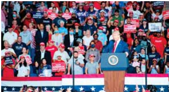
El mitin de Tulsa (Oklahoma) se celebró en un clima de tensión ante la advertencia de los expertos médicos del riesgo que implicaba un acto masivo en plena pandemia.

na del Sur, Utah, Washington, Nevada y Misuri registraron el sábado récords diarios de nuevos casos.