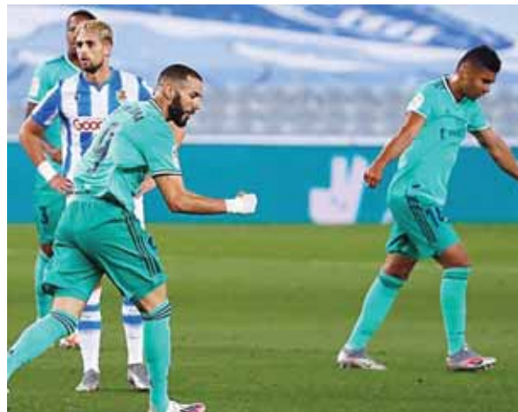
Hubo polémica en el tanto marcado por Benzema, pero el árbitro lo dio por bueno.