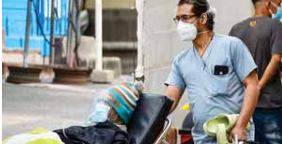
El descuido está matando a los pacientes, porque llegan en estado crítico, según la exministra de Salud.

Una vez que las autoridades municipales decidieron el cierre de los mercados capitalinos los pobladores