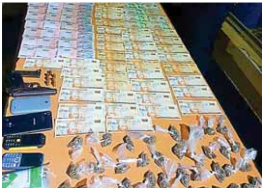
Al acusado se le decomisó 50 mil lempiras y tres dólares, además de droga y un arma de fuego.

EL SOSPECHOSO ESTÁ SIENDO ACUSADO DE AL MENOS DOS DELITOS