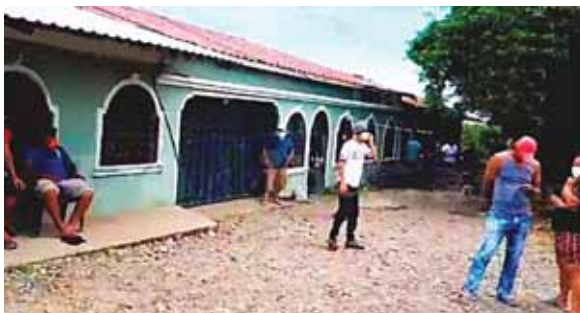
Dos de las víctimas son hermanos. Anteriormente habían muerto dos parientes más.

Mientras tanto, en horas de la mañana de ayer, se reportó el hallazgo del cuerpo sin vida de un teniente auxiliar retirado, de la Empresa Nacional Portuaria (ENP),