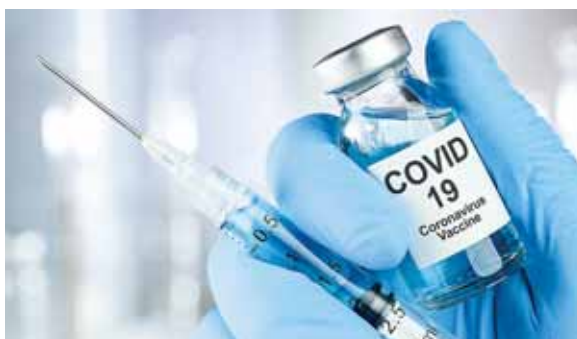
El centro, dependiente del Ministerio de Defensa, espera acabar la preparación de la vacuna en un año o incluso antes.

Múltiples grupos de científicos israelíes, igual que los de muchos otros países del mundo, trabajan a contrarreloj para el desarrollo de vacunas y medicamentos contra la COVID-19, un proceso acelerado que abordan