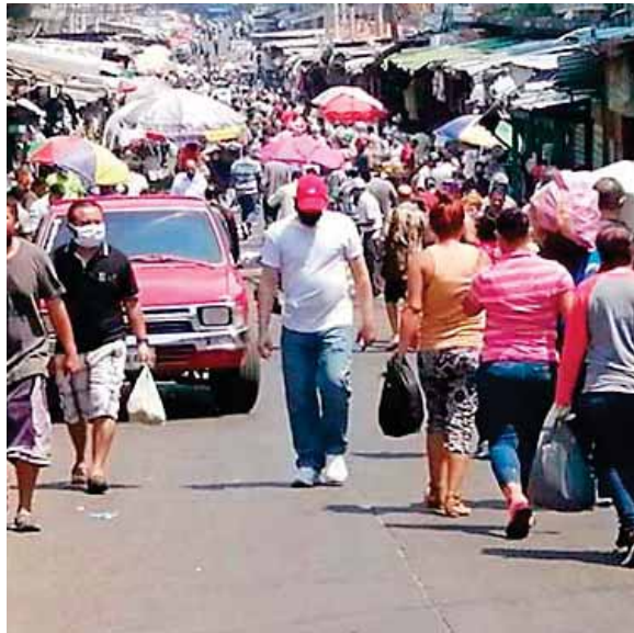
Las autoridades señalaron que se abrirán hasta que se establezcan los protocolos de seguridad.

“Advertimos que los comercios ya autorizados y las empresas que les prestan el servicio de seguridad privada deben respetar la atención ciudadana con base en