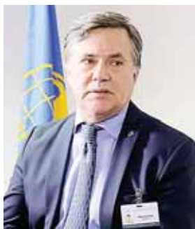
El director general del IICA, expresó que el uso masivo de la tecnología tiene una perspectiva práctica porque se orienta a resolver problemas en el campo con costos acotados.

Podemos convencer gobiernos, empresas y otros actores clave mostrando que invertir para mejorar la conectividad rural genera retornos en escala cada vez ma-