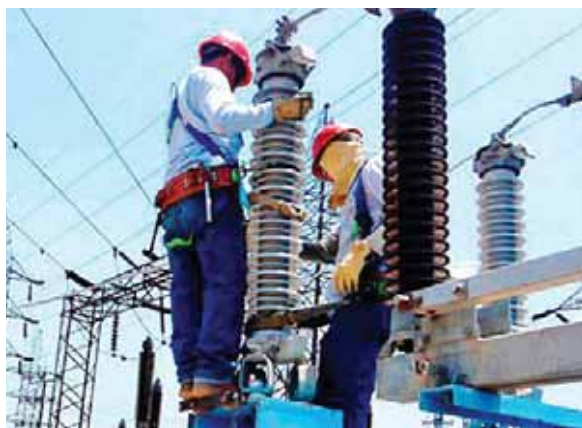
La CREE se prepara para dar a conocer en dos semanas, la nueva revisión basada en el precio de combustibles y del lempira en función del dólar.

ses registran altos niveles, eso se traduce en menor importación de diésel y de bunker para generar energía con plantas térmicas.