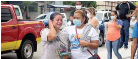
Las lágrimas y la impotencia se reflejaban en la cara de los locatarios, ya que el trabajo de muchos años se consumió a cenizas.

Asimismo, los vendedores, dijeron que el siniestro inició en el área