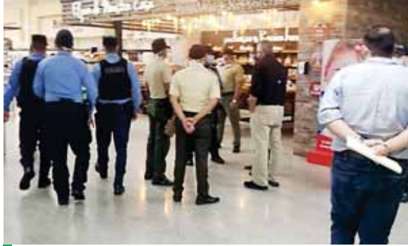
Las autoridades policiales llegaron sorpresivamente a los establecimientos comerciales para realizar la supervisión.

Además, se pretende verificar si los clientes que visitan los mismos están autorizados para circu-