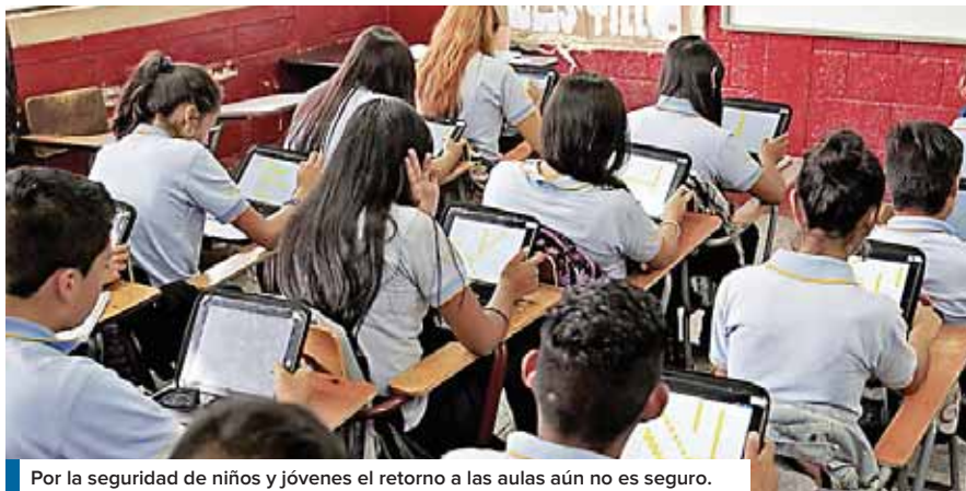
Por la seguridad de niños y jóvenes el retorno a las aulas aún no es seguro.