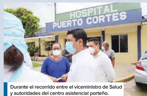
Durante el recorrido entre el viceministro de Salud y autoridades del centro asistencial porteño.

Asimismo, destacó que partiendo del hecho de que no existe un tratamiento específico para la enfermedad, se buscan estrategias de contención, estas implican indicar medicamentos que reducen la carga viral para reducir la transmisión comunitaria, “esa es una estrategia que ha funcionado en otros países, pero hay que ir a buscar los contactos a la comunidad”, recomendó.