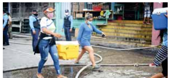
Algunos emprendedores lograron sacar algunas pertenencias que no fueron alcanzadas por las llamas.