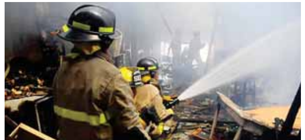
Los bomberos trabajaron por varios minutos en apagar el fuego.

Mientras que otro emprendedor, lloraba al saber que su patrimonio se había reducido a cenizas, recordó que tenía invertido unos 2 millones de lempiras en su negocio.