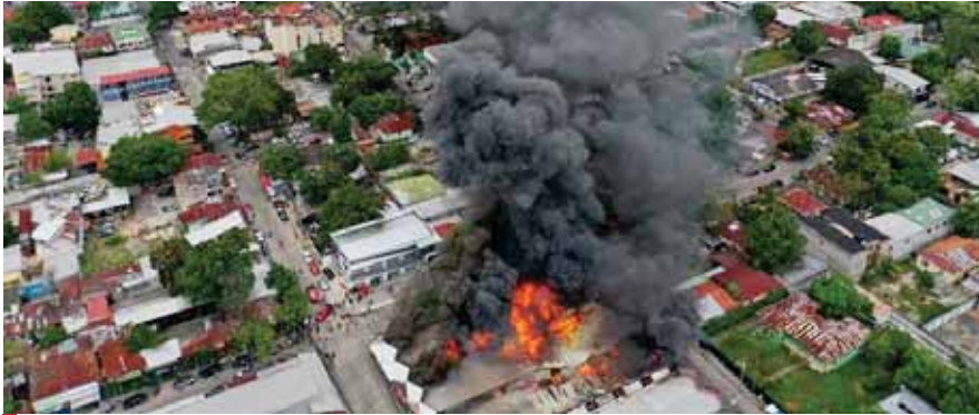
El emblemático mercado Guamilito se ubica en la 6 calle, 8 y 9 avenida, del barrio Guamilito.

Funcionarios policiales mediante ubicación con orden de captura, arrestaron ayer a un sujeto quien durante un enfrentamiento disparó contra la humanidad de un grupo de agentes del orden. La acción se ejecutó en la colonia Ayesta de San Pedro Sula.