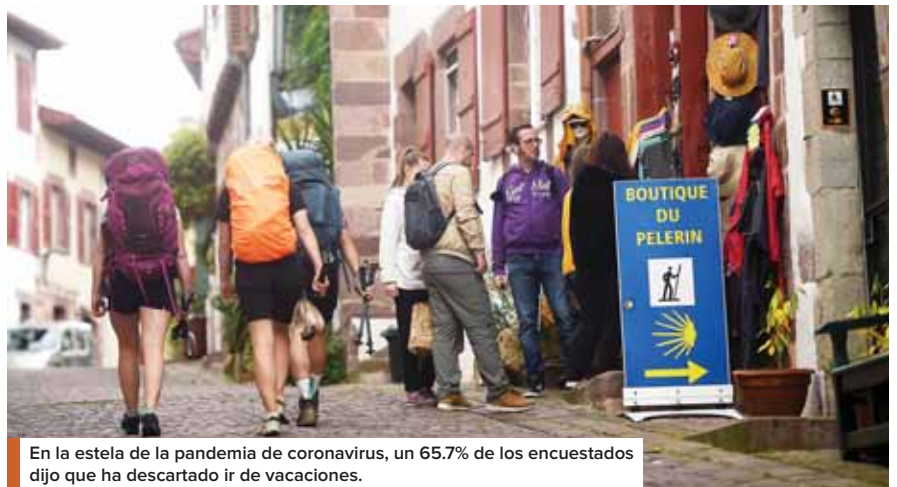
En la estela de la pandemia de coronavirus, un 65.7% de los encuestados dijo que ha descartado ir de vacaciones.

Sin embargo, los agentes del sector turístico, que representan un 12% del PIB nacional, temen que los clientes tengan miedo al contagio o a verse atrapados en un país foráneo si reaparece un nuevo brote del coronavirus. AFP