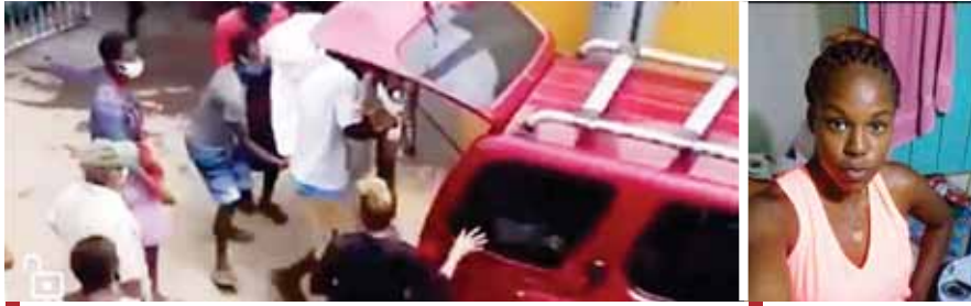
El cuerpo de la mujer fue retirado por los familiares de la morgue del hospital.