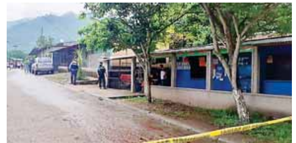
A la escena llegaron los agentes de investigación para comenzar con las pesquisas del doble crimen.