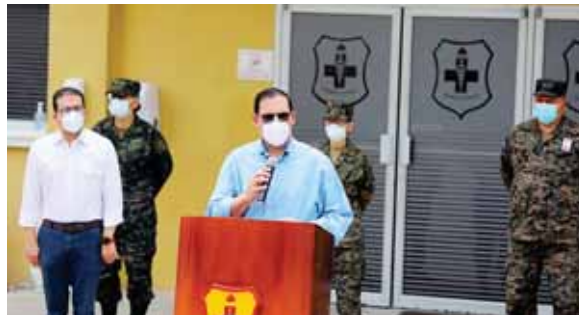
El mandatario fue revisado por un equipo de médicos, quienes han realizado una serie de exámenes laboratoriales y otros medios diagnósticos.

“Después del análisis de sus exámenes laboratoriales y de rayos X, se encontró que presenta algunos infiltrados leves en sus pulmones”, detalló.