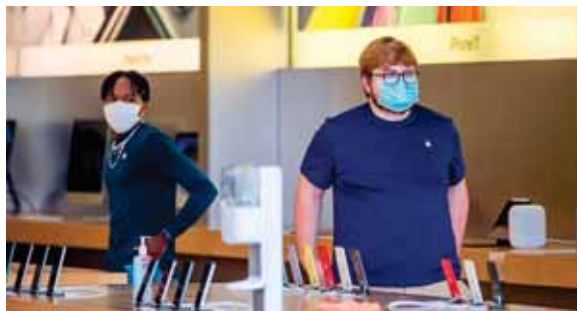
Algunas grandes empresas como Apple ya han reabierto todas sus tiendas en los cinco distritos neoyorquinos.