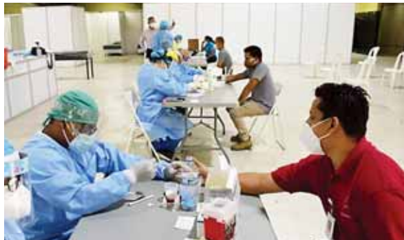
Los equipos de Salud, realizan las pruebas a los colaboradores de las empresas. Éstas son entregadas aproximadamente en 15 minutos.