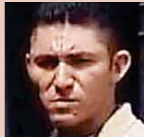
conoce su nombre, se encuentra interna en estado crítico.

Tras el encontronazo, el ahora fallecido y su acompañante fueron llevados de emergencia al hospital Mario Catarino Rivas, donde tiempo después falleció. Mientras que la fémina, de quien se des-