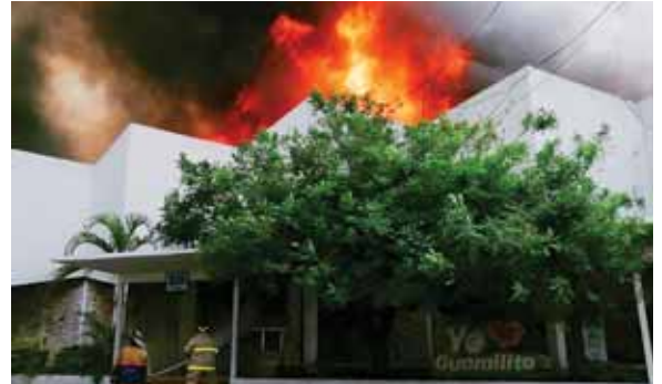
Los apagafuegos tuvieron que utilizar equipo hidráulico, ya que las cortinas estaban cerradas y esto provocó que no pudieran entrar rápido.