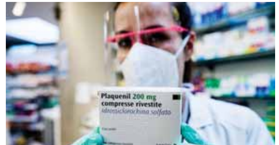
La hidroxiquina es un medicamento utilizado desde hace décadas en enfermos de malaria y de afecciones reumáticas.

El cacique Paulo Paikan, un importante líder indígena brasileño de la década de los años ochenta del siglo pasado, falleció ayer como consecuencia de la COVID-19, confirmó la Articulación de los Pueblos Indígenas de Brasil (APIB).