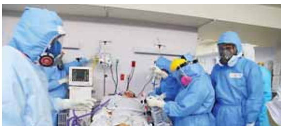
Hasta ayer, el país registró más de 9 mil 500 casos positivos, más de 330 fallecidos y unas 920 personas hospitalizadas.

Afirmó que “a tendencia de la enfermedad en el país va a seguir siendo ascendente, hasta que se alcance un nivel de inmunidad en la población, lo suficiente como para bloquear la transmisión. Considero que eso no va a suceder de la noche a la mañana, y que posiblemente se presentarán importantes cantidades de casos durante todo el 2020. “Probablemente vamos a ir viendo una reducción de casos a finales de julio o principios de agosto,