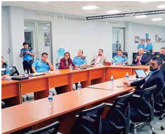
La exposición se hizo a los miembros de la Comisión de Seguridad del Congreso Nacional.

La reglamentación planteada tiene la finalidad de facilitar los procesos a la ciudadanía para que registre su arma y la institución policial tener un mejor y mayor control.