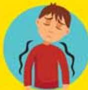
DOLOR DE HUESOS Y MUSCULAR O MALESTAR GENERAL