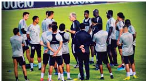
El Seattle Sounders hizo reconocimiento de cancha la tarde de ayer y entrenó a puertas cerradas en el Olímpico Metropolitano.