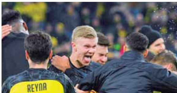
Su doblete, en el primer partido de su vida en una eliminatoria de Liga de Campeones, enlaza con una impresionante temporada.

pocos pueden resistir al despliegue de Erling Braut Haaland”, apunta el Guardian de Londres. Incluso España, que veneró a Messi y a Cristiano Ronaldo durante una década, también incidió en la exhibición de Haaland: “Erling Haaland se sentó en la mesa de Mbappé y la partió en dos. El chico de moda del fútbol europeo no tiene techo”, dice AS. AFP