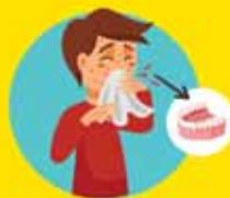
SANGRADO DE ENCÍAS, NARIZ Y ORINA

...busca el Establecimiento de Salud más cercano NO TE AUTO-MEDIQUES