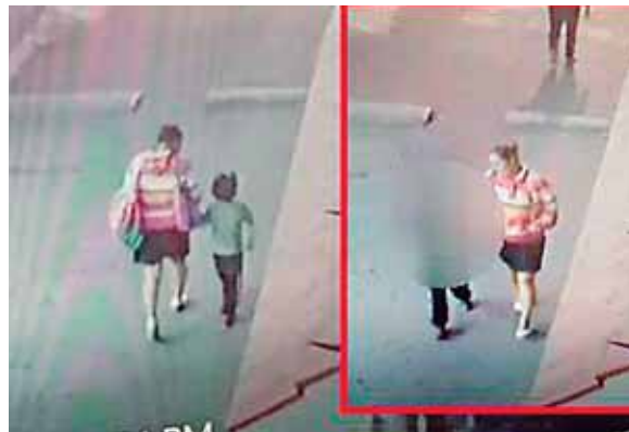
En un vídeo que ha circulado se ve cuando la sospechosa llevaba a la niña para su casa.

Fuentes cercanas a la investigación dieron a conocer que la mujer dejó el domicilio el lunes luego de que su rostro se difundiera en los medios de comunicación. AFP Y EL UNIVERSAL DE MÉXICO