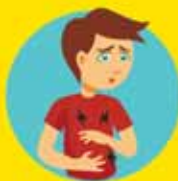
DOLOR DE ESTÓMAGO, NAUSEAS O VÓMITOS PERSISTENTES