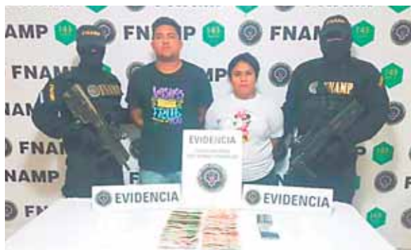
Los detectives realizaron operaciones simultáneas en distintos sitios de la capital.