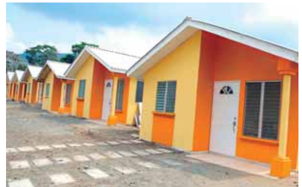
Los trabajadores de la clase media y baja podrán adquirir su vivienda a una tasa de interés del 8.7 por ciento.

El funcionario dijo que se consideró necesaria la aprobación de esta ley para que la iniciativa perdure en el tiempo, independientemente del partido político que gobierne en