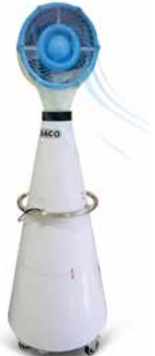
Ventilador con mist con compartimiento de hielo