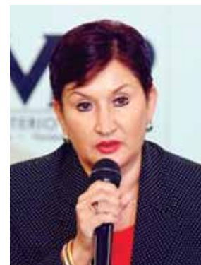
Thelma Aldana, actualmente está en EE.UU.

Aldana ha asegurado que los señalamientos de corrupción fueron fabricados por un "sistema" que se vio afectado por las investigaciones de alto impacto que encabezó junto a la Comisión Internacional Contra la Impunidad en Guatemala (Cicig), un ente adscrito a la ONU que abandonó el país en septiembre pasado tras 12 años de funcionamiento porque el expresidente Jimmy Morales no les renovó la misión. AFP