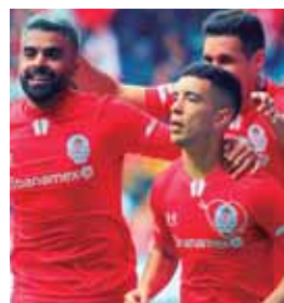
Pachuca no pudo con el Toluca y se llevó una goleada.