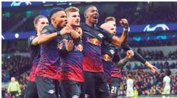
El RB Leipzig dio un paso importante para clasificarse para los octavos de final de la Liga de Campeones venciendo al Tottenham.

¿Está la Eurocopa-2020 en peligro para Marcus Rashford? El atacante del Manchester United y de la selección inglesa, de baja desde hace un mes por una fractura por fatiga en la espalda, tiene aún "unos meses" más de recuperación, según dijo su entrenador de los 'Red Devils', Ole Gunnar Solskjaer. "Espero que pueda jugar esta temporada, pero estará en duda hasta el final", indicó el técnico noruego. AFP