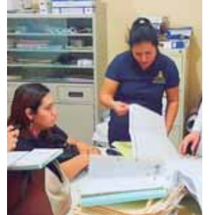
Equipo del MP realizó visita al centro de salud Doctor Jerónimo Suazo Alcerro, de San José de Colinas, Santa Bárbara.

También se realizaron inspecciones a vertederos clandestinos de desechos sólidos e inspecciones en lugares de descombro, todo con el acompañamiento con personal de Justicia Municipal y Uni-