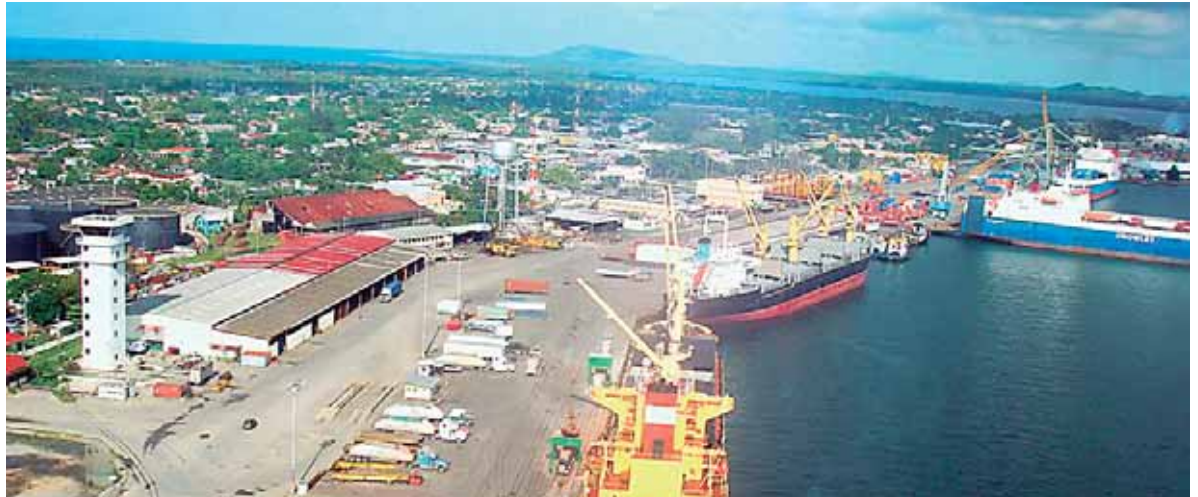
Las autoridades buscan que Puerto Cortés, tenga un mayor derrarrollo den infraestructura.

Sin embargo, con la votación a su favor, el alcalde Alan Ramos pretende desarrollar el Proyecto Plan