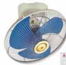
De techo tipo pulpo