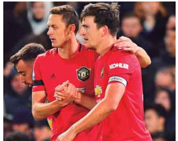
Manchester United visita al belga Club Brujas en un partido nada fácil para el cuadro inglés que intenta dar la pelea en la Europa League.