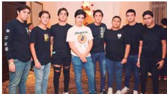
Los jóvenes de los diferentes grados de la EIS disfrutaron de la fiesta.