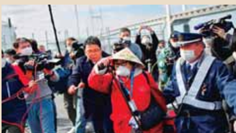
Los pasajeros del "Diamond Princess" estaban en cuarentena.

El decreto en su artículo 3, establece que la Comisión Permanente de Contingencias (Copeco), en coordinación con la Secretaría de Salud, serán los encargados de manejar los fondos destinados a combatir enfermedades, las que serán comprobadas de forma científica para lograr la prevención y control del dengue a nivel nacional.