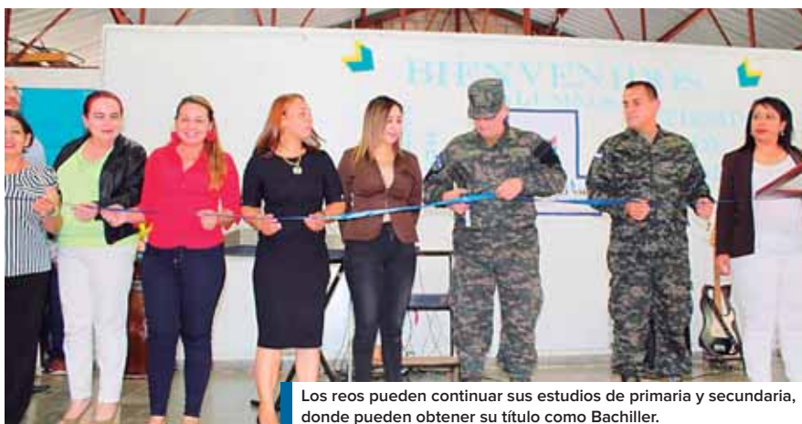
Los reos pueden continuar sus estudios de primaria y secundaria, donde pueden obtener su título como Bachiller.

“Hay tres cosas que uno siempre debe mantener presente, la primera es doblar rodillas, orar y fortale-