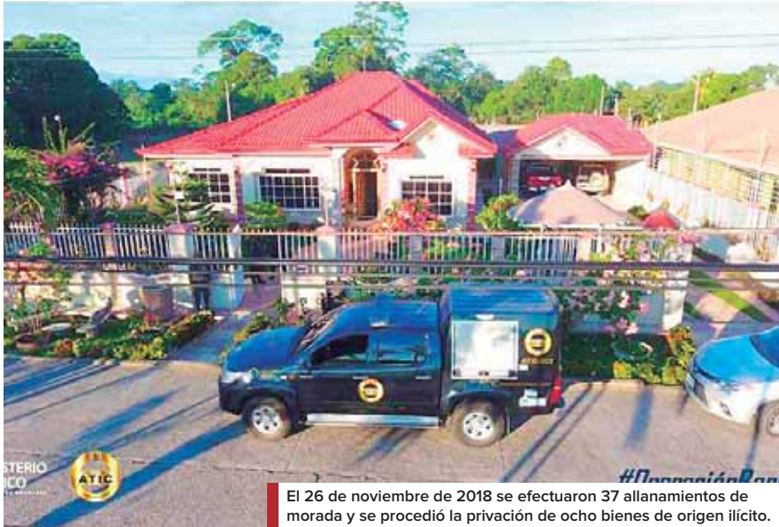
El 26 de noviembre de 2018 se efectuaron 37 allanamientos de morada y se procedió la privación de ocho bienes de origen ilícito.