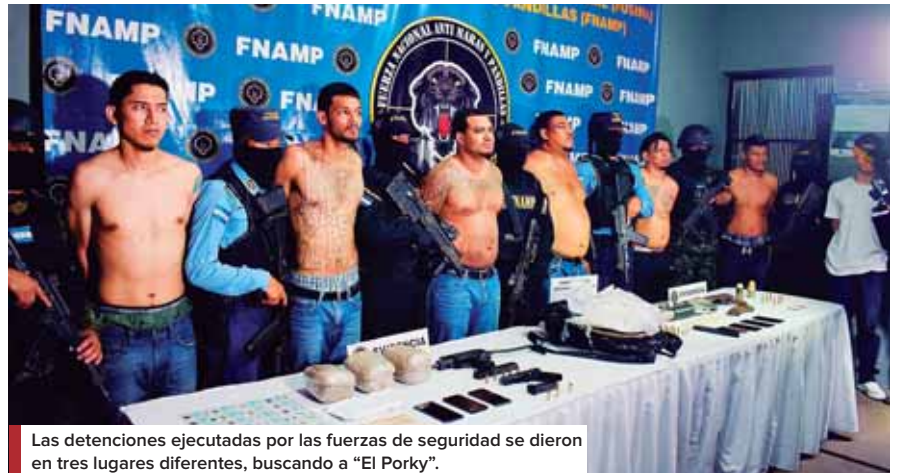
Las detenciones ejecutadas por las fuerzas de seguridad se dieron en tres lugares diferentes, buscando a “El Porky”.

En otra fuerte operación, lograron detener en la colonia Villa Ernestina, de esta ciudad, a Jo-