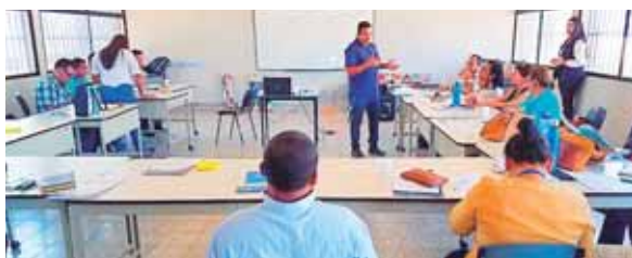
El propósito es enseñarle a leer y a escribir a más de 20 mil ciudadanos.

cada día. Deseamos que todos los que se matricularon, todos se gradúen y quisiéramos que ustedes motiven a los demás para que sean parte de este proyecto que se llama Tiempo de Cambio, este cambio va a ser positivo, enfatizó.