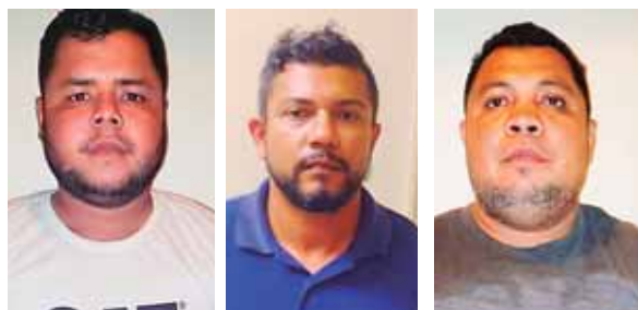
Los ahora detenidos, presuntamente, se hacían pasar como empleados de la EEH.

SAN PEDRO SULA. La Fuerza Nacional Anti Maras y Pandillas (FNAMP) realizó ayer actividades preventivas y de reseñas a motoristas y ayudantes de unidades del transporte de esta ciudad. De acuerdo con la vocera, el objetivo de las actividades es prevenir el cobro de la extorsión a transportistas, asimismo dar a conocer las líneas telefónicas 143 y 911 donde los ciudadanos pueden interponer sus denuncias de manera anónima. Con la operación, los agentes buscan un acercamiento con los operarios del transporte público como urbanos, interurbanos y taxis. Además se requirió la documentación, tratando de reseñar a conductores y ayudantes.