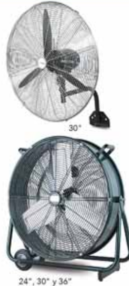
24", 30" y 36"