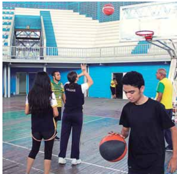
Los jóvenes pueden aprovechar de ejercitarse y tener buena salud por medio del programa deportivo que está disponible los días miércoles.

tes para Todos se desarrolla todos los miércoles, con el propósito de promover una cultura deportiva y