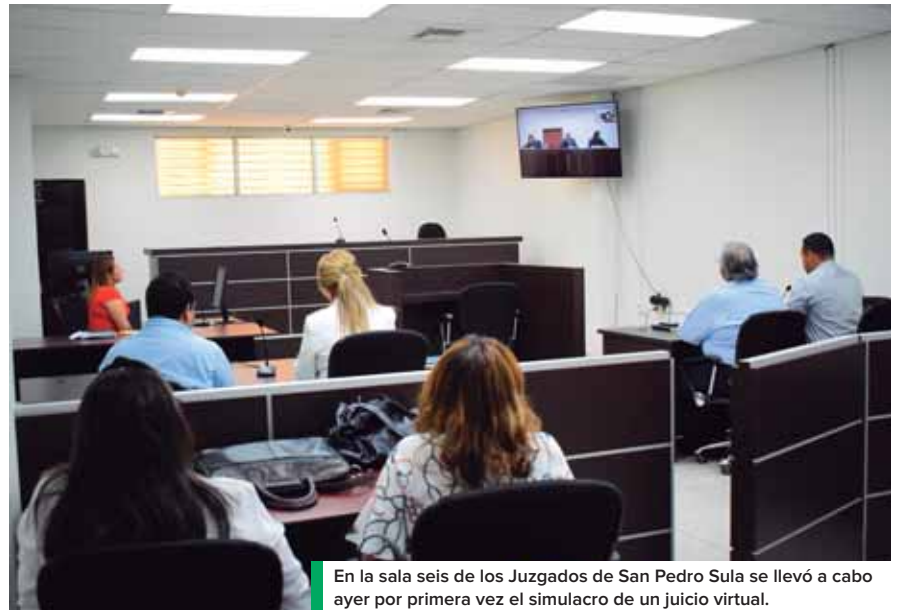
En la sala seis de los Juzgados de San Pedro Sula se llevó a cabo ayer por primera vez el simulacro de un juicio virtual.

El especialista dijo que en su opinión deben agregarle un auricular al imputado para que pueda estar en comunicación permanente con el imputado y que además debe haber un protocolo de seguridad a través del cual haya un fil-