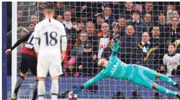
El delantero internacional Timo Werner anotó de penal (58') el gol de la victoria del subcampeón alemán.