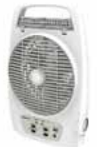
De mesa recargable