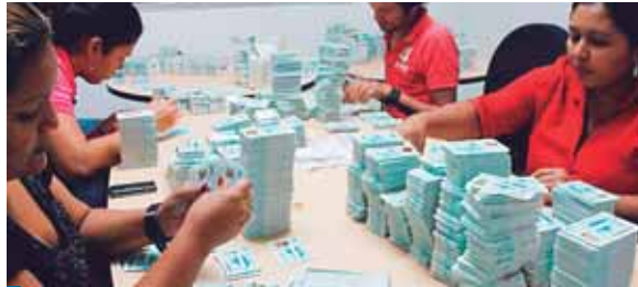
El 30 de septiembre se entregará el censo preliminar al CNE.

Quan dijo que "uno de los objetivos de este Proyecto de Identificación Nacional es tener una nueva base de datos, porque tenemos dos bases de datos: el Registro Civil y el de Identificación; ambas bases de datos presentan un 20 por ciento de inconsistencias, lo