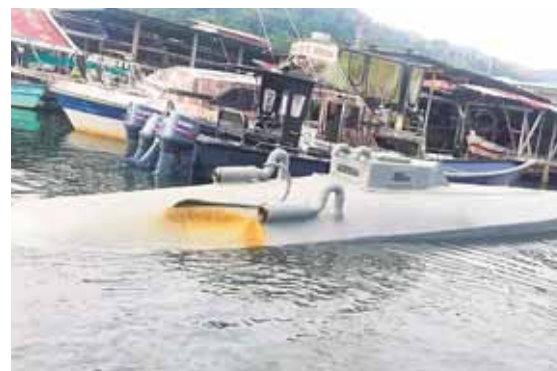
En el 2019 las autoridades incautaron casi 91 toneladas de droga, en su gran mayoría cocaína.

Pero esta oleada migratoria, que provocó una crisis humanitaria con centros de recepción superpoblados y condiciones sanitarias deplorables, tuvo una fuerte disminución tras duras medidas antiinmigración tomadas por la administración de Donald Trump: en enero de este año, la cifra de detenciones fue de menos de 37,000.