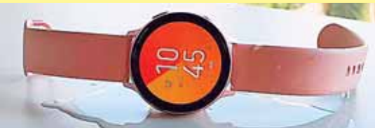
Reloj para entrenar sin sacrificar el estilo

Galaxy Watch Active 2, es un acompañante de entrenamiento más intenso, podrán elegir entre más de 40 rutinas diferentes. Es compatible con teléfonos de otras marcas, incluyendo al iPhone de Apple. En materia de resistencia al agua, el Active 2 tiene el protocolo más alto y está pensado para natación en aguas de piscina o playa, pero tiene indicaciones de cuidado que no todos los usuarios suelen tener en cuenta. En cuanto a batería, aunque la promesa es de un día, su rendimiento depende del uso, el reloj puede soportar dos y hasta tres días, usando el modo de ahorro de energía que convierte todo a blanco y negro. TECNÓSFERA