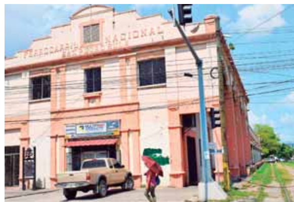
La planificación tiene como fin brindar un mejor servicio a los turistas y ciudadanos que usan esta vía.

Las autoridades aseguran que están trabajando fuertemente de la mano con INSEP para volverse a equipar con más flota de transporte para cubrir la demanda en diferentes sectores.