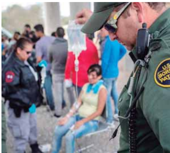
Un agente de la patrulla fronteriza sostiene una bolsa de suero que le es aplicado a una inmigrante detenida en McAllen, Texas. Foto archivo.

“Nuestros agentes están bien capacitados para manejar lo inesperado, y estoy orgullo-