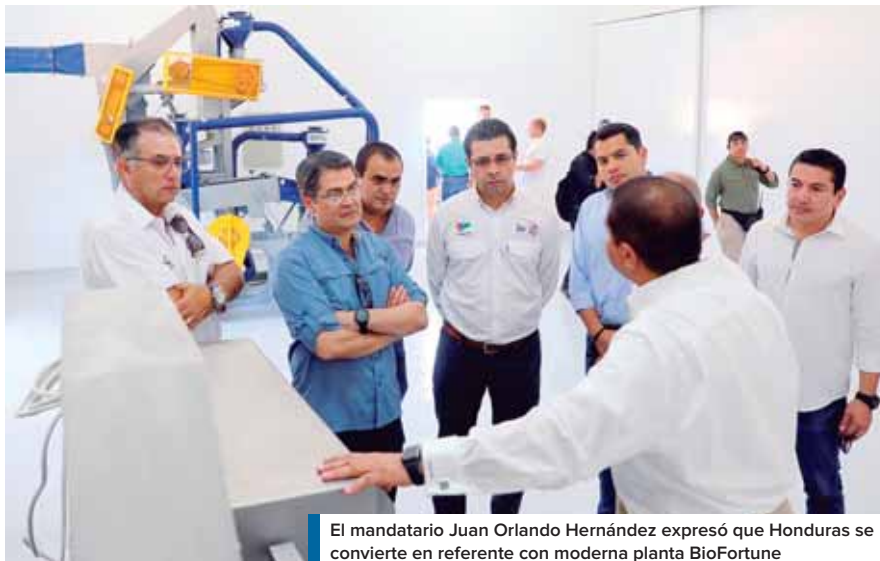
El mandatario Juan Orlando Hernández expresó que Honduras se convierte en referente con moderna planta BioFortune

Hernández recordó que siempre ha buscado mejores precios y mercado para el aromático y dijo que “esta es la primera vez, creo yo, que hay un presidente que es cafetalero; así que, cafetaleros, vayan pensando para que no dejen olvidado el sector”. “Aquí creo que podemos estar en poco tiempo a la vanguardia mundial. No es lo mismo cortar el café en Brasil con una máquina que agarra el tallo y lo sa-