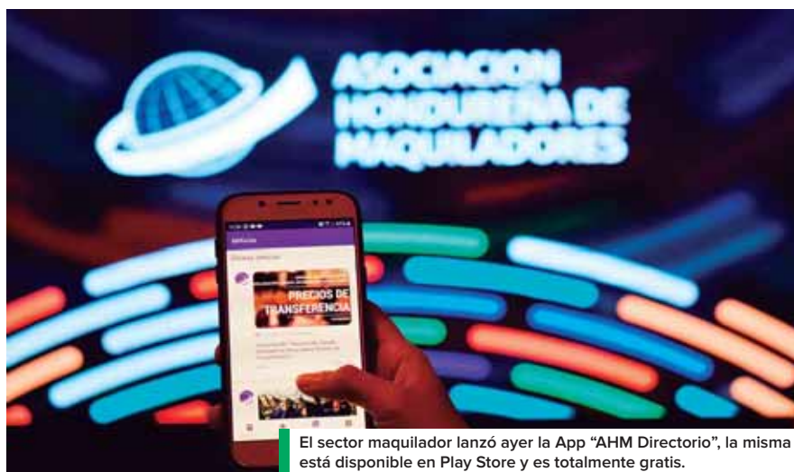
El sector maquilador lanzó ayer la App “AHM Directorio”, la misma está disponible en Play Store y es totalmente gratis.

“La revolución industrial ya comenzó y como asociación no nos