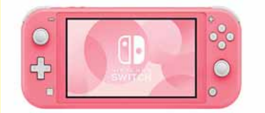
Presentan Nintendo Switch Lite Coral

Galaxy Watch Active 2, es un acompañante de entrenamiento más intenso, podrán elegir entre más de 40 rutinas diferentes. Es compatible con teléfonos de otras marcas, incluyendo al iPhone de Apple. En materia de resistencia al agua, el Active 2 tiene el protocolo más alto y está pensado para natación en aguas de piscina o playa, pero tiene indicaciones de cuidado que no todos los usuarios suelen tener en cuenta. En cuanto a batería, aunque la promesa es de un día, su rendimiento depende del uso, el reloj puede soportar dos y hasta tres días, usando el modo de ahorro de energía que convierte todo a blanco y negro. TECNÓSFERA