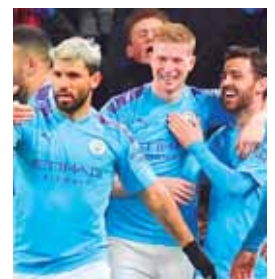
El City tiene 54 puntos, mientras que el Liverpool 76.