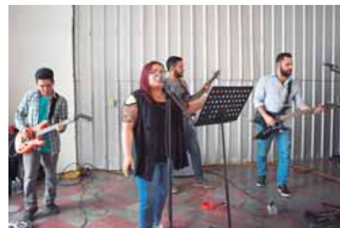
La agrupación musical “Piloto” amenizó el Instameet Plaza de la Cultura 2019.