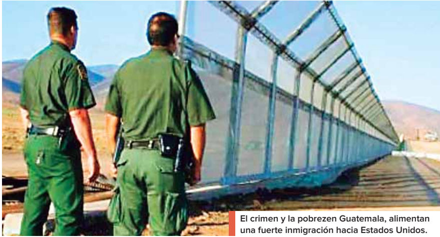
El crimen y la pobreza en Guatemala, alimentan una fuerte inmigración hacia Estados Unidos.