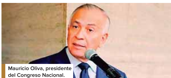
Mauricio Oliva, presidente del Congreso Nacional.

TEGUCIGALPA. El presidente del Congreso Nacional, Mauricio Oliva, reveló que las negociaciones para alcanzar un acuerdo sobre las reformas electorales han avanzado en un 98%.