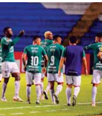
Real España, son los únicos equipos invictos y en el Apertura 2019-2020.

Los clubes Honduras, Real Sociedad, Vida y Platense, son los equipos que no han conseguido un triunfo en el Torneo Apertura.