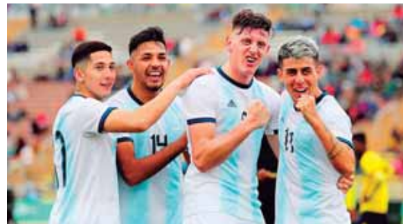
El combinado nacional es el máximo ganador de este certamen con seis medallas doradas (1951, 1955, 1959, 1971, 1995 y 2003).

FECHA: 10 de agosto HORA: 7:30 p.m. CIUDAD: Lima, Perú