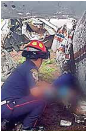
En la avioneta hallaron 171 kilos de cocaína.

Dentro de la avioneta fueron encontrados 171 kilos de cocaína y una pequeña cantidad de dóla-