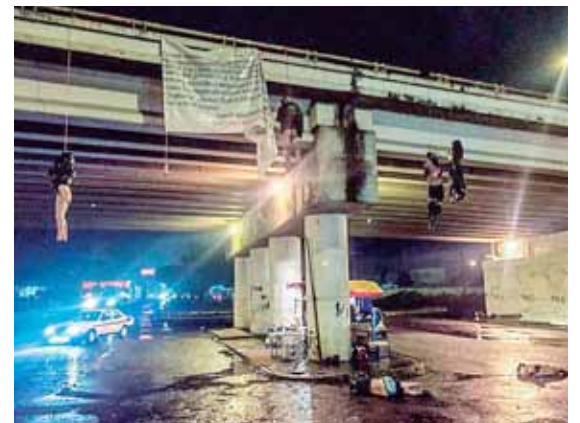
Los asesinatos de los ciudadanos obedece a pugnas entre grupos de la delincuencia organizada, según los fiscales.

De acuerdo a los policías, el Cartel Jalisco Nueva Generación (CJNG), encabezado por Nemesio Oseguera Cervantes “El Mencho”, se atribuyó el asesinato de las 19 personas.