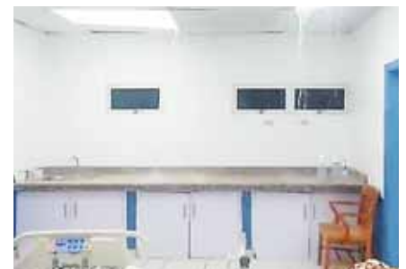
Debido a la fuerte lluvia, el drenaje del techo del hospital se rebalsó ocasionando así el caos.