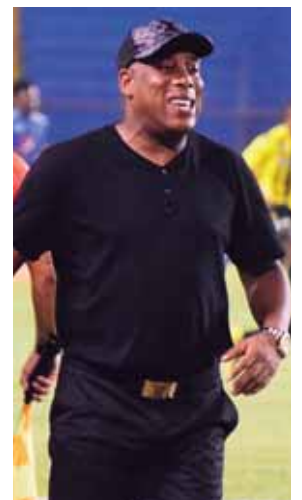
“Es algo raro, cómo me van a dar permiso para algo y después me lo quitan”, apuntó el entrenador de la Máquina.

El tico se mostró molesto porque la LINA permitió a su equipo inscribirlo y ahora es que ya no puede jugar. “Ya lo que pasa, pasa, y no se puede solucionar, ojalá el muchacho pueda quedar inscrito, son cosas que solo pasan en este fútbol, dan permiso, después nos arrepentimos y no damos permiso, si analizamos esto, creo que es la primera vez en el mundo que nos dan permiso de inscribirlo y ahora no se puede”, dijo.