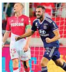
No hubo pruebas que Neymar intentó violar a una modelo.