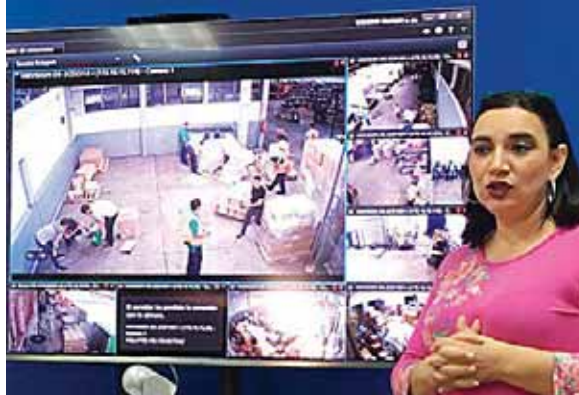
El nuevo control permite agilizar el ingreso de mercaderías, ya que las cámaras transmiten en tiempo real las actividades de aforo.

visitas a los puntos fronterizos de Nuevo Laredo, entre México y Estados Unidos y aduanas de Suramérica como en Colombia.