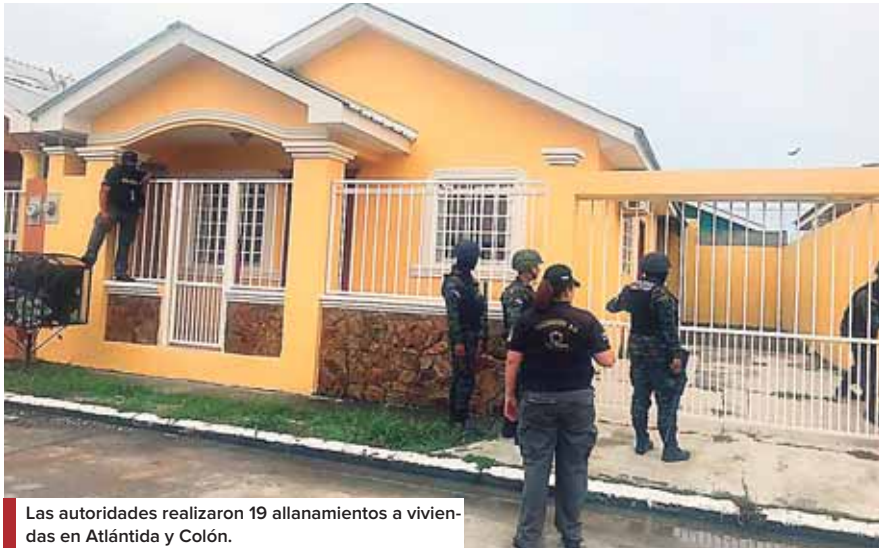
Las autoridades realizaron 19 allanamientos a viviendas en Atlántida y Colón.