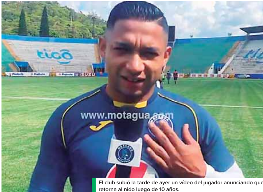
El club subió la tarde de ayer un vídeo del jugador anunciando que retorna al nido luego de 10 años.