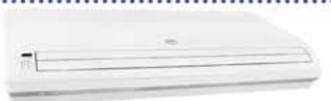
MODELO: FM-MUB1-36CR-NCS/FM-MOVB-36C-NCS CON COMPRESOR COOPELAND 3 TON.