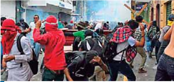
Foto de referencia. El ministro de Educación, Arnaldo Bueso, lamentó que algunos estudiantes continúen tomándose las instituciones.