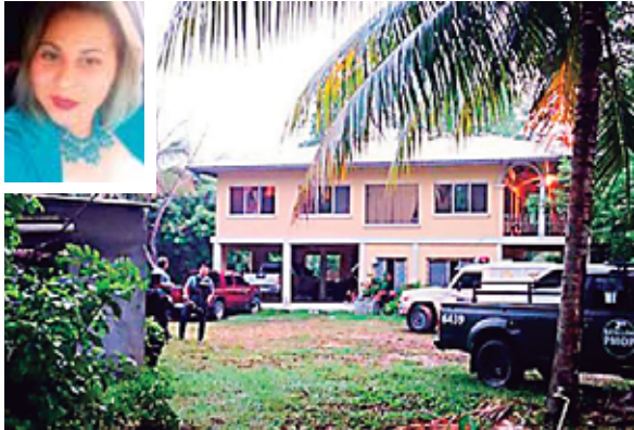
Los infortunados quedaron semidesnudos y con múltiples heridas. Los matones se llevaron una camioneta del patio.