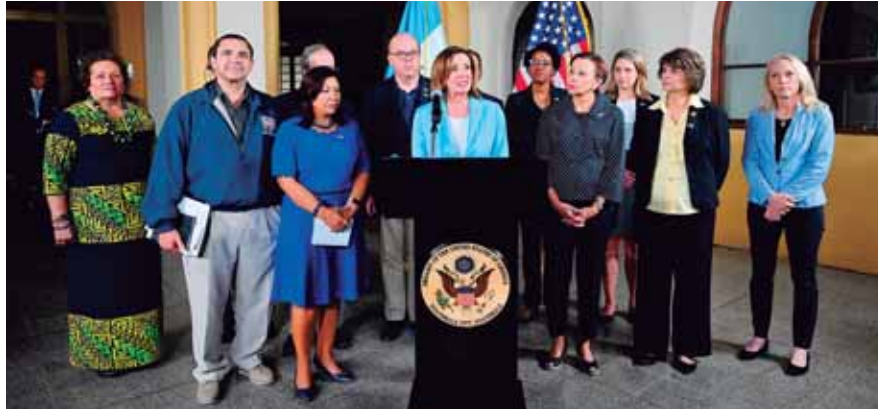
Pelosi encabeza una delegación de 14 miembros del Congreso que incluye a demócratas y republicanos.

“La visita de la presidenta de la Cámara de Representantes es importante para dialogar ampliamente de lo que el país, el gobierno, la sociedad y la clase política ha logrado en temas de relevancia y en los que