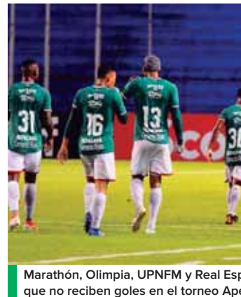
Marathón, Olimpia, UPNFM y Real España que no reciben goles en el torneo Apertura.