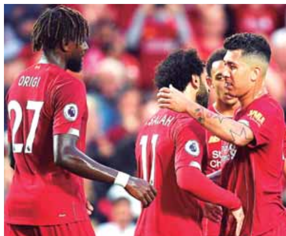
Liverpool es uno de los clubes favoritos a ganar el campeonato en la Premier League, junto al Manchester City, Tottenham y Manchester United.