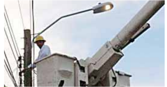
La idea de los funcionarios y sindicalistas de la compañía estatal es que nadie se quede sin trabajo.

Un total de 1.4 millones de habitantes de Honduras, Guatemala, Nicaragua y El Salvador necesitan asistencia alimentaria urgente debido a una reducción de las cosechas por las lluvias y sequías, según el Programa Mundial de Alimentos de la Organización de las Naciones Unidas.