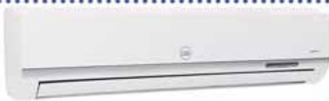
CONDENSADOR + EVAPORADOR MODELO: CAC-18CSA/BH2 18000 BTU