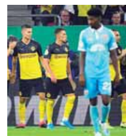
Borussia ganó la Supercopa y ahora avanza en Copa.