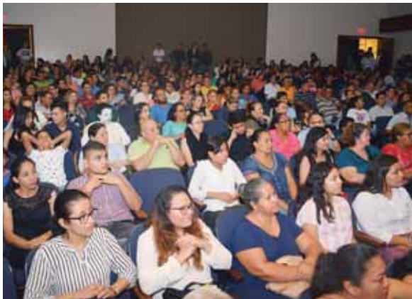
El auditorio general del Centro Cultural Sampedrano estuvo muy concurrido por padres de familia e invitados especiales al festival de artes.