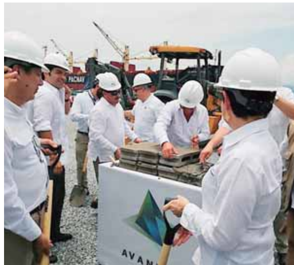
Cuando esté terminado este nuevo muelle tendrá una capacidad de carga de 2,500 toneladas.

EL PRESUPUESTO DE LA OBRA SERÁ DE UNOS 18.5 MILLONES DE DÓLARES