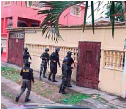
En la operación también participaron elementos de la Policía Militar de Orden Público.

“Con toda la información antes relacionada y en consideración a los lugares y modo de operar de este grupo delictivo se hace necesario la ejecución de los allanamientos con el propósito de recolectar los indicios que acrediten la comisión de los delitos denunciados”, indica un comunicado del MP.