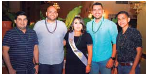
La futura señora de Mejía celebró su despedida de soltera con sus compañeros de trabajo.