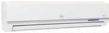
MODELO: TAC-24CS/BH2 220V/60HZ CON TUBO CON COMPRESOR TOSHIBA 24000 BTU