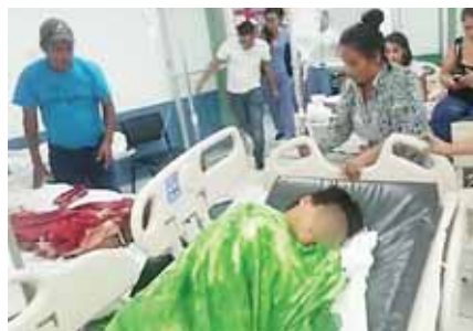
Las madres de los menores trasladaron a sus hijos hacia otras áreas para evitar que se mojaran.