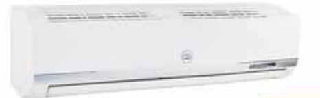
MODELO: TAC-30CS/BH2 200V/60HZ CON TUBO CON COMPRESOR TOSHIBA 30000 BTU