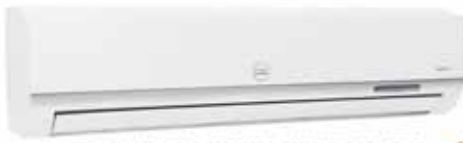
MODELO: TAC-12CSA/LC 220V/60HZ CON TUBO CON COMPRESOR TOSHIBA 12000 BTU

✓ Instalación básica GRATIS Accesorio GRATIS Includo Tubo de Cobre para Mini Split hasta aires de 30,000 BTU ✓ Compresores marca Toshiba y Coopeland.