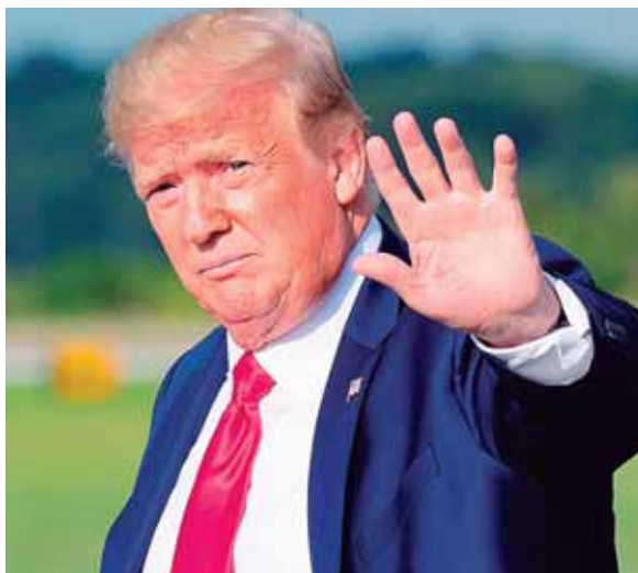
Por ley, el presidente de EE.UU. debe enviar anualmente un memorando al secretario de Estado en el marco de las asignaciones de gastos.

“Necesitamos ver un compromiso sostenido y unificado de los funcionarios del gobierno mexicano”, señaló el mandatario. “Sin más progreso durante el próximo año, consideraré determinar que