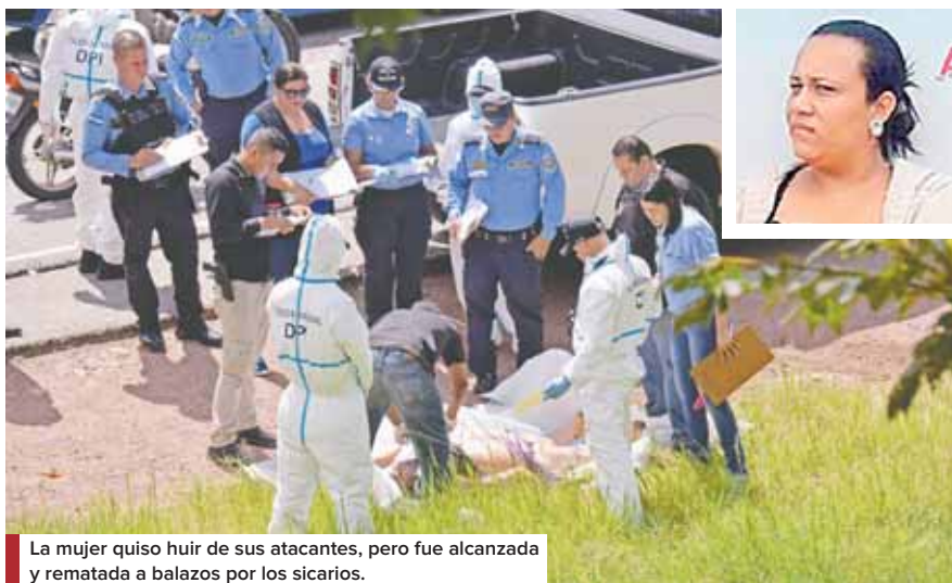
La mujer quiso huir de sus atacantes, pero fue alcanzada y rematada a balazos por los sicarios.

Para el caso, el 15 de abril pasado cinco miembros de la familia fueron masacrados a balazos en la al-