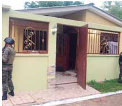
Agentes de la Dirección de Lucha Contra el Narcotráfico (DLCN) resguardaron los bienes.