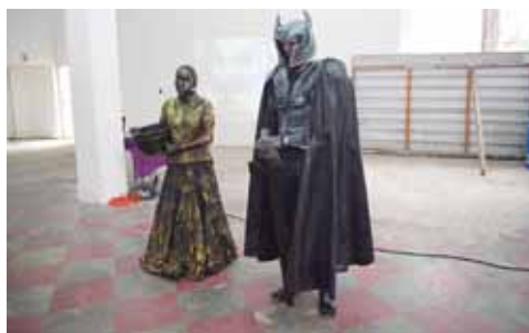
Las estatuas vivientes de Proyecto Teatral Futuro participaron en el recorrido por la instalación de la histórica edificación.