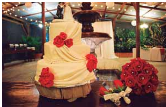
El exquisito pastel que disfrutaron los invitados a la boda.