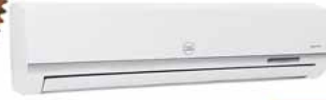
CONDENSADOR + EVAPORADOR MODELO: CAC-24CSA/BH2 24000 BTU