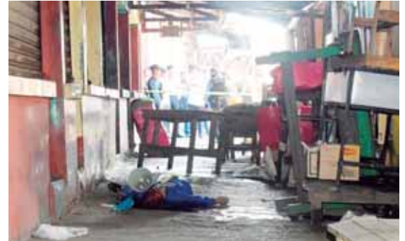
El hecho ocurrió en la 6 calle entre la 6 y 7 avenidas, cuando el hombre iba anunciando el número ganador del día.

Elementos de la Fusina, mediante orden de un juez, procedieron ayer a incinerar 76 sacos con marihuana, lo que equivale a mil 845 libras de hierba. La destrucción se ejecutó en las instalaciones del Tercer Batallón de Infantería de Naco, Cortés, la mañana de ayer.