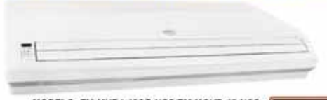
MODELO: FM-MUB1-48CR-NCS/FM-MOVB-48-NCS CON COMPRESOR COOPELAND 4 TON.