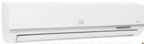
MODELO: TAC-18CS/LC 220V/60HZ CON TUBO CON COMPRESOR TOSHIBA 18000 BTU