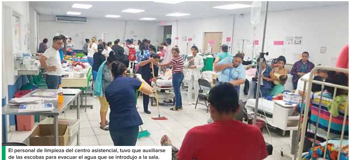
El personal de limpieza del centro asistencial, tuvo que auxiliarse de las escobas para evacuar el agua que se introdujo a la sala.

De igual forma, Pineda detalló que ya las gestiones fueron realizadas con los ingenieros del hospital para acordar las medidas a tomar y ejecutarla en los siguientes