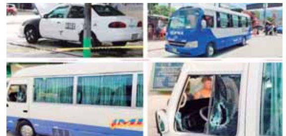
De acuerdo con las autoridades, el sospechoso tiene participación en el crimen de al menos 15 trabajadores del transporte.

En julio de este año habría participado directamente en más de 15 crímenes contra trabajadores del rubro del transporte.