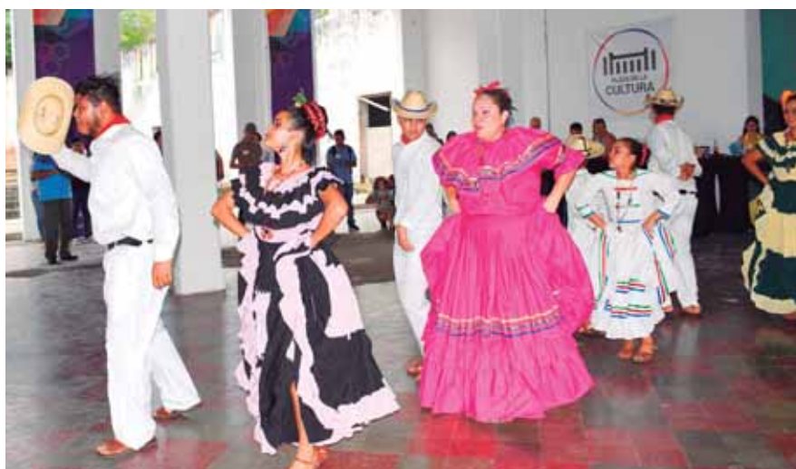
Una muestra de las realidades detrás del lente.

El recorrido por las instalaciones del patrimonio histórico, inició en la fachada, para luego continuar por lo que será el parque