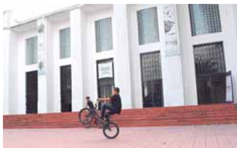
El grupo de chicos BMX hicieron sus piruetas frente a la fachada de La Plaza de la Cultura.