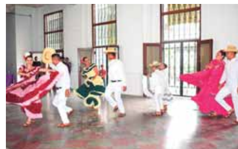
Con la visión de promover el arte y la cultura nacional, grupos de danza folklórica participaron en el recorrido artístico.