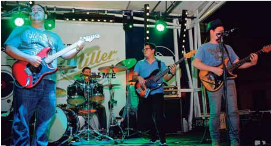
Las bandas musicales hicieron un espectacular show en el AngusTock Fest 2019.