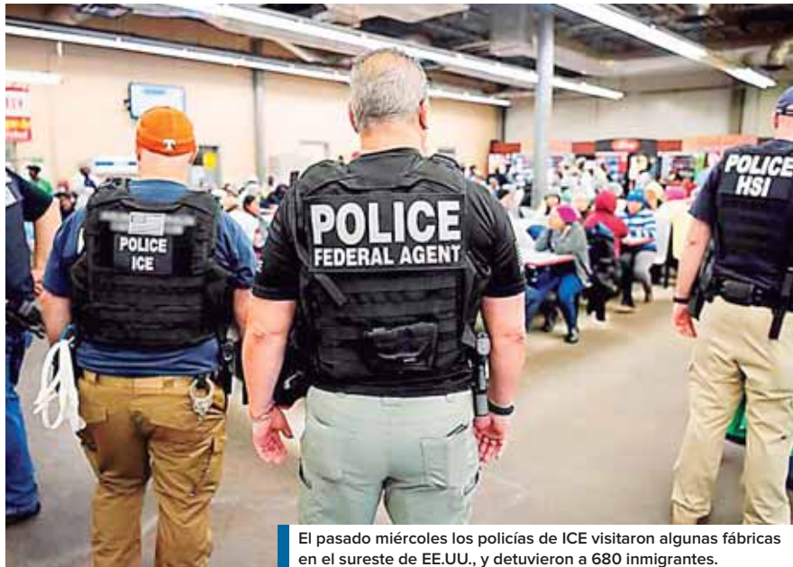
El pasado miércoles los policías de ICE visitaron algunas fábricas en el sureste de EE.UU., y detuvieron a 680 inmigrantes.

"Con instrucciones del presidente Hernández y el canciller Lisandro Rosales se trasladó un equipo de protección del consulado de Nueva Orleans hacia Mississippi para poder estar cerca de los posibles hondureños que fueron detenidos en esa operación de ICE", refirió el diplomático.