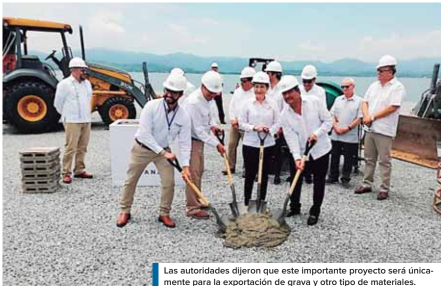
Las autoridades dijeron que este importante proyecto será únicamente para la exportación de grava y otro tipo de materiales.