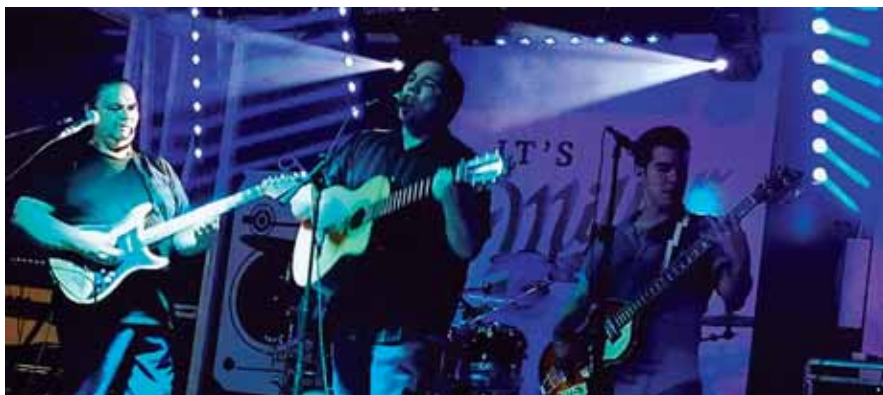
La banda La Revolución deleito a los presentes con los éxitos musicales de la popular banda The Beatles.