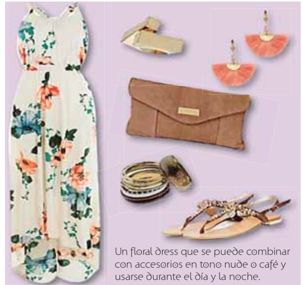
Un floral dress que se puede combinar con accesorios en tono nude o café y usarse durante el día y la noche.