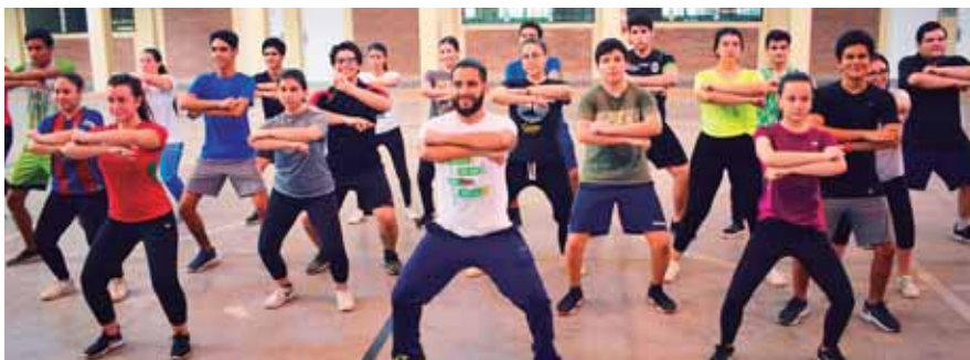
El baile sincronizado de los estudiantes de la Franciscan School seguramente se robará los aplausos de los presentes.