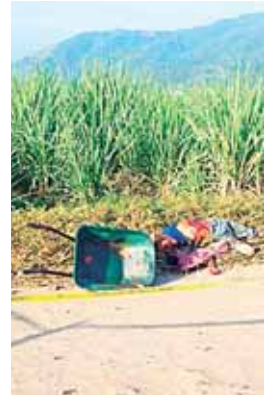
El hombre presentaba signos de tortura y fue encontrado a la orilla.

Un acompañante fue requerido únicamente para efectos de investigación.