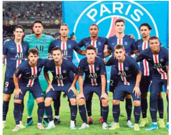
El equipo de la capital parisina, que ha ganado seis de los últimos siete campeonatos de nuevo figura como el gran favorito.