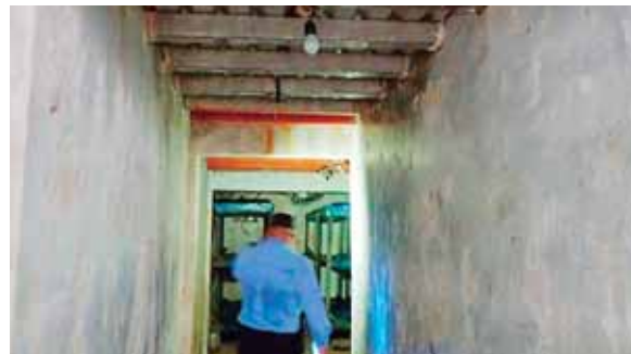
El pasillo es amplio y conecta a dos cubículos, donde descansaban los mareros.

Las autoridades constataron que en el sitio hay energía eléctrica, la cual instalaron de manera subterránea mediante tubería.