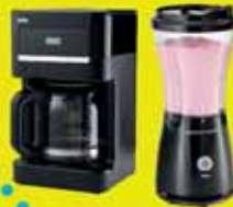
*PERCOLADORAS *MICROONDAS *LICUADORAS