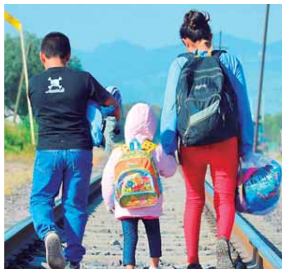
Las autoridades estadounidenses les dicen a las familias que no ingresen a este país de manera ilegal, sino que lo hagan legalmente.