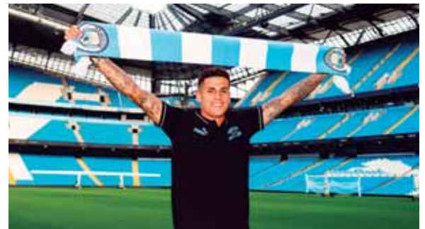
Joao Cancelo fue presentado ayer como nuevo refuerzo del Manchester City.