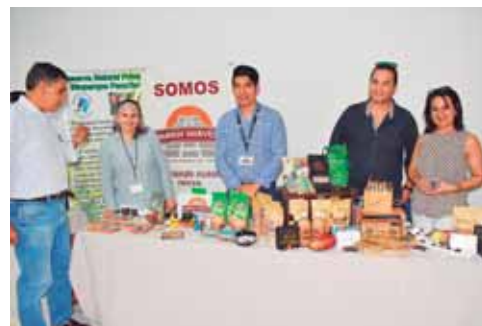
Mayan Harvest, en Copán Ruinas, ofrecen chocolates, jaleas y bombones hechos a base de cacao.