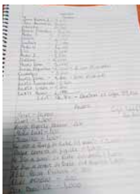
Se les decomisó una lista con nombres de sus víctimas.

Al momento de su captura se les decomisó L500, una pistola con su cargador, 33 cartuchos, al igual que una libreta donde apuntaban