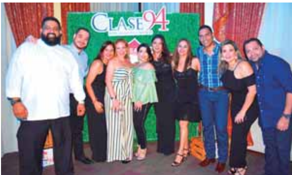
Los organizadores del tercer reencuentro de la Clase '94 del Instituto La Salle.