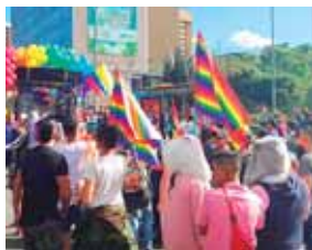
Los miembros de esta organización aseguran estar desprotegidos.

ELSALVADOR. Organizaciones latinoamericanas defensoras de los derechos de la comunidad LGBTI demandaron ayer un alto a las agresiones contra miembros de los colectivos, que entre 2014 y 2019 sufrieron la muerte violenta de casi 1,300 personas en la región.