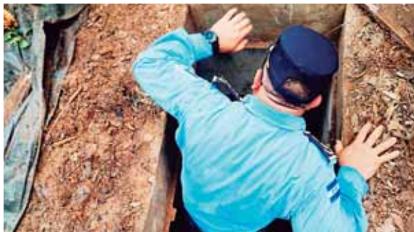
La entrada estaba oculta con una tapadera, con al menos un metro de tierra sobre el techo.

La acción fue ejecutada por unidades operativas de la Policía Nacional en coordinación con la Unidad Fiscal de Operaciones Especia-