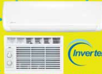
AIRES DE VENTANA Y MINI SPLITS