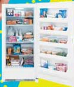
FREEZERS PEQUEÑOS Y GRANDES