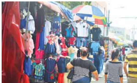
Cuando hay paralizaciones con tomas de carreteras son afectados los negocios grandes y pequeños.

Indicó que esos resultados se darían a conocer el próximo jueves, luego que el directorio del BCH