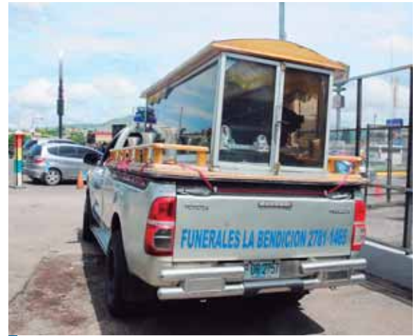
En la actualidad se encuentra en proceso de repatriación el cuerpo de 89 hondureños.