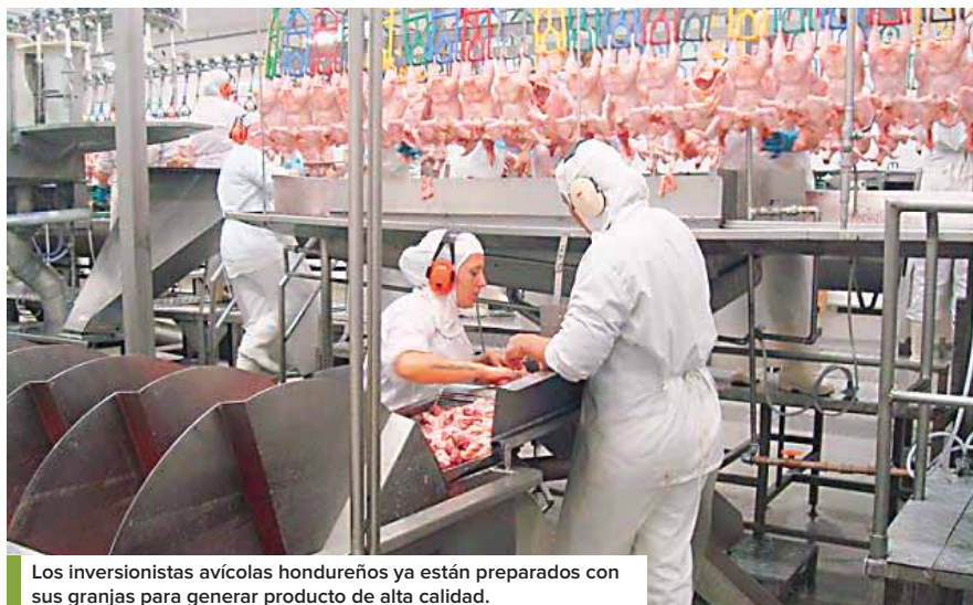
Los inversionistas avícolas hondureños ya están preparados con sus granjas para generar producto de alta calidad.

En abril pasado, el sistema para productos avícolas que mantiene el Servicio Nacional de Sanidad e Inocuidad Agroalimentaria (Se-