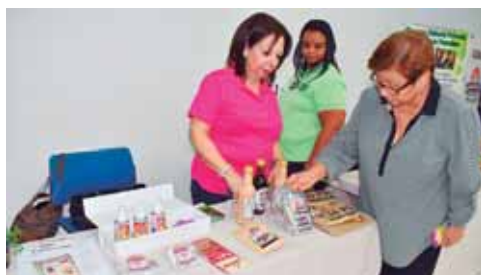
Chocalatl se las han ingeniado para producir repelentes a base del “alimento de los dioses”.