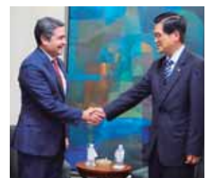
El mandatario Juan Orlando Hernández y el ministro taiwanés Yen Teh-fa abordaron diversos temas.

El jerarca militar dijo que “Taiwán, como siempre, sigue colaborando en otros temas, especialmente de tecnología, y nosotros tenemos 20 estudiantes (militares), entre oficiales superiores, cadetes y otros que cursan maestrías (en ese país); estamos apuntando