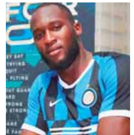
El jugador belga fue recibido por cerca de 200 aficionados.