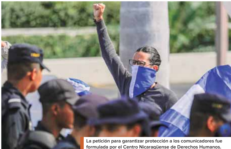
La petición para garantizar protección a los comunicadores fue formulada por el Centro Nicaragüense de Derechos Humanos.