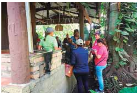
En la finca Santa Martha, los visitantes aprenden cómo se elabora el chocolate.