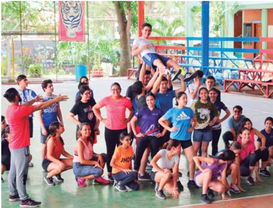
Los seniors del Instituto Bilingüe Episcopal Buen Pastor esperan sorprender a sus demás compañeros.