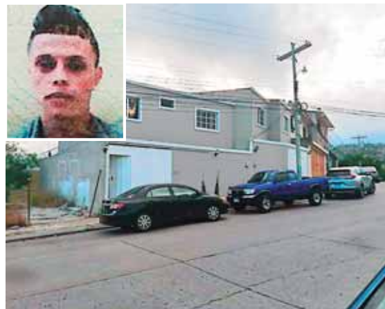
El hombre degollado quedó en el interior de la vivienda donde las autoridades hicieron el levantamiento.

los cobros de extorsión que hacían a transportistas, cuatro celulares y un taxi.