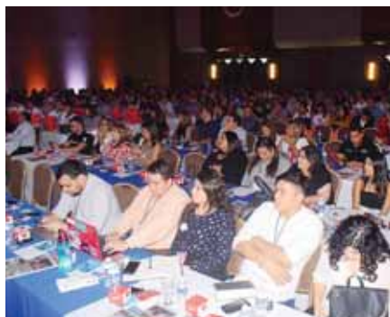
Representantes de diferentes empresas y emprendedores se empaparon de diversos temas.