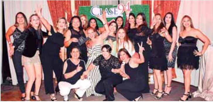
Las damas protagonistas del reencuentro entre ex compañeros, en una imagen para recordar.