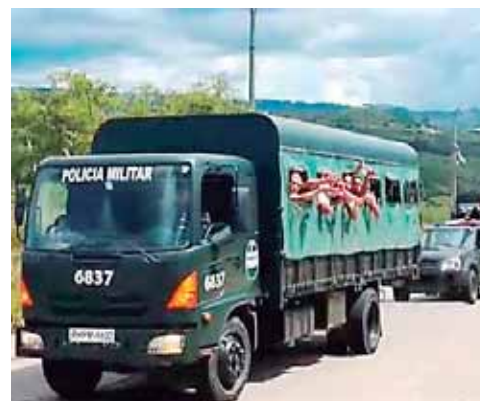
Un grupo de enjuiciados también se trasladó en vehículos de la Policía Militar.