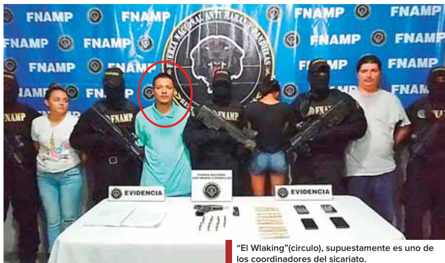
“El Wlaking” (círculo), supuestamente es uno de los coordinadores del sicariato.