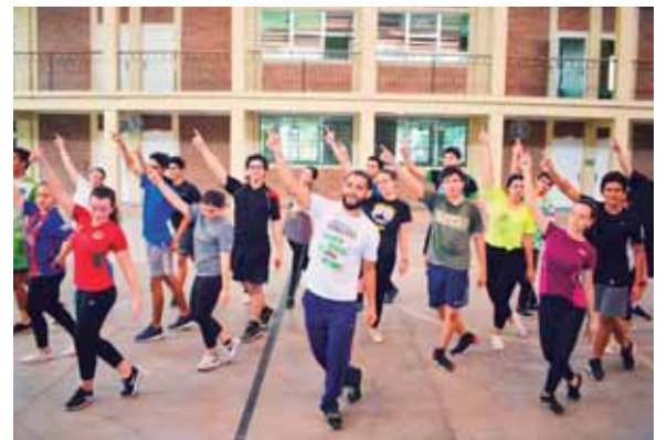
Los chicos de la Franciscan School, la temática de ellos es sorpresa y no quisieron revelarla a Diario EL PAÍS.