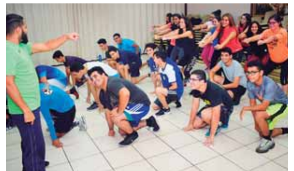
Los seniors de la Valle de Sula se encuentran trabajando arduamente en su coreografía y su temática será la Nasa, el espacio.

Desde que inicia la caravana hasta llegar a la institución todo es pura alegría, son aproximadamente 40 jóvenes que estarán bailando la coreografía que dura entre 10 a 12 minutos. “Es importante destacar que este año los seniors se han puesto la meta de mejorar las entradas”, concluyó.