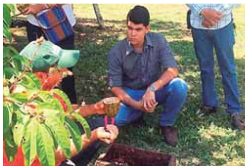
En esta misma finca, productores explican los procesos que se siguen en las plantaciones.