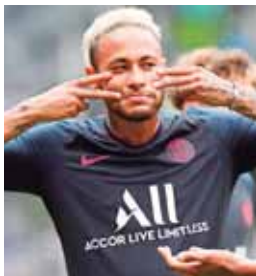
No hubo pruebas que Neymar intentó violar a una modelo.