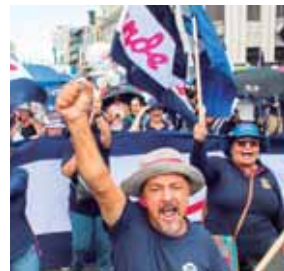
Los manifestantes exigen restricciones presupuestarias.

La manifestación recorrió la céntrica Avenida Segunda, que cruza la capital de oeste a este, para llegar a la sede de la Asamblea Legislativa para exigir que