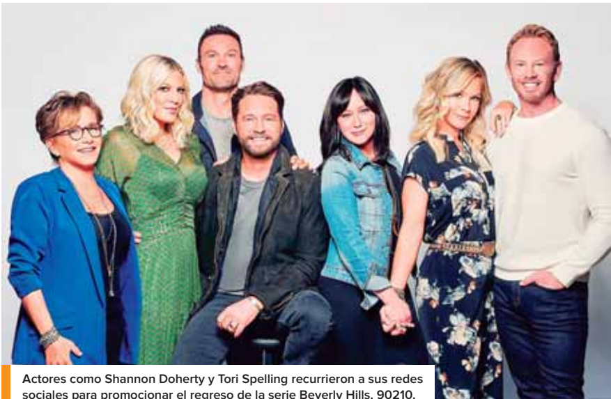
Actores como Shannon Doherty y Tori Spelling recurrieron a sus redes sociales para promocionar el regreso de la serie Beverly Hills, 90210.