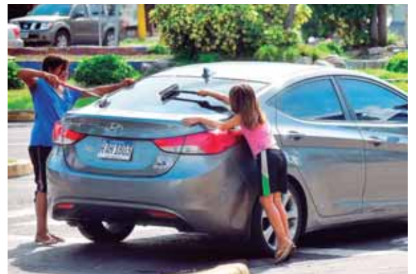
En las calles de San Pedro Sula, es común ver a menores de edad trabajando. Mucho de ellos no estudian.

Brillantes, comunicó que “es importante que este tema sea abordado ya que en la actualidad es visto como algo que hace madurar a los niños, sin embargo, lo que hace es condenar a las generaciones a la pobreza”, apuntó. De acuerdo a estadísticas del Instituto Nacional de Estadísticas (INE), un promedio de 400 mil niños trabaja, siendo el área agrícola en la que mayormente se da la incidencia.