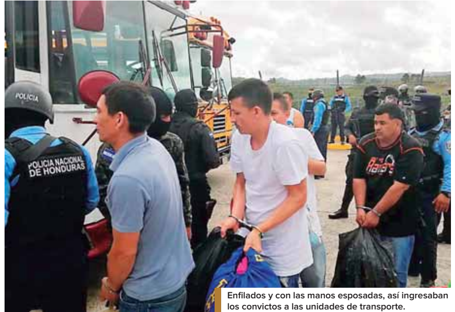
Enfilados y con las manos esposadas, así ingresaban los convictos a las unidades de transporte.

LA OPERACIÓN FUE EJECUTADA POR LAS INSTITUCIONES DE SEGURIDAD