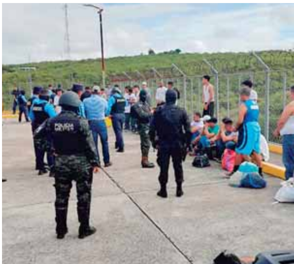
Mientras esperaban a ser trasladados, los reos eran organizados por los elementos de varias instituciones de seguridad.

Con ese movimiento, las autoridades buscan evitar que los privados de libertad sigan girando instrucciones de extorsión y asesinato desde el interior de los penales.