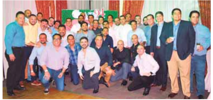
Los caballeros de la Promoción '94 de La Salle, no perdieron la oportunidad de posar y enmarcar una linda fotografía para recordar.