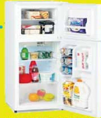
REFRIGERADORAS VARIEDAD (GRANDES Y PEQUEÑAS)