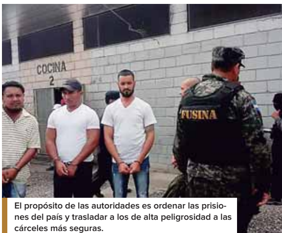
El propósito de las autoridades es ordenar las prisiones del país y trasladar a los de alta peligrosidad a las cárceles más seguras.

USO DE LA TECNOLOGÍA Hernández señaló que el uso de tecnología desde las cárceles le ha hecho un gran daño al país, pues los privados de libertad las aprovechan para ordenar extorsiones y asesinatos en el país. “Hemos detectado durante todo este tiempo cómo el mundo criminal aprovecha una visita para mandar un mensaje, sea verbal o por escrito, cómo utilizan llamadas y cómo, cuando salen a pedir atención médica o cuando salen a una audiencia, son for-