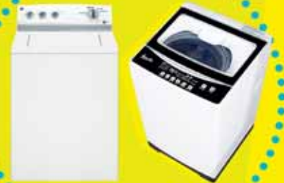
LAVADORAS DIGITAL Y NORMAL