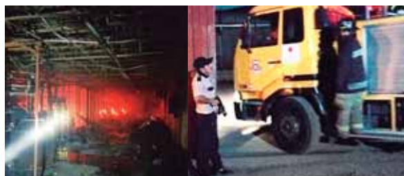
Luego de ser alertados, elementos del Cuerpo de Bomberos llegaron al lugar para sofocar el incendio.

De manera preliminar, los agentes de investigación manejaban dos hipótesis sobre el crimen; la primera que pudo ser motivada por el robo y la segunda que se trata de una muerte por encargo, debido a la forma en que se cometió.