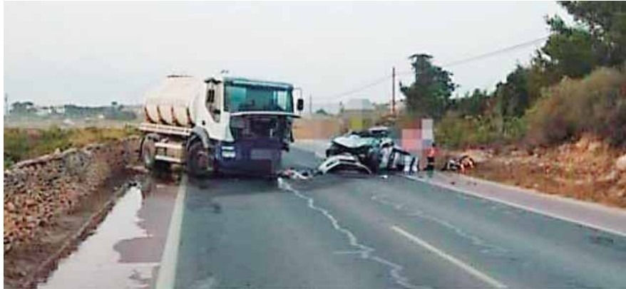
El vehículo en donde se conducía la compatriota cayó a una hondonada.

El promedio de la producción en esta temporada es de unos 600 mil quintales, por lo que se cuantificará una baja de 90 mil.