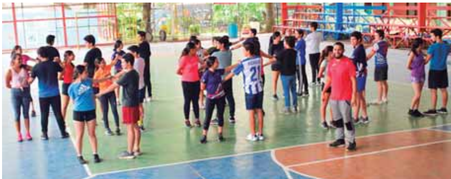
A parte de la coreografía la temática del Buen Pastor será la tecnología.

SAN PEDRO SULA. Con gran esfuerzo, alegría y dedicación los jóvenes de las diferentes instituciones educativas privadas se preparan para realizar su triunfal Seniors Entrance 2020 - 2021, con la que inician su año académico.