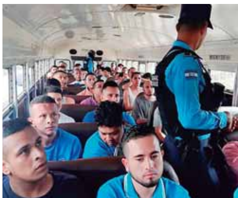
Los privados de libertad fueron llevados a sus nuevos recintos en varios autobuses.

Esta reubicación obedece a ser mucho más precisos y a endurecer el mecanismo de máxima seguridad”. Juan Orlando Hernández, presidente de Honduras.