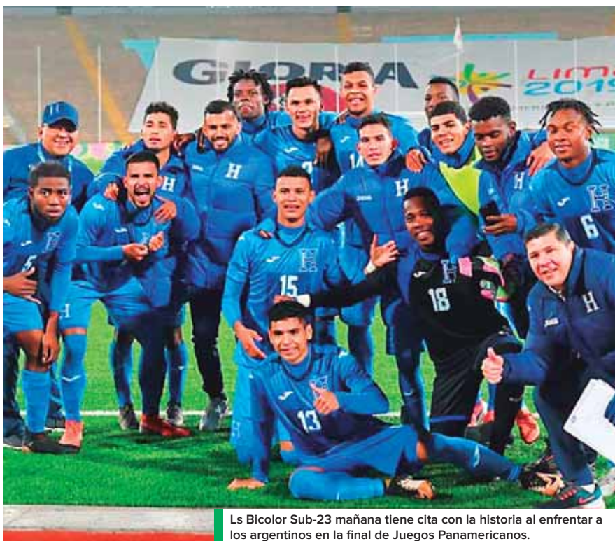
La Bicolor Sub-23 mañana tiene cita con la historia al enfrentarse a los argentinos en la final de Juegos Panamericanos.

Juegos: Winnipeg 1999 DT: Ramón Maradiaga Posición final: 2do lugar, Resultados: Honduras 2-1 USA Honduras 4-1 Uruguay Honduras 2-0 Cuba Honduras 2-1 Jamaica Semifinales: Honduras 2-0 Canadá Final Honduras 1-3 México