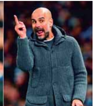
Klopp y Guardiola sin duda volverán a vivir una intensa pelea por alcanzar el campeonato de la Premier League.