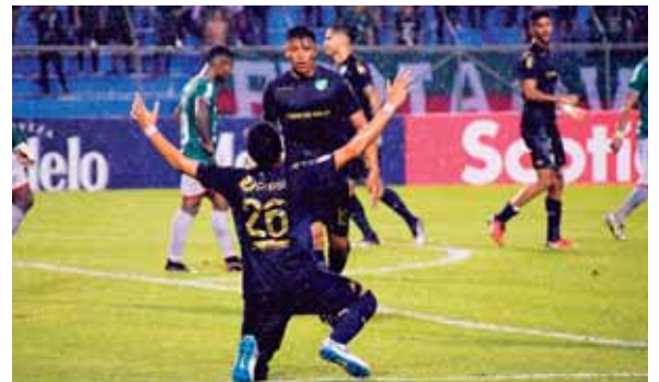
Los jugadores del Comunicaciones festajan su milagroso pase, en el último suspiro del juego.