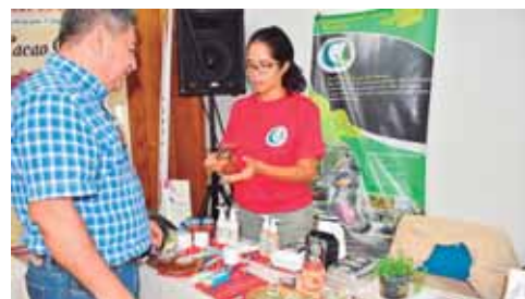
La Finca Luna del Puente se encuentra en el Lago de Yojoa y ofrece diferentes productos artesanales.