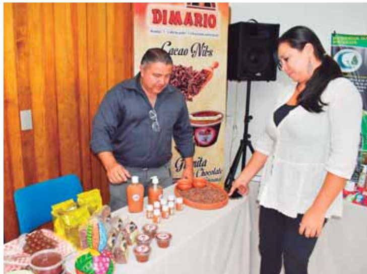
La empresa DIMARIO aprovechó la oportunidad para exhibir productos de belleza que son elaborados en base al cacao. Algo que captó la atención las mujeres.