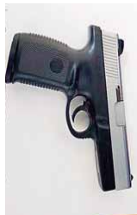
Durante los fuertes operativos, los policías decomisaron varias bolsitas con droga y hasta un arma de fuego.