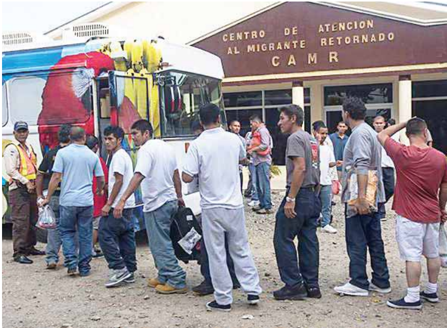
El Gobierno de Honduras ha creado diversos programas para ayudar a los compatriotas.

TEGUCIGALPA. Unos 200 migrantes retornados serán beneficiados con el proyecto “Inclusión en los Procesos Productivos de los Migrantes Retornados en los rubros de Frijol y Pollos de Engorde”.