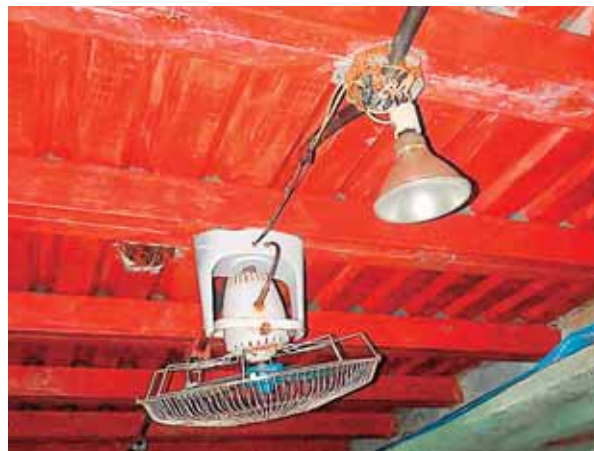
La estructura cuenta con un sistema eléctrico de ingeniería, hecho por expertos en la materia.

PODRÍAN HABER UNAS CUATRO EDIFICACIONES SIMILARES EN LA ZONA