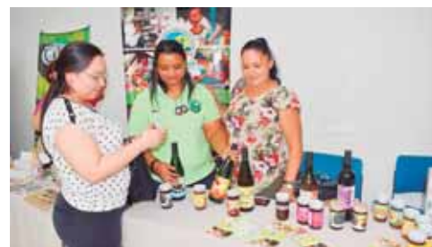
Las mujeres encargadas de Amalancetilla preparan con cariño vinos y jaleas a base de cacao.