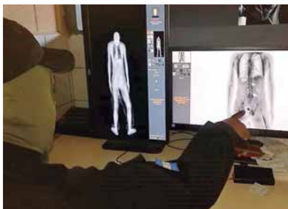
En los últimos meses, familiares han pretendido ingresar objetos a los centros penitenciarios a la hora de la visita.