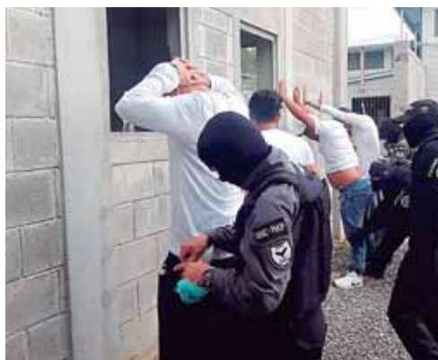
Antes de ser trasladados, fueron sometidos a minuciosas inspecciones.