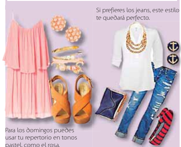
Si prefieres los jeans, este estilo te quedará perfecto.

look informal pero coqueto que tanto deseas. Para que tengas una idea, te dejamos 4 estilos diferentes que puedes usar tanto el sábado como domingo. Recuerda que lo más importante son los accesorios que agregues a tu outfit.