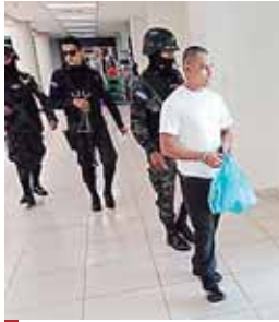
Un juez resolvió imponerle detención también como sospechoso de asociación ilícita.