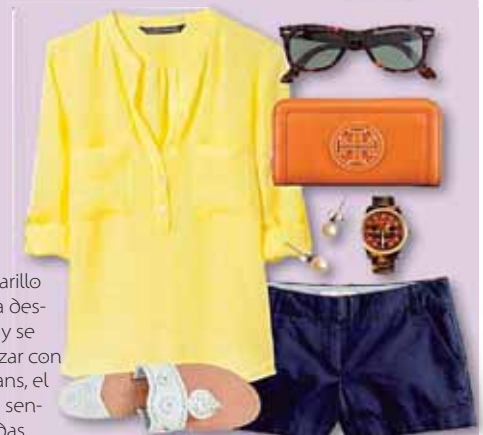
El tono amarillo nunca pasa desapercibido y se puede utilizar con shorts o jeans, el objetivo es sentirse cómodas.