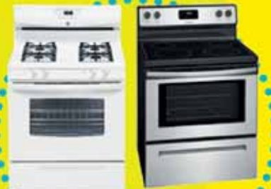
VARIEDAD ESTUFAS BLANCAS-CERÁMICAS-GAS