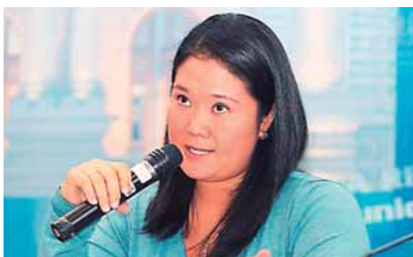
Keiko Fujimori, lleva nueve meses en la cárcel.

El gobierno de México dijo ayer que hay 107 mexicanos entre los 680 detenidos en este megaoperativo contra la migración ilegal. Todos estos ciudadanos capturados en las redadas contarán con asistencia de los consulados en su proceso legal.