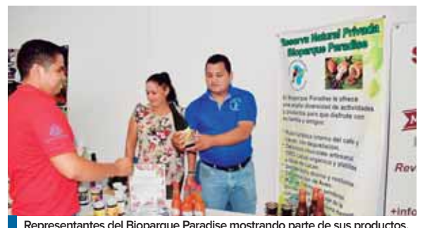
Representantes del Bioparque Paradise mostrando parte de sus productos.

Finalmente, Felipe Caballero, presidente de la ruta ecoturística del cacao de Honduras acotó que el proyecto se extenderá desde La Ceiba hasta el Lago de Yojoa. Además, Copán Ruinas, Villanueva, San Pedro Sula y Santa Bárbara.