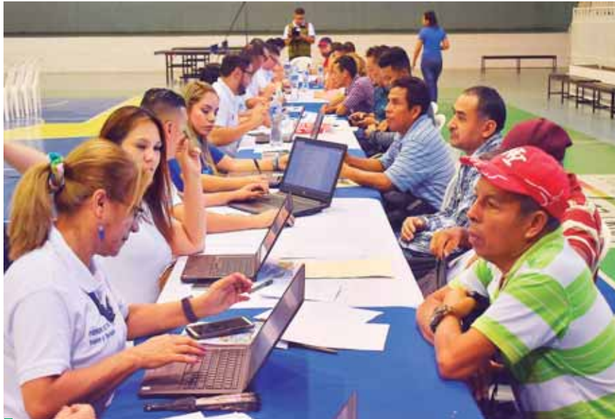
Los aspirantes, pudieron entregar sus documentos con la finalidad de poder aplicar a un puesto de trabajo.

Agregó que los aspirantes deben presentar hoja de antecedentes penales y no haber tenido problemas migratorios con Estados Unidos, o sea, que no hayan sido deportados ni que hayan violado una ley dentro de los Estados Unidos para aplicar a este tipo de programas.