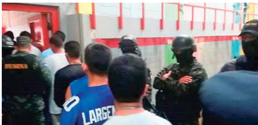
Al menos 21 mil 288 personas detenidas conviven en los centros penitenciarios a nivel nacional, de estas, unas tres mil 500 pertenecen a maras y pandillas.