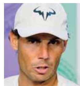
Rafael Nadal quedó triste luego de la derrota.