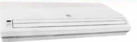
MODELO: FM-MUB1-36CR-NCS/FM-MOV8-36C-NCS CON COMPRESOR COOPELAND 3 TON.