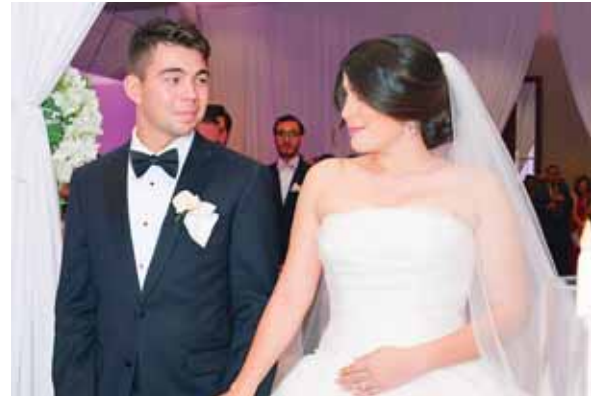
Seguros de sí mismos, los jóvenes unieron sus vidas.