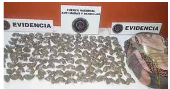
Al ahora acusado se le decomisó 138 envoltorios conteniendo presunta marihuana.

Al sindicado, dijo Moradel, se le decomisó 138 envoltorios conteniendo supuesta marihuana.