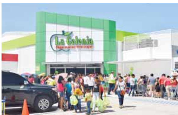
Supermercados La Colonia número 50 está ubicado en la Plaza San Elías, carretera CA-5 contiguo al Centro Comercial Megaplaza en Villanueva, Cortés.

su desarrollo económico y por ente al de Honduras.