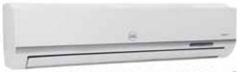
MODELO: TAC-12CSA/LC 220V/60HZ CON TUBO CON COMPRESOR TOSHIBA 12000 BTU

✓ Instalación básica GRATIS Accesorio GRATIS Includido Tubo de Cobre para Mini Split hasta aires de 30,000 BTU ✓ Compresores marca Toshiba y Coopeland.