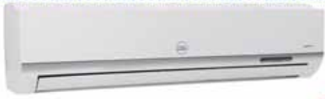
CONDENSADOR + EVAPORADOR MODELO: CAC-18CSA/BH2 18000 BTU