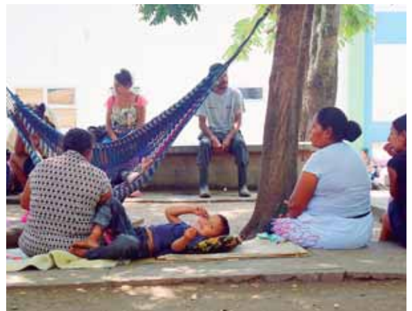
El rostro refleja el desvelo y cansancio, sin embargo se mantienen en vela para cuidar de sus familiares.