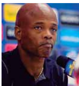
Los panameños está en duda si continúa o no Dely.