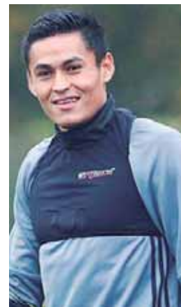
El futbolista que regresaba a la Bicolor justamente ante Paraguay, no jugará más por el resto del 2019.

El futbolista podría estar fuera de las canchas por seis meses para que este al cien de nuevo.