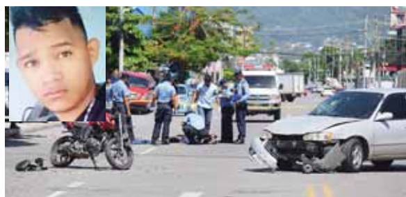
El infortunado motociclista salió volando y posteriormente cayó en el pavimento donde quedó muerto.