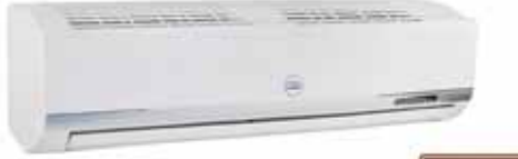
MODELO: TAC-30CS/BH2 200V/60HZ CON TUBO CON COMPRESOR TOSHIBA 30000 BTU