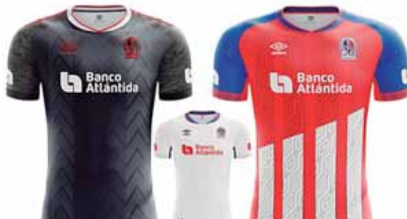
La nueva indumentaria que usarán los jugadores de Olimpia, fue presentada ayer por Diunsa.

Mientras que la de visita es de color rojo con rayas verticales blancas y con sus mangas azules, o tercera playera que será la alternativa, es de color negro, con los logos en bordado rojo y en su fondo el diseño digital.