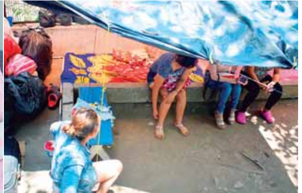
Los trillizos están recuperándose tras haber nacido prematuros, mientras los familiares han creado un refugio que les sirve como albergue.

LOS FAMILIARES DE PACIENTES SE QUEDAN A LA INTEMPERIE POR VARIOS MESES