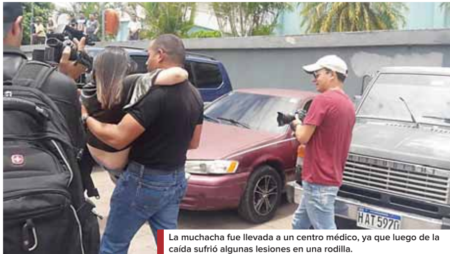
La muchacha fue llevada a un centro médico, ya que luego de la caída sufrió algunas lesiones en una rodilla.