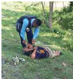
El ciudadano estaba vengado, al igual que con las manos y pies atados.