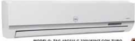
MODELO: TAC-18CSA/LC 220V/60HZ CON TUBO CON COMPRESOR TOSHIBA 18000 BTU