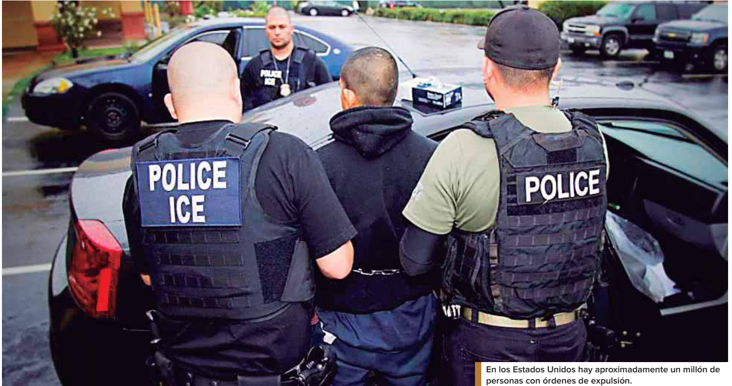
En los Estados Unidos hay aproximadamente un millón de personas con órdenes de expulsión.

La cancillería mexicana dio a conocer ayer, a través de un comunicado, que se redoblará las acciones de asistencia "en apoyo a los connacionales que pudieran resultar afectados por los posibles operativos migratorios" de Estados Unidos.