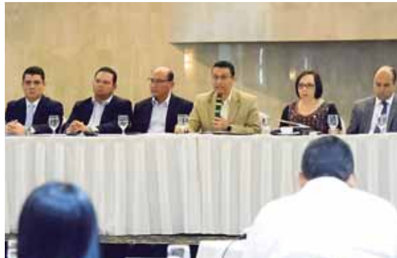
La socialización de los beneficios es encabezada por el secretario de la Presidencia Ebal Díaz y otros funcionarios.

Falck agregó que el proceso de crédito es simple e inicia con la solicitud ante el organismo financiero; luego se pide que sea con fondos Banhprovi y con la garantía de Con-