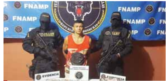
De acuerdo con las autoridades el ahora apresado pretendía acabar con miembros de una banda enemiga.

Luego de una denuncia al Sistema de Emergencia 911, agentes de la Dirección Nacional de Prevención y Servicios Comunitarios lograron la recuperación de una menor de edad y capturaron a un sospechoso de rapto en el municipio de Juticalpa, Olancho.