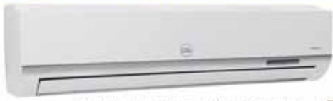
MODELO: TAC-24CS/BH2 220V/60HZ CON TUBO CON COMPRESOR TOSHIBA 24000 BTU