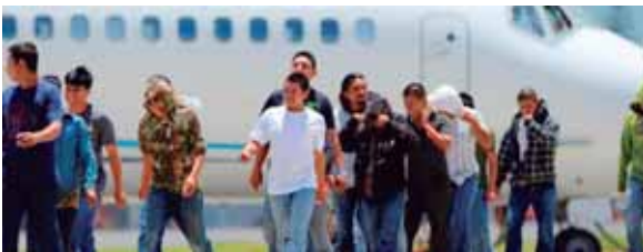
El año pasado fueron deportados, de México y Estados Unidos, más de 75 mil hondureños y en lo que va de este año van unos 40 mil.

“serán puestos en proceso de deportación y presentados ante un juez para que decida su futuro. Estos procesos demorarán mucho más que las 24 o 48 horas que se requieren para ejecutar algunas ordenes de deportación final”. Las redadas son conocidas como “Operación Familia” (family op).