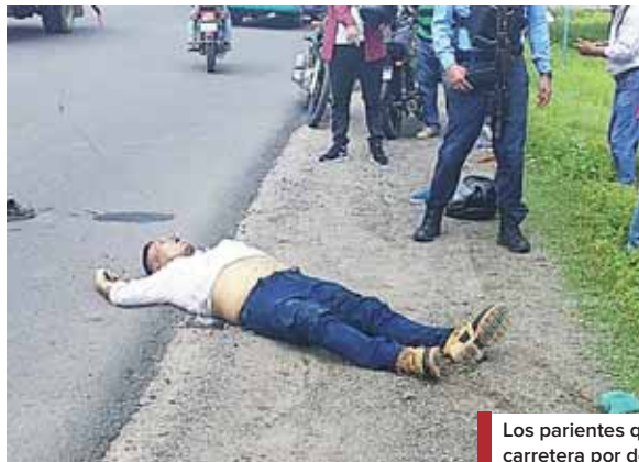
Los parientes quedaron sin vida a la orilla de una carretera por donde se conducían.

De acuerdo con información policial, debido a la presión que estaban sintiendo los facinerosos decidieron abandonarlo.