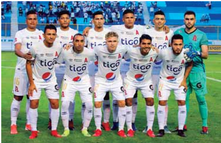
Alianza suma tres puntos, luego de vencer el miércoles anterior al Municipal 1-0. Se perfila para ser uno de los clasificados.