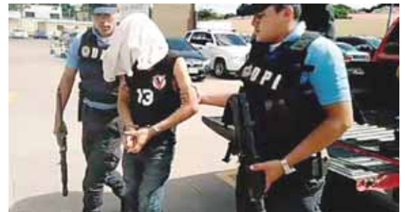
El menor de edad es presunto marero y está siendo acusado de asesinato y privación injusta de la libertad.

El detenido fue remitido al juzgado para el trámite legal correspondiente y que responda por el delito que se le imputa.