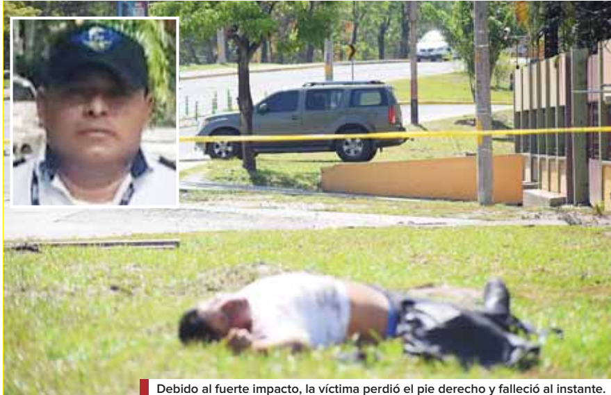
Debido al fuerte impacto, la víctima perdió el pie derecho y falleció al instante.