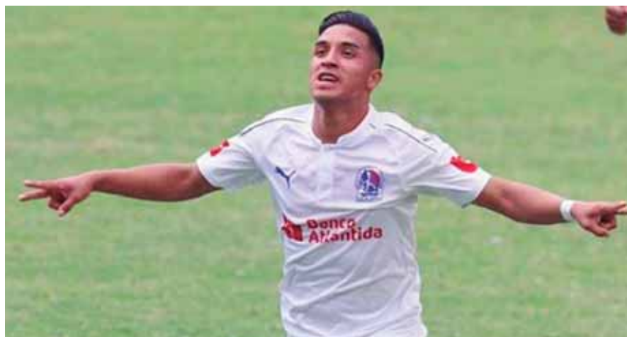
El futbolista será una de las grandes atracciones en el Apertura. Es un jugador de mucha clase.