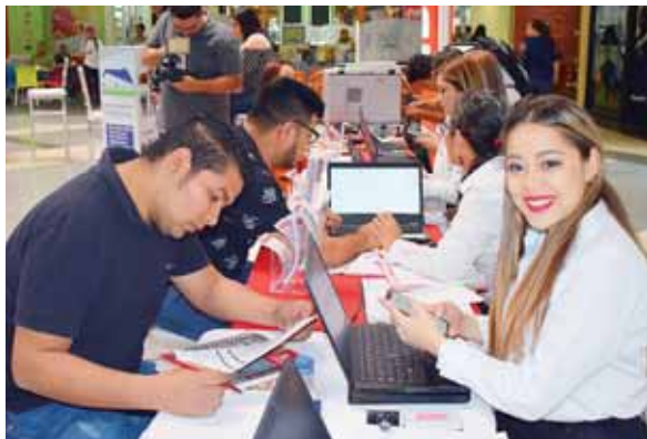
Las personas pueden llegar al redondel del Mall Galerías del Valle para solicitar su préstamo para hacerse de la casa de sus sueños.

Noroccidental de Banco Atlántida expresó que para los clientes que visiten la feria y soliciten su Préstamo de Vivienda, contarán con beneficios y condiciones de financiamiento especiales como ser: 0% comisión de desembolso, avalúo gratis, sin prima de seguro, sin cargo por pago anticipado, cuota de acuerdo a desembolso en el caso de construcción o mejoras y tasa de interés preferencial, además de gozar de los beneficios ofrecido por las 10 inmobiliarias que estarán presentes así como bonos de hasta 50,000 mil lempiras aplicables a la prima, aires acondicionados gratis, instalación de engramado, jardín para casa y muchos beneficios más.