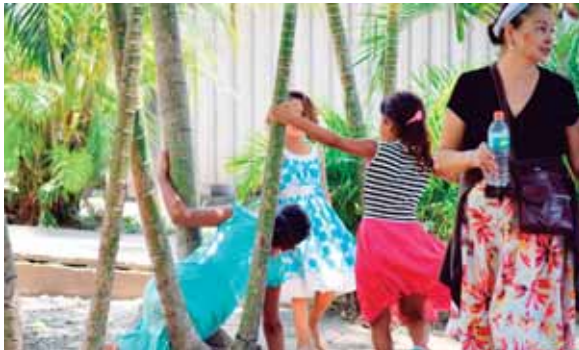
Varios padres que tienen a sus familiares internados no tienen alternativa de llevar a sus hijos al hospital temiendo se enfermen.

Agregó que familiares y amigos se han unido para colaborar con los gas-