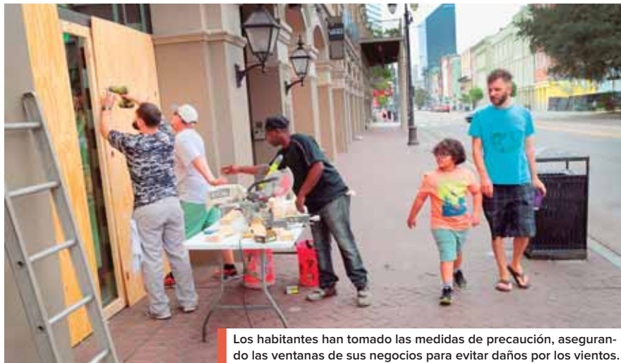
Los habitantes han tomado las medidas de precaución, asegurando las ventanas de sus negocios para evitar daños por los vientos.

El sistema meteorológico descargará de 15 a 25 cm de lluvia en una franja de 160 km de ancho, con el río Misisipi al este y Texas al oeste, mientras que se espera que las precipitaciones alcancen los 50 cm cuando Barry