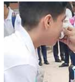
Los niños lloraban desesperados y fueron auxiliados por sus maestros.

Para el caso, solo en siete días ha habido ocho muertes violentas.