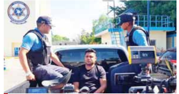
El detenido fue puesto a la orden de las autoridades correspondientes.