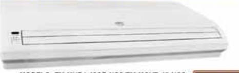
MODELO: FM-MUB1-48CR-NCS/FM-MOV8-48-NCS CON COMPRESOR COOPELAND 4 TON.