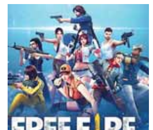
La aplicación fue lanzada en diciembre de 2017 en dispositivos Android y iOS.

El juego consiste en que cincuenta jugadores caen de paracaídas en una isla en busca de armas y equipos para matar a los otros jugadores. Los jugadores eligen a voluntad la posición inicial, toman armas y suministros para aumentar el tiempo de vida en la batalla.