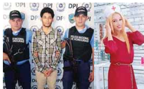
El capturado fue remitido al Ministerio Público para realizar el trámite correspondiente conforme a ley.

Supuestamente el ahora occiso, quien era travesti, ya había recibido amenazas de muerte.