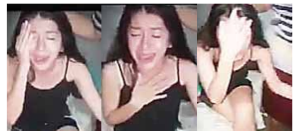
La joven dijo que habían demonios que la atormentaban desde que empezó a jugar Free Fire.

“Denos la oportunidad de hacer una investigación y creemos que vamos a mejorar en corto tiempo esa relación entre los medios de comunicación y los colaboradores de salud”, concluyó.