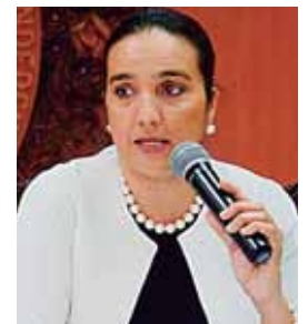
Nelly Jerez, vicecanciller de Asuntos Consulares y Migratorios.

La funcionaria aconsejó que los compatriotas deben contar con la documentación de sus hijos y parientes más cercanos para mostrarlos al momento de ser requeridos.