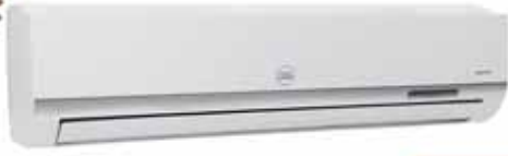
CONDENSADOR + EVAPORADOR MODELO: CAC-24CSA/BH2 24000 BTU