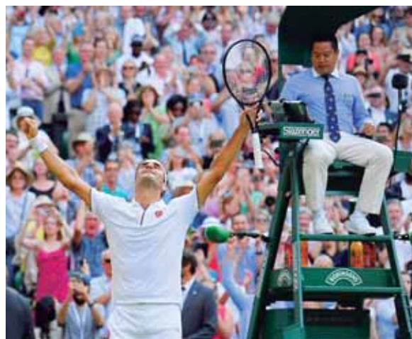
Federer, que a sus 37 años se convierte así en el tercer finalista de Grand Slam de mayor edad, buscará su noveno título de Wimbledon contra Djokovic.

El público del All England Club londinense esperaba un enfrentamiento que recordase a la épica final de 2008, pero no fue así.