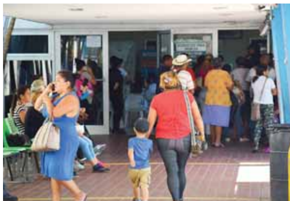
La Secretaría de Salud ya está haciendo todo un trabajo para revisar y poner la mano en este tema.

que en este momento tienen que tener tranquilidad, el personal de salud está 24 horas, a veces desvelado, sin comer, hay varias exigencias y es normal.