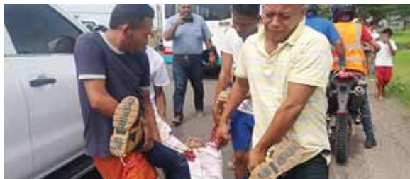
Los familiares llegaron a la escena y se llevaron los cuerpos sin esperar a las autoridades del Ministerio Público.

tivos no les dio tiempo de acordar el área de la escena del crimen mientras llegaba el personal del MP y de la Dirección Policial de Investigaciones (DPI), por lo que solo observaron cómo los dolientes se llevaban los muertos.